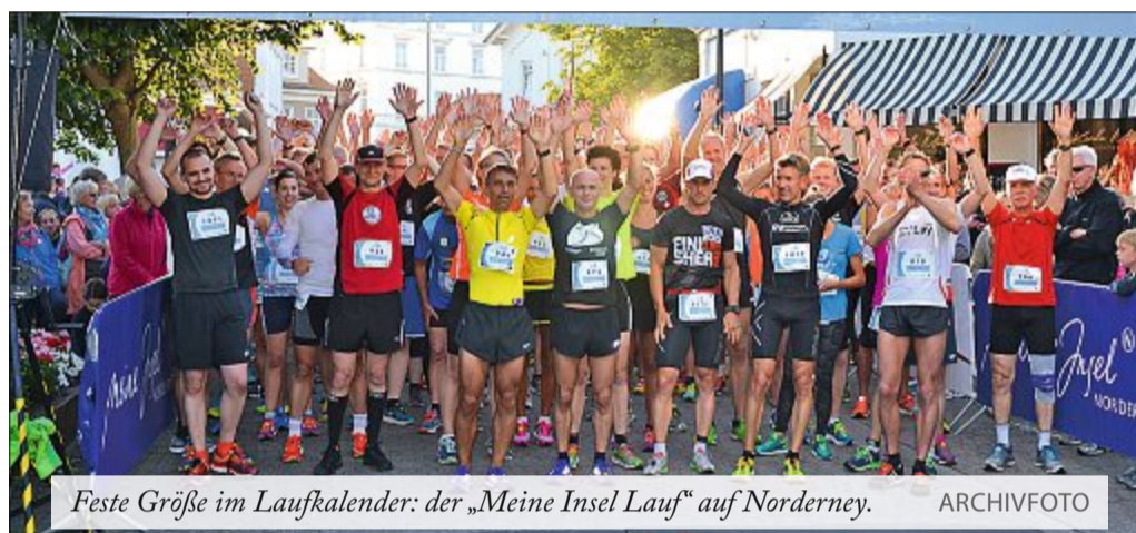
Feste Größe im Laufkalender: der „Meine Insel Lauf“ auf Norderney.

Die verschiedenen Wettkämpfe sind für alle Alters- und Leistungsklassen geeignet. Mit dem Bambini-Lauf über 500 Meter (bis Jahrgang 2010 und jünger) erhalten die Jüngsten ab 18 Uhr die Möglichkeit, zum ersten Mal Wettkampfluft zu schnuppern. Alle Bambini, deren Strecke in einer Runde um den Kurplatz führt, erhalten bei ihrer Teilnahme das Erinnerungs-T-Shirt gratis. Die Nachwuchsläufer beim Schülerlauf (bis Jahrgang 2002 und jünger) messen sich ab 18.30 Uhr über 1,5 Kilometer, indem sie dreimal um den historischen Kurplatz laufen werden. Die beiden Hauptläufe über fünf und zehn Kilometer starten nacheinander ab 20 Uhr. Ab dieser Uhrzeit darf im Stadtkern der Insel bis auf wenige Ausnahmen nicht mehr mit dem Auto gefahren werden. Beim Fünf-Kilometer-Lauf gibt es neben den Einzelstarts auch eine Mannschaftswertung für Gruppen (bestehend aus drei Personen).