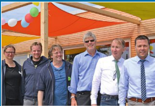
JUGEND Inbetriebnahme der Holzbauten auf Zeltplatz Dünensender

12.7. Wirtschaftsgebäude fügen sich gut ein