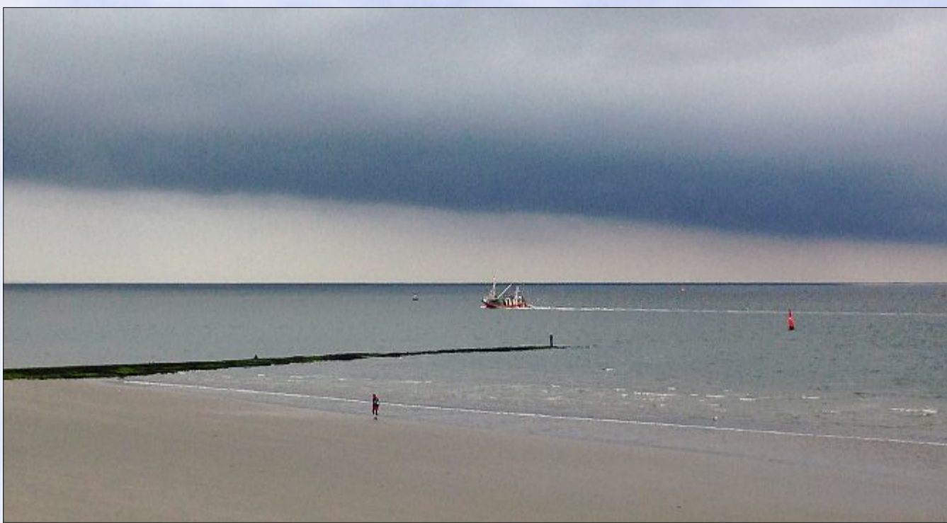
Eine Böenwalze schob sich am Dienstagmorgen von Westen her heran.