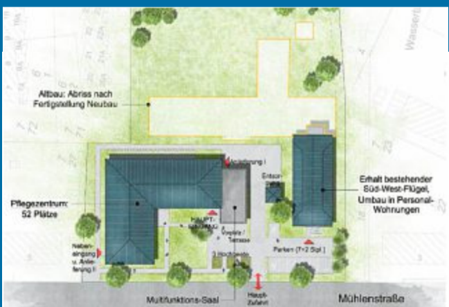
SOZIALES Seniorenzentrum soll näher an Mühlenstraße rücken