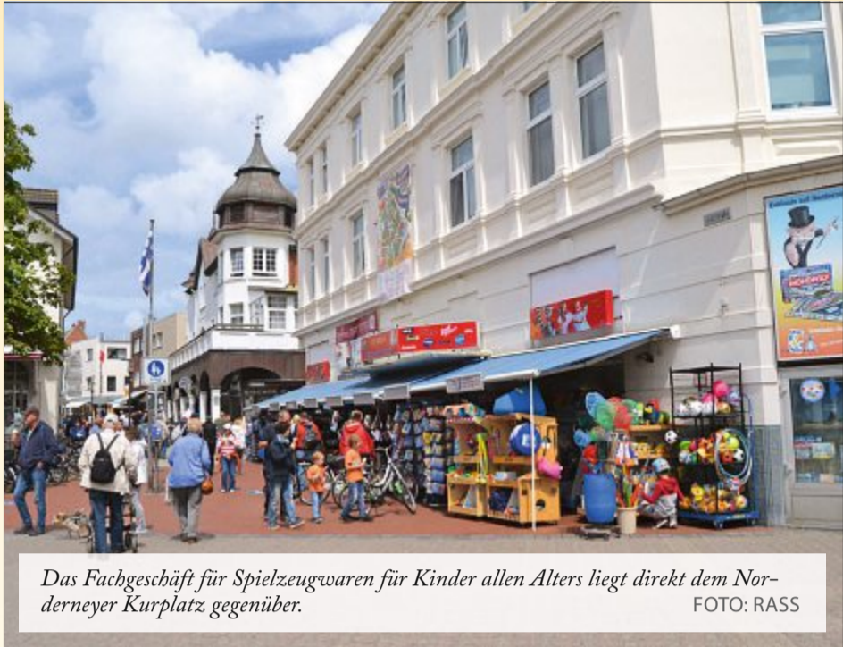
Das Fachgeschäft für Spielzeugwaren für Kinder allen Alters liegt direkt dem Norderneyer Kurplatz gegenüber.