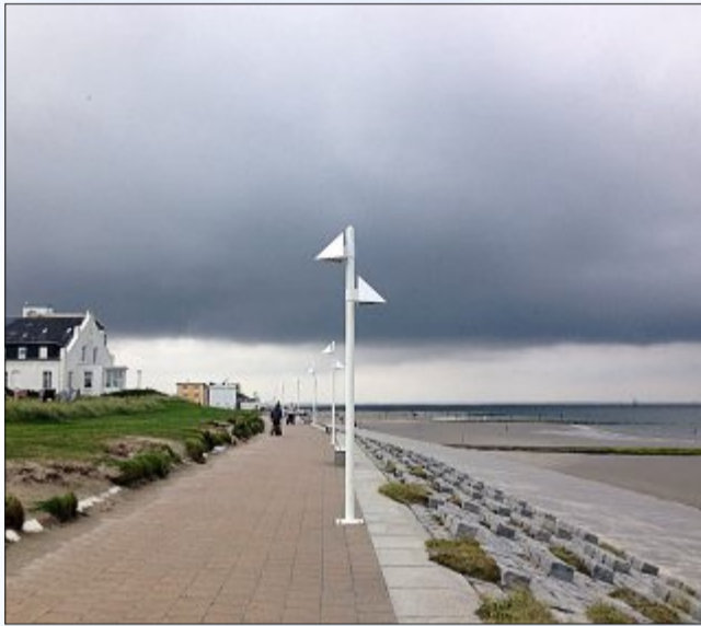
Weltuntergangsstimmung am Weststrand.