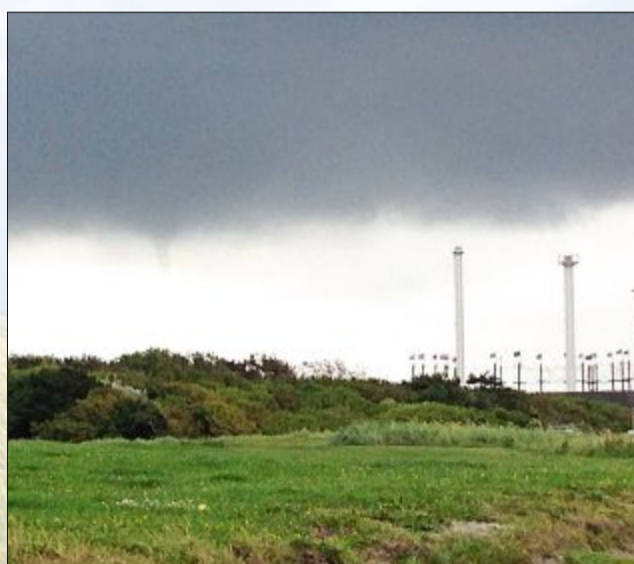
An den Schornsteinen des Blockheizkraftwerkes.