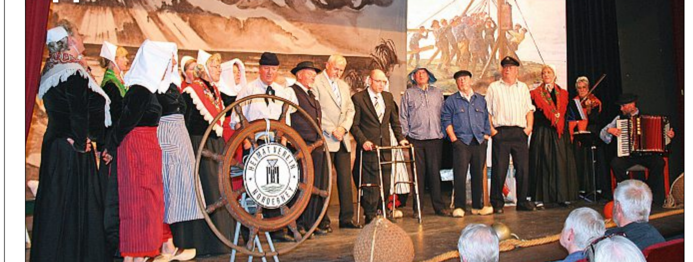
Heimatabend: Die Trachtengruppe des Norderneyer Heimatvereins führt am Montag, 17. Juli, um 20 Uhr einen bunten Unterhaltungsabend mit Inselfolklore, Shantys, Volkstänzen, Seemannsgarn und altem Brauchtum auf. Der Eintritt beträgt acht Euro im Vorverkauf in der Tourist-Information im Conversationshaus und neun Euro an der Abendkasse.