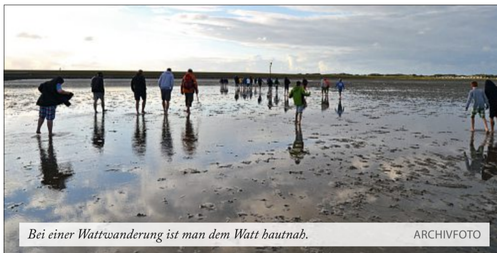
Bei einer Wattwanderung ist man dem Watt hautnah.