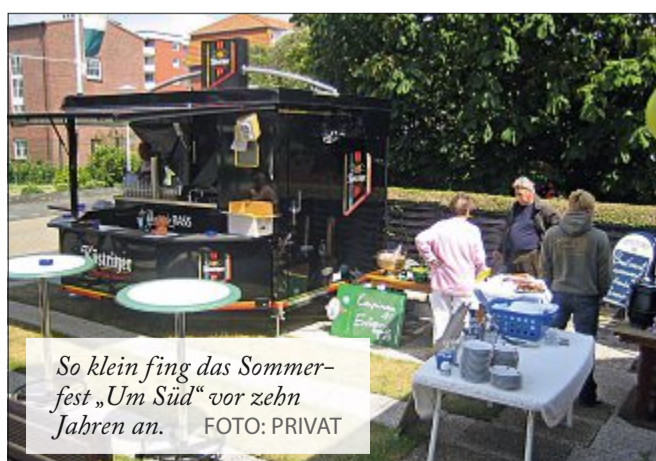
So klein fing das Sommerfest „Um Süd“ vor zehn Jahren an.