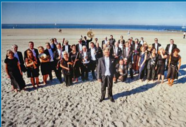
Musik Die 38. Konzertsaison auf Norderney beginnt