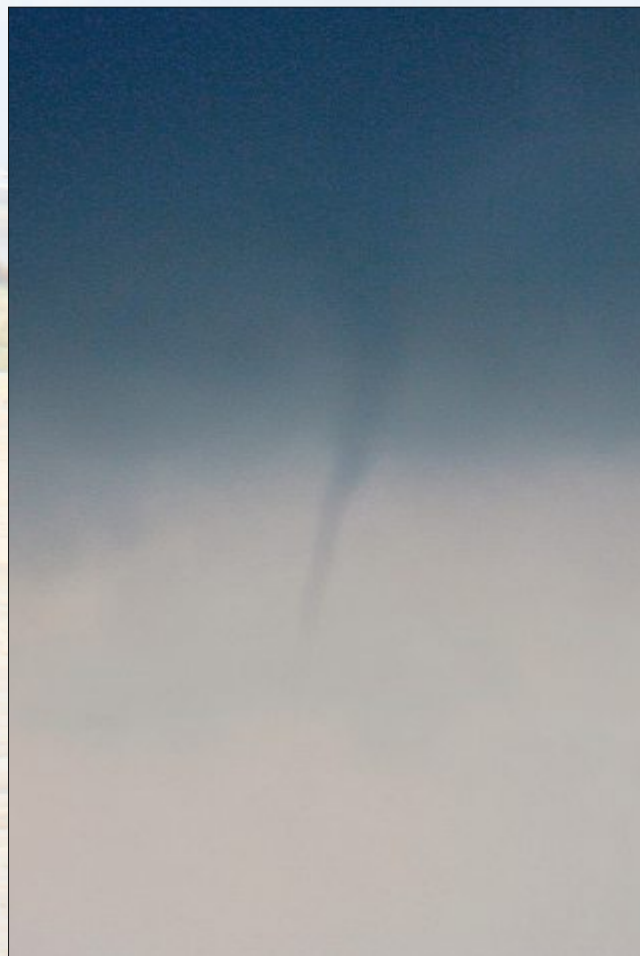
Hier ist die Struktur des Tornados gut erkennbar.