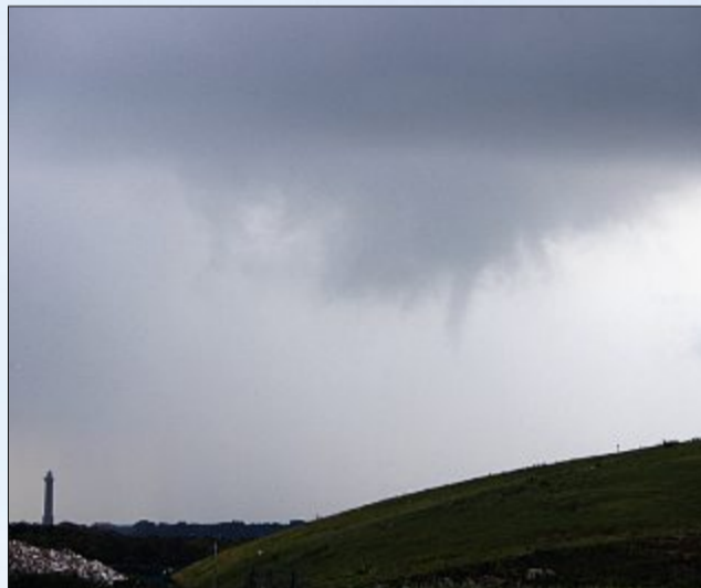
Neben dem Leuchtturm.