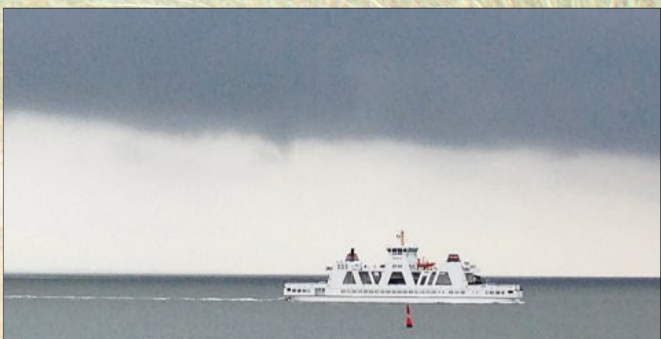
Hier bildet sich gerade unterhalb der Wolkendecke eine Trichterwolke (engl. Funnel).