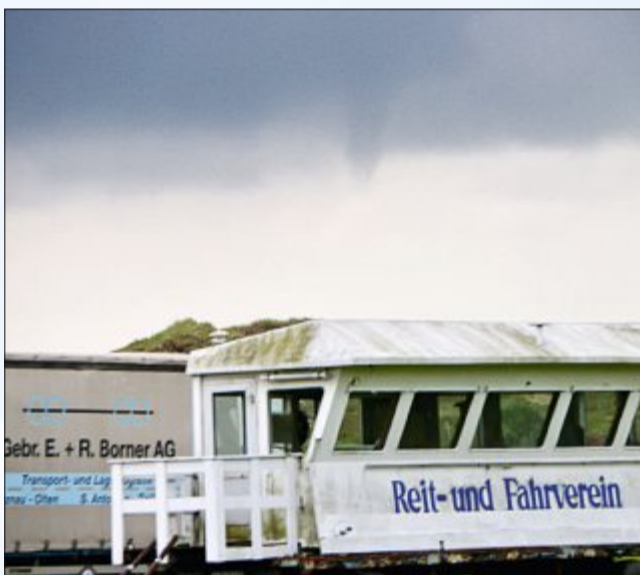
Eine Trichterwolke (Funnel) über dem Reitplatz.