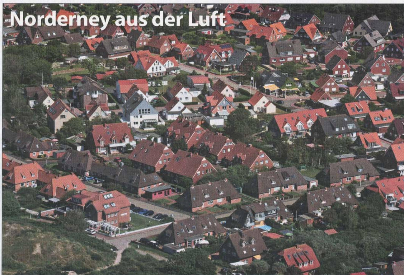
Die Bestellnummer lautet: Norderney Kurier 815