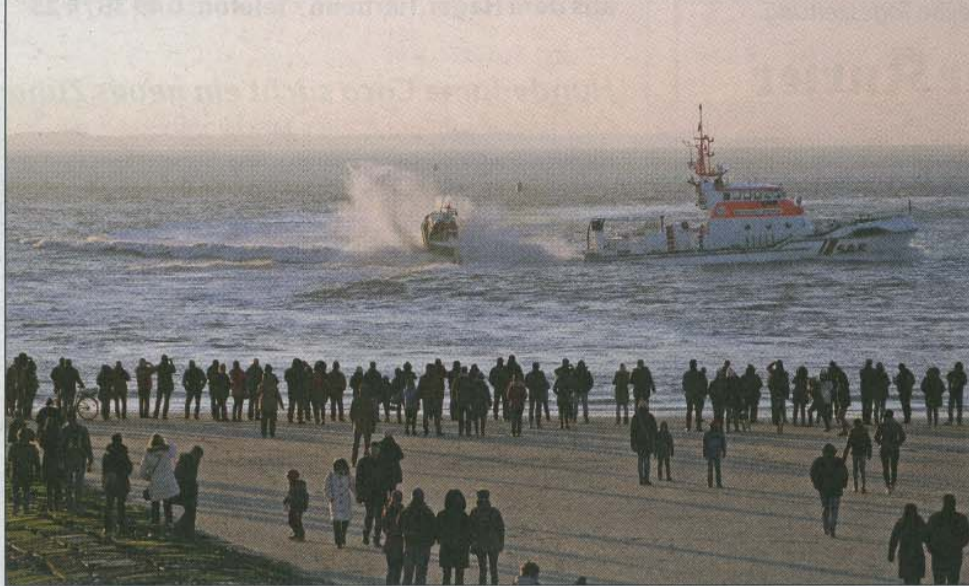
Seenotrettung: Die Deutsche Gesellschaft zur Rettung Schiffbrüchiger (DGzRS) veranstaltet am Samstag, 15. April, von 14 bis 17 Uhr einen Werbetag am historischen Rettungsbooten am Weststrand. Filme und moderierte Manöverfahrten des Seenotkreuzers „Bernhard Gruben“ werden gezeigt. Die historischen Rettungsgeräte und das Ruderrettungsboot „Fürst Bismarck“ von 1893 können besichtigt werden.

Rettungsbooten am Weststrand, Eintritt frei, um eine Spende zugunsten der Seenotretter wird gebeten.