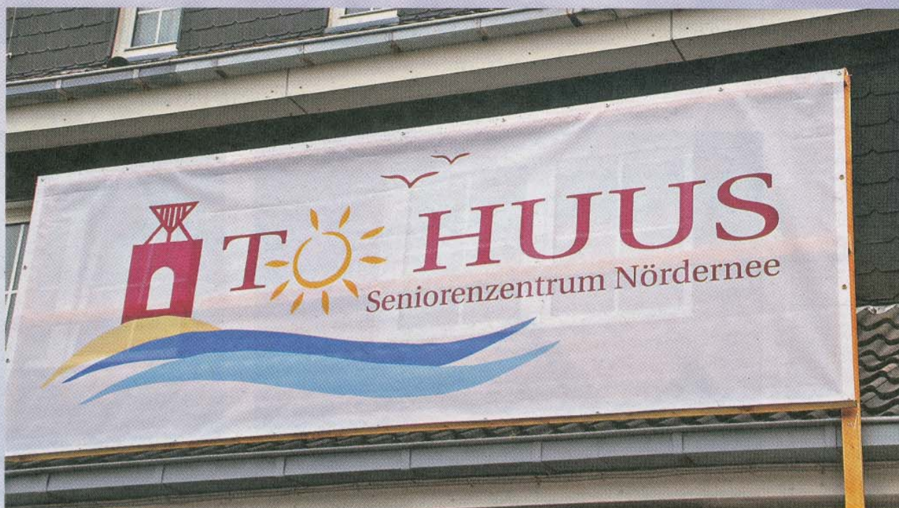
To Huus – Seniorenzentrum Norderney: Gastfreundlich und heimatbezogen klingt der neue Name des ehemaligen Alten- und Pflegeheimes Inselfrieden, das ein Seniorenzentrum werden wird.

Freitag, 14. April 15.30 Uhr: Die Schlümpfe – Das verlorene Dorf – 3D 19 Uhr: Die Schöne und das Biest – 3D 21.15 Uhr: La La Land Samstag, 15. April 15.30 Uhr: Die Schlümpfe – Das verlorene Dorf – 3D 19 Uhr: The Boss Baby – 3D 21.15 Uhr: La La Land Sonntag, 16. April 15.30 Uhr: Bibi & Tina – Tohuwabohtotal 19 Uhr: The Boss Baby – 3D 21.15 Uhr: Der Hunderjährige, der die Rechnung nicht bezahlte und verschwand Montag, 17. April 15.30 Uhr: Bibi & Tina – Tohuwabohtotal 19 Uhr: The Boss Baby – 3D 21.15 Uhr: Der Hunderjährige, der die Rechnung nicht bezahlte und verschwand Dienstag, 18. April 15.30 Uhr: Die Schöne und das Biest – 3D 19 Uhr: Florence Foster Jenkins 21.15 Uhr: Fifty Shades of Grey – Gefährliche Liebe Mittwoch, 19. April 19 Uhr: Die Schöne und das Biest – 3D 21.15 Uhr: Willkommen bei den Hartmanns Donnerstag, 20. April 15.30 Uhr: Die Schlümpfe – Das verlorene Dorf – 3D 19 Uhr: Alles unter Kontrolle 21.15 Uhr: La La Land