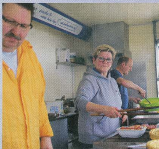
Der Seniorenförderverein bot Spezialitäten für nur einen Euro an. Die Einnahmen kommen den Senioren zugute.