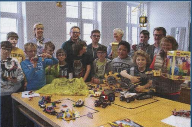
Forschung Bürgerstiftung spendet spezielle Lego-Steine

12.4. Norderneyer Schüler basteln Roboter