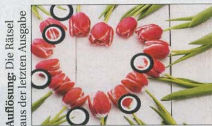
Auflösung: Die Rätsel aus der letzten Ausgabe