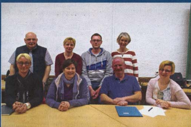
Ehrenamt Viele rührige Helfer bei den Aktionen