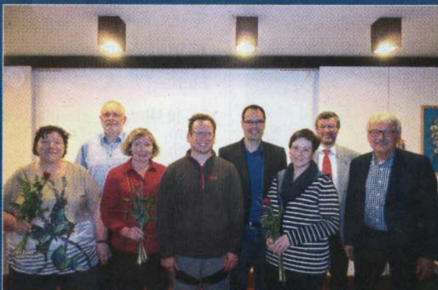
Politik Jahresversammlung des Ortsvereins im Stadtsaal