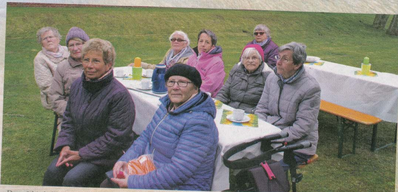
Der städtische Teekreis traf sich zur Namensfeier ausnahmsweise am Altenheim und nicht wie sonst im Haus der Insel. Der Teekreis findet an diesem Freitag wieder im Haus der Insel statt.