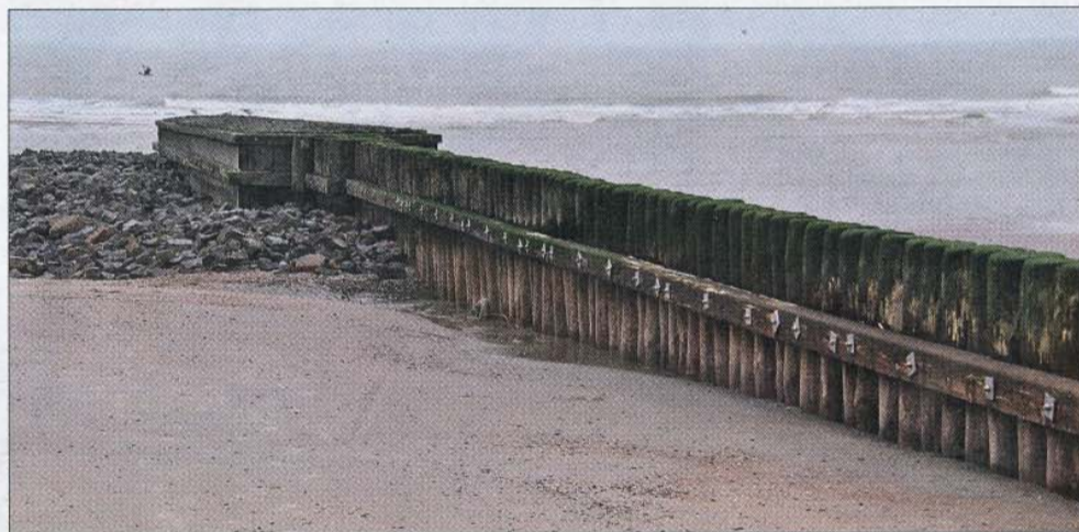
Die Buhnen dienen dem Küstenschutz und sollen verhindern, dass der Sand mit der Strömung in Richtung Osten abgetragen wird.

Heutzutage sind die Westseiten der Inseln häu-