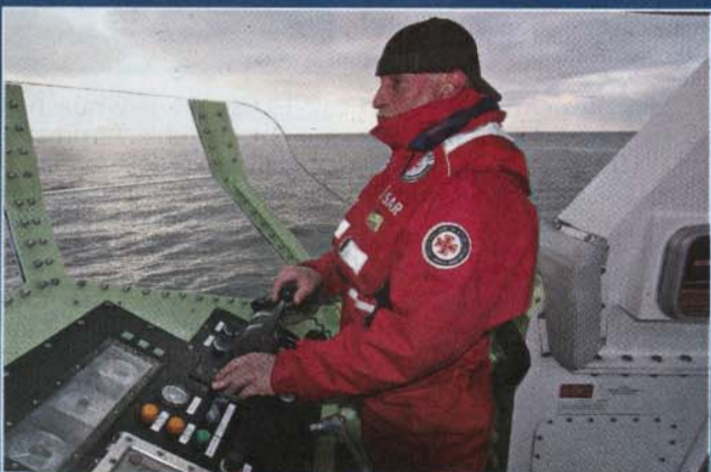
Hilfe Dokufilm über die Rettungsaktionen der „Minden“