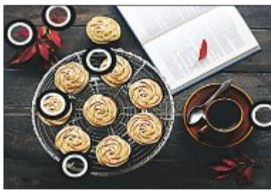
Auflösung: Die Rätsel aus der letzten Ausgabe