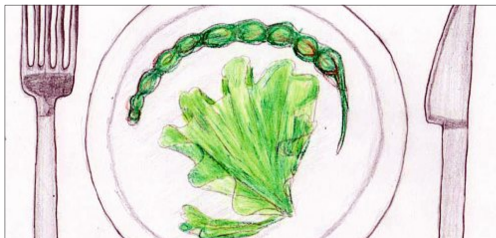
Lecker: Algen kommen immer öfter als Gemüse oder Salat auf den Teller.

als leckeres Gelee. Es gibt sogar vegetarische Würstchen mit Algen zu kaufen. Auch in der Medizin und der Kosmetik sind Algen zu einem