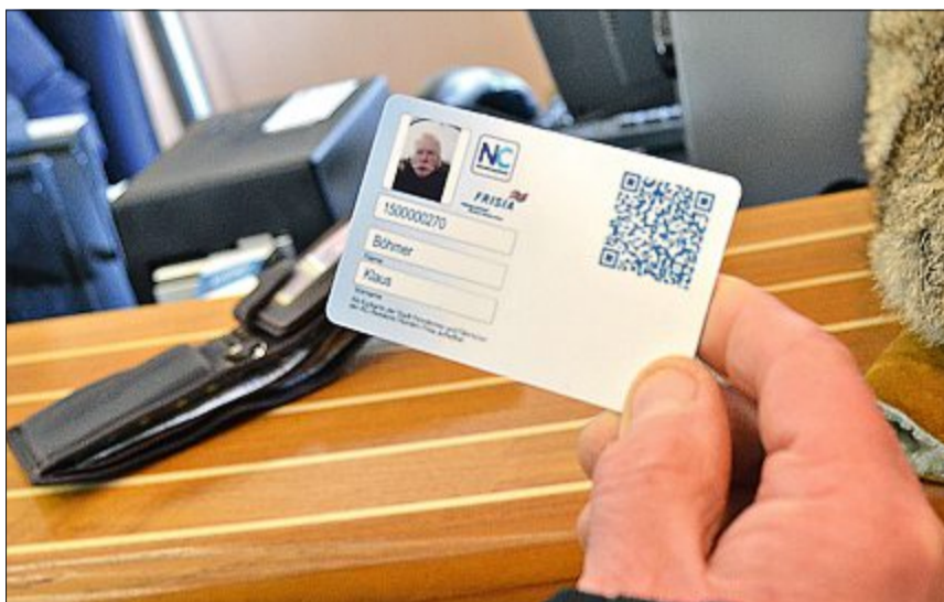
So sieht die neue Insulanercard aus.

Das System übernimmt die Daten der alten Karte automatisch nach Eingabe der alten Insulanercard-Nummer. Kunden haben künftig die Möglichkeit, weitere Insulaner-Karten (zum Beispiel von Familienmitgliedern) mit dem Kundenkonto zu verknüpfen. Dazu muss für jede Person die Karten-Nummer der bisherigen Insulaner-Karte sowie der