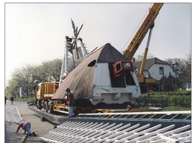
Abtransport der Mühlenkappe im Mai 1995.