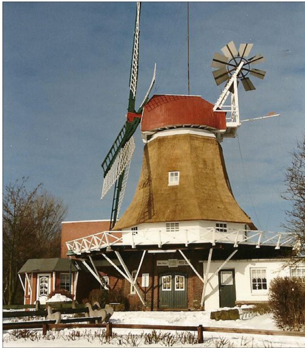
Dieses Foto ist eine Rarität: Der Rumpf ist bereits reetgedeckt, während die Kappe noch mit Dachpappe gedeckt ist.

den Qualitätsmaßstäben der Niedersächsisch-Bremischen Mühlenvereinigung“, erklärte ihr Regionalbeauftragter, Torsten Scheweling. „Anfang Dezember soll die Norderneyer Mühlenkappe fertig sein. Sie kehrt mit einem Sonderschiff der Reederei Frisia auf ihre Heimatinsel zurück.“