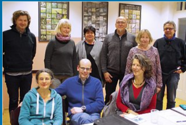
AUSTAUSCH Jahresversammlung der AG Soziale Einrichtungen

14. 2. Personalmangel ist bei allen ein Problem