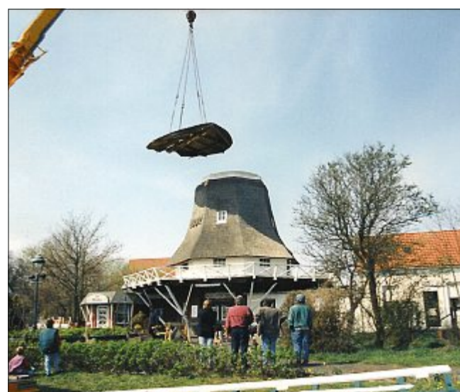
Die Mühle wird mit einer Platte abgedeckt für die Dauer der Kappen-Sanierung.