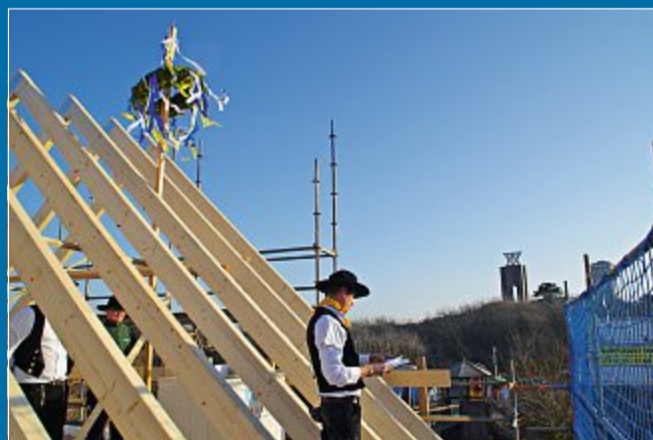
BAUWESEN Der Neubau soll im Sommer fertiggestellt sein

16. 2. Ein Richtfest für den Anbau des Kindergartens