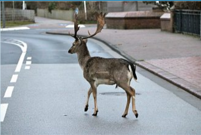
NATUR Norderneyer Jäger sind seit Jahren Anfeindungen ausgesetzt

13. 2. Damwild kommt vom Festland auf die Insel