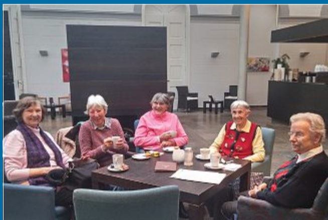
AUSTAUSCH Teilnehmer eines „Kluttjes“ helfen sich gegenseitig

09. 02. Durch die Kommunikation geistig rege bleiben