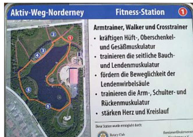
Der Aktiv-Weg Norderney mit Stationen für sportliche Betätigung im Neuen Kurpark am Gondelteich.

innere. Dacheindeckungen wie Dachpappe, Teerpappe und ähnliche Materialien schließen das Mühleninnere luftdicht ab und führen in warmen Sommerzeiten zu Hitzestaus unterhalb der Eindeckung. Das dabei entstehende Schwitzwasser setzt sich in den tragenden