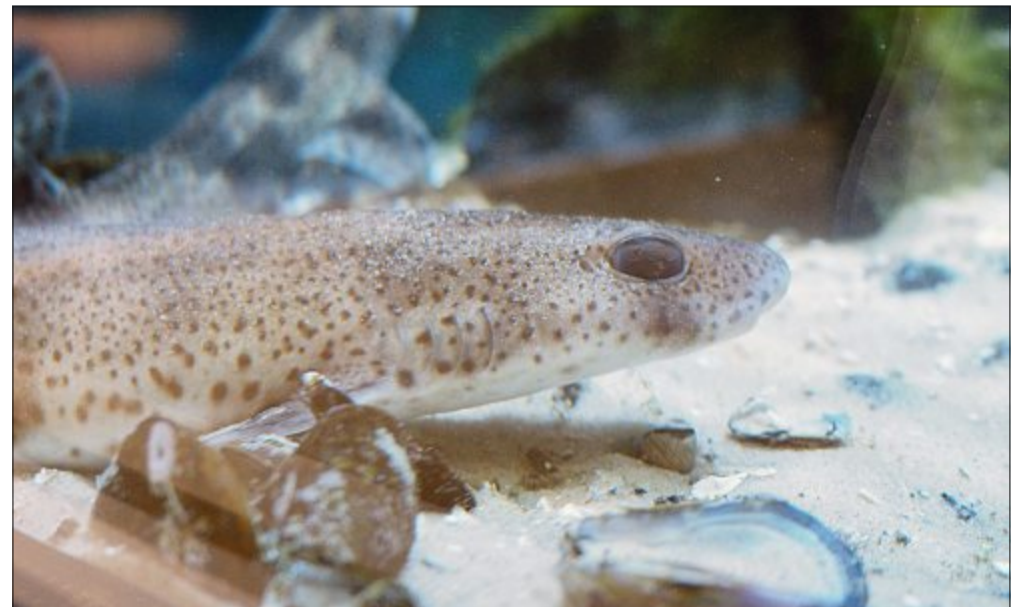
Gepunktete Schönheit: Ein Katzenhai schwimmt durch das Aquarium des Norderneyer Nationalpark-Hauses.