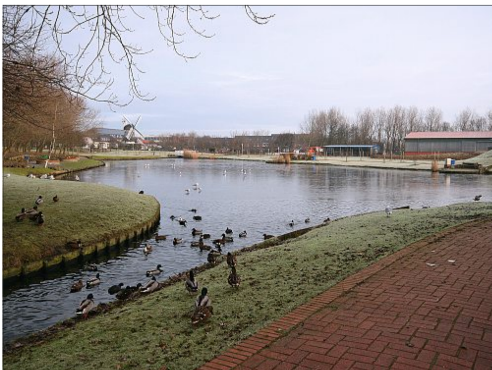
Es gibt eine Trennung von Schmutz- und Regenwasser in der Kanalisation auf Norderney. Der Gondelteich fungiert als Regenwasser-Rückhaltebecken. Im Hintergrund die Inselmühle.