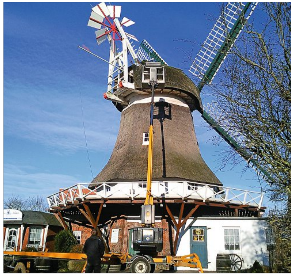
Ausbesserung des Reetdaches im November 2015.

Ein Rundschreiben der Stadt Norderney vom 21. August 1990 an die „Anlieger im Umfeld der Mühle“ kündigte an, dass