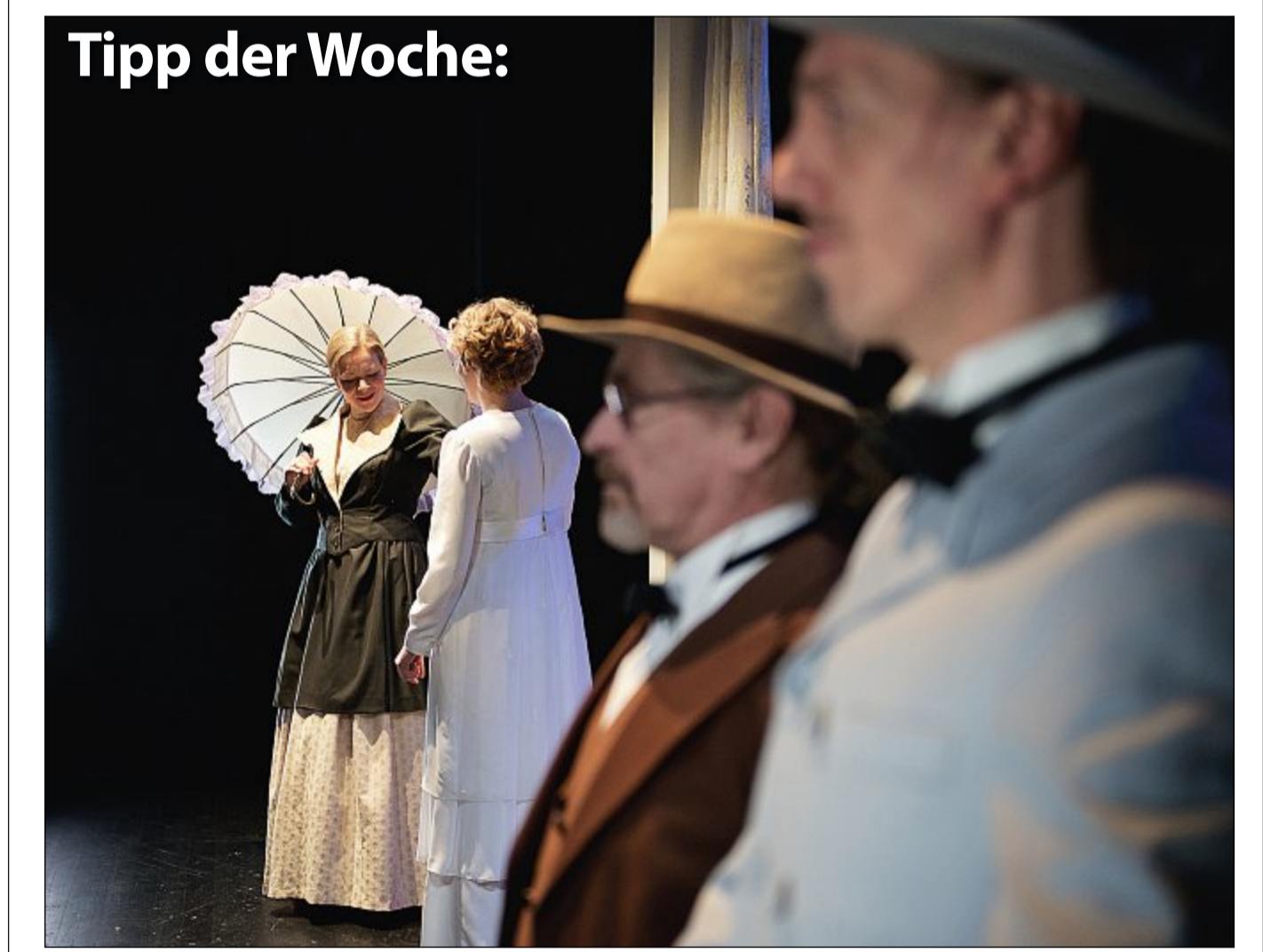
Theater: Die Landesbühne Niedersachsen führt Dienstag, 14. Februar, um 19.30 Uhr das Stück „Effi Briest“ auf. Der Eintritt liegt zwischen 20 und 24 Euro.

Für alle Fälle Bote Weber, Im Gewerbegebiet 4, ☎ 04932/927939 Frisia Service-Telefon, ☎ 04931/9870 Kindergarten, Benekestraße 25a, ☎ 04932/584 Kükennest, Am Weststrand 11, ☎ 04932/83458 Kleine Robbe, Am Weststrand 11, ☎ 04932/935495 Grundschule, Jann-Berghaus-Straße 56, ☎ 04932/2419 Kooperative Gesamtschule, An der Mühle 2, ☎ 04932/2402 Taxi, ☎ 04932/2345 Flugplatz, Am Leuchtturm, ☎ 04932/2455 Reederei Frisia, Bülowallee 2, ☎ 04932/913-0 Stadtverwaltung, Am Kurplatz 3, ☎ 04932/920-0 Kurverwaltung, Am Kurplatz 3, ☎ 04932/891-0 Zimmervermittlung, Am Kurplatz 1, ☎ 04932/891300 Stadtwerke Störungsdienst, ☎ 04932/1001 Onkes Notdienst, ☎ 04932/412 Rosenboom Notdienst, ☎ 04932/8770 VEN Notdienst, ☎ 04932/990505 Autohaus Bodenstab Notdienst, ☎ 04932/93800 Seehundstation Norddeich, ☎ 04931/8919