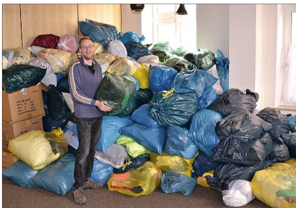
In den vergangenen Jahren wurde die Bethel-Sammlung stets gut angenommen. Der große Saal im Martin-Luther-Haus füllte sich mit Säcken bis unter die Decke.

Gern können eigene Säcke verwendet werden, es liegen aber auch leere Säcke im Vorraum des Martin-Luther-Hauses bereit, so die Mitteilung der Kirchengemeinde. Eine Ab-