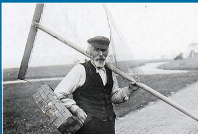
GESCHICHTE Leser recherchieren die Herkunft eines Küchenfundes

08. 02. Das Geheimnis um eine alte Bierflasche