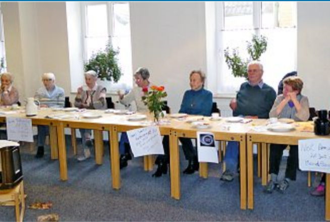
ERINNERUNGEN Thema des Erzählcafés trifft ins Schwarze

06. 02. Von Lilo Pulver bis Rudi Schuricke