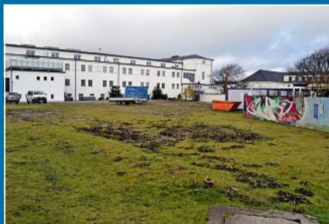
PLANUNG Gespräche zwischen Baubherrngemeinschaft und Stadt

11. 01. Fünf-Sterne-Hotel: Partner sind sich einig