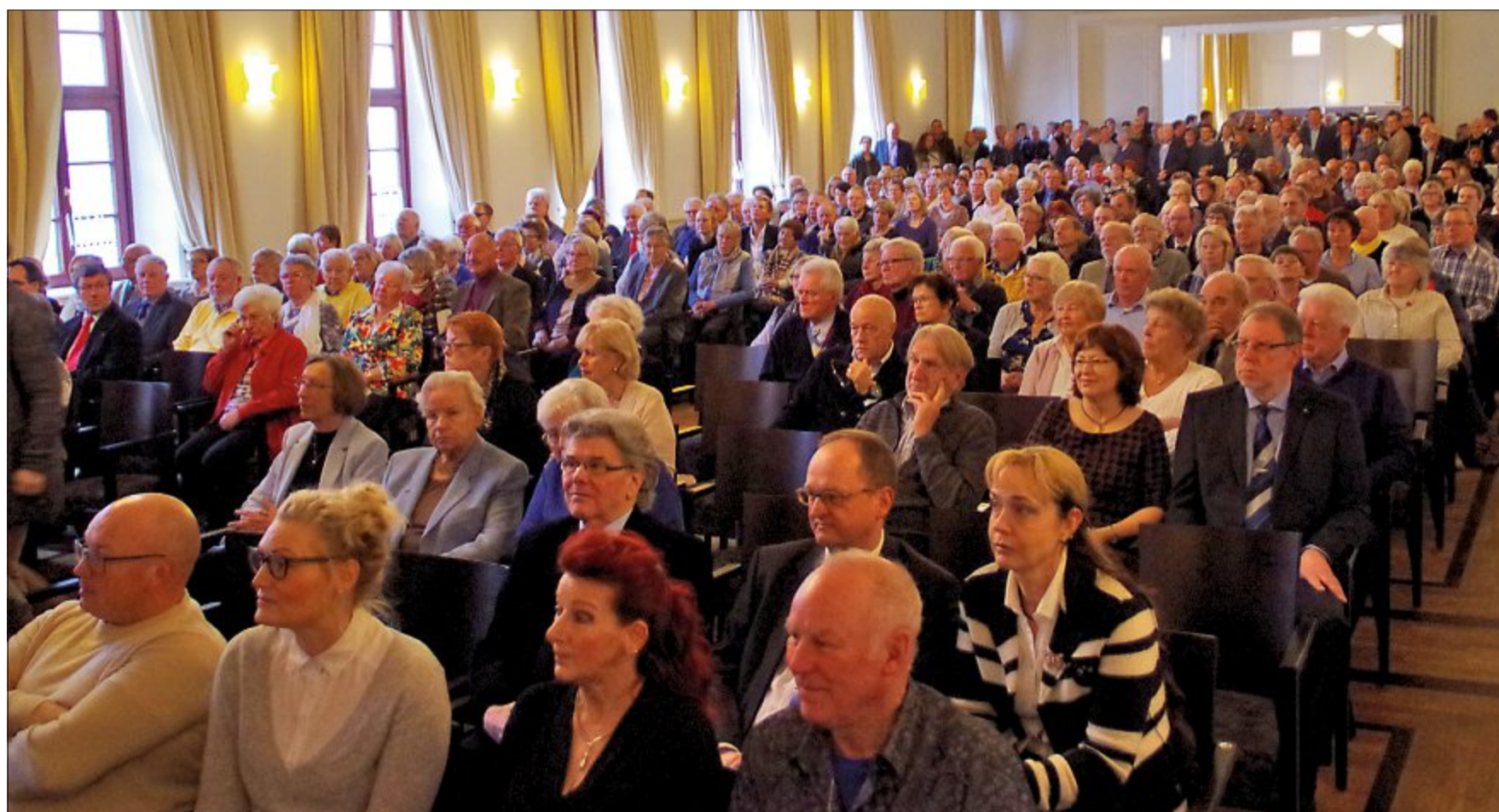
Für viele Nordderneyer ist der Neujahrsempfang das Ereignis am Jahresanfang und eine gute Gelegenheit, sich mal wiederzutreffen.

Die Gaststätte „Oase“ im Inselosten habe erhebliche Mängel an der Substanz, sagt Bürgermeister Frank Ulrichs. Aufgrund der besonderen baurechtlichen Vorgaben im Außenbereich dürfe dort nur im Bestand saniert werden. Eine ursprüngliche Planung, die im vergangenen Jahr im Raum stand, sei so gut wie vom Tisch, so Ulrichs in der Neujahrsrede.