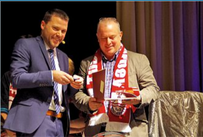
TRADITION 430 Norderneyer kommen ins Conversationshaus

09. 01. Neujahrs-Ehrung für ehrenamtliche Arbeit