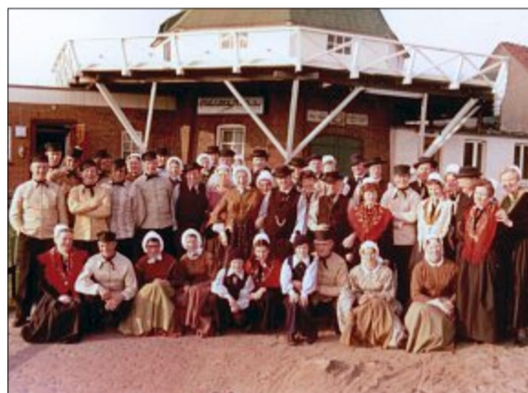
Besuch der Trachtengruppe des Heimatvereins NES auf Ameland/NL und der Trachtengruppe des Heimatvereins Norderney vor der Norderneyer Windmühle.

anlagen und so weiter. Alles sehr kostenintensiv. Dann kam der gastronomische Teil. Da ich aus einem ganz anderen beruflichen Umfeld kam, fehlte mir natürlich Erfahrung. Ich wusste nicht, wo anfangen und wo aufhören. Beratung war gefragt! Ich konnte mir nur vornehmen, alles für meine Gäste so zu gestalten, wie ich es als Gast selbst gerne vorgefunden hätte. Mit diesem Ziel war ich wohl auf dem richtigen Weg. Die Einweihung war Anfang März 1971 mit vielen Gästen, dem Rat und der Verwaltung der Stadt Norderney, dem Deutschen Hotel- und Gaststättenverband (Dehoga), Nachbarn, Familie, Freunden, Geschäftspartnern und vielen mehr. Es gab Geschenke, Blumen und eine Reihe guter Wünsche für den weiteren Geschäftsverlauf. Gute Verbindungen entstanden mit der Firma