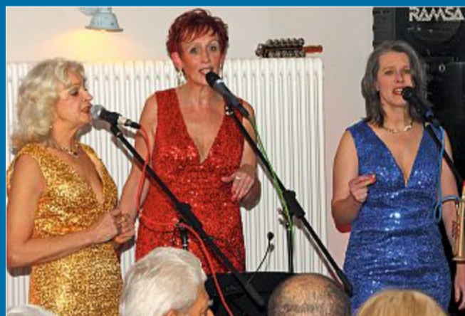
KULTUR Drei Norderneyerinnen swingen im Stil der „Puppini Sisters“

10. 01. Auftritt der „Seastars“ in der Austernbar