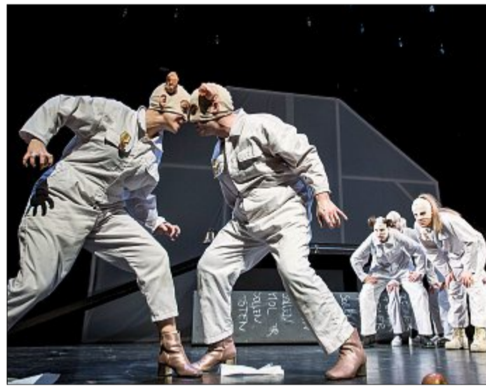
Napoleon und Snowball kriegen sich in die Schweineborsten, beobachtet von den anderen Tieren.

Als oberste Maxime gilt: „Alle Tiere sind gleich“ und die „Herrenfarm“ wird zur „Farm der Tiere“. Zukünftig sorgen die Schweine zum Wohle aller für die Organi-