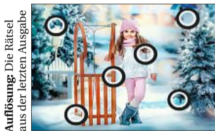
Auflösung: Die Rätsel aus der letzten Ausgabe