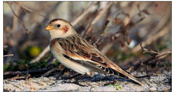
Die Schneeammer ist Werbevogel für die Zugvogeltag vom 14. bis 22. Oktober.

die Tiere beobachten, wie sie auf einem Felsen stehen oder im Flug melodisch zwitschern.