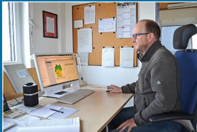
NATUR Die Winter werden wärmer