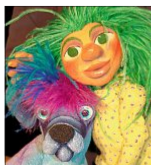
Wird die kleine Hexe am Ende ihren Zauberschnuffel bekommen?

Da freut sich die kleine Hexe so auf das Weihnachtsfest, das sie in diesem Jahr gemeinsam mit dem Weihnachtsmann feiern will, und dann geht einfach alles schief. Im Norderneyer Puppentheater Purzelbaum, Schmiedestraße 1a, können Kinder ab drei Jahren der kleinen Hexe am Montag ab 16 Uhr dabei zusehen, wie sie trotz allem versucht, ihr ersehntes Weihnachtsfest zu bekommen. Dann wird sich auch zeigen, ob sich der Wunsch der kleinen Hexe erfüllt, denn vom Weihnachtsmann hat sie sich ein eigenes Haustier gewünscht, einen Zauberschnuffel. Das Stück dauert zirka 40 Minuten, der Eintritt liegt wie immer bei fünf Euro. Premiere feierte das Stück „Die kleine Hexe feiert Weihnachten“ 2009 und erfreut seither jedes Jahr zu Weihnachten Klein und Groß. efs