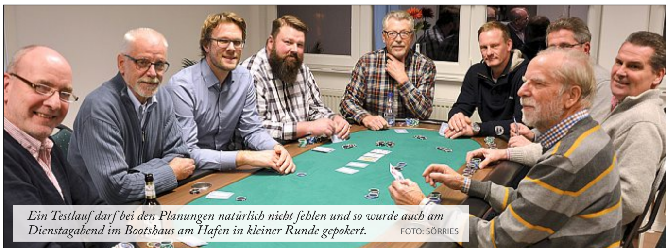
Ein Testlauf darf bei den Planungen natürlich nicht fehlen und so wurde auch am Dienstagabend im Bootshaus am Hafen in kleiner Runde gepokert.

Wer mit Pokern noch nicht so vertraut ist oder es überhaupt erst lernen möchte, der kann sich an diesem Tag über eine Pokerschule freuen. Hier wird Anfängern kostenlos das Spiel nahegebracht. Wer es sich anschließend doch zutraut, der kann immer noch ins Turnier einsteigen – und wer weiß, vielleicht geht es dann direkt von der Pokerschule nach Las Vegas. efs