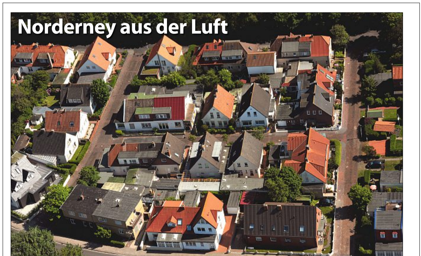
Die Bestellnummer lautet: Norderney Kurier 751