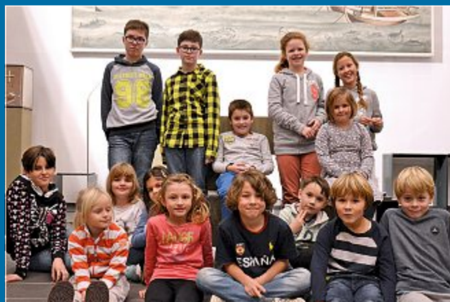
FEST Kinder üben fleißig für die Krippenfeier in der „Stella Maris“

22.12. Proben für das Krippenspiel an Heiligabend