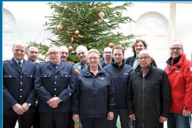
UNTERSTÜTZUNG Kurverwaltung spendet traditionell am Jahresende

20.12. Geld für Engagement der Ehrenamtlichen