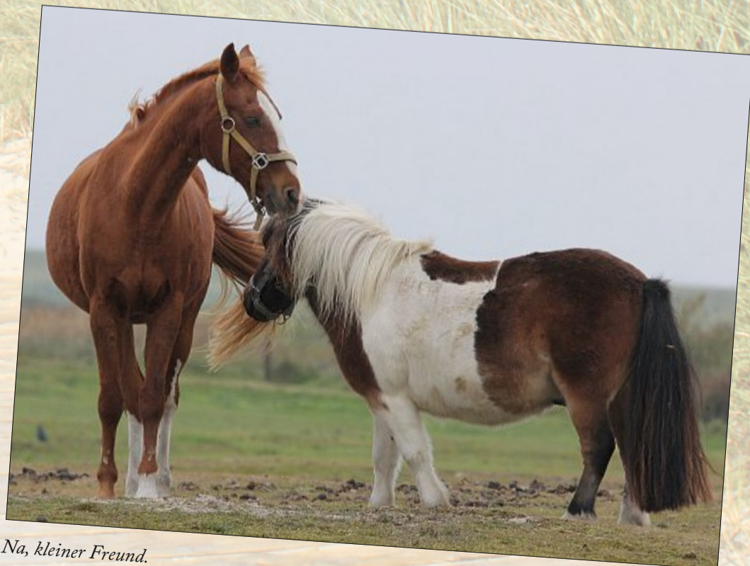
Na, kleiner Freund.