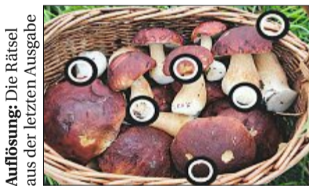
Auflösung: Die Rätsel aus der letzten Ausgabe