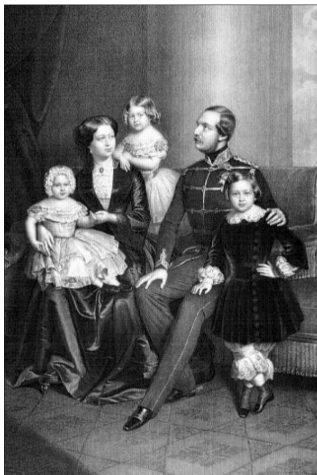
Das „Offizielle Bildnis nach Regierungsantritt“ zeigt König Georg V. mit seiner Familie 1851. Die Aufnahme ist Teil der derzeitigen Sonderausstellung im Nordderneyer Bademuseum.

Ab dem 1. November ist das Bademuseum mittwochs und sonnabends von 11 bis 16 Uhr geöffnet. Gruppen (ab zehn Personen) haben die Möglichkeit, eine Sonderöffnungszeit zu bekommen. Anmeldung unter Telefon 04932/840725. ae