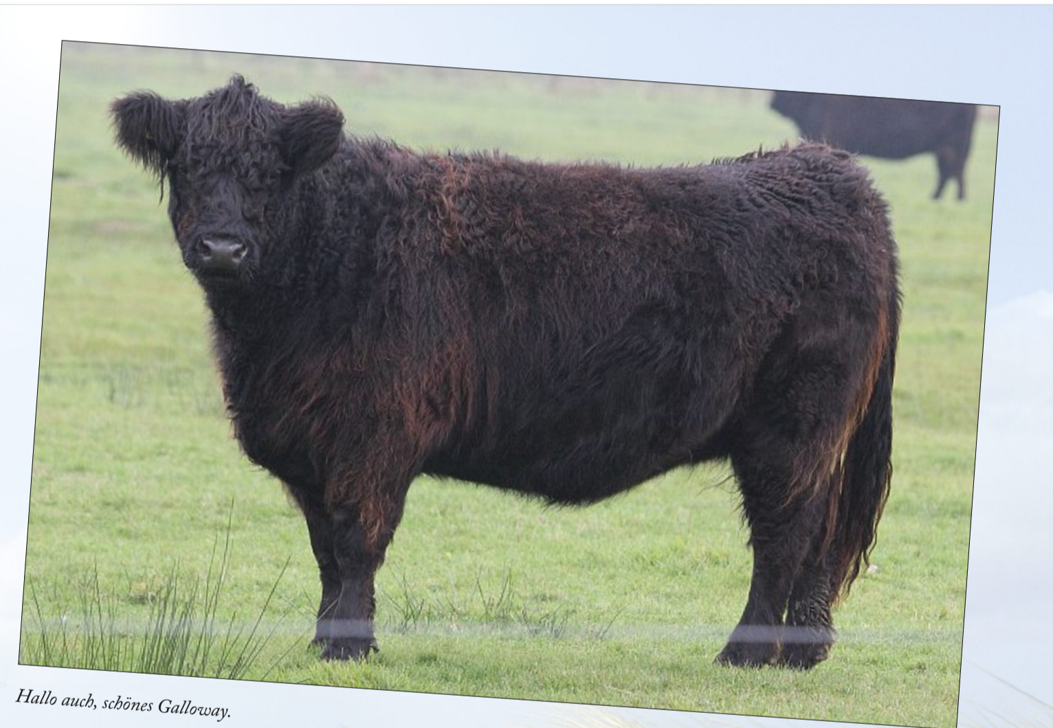
Hallo auch, schönes Galloway.