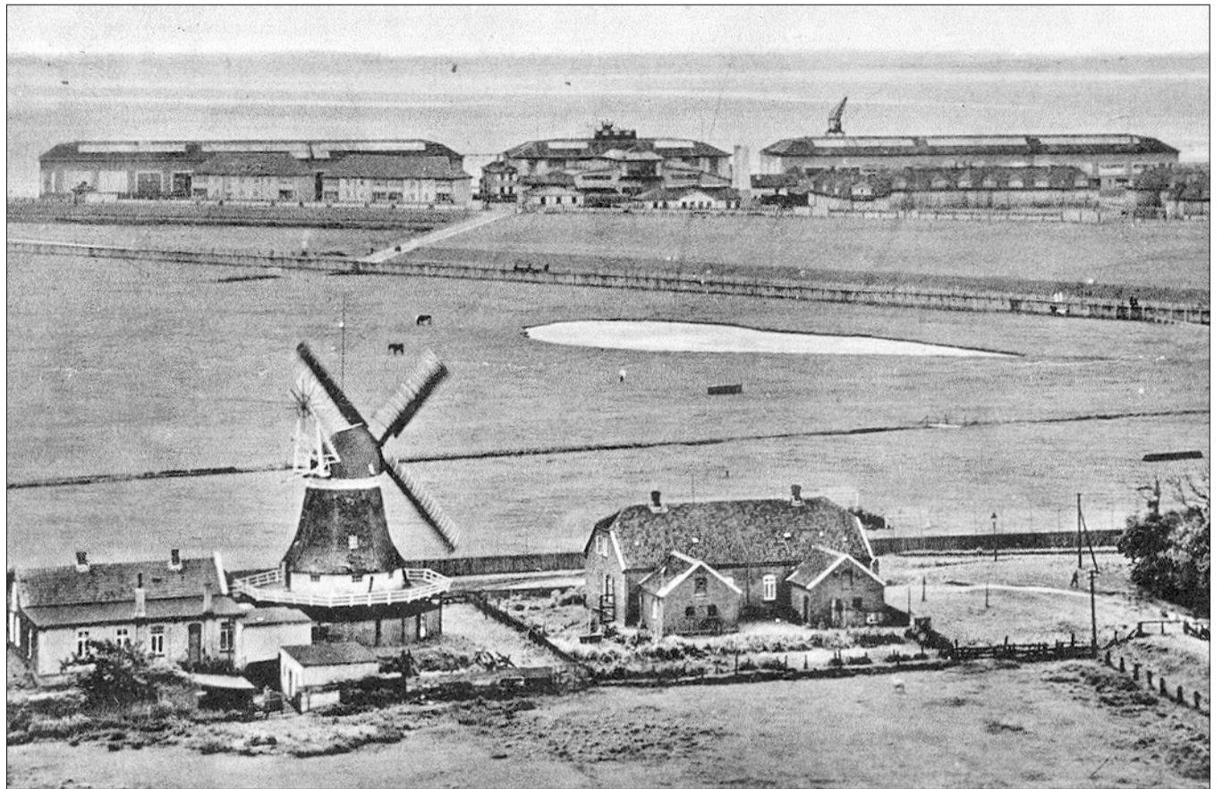
Luftaufnahme um 1930 – Blick über den Sportplatz vor der Mühle/Marienstraße zum Flughafen.

Die beiden Kinder waren in der Obhut eines „Mädchens“; zu der Zeit kein Indiz für besonderen