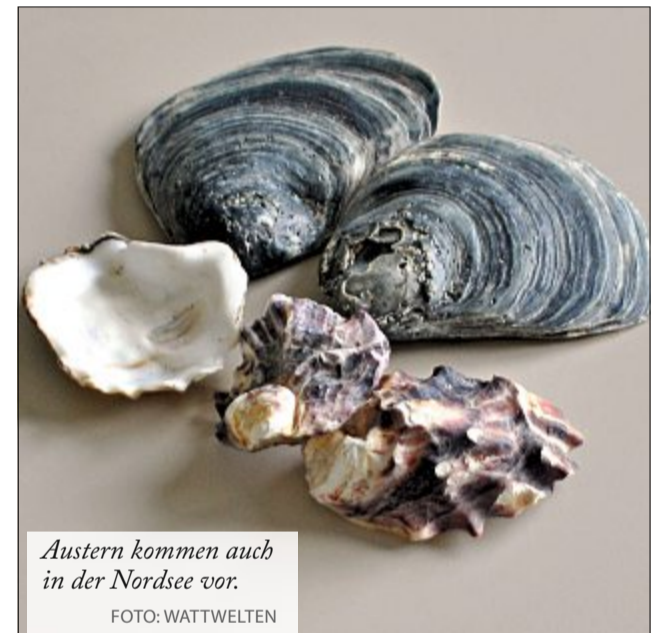
Austern kommen auch in der Nordsee vor.