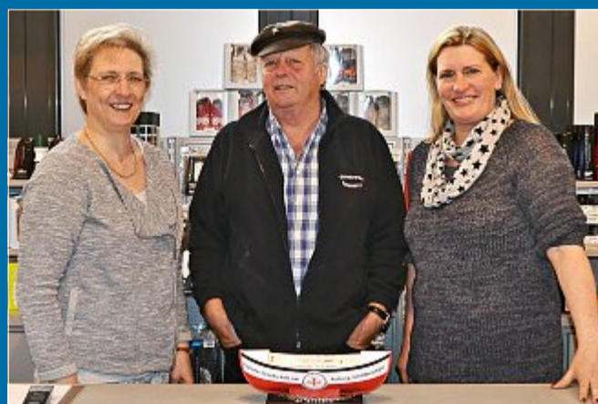
SPENDEN Die zehn Cent für die Plastiktüte werden gespendet

27. 10. – Eine Idee füllt die Sammelschiffchen