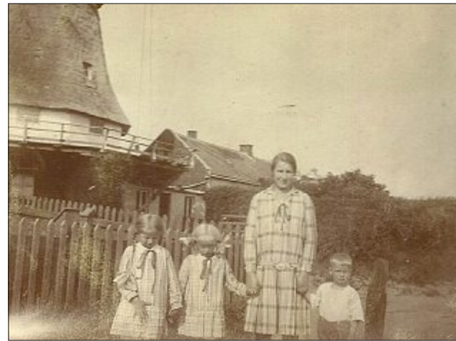
Das Hausmädchen der Familie Fleetjer mit Aafkea (ganz links), Elisabeth und einem eigenen Kind vor der Mühle.

Im Jahr 1929 wurde dann auf der Nordsee-Insel der Grundstein gelegt für das erste europäische Seewasser-Wellenschwimmbad. Dies trotz der immer noch oder auch wieder schwierigen Zeiten, denn der sogenannte „Schwarze Freitag“ 1929, der Tag des Zusammenbruchs der Börse in New York, leitete eine Weltwirtschaftskrise ein, eine Folge davon war die hohe Arbeitslosigkeit, die 1931 in Deutschland bei 45 Prozent lag.