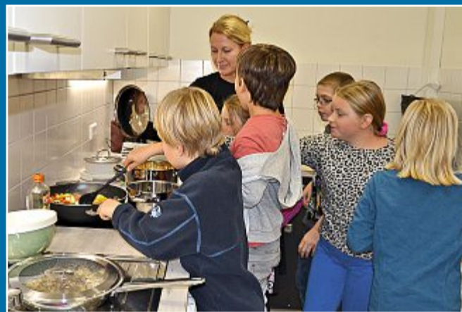
JUGENDBETREUUNG Für die Herbstküche wird auch eingekauft

26. 10. Wenn der Knoblauch durch die Küche duftet