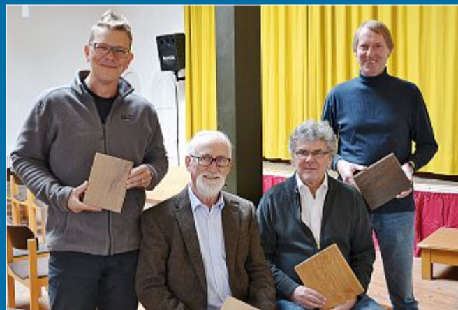
RENOVIERUNG Baumaßnahmen sollen bis Mai fertig sein

25. 10. Gemeindehaus: Statikarbeiten ab Januar