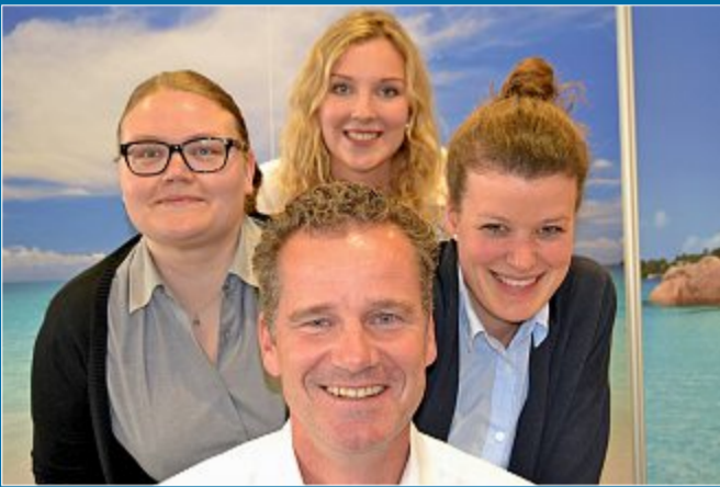
REISE Norderneyer zieht es mittlerweile mehr in den Westen

24. 10. – Urlaubsziele: Weit weg von der eigenen Insel