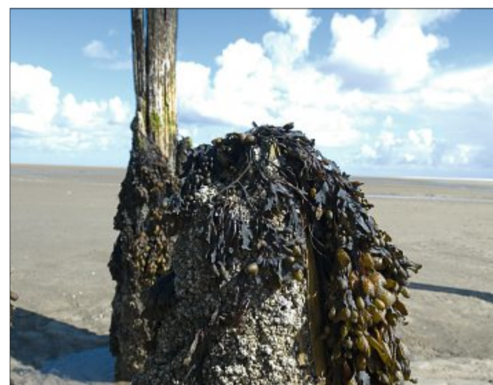
Seepocken (weiß) siedeln auf Gegenständen.

Umstand gelingt, siedeln sie sich gern in langen Penis. Einen bedeutenden Beitrag zur Seepocken-