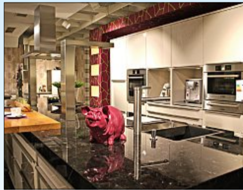
Das Einrichtungszentrum Konken verfügt über ein riesiges Küchenstudio.

Die großen Abteilungen im Haus sind zum Beispiel: