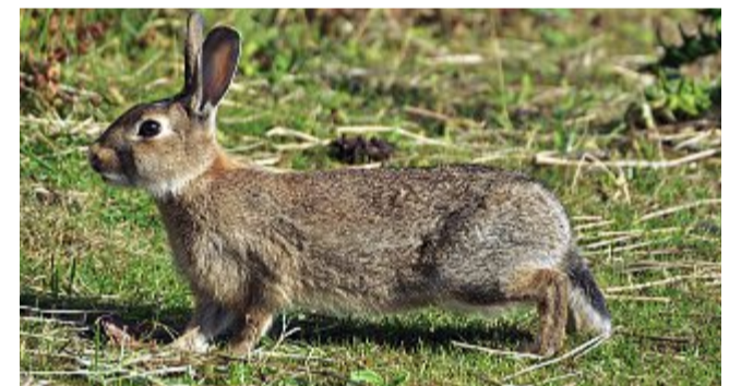
Kaninchen sind ein Problem auf der Insel Norderney. Um deren Population in Grenzen halten zu können, werden diese von Jägern geschossen.