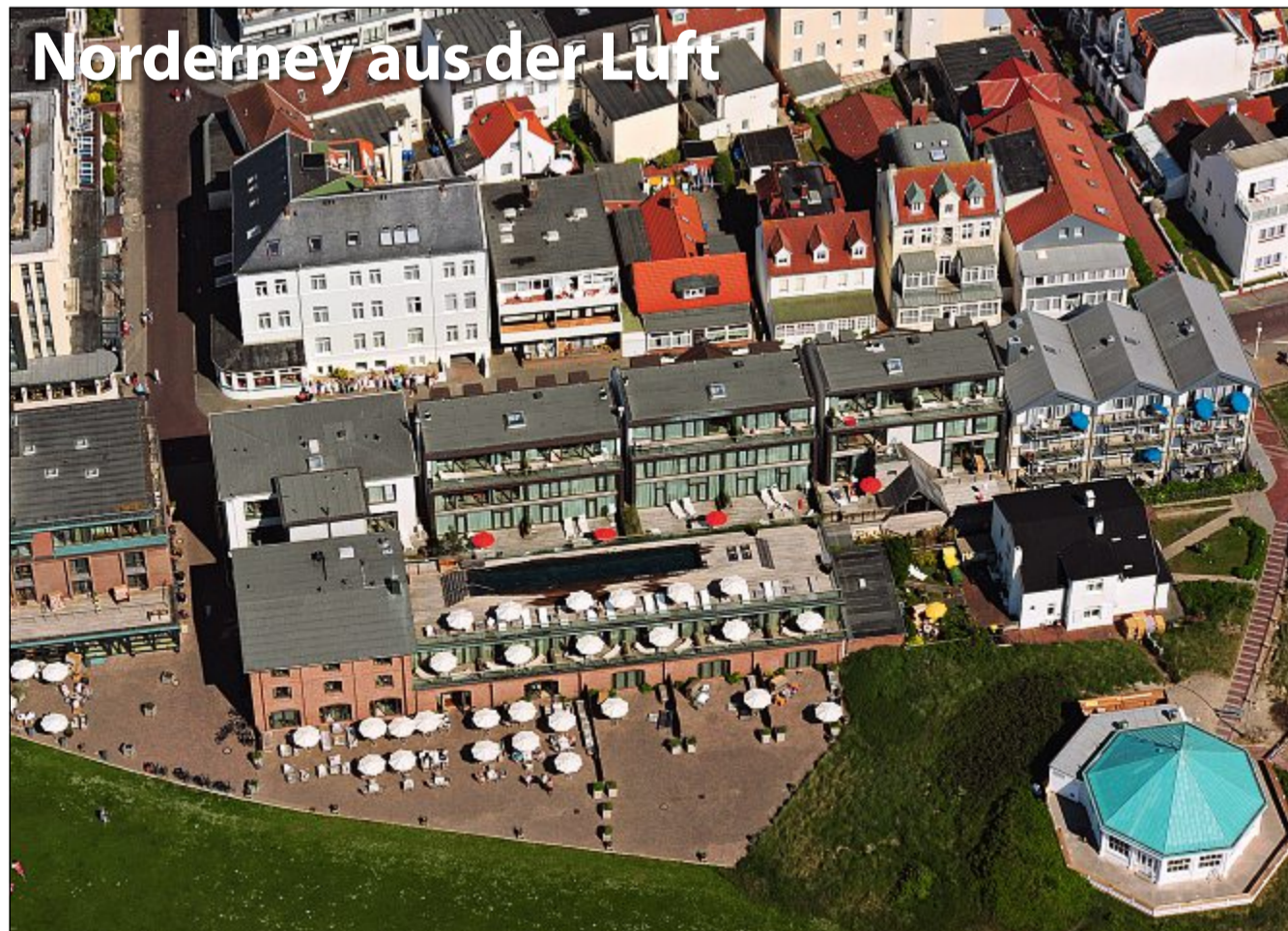
Die Bestellnummer lautet: Norderney Kurier 738