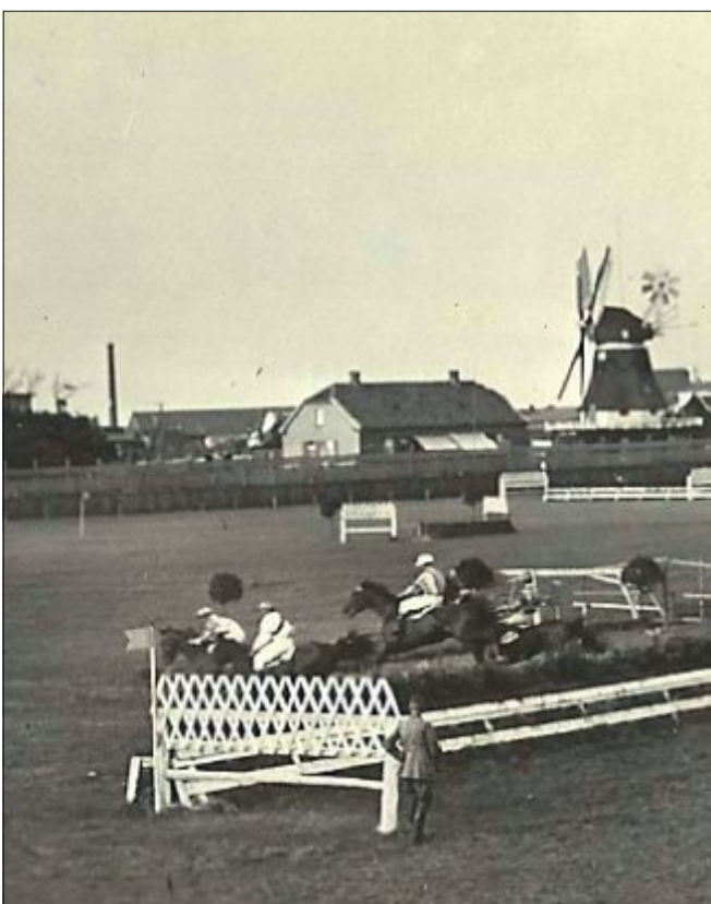
Der Pferderennplatz vor der Mühle um 1930.