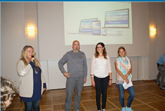
PRÄSENTATION: Neuer Auftritt im Netz.

21.9. – Staatsbad präsentiert neue Internetseite