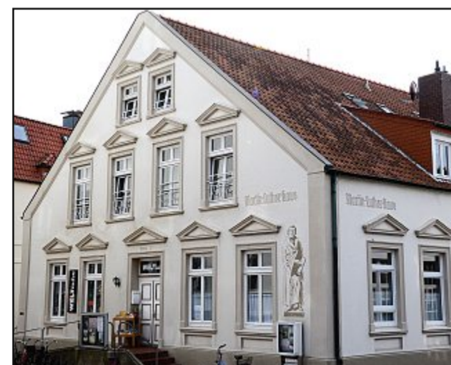
Im Martin-Luther-Haus finden regelmäßig Veranstaltungen der evangelisch-lutherischen Inselkirchengemeinde statt.