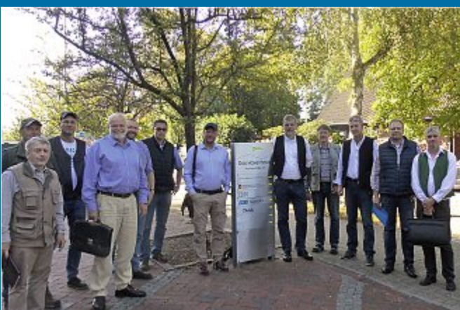
UMWELT: Zunehmende Verschlechterung der Jagdpachtbedingungen

22.9. – Insel-Jäger machen ihrem Unmut Luft