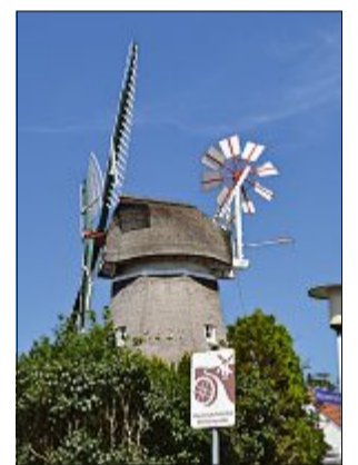
Die Norderneyer Mühle „Selden Rüst“.