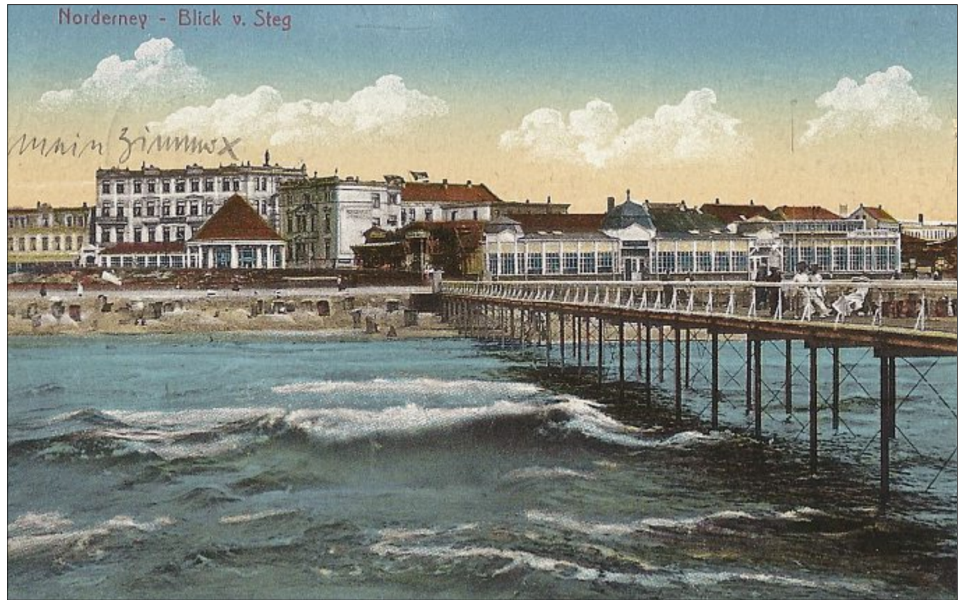
Vor Ausbruch des Ersten Weltkrieges im Mittelpunkt des Geschehens: Scherl's Pavillon, auch in unserer Zeit als Milchbar eine der beliebtesten Plätze der Insel.

Das bestimmende Ereignis dieses Jahrzehnts ist aber, auch für die Insel Norderney, unbestritten der Erste Weltkrieg. Er wird allgemein als „Europäische Katastrophe“ oder auch als „Urkatastrophe