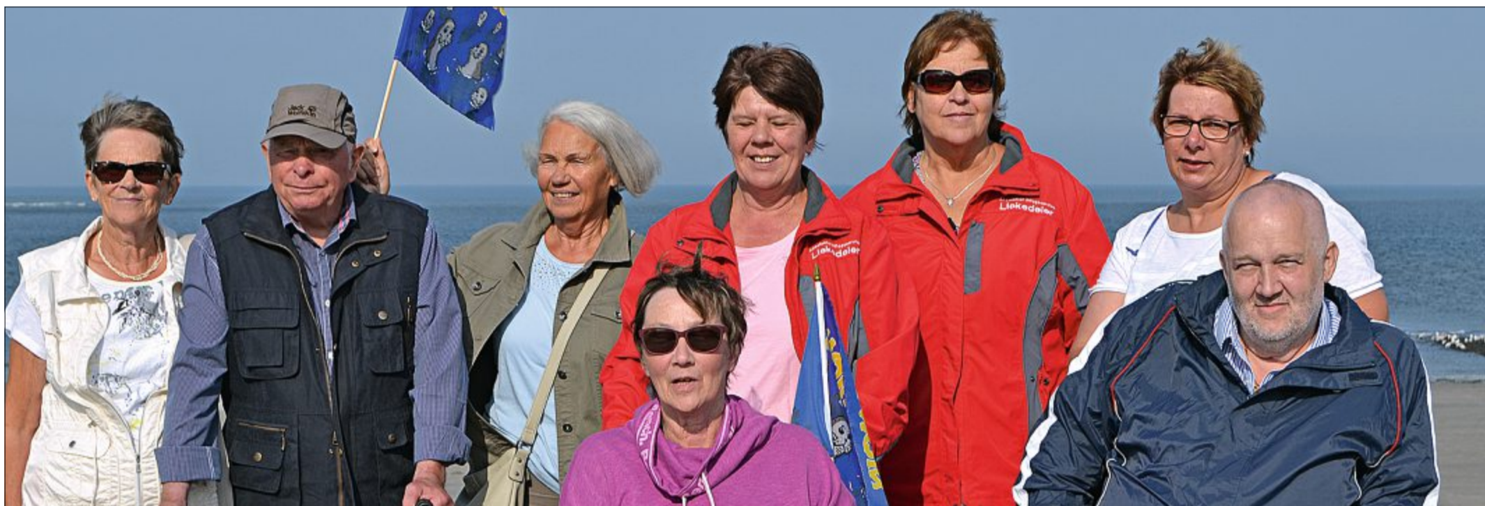
Seit mittlerweile drei Jahren kommen Pfleger des Ambulanten Pflegeservice „Liekedeler“ in Marienhafen mit einigen Patienten für ein paar Tage zur Erholung nach Norderney. Derzeit ist eine Gruppe mit elf Personen auf der Insel und hat, wie alle einstimmig sagten, „fünf tolle Tage mit super tollem Wetter gehabt“.