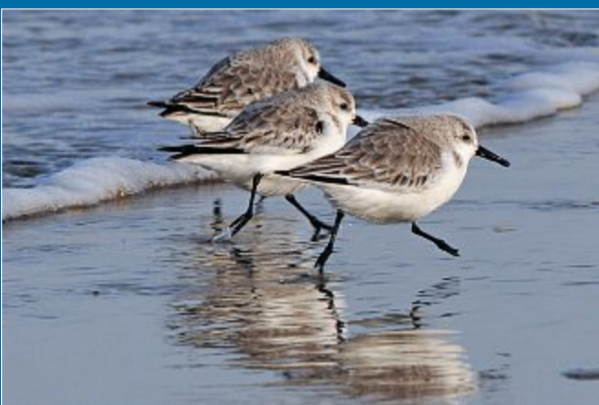
ZUGVOGELTAGE: Viele Veranstaltungen auf Norderney geplant.