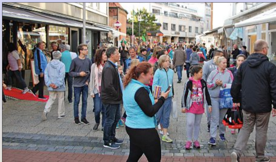
Ordentlich was los in den Norderneyer Einkaufsstraßen: Zum Nachtbummel haben sich Tausende Besucher von den Kaufleuten und Gastronomen locken lassen.

Im Rahmen der 20. Europäischen „BatNight“ („bat“ ist Englisch für „Fledermaus“) können die Teilnehmer des Ausflugs die geheimnisvollen Flattertiere näher kennenlernen und mit einem „Bat-Detektor“ auf Fledermaus-Exkursion gehen. Es werden Informationen über Biologie und Gefährdung der Tiere gegeben und was jeder Einzelne zu ihrem Schutz beitragen kann. „Mit etwas Glück