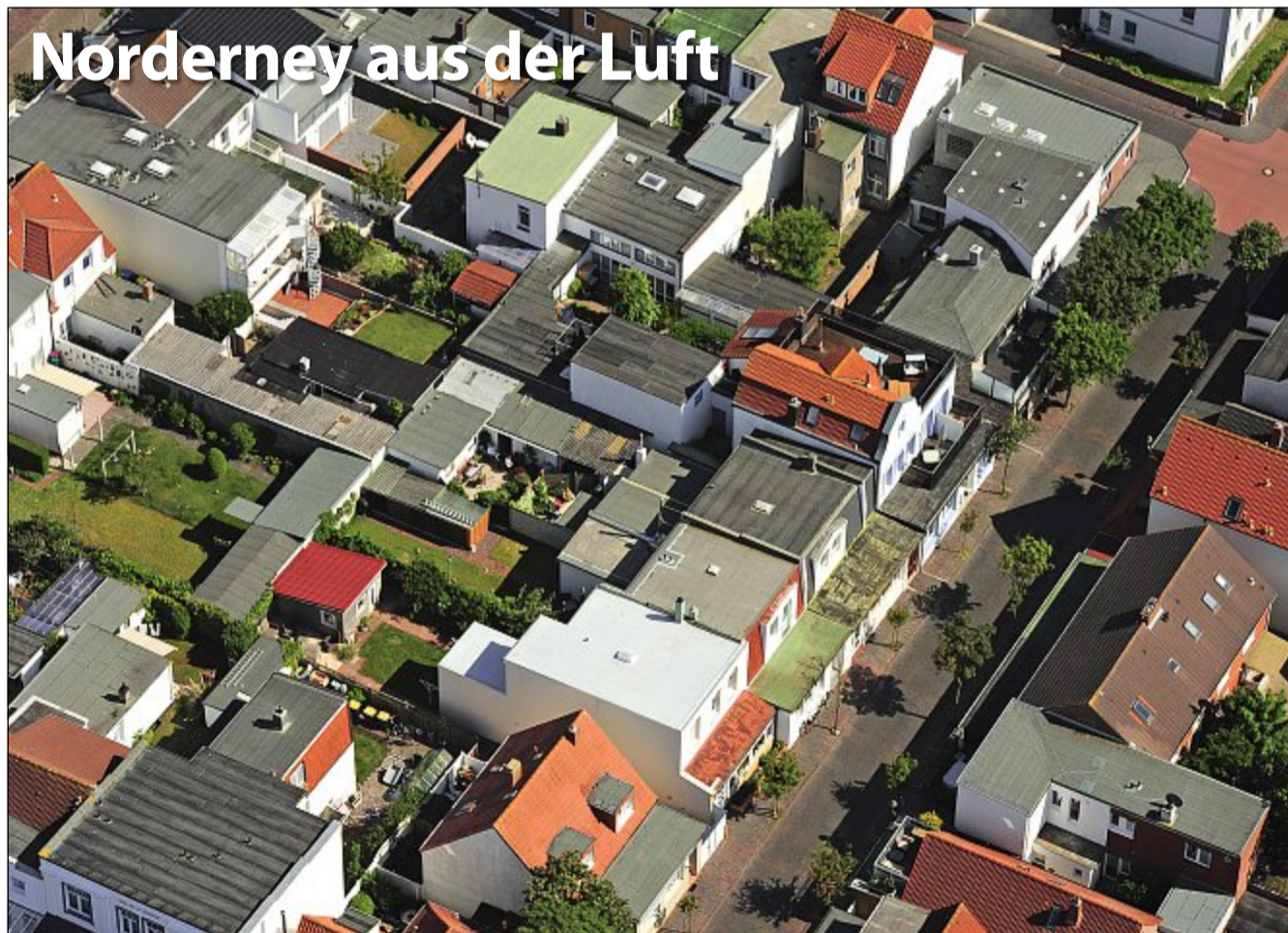
Die Bestellnummer lautet: Norderney Kurier 732