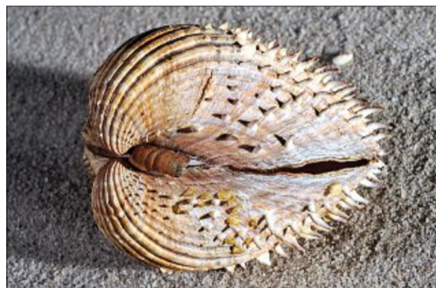
Von der Familie der Herzmuscheln gibt es viele verschiedene Arten. Unser Foto zeigt eine Stachelige Herzmuschel. Die Herzform im seitlichen Profil ist besonders gut erkennbar, wenn du das Bild um 90 Grad drehst.

ten Muschelarten hier bei uns in der Nordsee. Sie besitzt einen Grabfuß, mit dem sie sich sowohl ein- als auch ausgraben kann. Das ist wichtig, da sie sich am liebsten drei bis vier Zentimeter unter der Wattoberfläche aufhält. Das einzige Problem, das dabei auftritt: Die Muschel