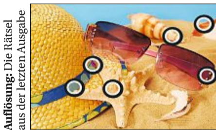
Auflösung: Die Rätsel aus der letzten Ausgabe