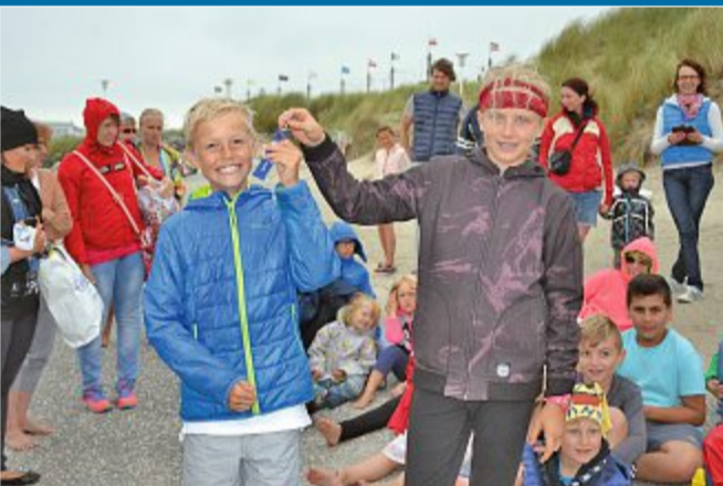
AKTION Der Zehnjährige ist neuer Kinderkurierdirektor Norderneys