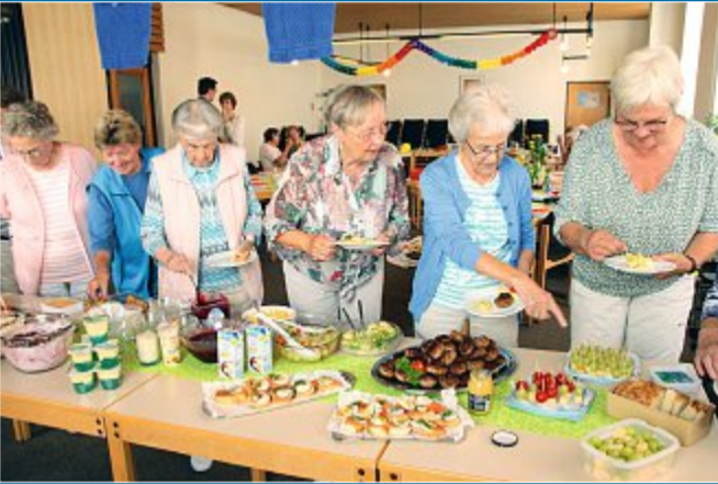
ERINNERUNGEN Erzählcafé mit Sommerpicknick