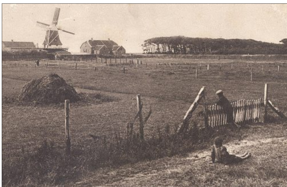
Postkarte aus den 20er-Jahren: Die Mühle hat Nachbarn bekommen. Im Westen wurde ein Doppelhaus errichtet, während der Osten und Norden noch unbebaut sind.