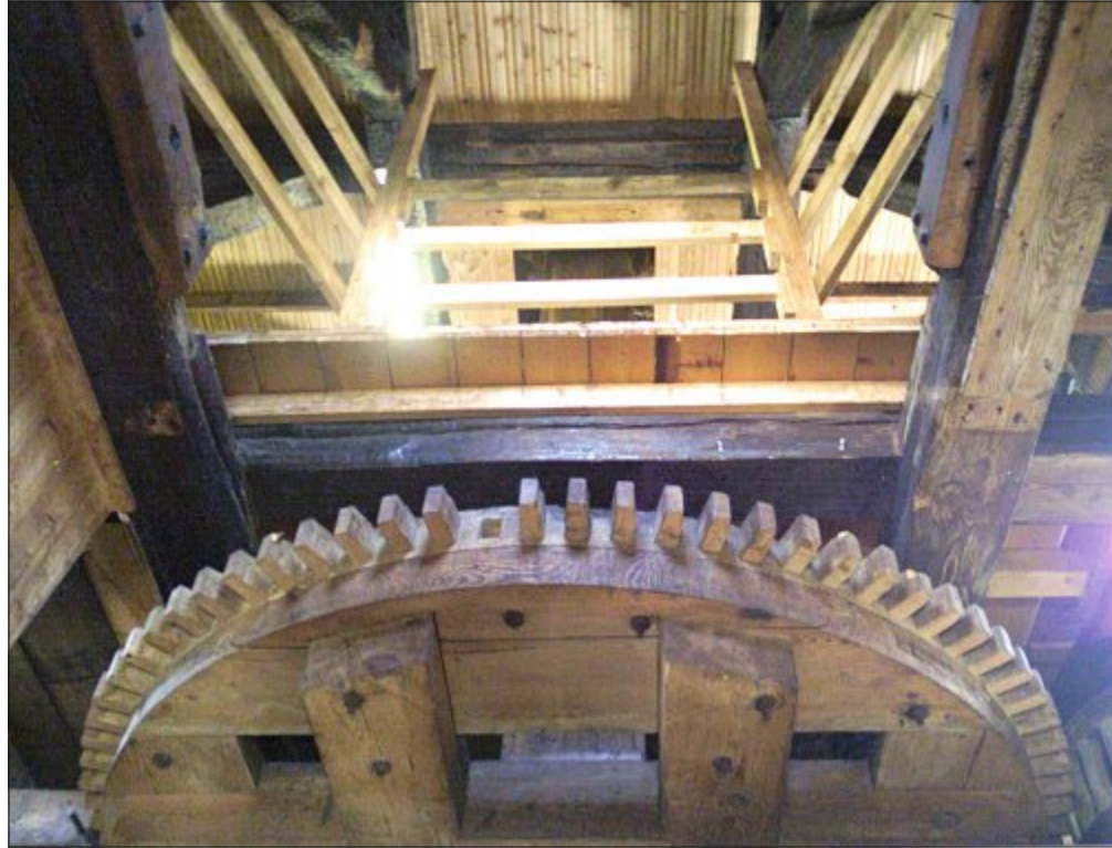
Im Inneren der Mühle: ein Blick in die oberen „Etagen“.