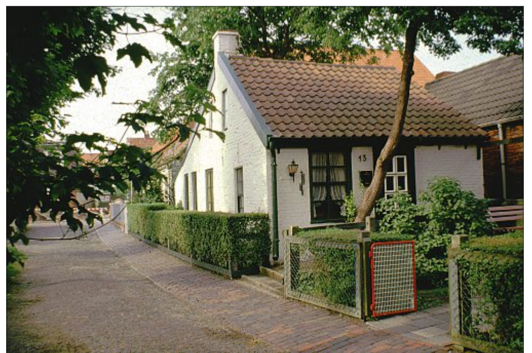
Fischerhaus an der Osterstraße