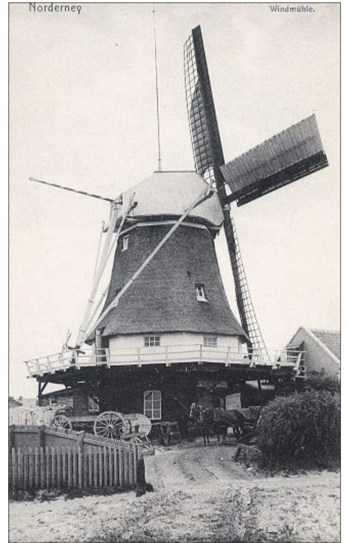
Die Norderneyer Mühle um 1900.

Am 27. Juni 1866 kam es zwischen der hannoverschen Armee und den preußischen Truppen zur blutigen Schlacht bei Langensalza. Zwar mussten sich hier die preußischen Truppen – weil sie zahlenmäßig unterlegen waren – zurückziehen, dennoch war die Ge-