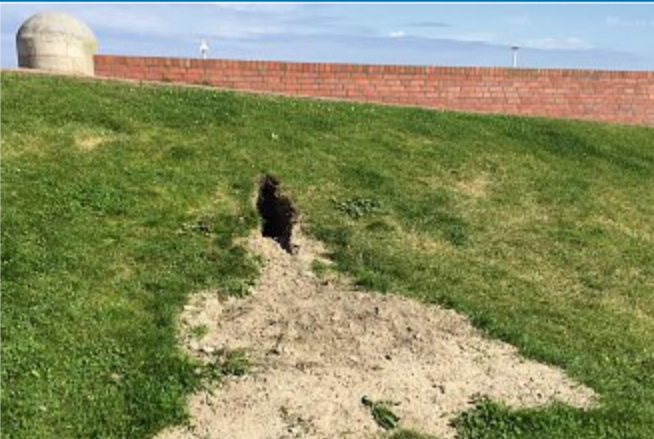
KÜSTENSCHUTZ NLWKN und Hegering rücken Langobren zu Leibe

10.8. – Kaninchen buddeln Inseldeiche auf