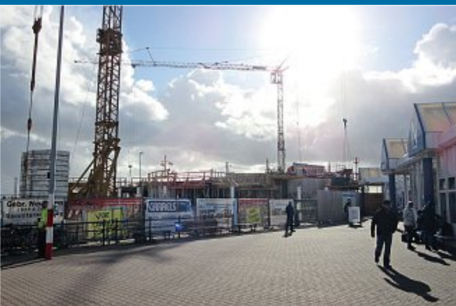
VERKEHR Terminalneubau liegt voll im Zeitplan

11.8. – Hafen: Erster Teilabriss steht bevor