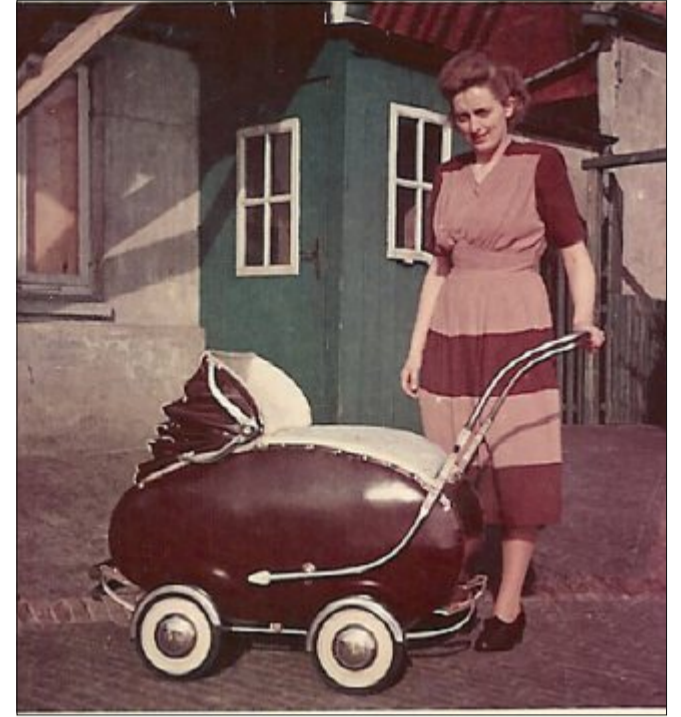
Iris Pugatschovs Tante, Elisabeth Fleetjer, mit Kinderwagen vor dem Ladeneingang um 1950.