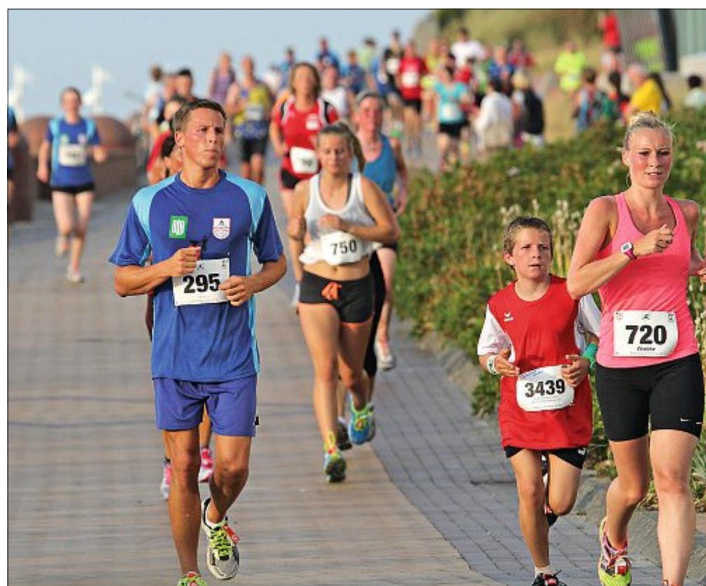
Aus dem früheren OLB-Cityabendlauf geht nach einem Jahr Pause nun mit neuen Veranstaltern der „meine Insel“-Lauf hervor. Die erste Ausgabe startet im Juli.