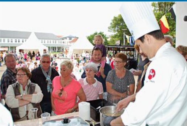
AKTIONSTAGE Köcheverein lädt wieder zu „Fisch & Meer“ ein

21.6. – Neun Hobbyköche auf der Showbühne