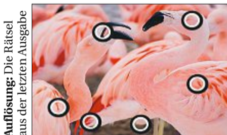
Auflösung: Die Rätsel aus der letzten Ausgabe