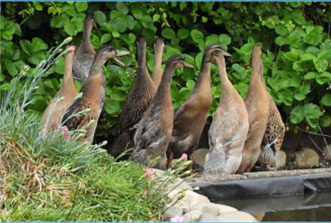
NATUR Laufenten sollen Schnecken und Insekten vertilgen

20.6. – Neue Bewohner am Kleingartenteich