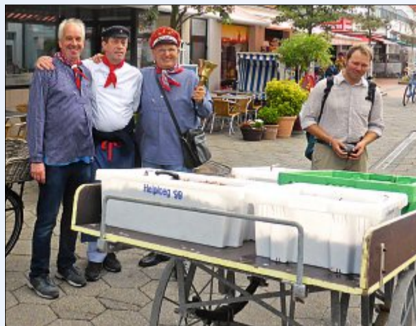
Zum Rahmenprogramm der kulinarischen Aktionstage gehört auch der Krabbenwagen, mit dem die Veranstalter morgen zum Kurplatz ziehen.