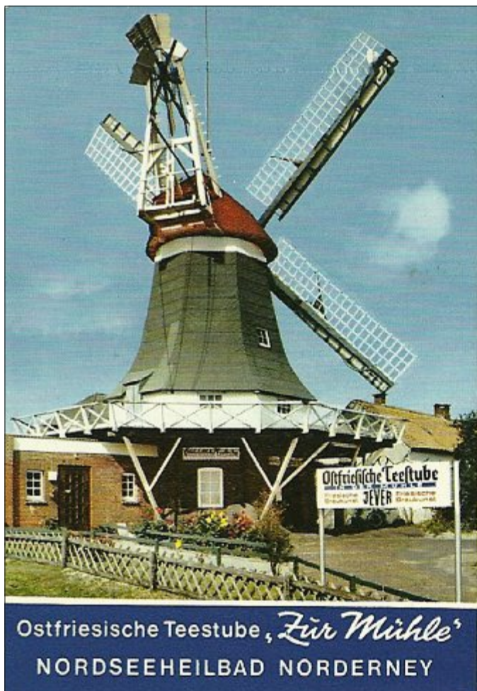
Durch all ihre Jahre war und ist die Norderneyer Mühle ein beliebtes Postkartenmotiv. Dieses Exemplar zeigt auch die Innenräume der Teestube. Auf dem Bild oben rechts gibt rechts vom Tresen die steile Stiege nach oben in die erste Etage der Mühle.