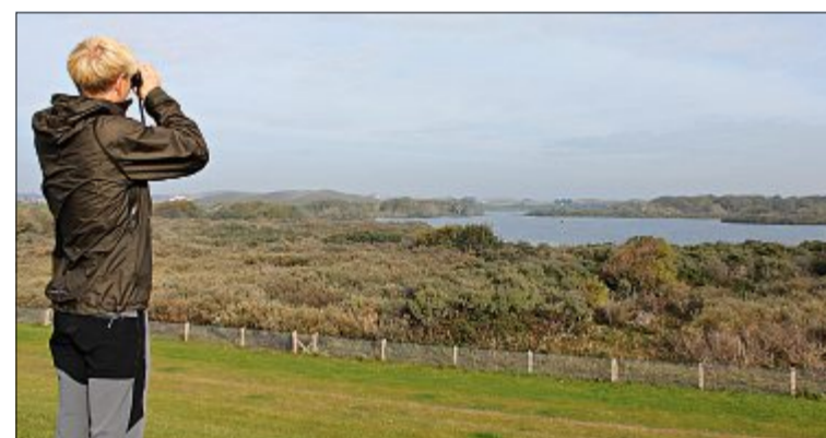
Zahlreiche Tier- und Pflanzenarten können im Nationalpark Wattenmeer entdeckt werden. Besonders zur Zugvogelzeit empfiehlt es sich, das Fernglas herauszuholen.

Von internationaler Bedeutung ist das Wattenmeer