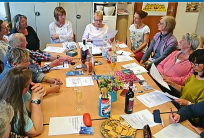
VERSAMMLUNG Verein will Literatursparte neu beleben

22.6. – Kunst und Literatur: Wieder volles Programm