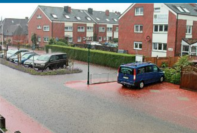
LAND UNTER Anlieger haben sich bei Stadt gemeldet

23.6. – Sturzregen flutet sanierte Nordhelmstraße