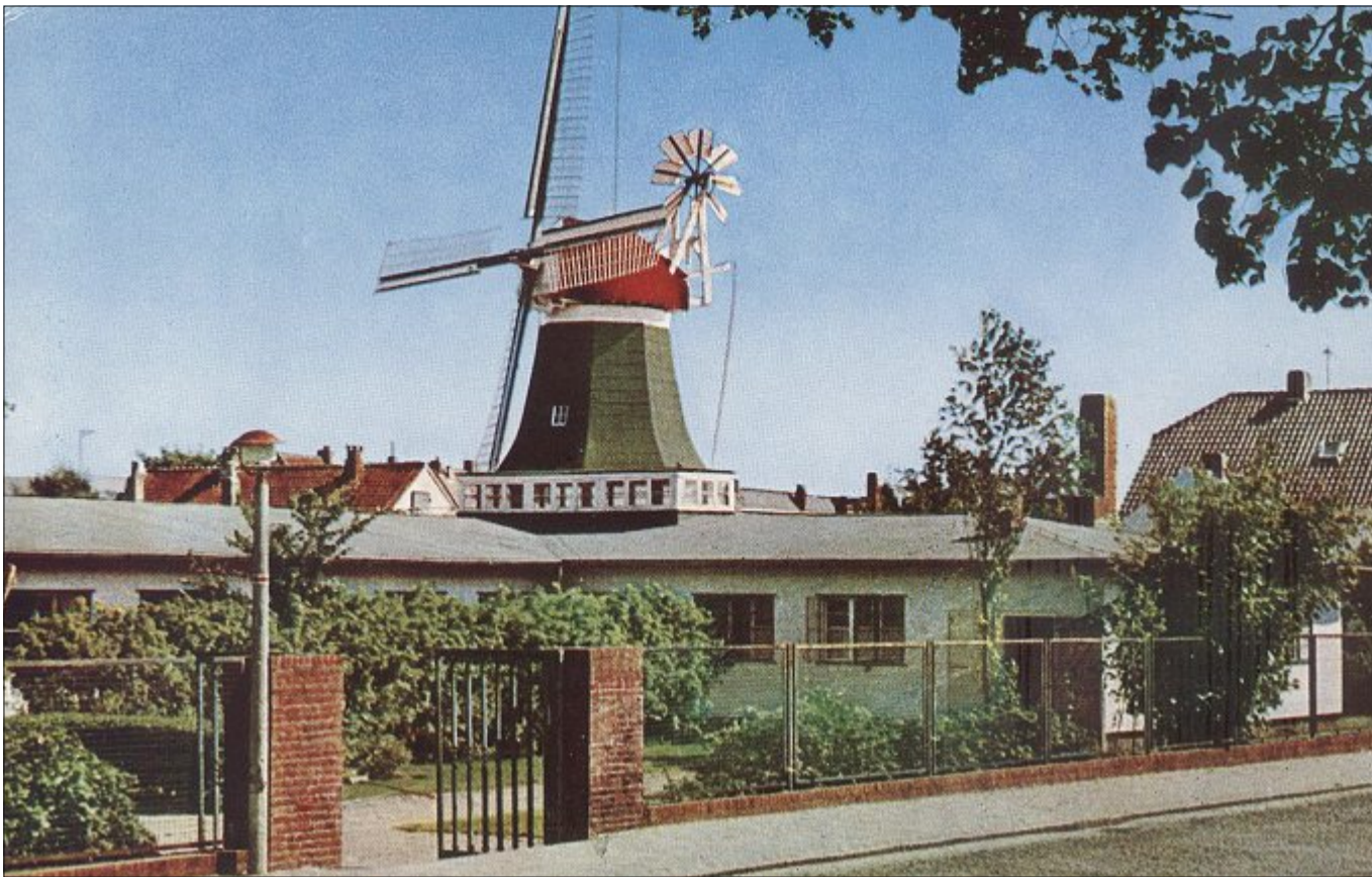
Die „Selden Rüst“ von der Mühlenstraße her, vor dem Ausbau des Schulzentrums.