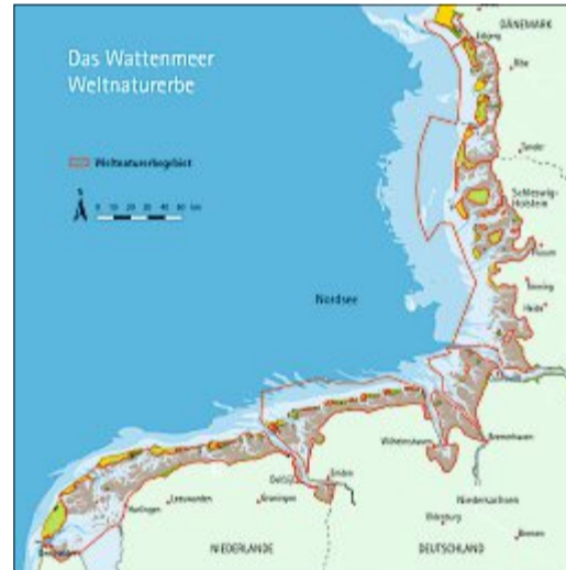
Übersichtskarte des Welterbes Wattenmeer.

auf das Wattenmeer zu? Das wird Kornrad Kornweihe in der nächsten Folge schildern.