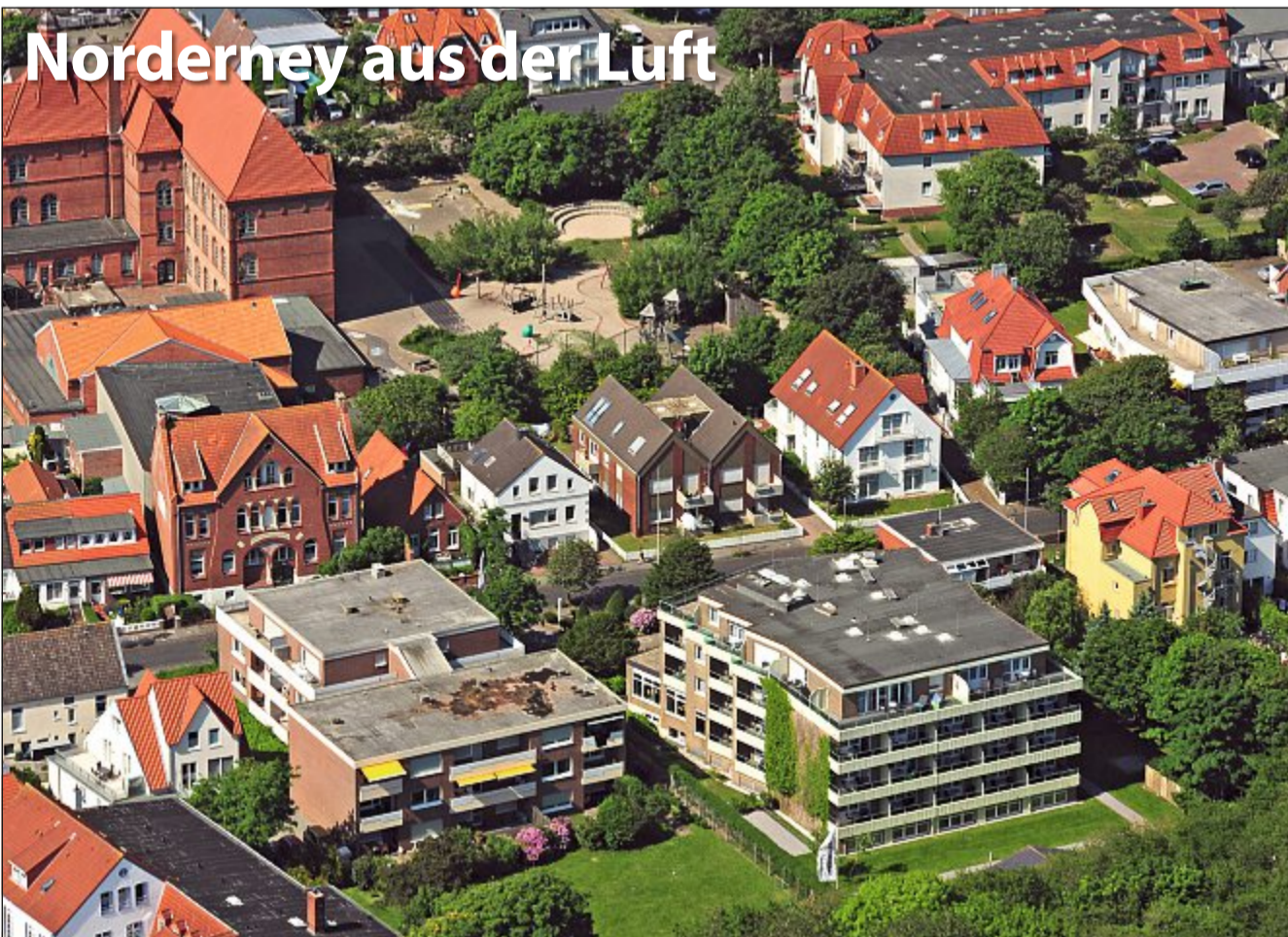
Die Bestellnummer lautet: Norderney Kurier 724