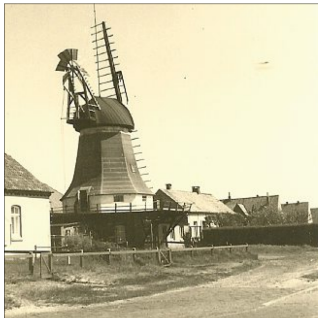
Die Inselmühle Anfang 60er-Jahre.