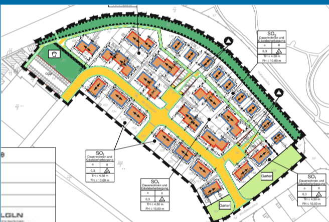
BEBAUUNG Nicht alle Norderneyer mit Änderungen einverstanden

14.6. – Süderdüner immer noch nicht zufrieden