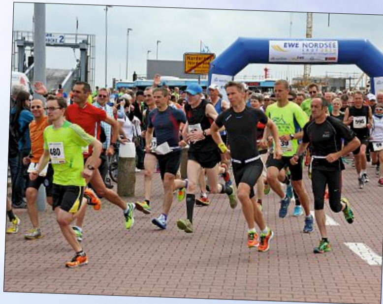
Der 15. Nordseelauf wurde auf Norderney nicht wie sonst direkt vom Schiff aus gestartet, sondern von der Baustelle am Hafen.