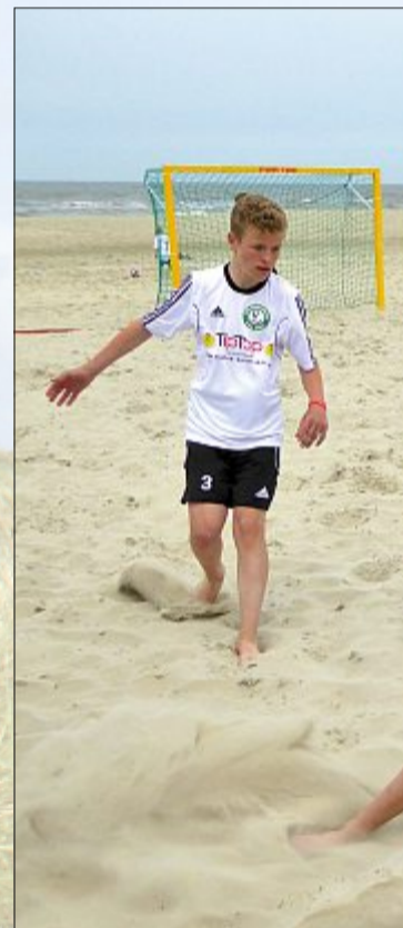
Bei perfekten Bedingungen haben die Weissen Düne auf Norderney um... Ohne größere Verletzungen, so M... etwa 1500 Teilnehmer auf ein ge...