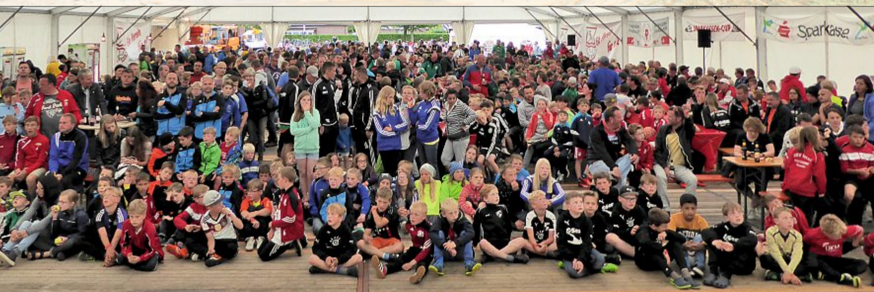
zum Turnierwochenende zu beherbergen, haben sich erneut zahlreiche Helfer um die TuS-Funktionäre versammelt und nicht nur für einen reibungslosen Turnierablauf, Spaß und Unterhaltung gesorgt. Sowohl das Eröffnungsspiel der Fußball-EM in Frankreich am Freitagabend als auch die Siegerehrung am Sonnabend erlebten die hier gemeinsam im Zelt auf dem Sportplatz an der Mühle.