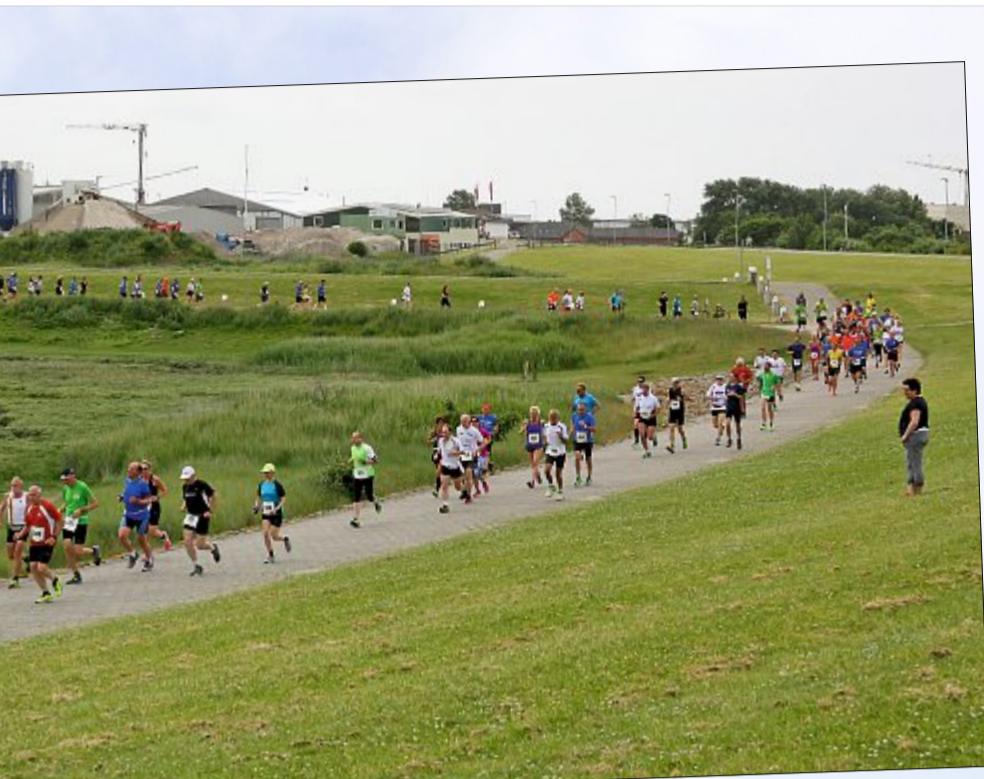
erste Etappe führte über 13,1 Kilometer entlang Norderneys Küsten.