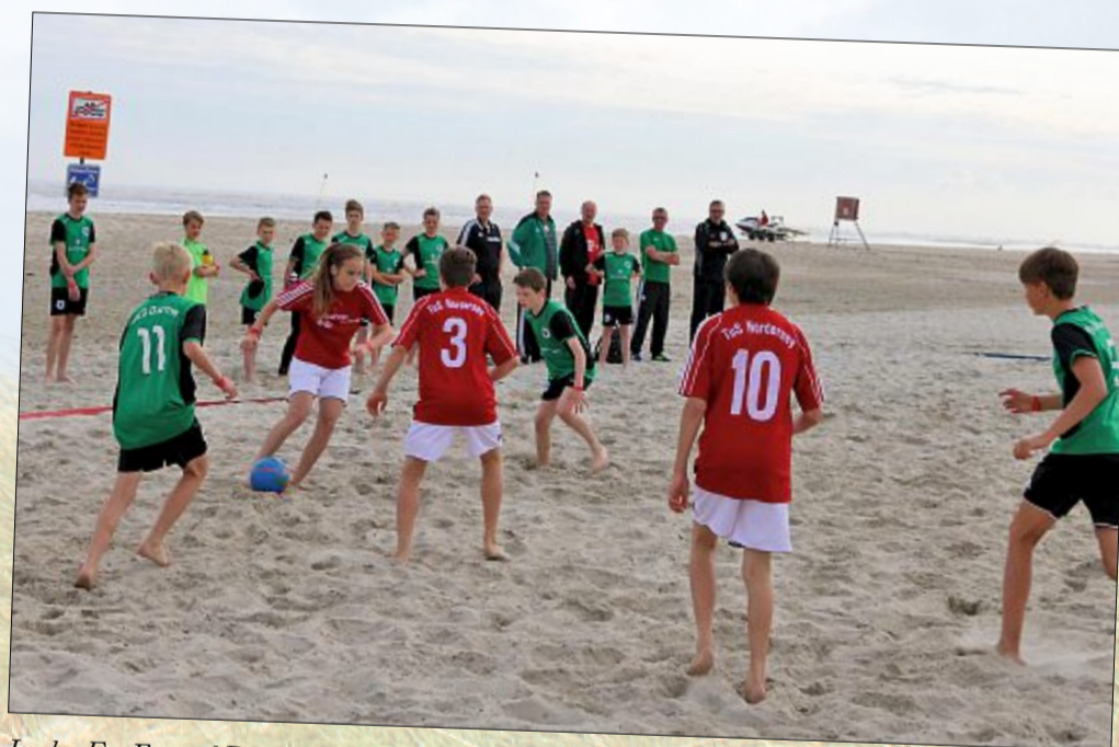
In der F-, E- und D-Jugend traten die Nachwuchskicker direkt am Strand gegeneinander an. Auch die Lokalmatadore vom TuS Norderney konnten ihre Leistungen sehen lassen. In der E- und D-Jugend landeten sie auf den vorderen Plätzen.