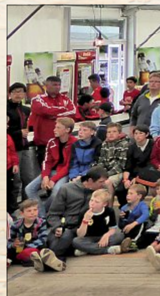
Um die weit über 1000 Gäste... sondern auch für Verpflegung... knapp 1500 Turnierteilnehm...