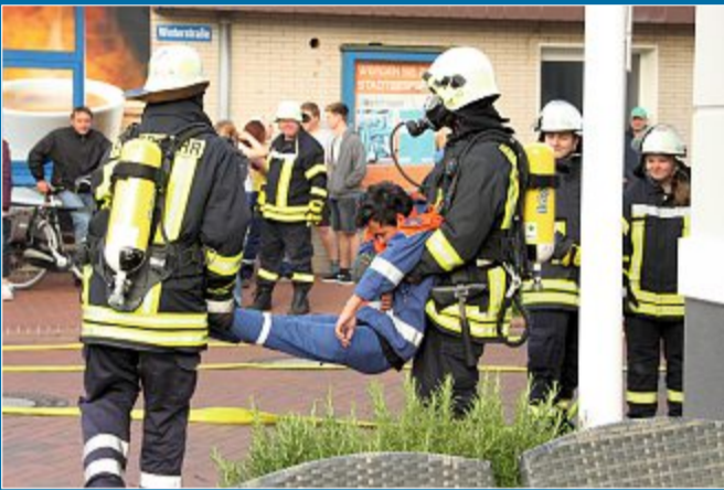
RETTUNG In einer Großübung probt die Feuerwehr den Ernstfall

13.6. – Inselwehr erweist sich als schlagkräftige Truppe