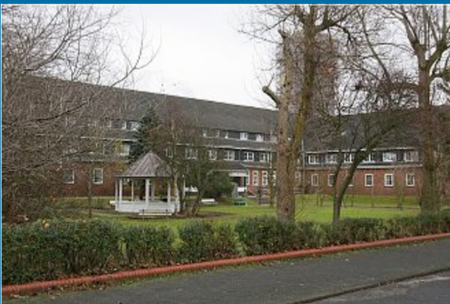
PFLEGE Landkreis: Weiterhin erhebliche Defizite – Teiluntersagung

15.6. – Altenheim hat Insolvenz angemeldet