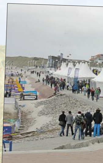
Überschaubar auch die Besucher herrschte dafür bei der Typisierungssponder ließen sich bei der DKM