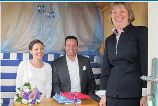
EHE. Besondere Hochzeit: 1000. Trauung im Badekarren