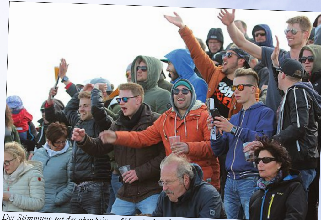
Der Stimmung tat das aber keinen Abbruch. Angefeuert, gejubelt und gefeiert wurde trotz Kälte und steifer Brise am Nordstrand.