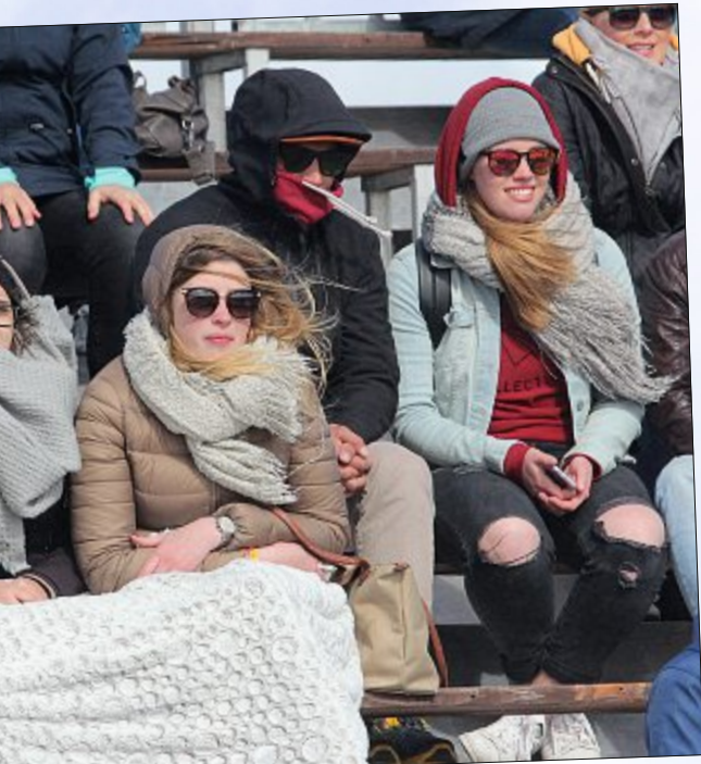
Das Festival am Pfingstwochenende nicht so richtig mitspie- Zuschauer auf der Tribüne.