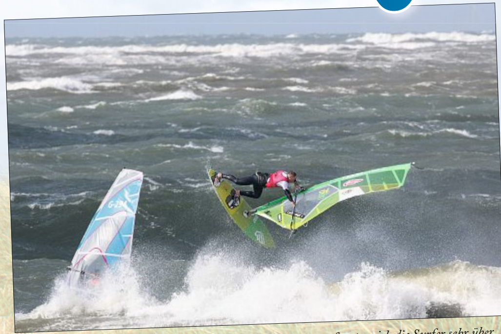
Während die Beach-Volleyballer in langen Anzügen antraten, freuten sich die Surfer sehr über den Wind, der ihnen den Ritt über die Wellen in allen Disziplinen ermöglichte.