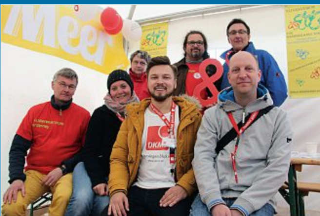
AKTION Erfolgreiche Registrierung beim White Sands Festival