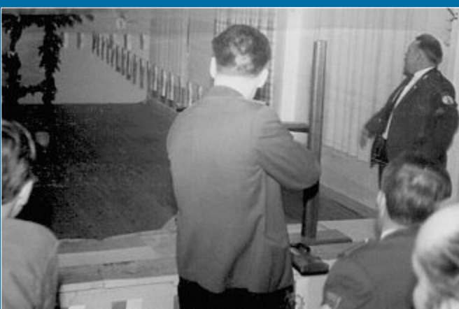
VEREIN Mit Luftgewehr Modell „Diana“ fing damals alles an

19.5. – Inselschützen feiern 50. Geburtstag