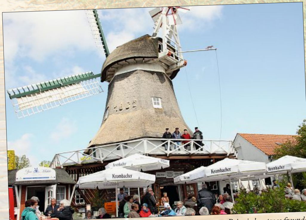
Am Pfingstmontag fand außerdem der bundesweite Mühlentag statt. Bei wieder etwas freund- licherem Wetter genossen zahlreiche Besucher an der Inselmühle Selden Rüst das bunte Treiben, verschiedene Leckereien und natürlich interessante Mühleninfos.