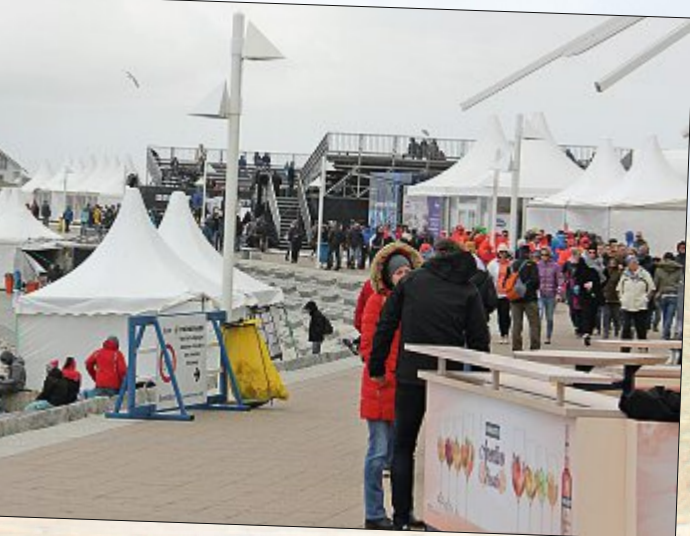
mengen in den Festzelten an der Promenade. Großer Andrang ngsaktion direkt am Januskopf: 668 potenzielle Stammzellen- IS registrieren.