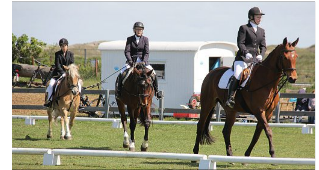
In verschiedenen Disziplinen lassen sich Pferde und Reiter prüfen.

Beim Mannschaftswettbewerb waren gleich fünf Disziplinen im Laufe des