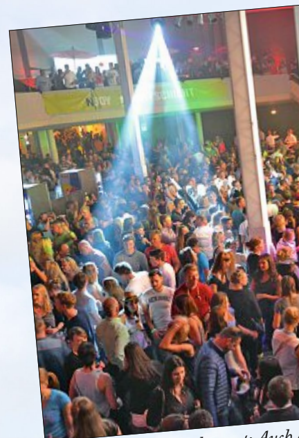
Tanzen bis der Arzt kommt: Auch waren wieder gut besucht.