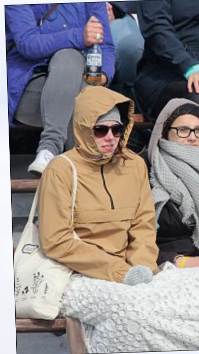
Das Wetter wollte beim White Sanden, dick eingemummelt saßen die