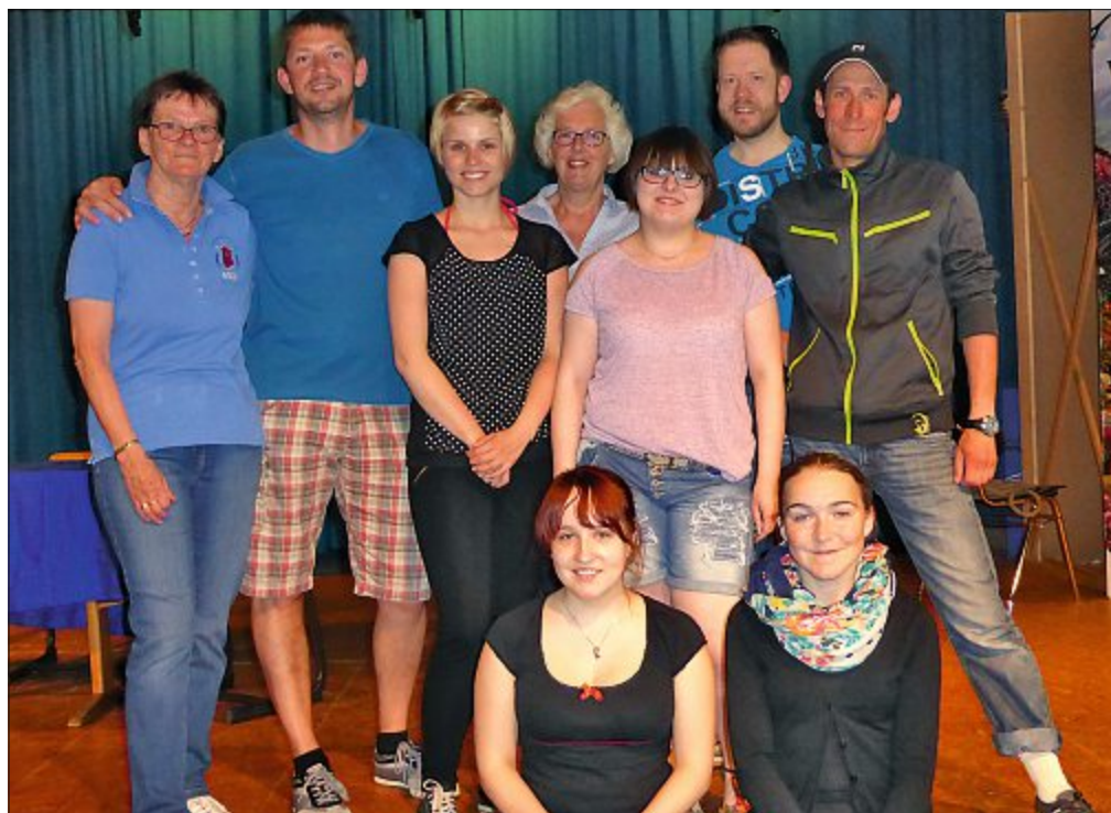
Letzte Vorbereitungen bei den Laienschauspielern: Heute Abend ist Premiere.