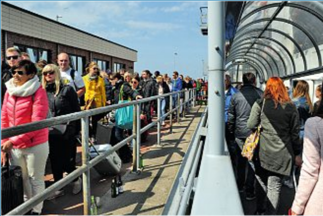
ANREISE Fähren und Zoll wieder im Dauereinsatz