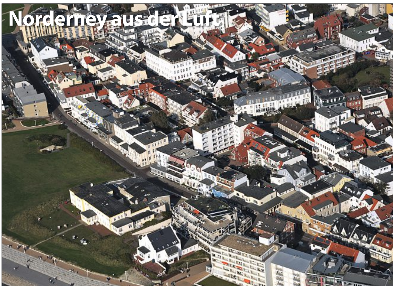
Die Bestellnummer lautet: Norderney Kurier 720