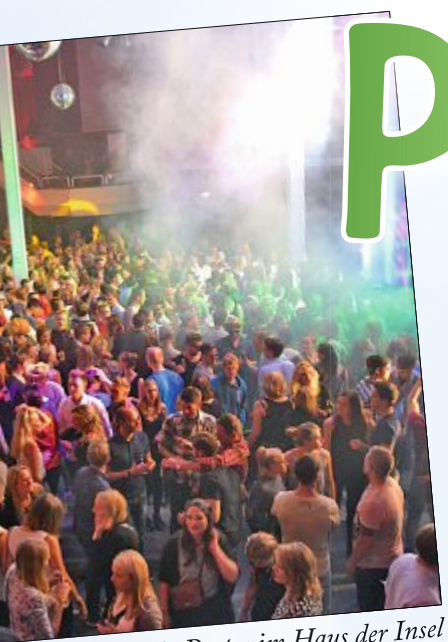
die White-Sands-Partys im Haus der Insel