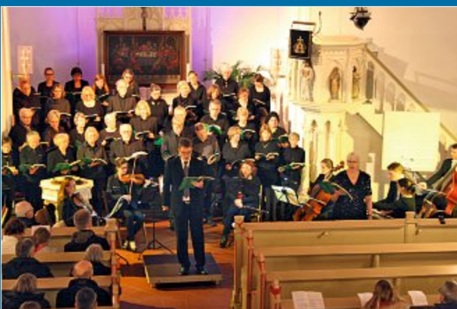
KONZERT Erstmals treten Solisten der Norderneyer Kantorei auf

29.3. – Johannes-Passion in der Inselkirche