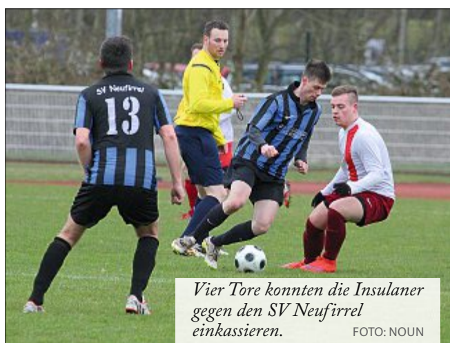
Vier Tore konnten die Insulaner gegen den SV Neufirrel einkassieren.