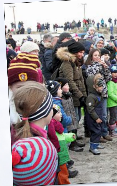
Laut riefen die Mädchen und Jungen ihre Fackel durchzulassen.

Donnerstag, 7. April: 20 Uhr: „Der Chor – Stimmen des Herzens“