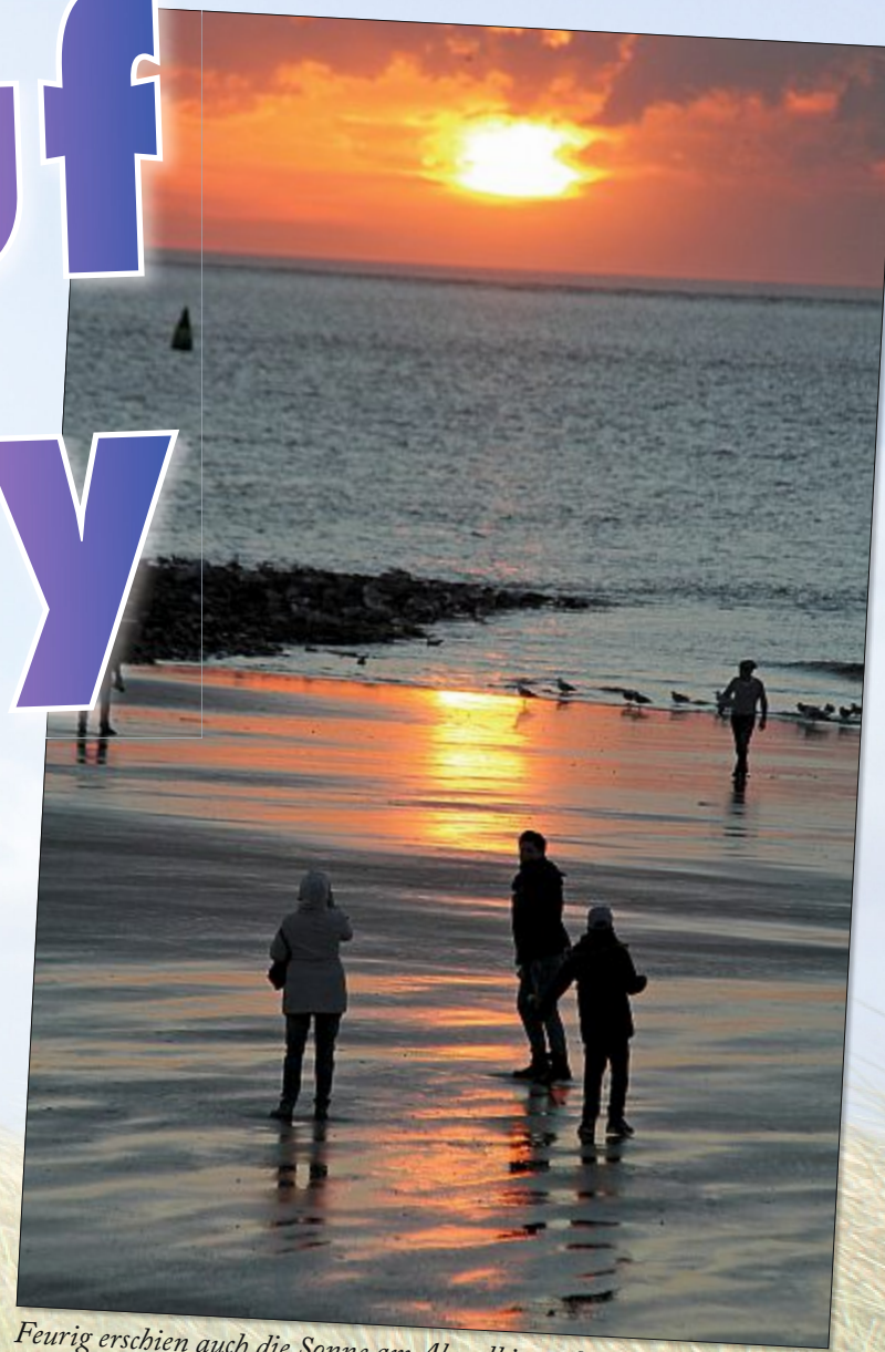
Feurig erschien auch die Sonne am Abendhimmel...