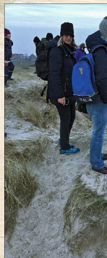
Von den Dünen, den Ständen, und feuchten Holzes über die Promenaden