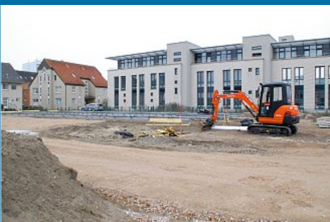
BAUMASSNAHME Haus G wird eine Holzkonstruktion

31.3. – Klinik Norderney wird temporär erweitert