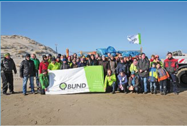
UMWELT Müll im Meer: Globales Problem lokal behandeln

26.3. – BUND und Helfer sammeln zwei Tonnen Müll