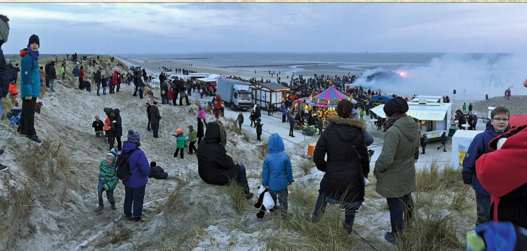
... von der Promenade aus oder auch direkt am Feuer schauten zahlreiche Gäste dem österlichen Spektakel zu. Nur der Wind spielte nicht mit und trug den Qualm des ... made Richtung Stadt. Den Spaß ließen sich die Besucher durch die steife Brise aber nicht verderben.