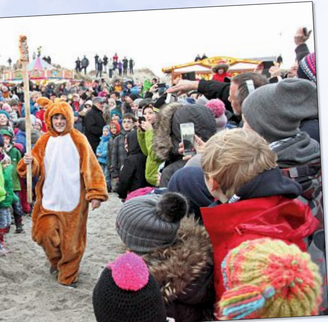
...gen den Osterhasen herbei und standen Spalier, um ihn mit