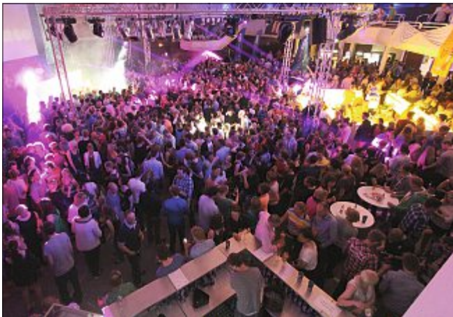
Partystimmung im vollen Haus der Insel.