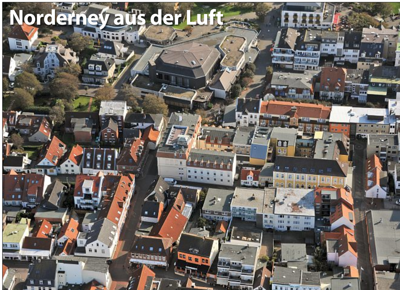
Die Bestellnummer lautet: Norderney Kurier 713