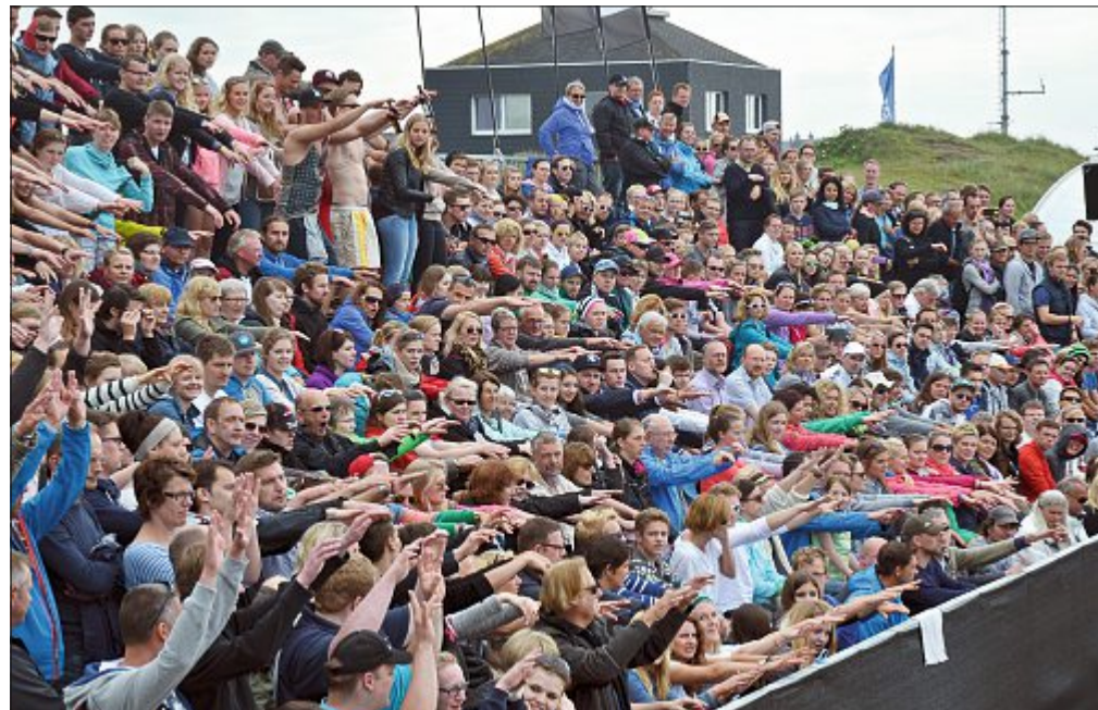
Sportliche Wettkämpfe und ein buntes Rahmenprogramm verwandeln den Nordstrand über Pfingsten regelmäßig zu einer gut gelaunten Fanmeile.

Der Deutsche Windsurf-Cup ist die offizielle nationale Regattaserie im Windsurfen.