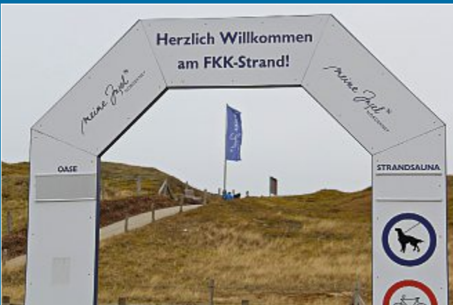
TOURISMUS FKK-Strand soll anders konzipiert werden