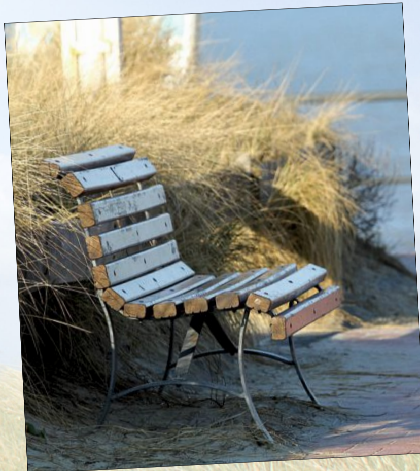
Einladung zu einem Päuschen.