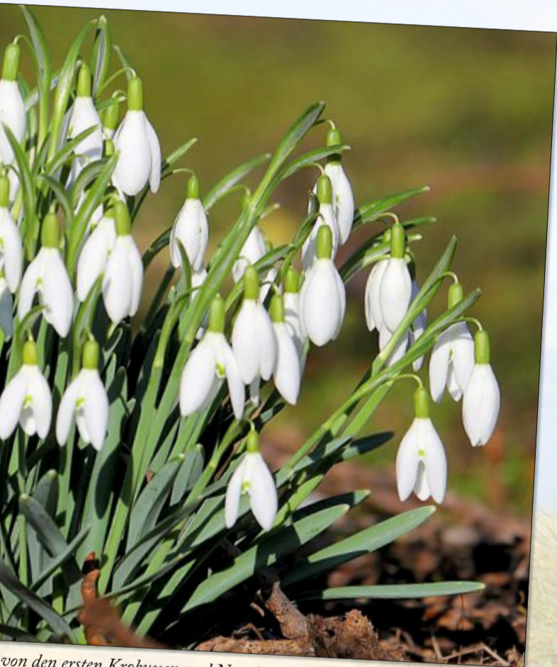
von den ersten Krokussen und Narzissen.