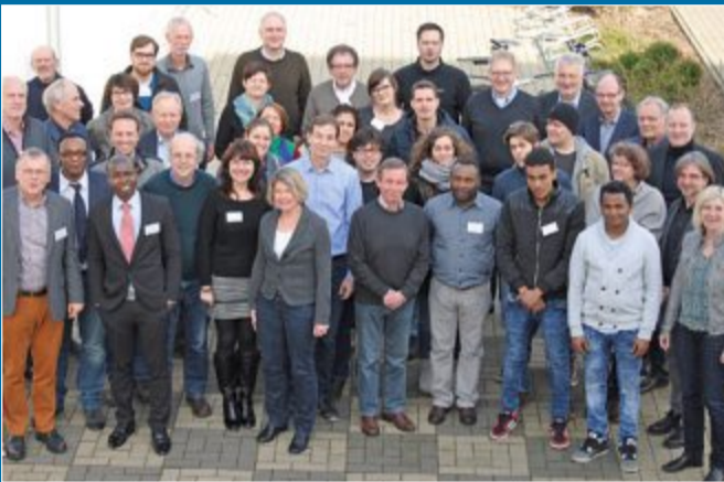
HUMANITÄRE HILFE Stiftung Outlawo lädt zur Tagung ein