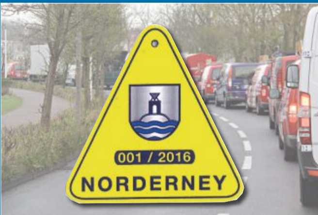
VERKEHRSSPERRE Ausnahmegenehmigungen besser erkennbar

2. 3. – Künftig nur noch einheitliche Plaketten