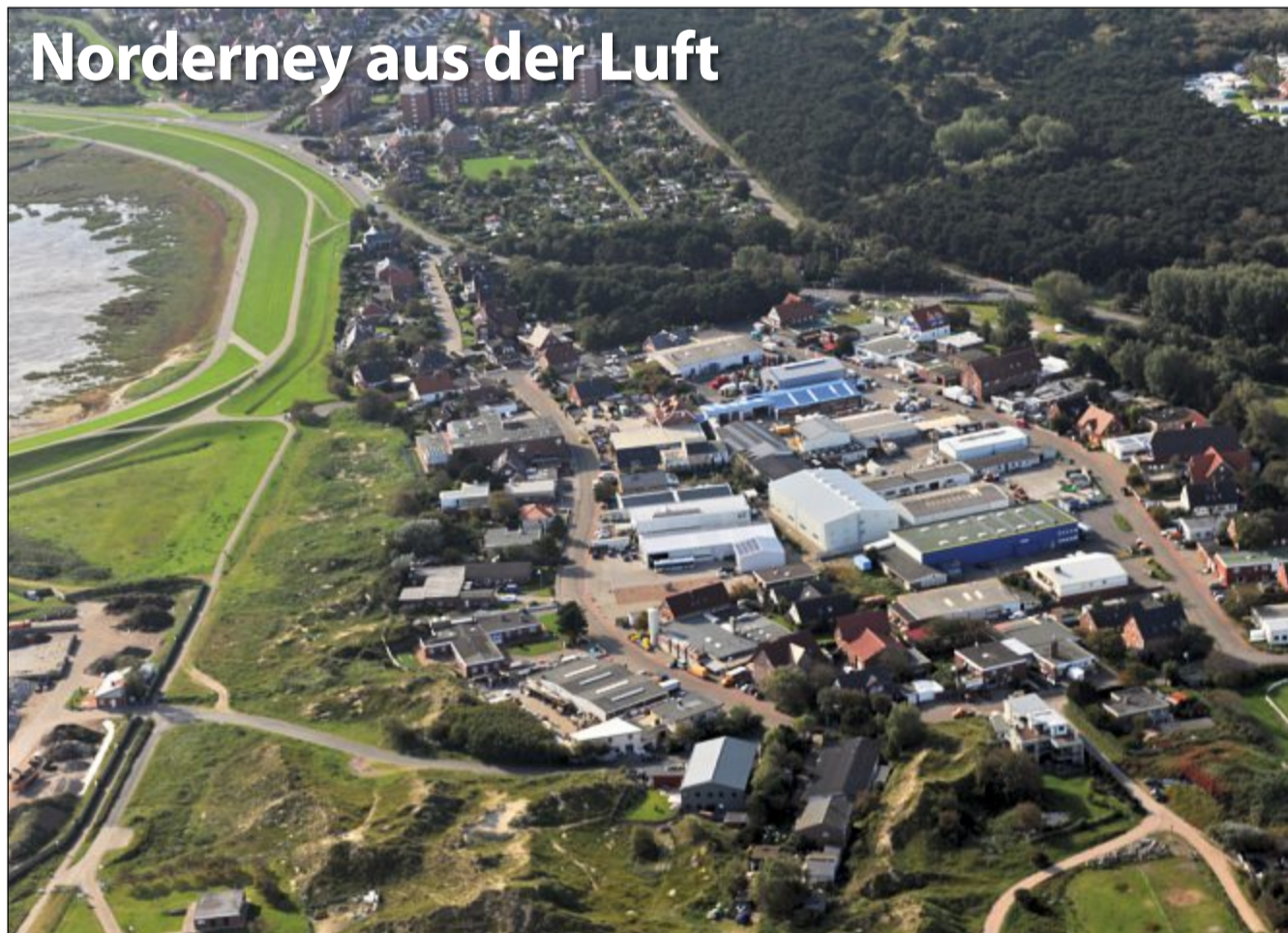
Die Bestellnummer lautet: Norderney Kurier 649