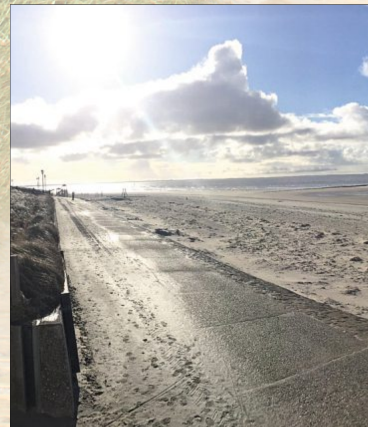
Unendliche Weite – zumindest gefühlt.