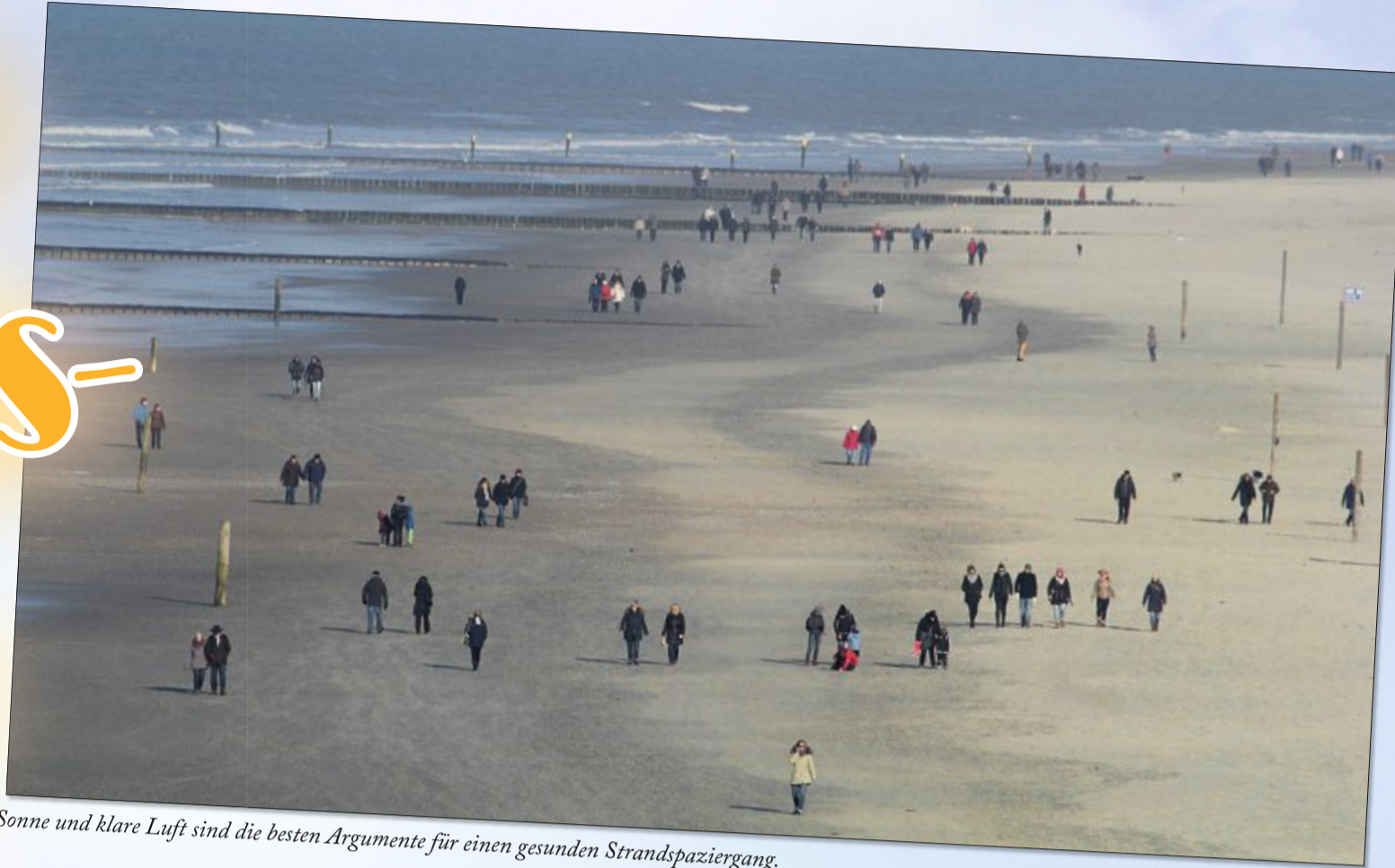
Sonne und klare Luft sind die besten Argumente für einen gesunden Strandspaziergang.