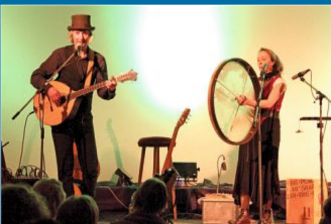
KONZERT Duo „Siebenschläfer“ begeistert Inselpublikum

1. 3. – Von Renaissance über Romantik bis Legenden