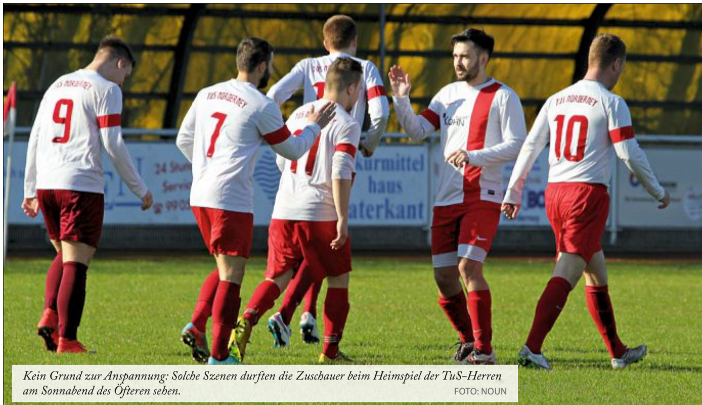
Kein Grund zur Anspannung: Solche Szenen durften die Zuschauer beim Heimspiel der TuS-Herren am Sonnabend des Öfteren sehen.

Es spielten: Schoon, Harms, Kaszuba, Rauchmann (58. Bednarczyk), Vlad, Visser (72. Oer), Pommer, Cömertpay, Engelkes, Angelli, Hollbach (65. Loth).