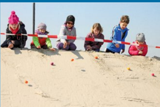
FERIENTAGE Zu Ostern wieder traditionelles Programm

3. 3. – Es darf wieder getrullert werden