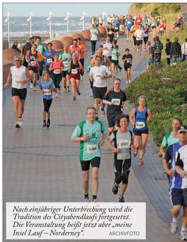
Nach einjähriger Unterbrechung wird die Tradition des Cityabendlaufs fortgesetzt. Die Veranstaltung heißt jetzt aber „meine Insel Lauf – Norderney“.

Der Lauf wird weiterhin in den Abendstunden ausgetragen und führt über einen Rundkurs. Die neue Strecke wurde leicht zur alten Cityabendlauf-Strecke modifiziert und wird ihren Start- und Zielbereich am historischen Kurplatz der Insel haben. Die Teilnehmer