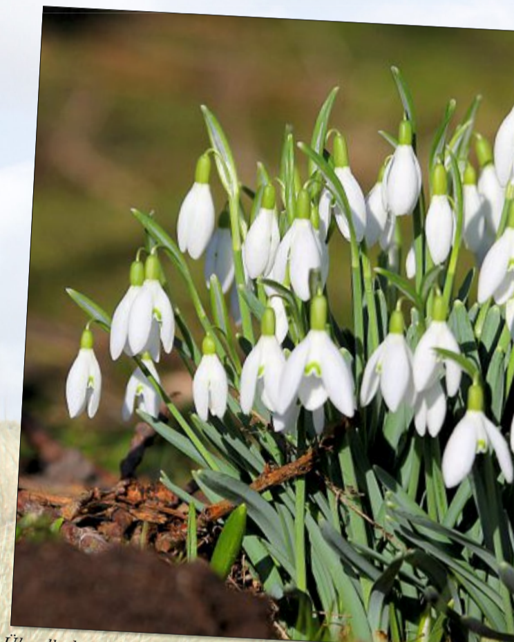
Überall schauen die Schneeglöckchen mittlerweile aus dem Boden, begleitet