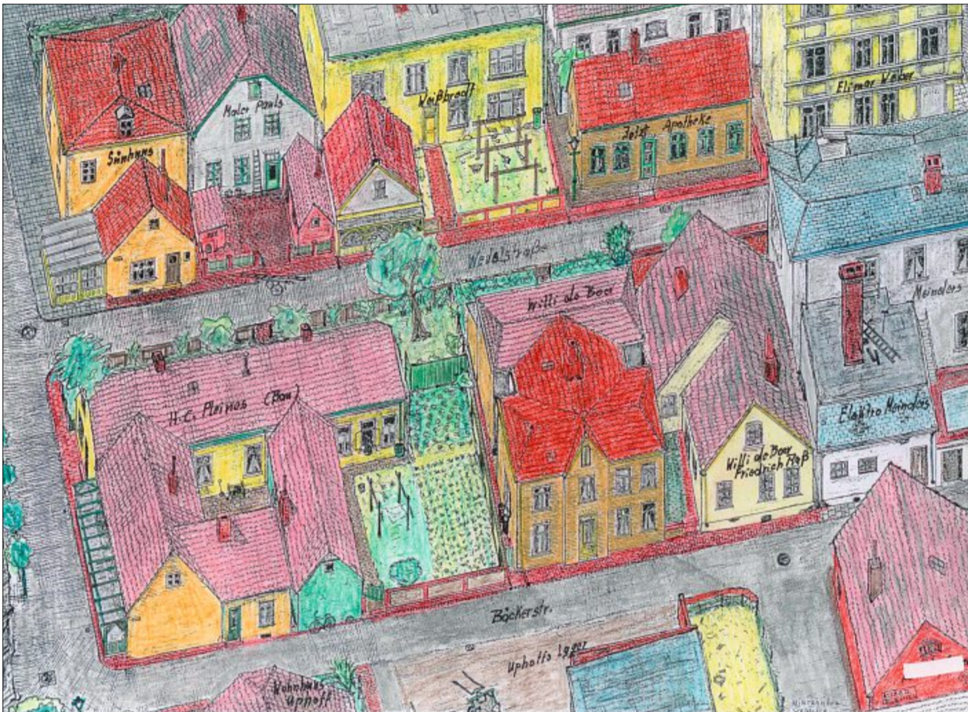
Handwerksbetriebe auf Norderney: Diese Zeichnung, die Etzard Pleines um 1960 angefertigt hat, zeigt die Hinterhöfe der Wedel- und Bäckerstraße um 1953.