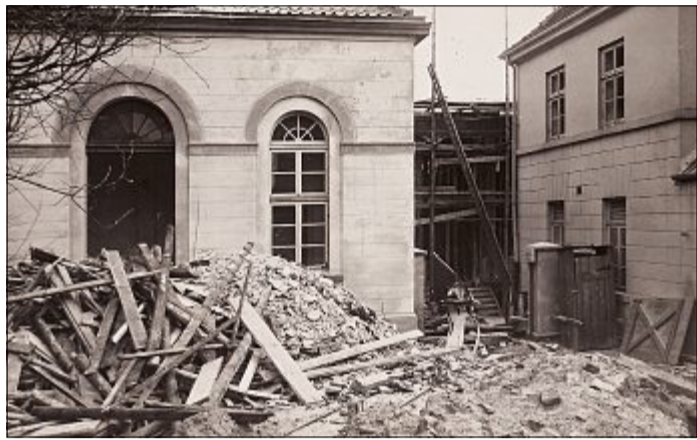
Der preußische Staat hat acht Millionen Reichsmark für den Umbau des Norderneyer Kurhauses bereitgestellt.