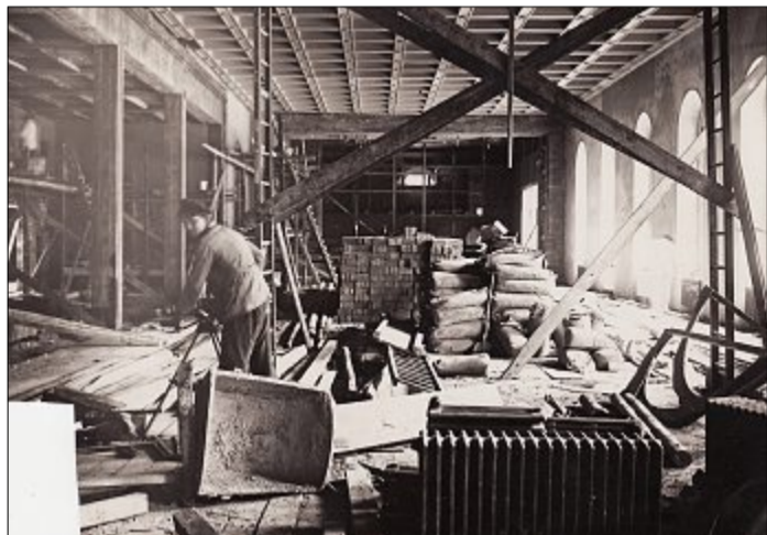
Viele Handwerker hatten auch durch diesen Auftrag gut zu tun in den 20er-Jahren.