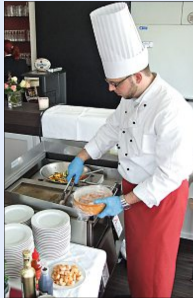
In der Gastronomie und Hotellerie sind auf Norderney zahlreiche Stellen zu besetzen.

Etwas Besonderes zeichne die Schlosserei de Boer aus, ist dem Chef wichtig zu erwähnen: Seit November 2014 ist sie ein vom ZDH offiziell nach DIN EN 1090 zertifizierter Schweißfachbetrieb. Das bedeute, dass die Firma au-