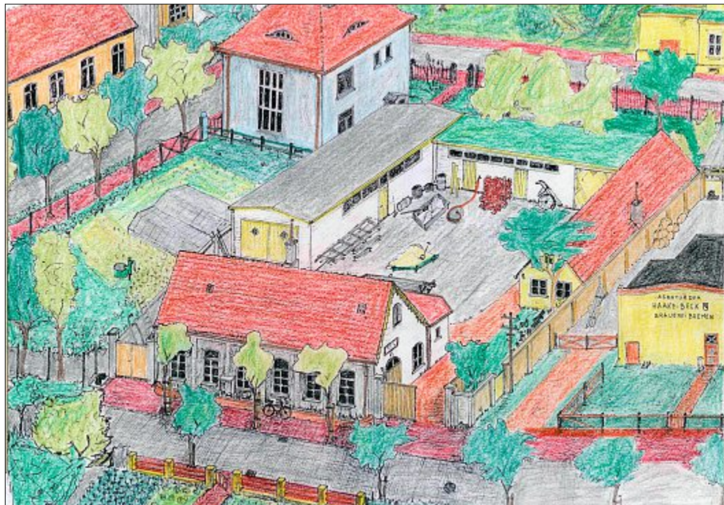
Der Bauhof der Baufirma Pleines & Co und die umliegenden Gebäude von der Gartenstraße aus, gezeichnet um 1960 von Etzard Pleines und coloriert 2009 von Gerhard Eberhardt.