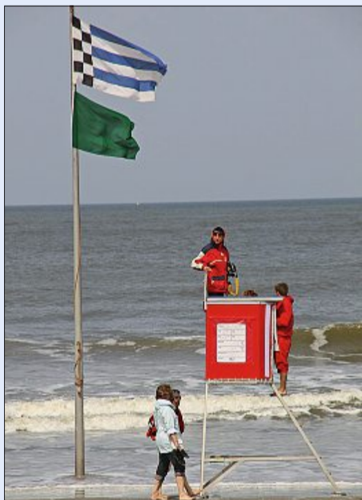
Die Staatsbad Norderney GmbH sucht für die kommende Saison Fachkräfte, so auch Rettungsschwimmer für die Strände. Sie werden nach dem Tarifvertrag des öffentlichen Dienstes bezahlt.