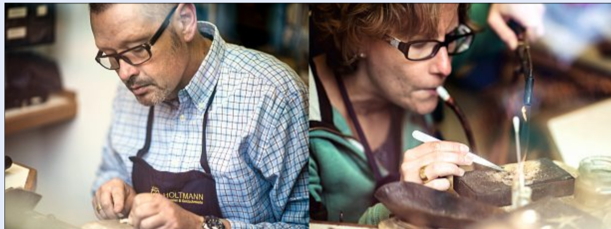
Juwelier und Goldschmiede Holtmann stellt selbst Schmuck mit maritimen und Norderney-bezogenen Motiven her. Die Nachfrage ist groß und deshalb werden Mitarbeiter gesucht.