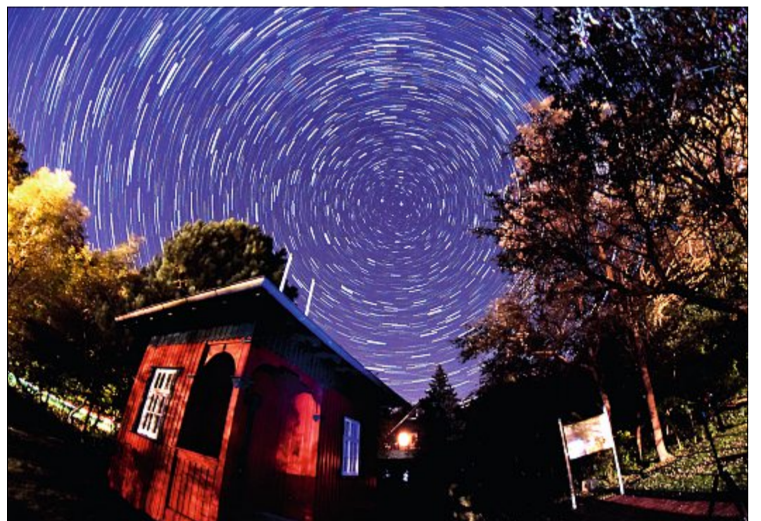
Eine besonderes Inselmotiv ist diese Strichspuraufnahme des vorbeiziehenden Sternenhimmels über dem Bahnhof Stelldichein.