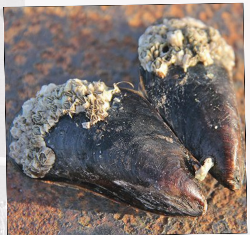
Oh, ein seltener Pockenschmetterling! ...ach nee, doch nur 'ne Miesmüschel...