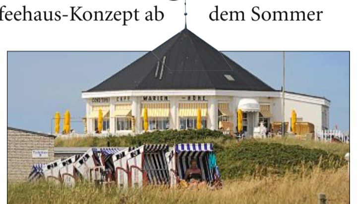
Im Innern der Marienhöhe wird sich in den kommenden Wochen einiges verändern.