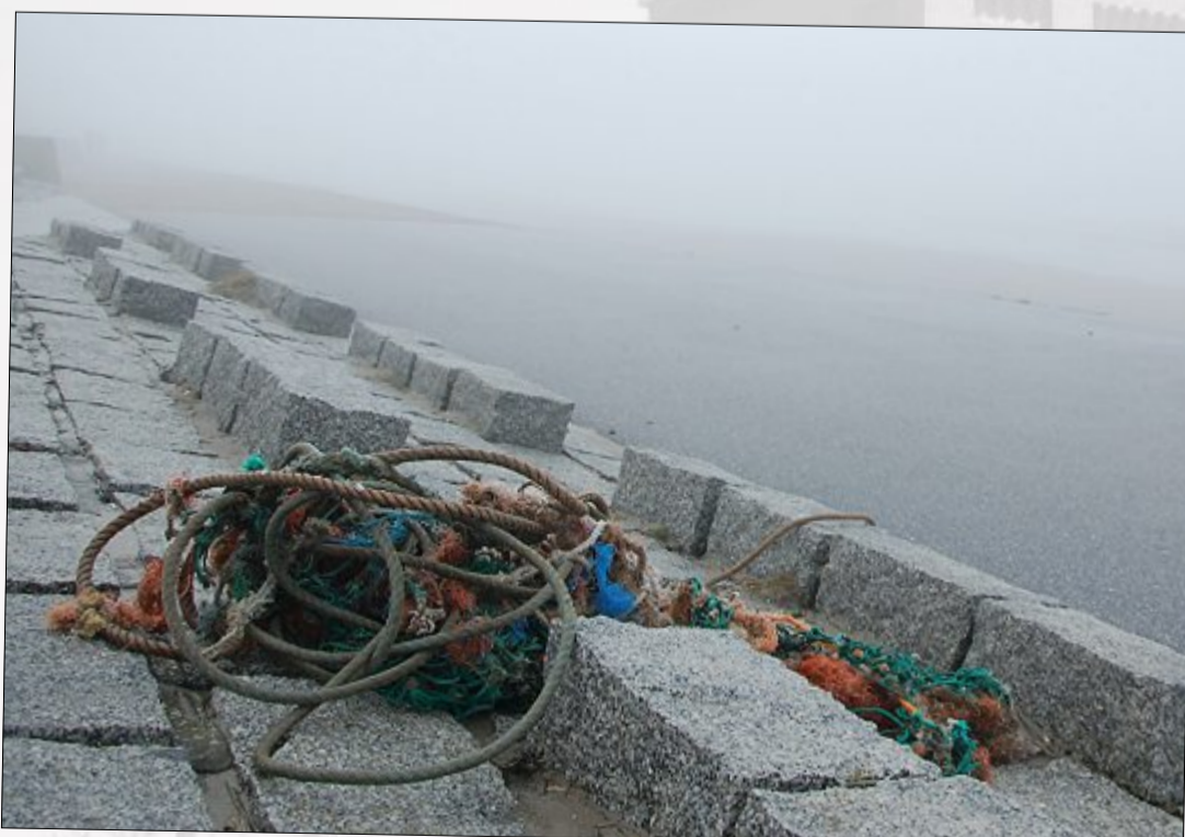
Ein Seilbündel am Weststrand. Kurze Zeit später war es verschwunden. Ob der Nebel es wohl verschlungen hat?