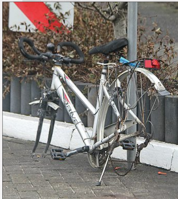
Gut, dieses Rad dürfte als Notbeförderung nicht mehr taugen...