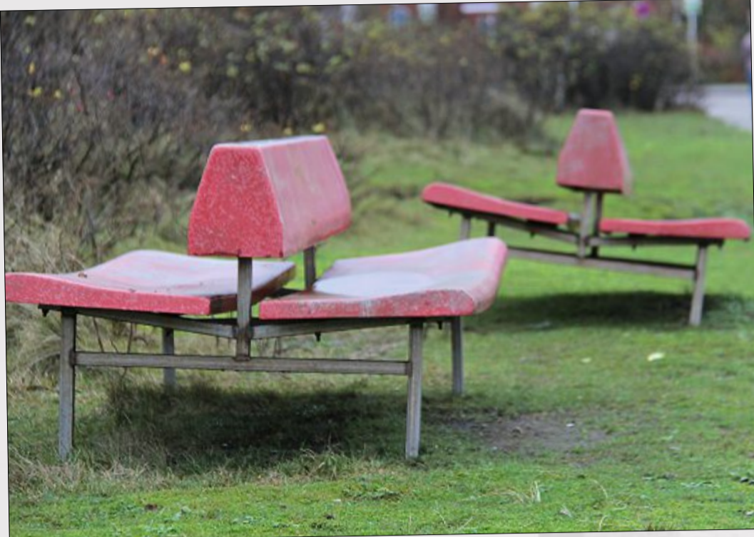
Ein Sitzplatz im Grünen – wie aufmerksam!