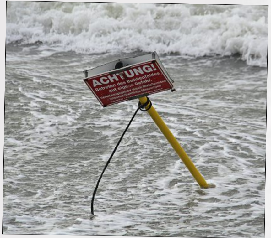
Achtung! Nicht mal das Achtung-Schild kann sich in den Wellen halten...