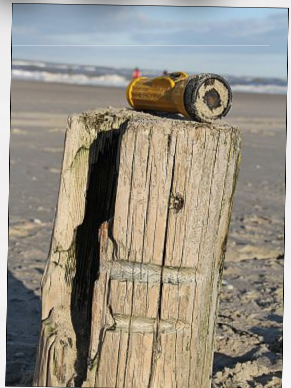
...aber diese Taschenlampe vielleicht?