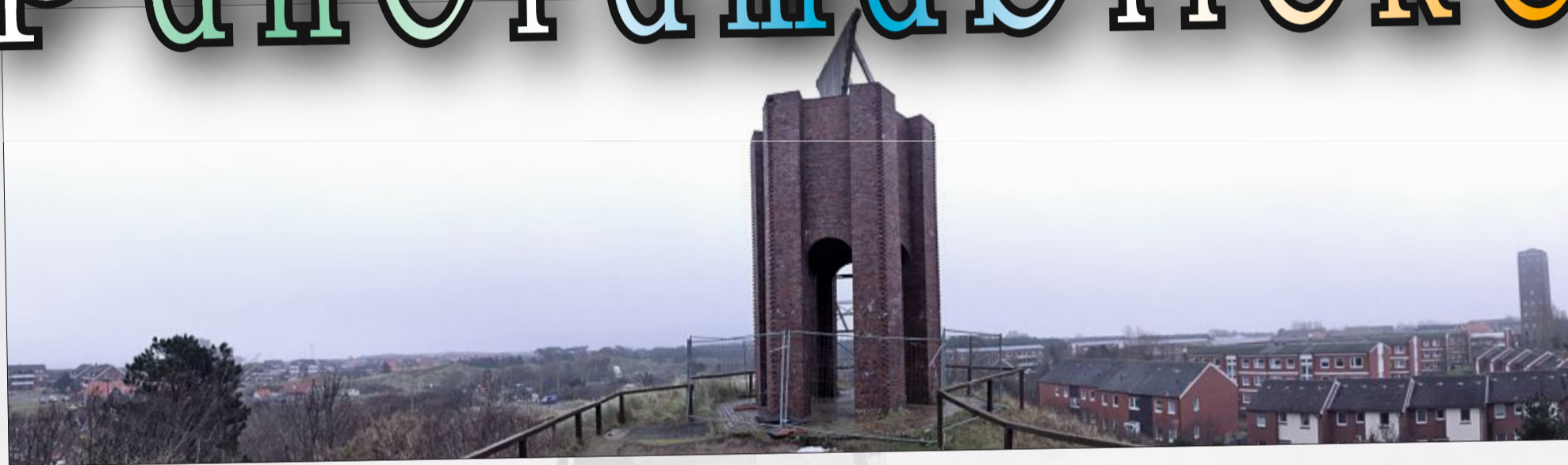
Das Kap: Baustelle am Wahrzeichen.