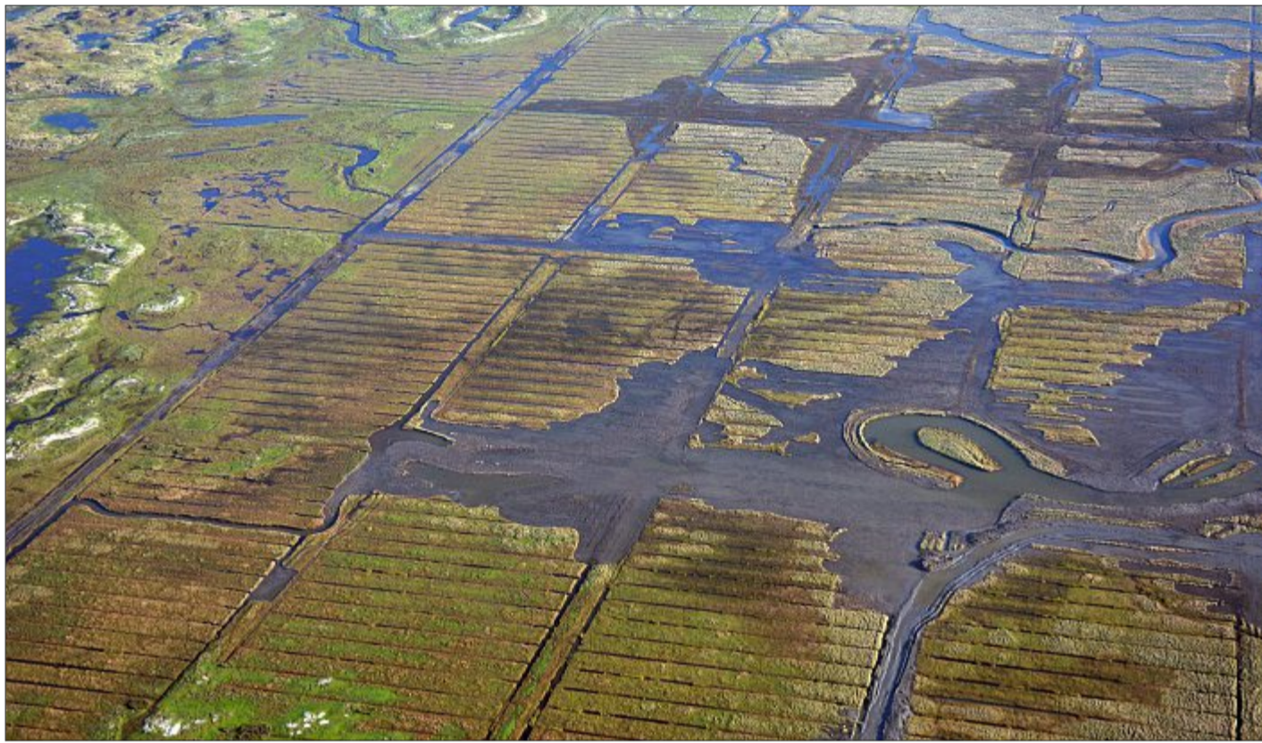
Der Ostheller auf Norderney: Im Hintergrund ist die Fläche zu sehen, die bereits 2008 renaturiert wurde, im Vordergrund die Fläche, auf der die Arbeiten nun abgeschlossen wurden.