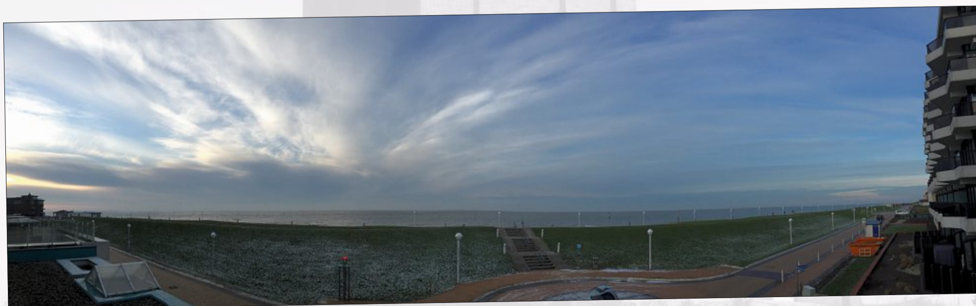
Winter am Nordstrand.