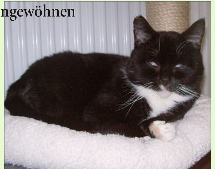
Karl ist ein etwas scheuer, aber lieber kleiner Kerl.

Wer sich für Karl interessiert, kann sich unter Telefon 04938/425 beim Hager Tierheim melden. Das Telefon ist montags bis freitags von 9 bis 12 Uhr und täglich von 13.30 bis 17 Uhr besetzt. Die Öffnungszeiten sind: täglich von 13.30 bis 16 Uhr und nach Vereinbarung – ausgenommen dienstags, mittwochs und an Feiertagen. Weitere Infos finden sich im Internet auf der Seite www.tierheim-hage.de .