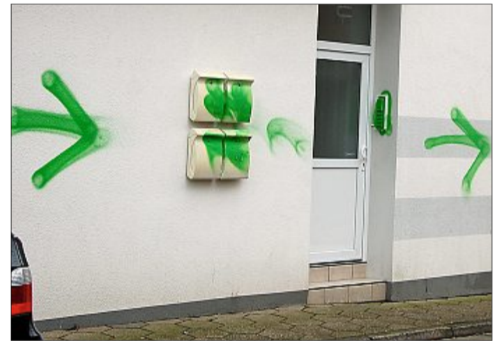
Hauswände, Briefkästen und Klingelschilder sind an diesem Gebäude in der Jann-Berghaus-Straße besprüht - nur einer der zahlreichen Tatorte im Norderneyer Stadtkern.

Wer sich diesen makaberen Scherzerlaubungen damit zahlreiche Sachbeschädigungen begangen hat, ist der Polizei noch unklar. „Wir wissen nur von zahlreichen Tatorten und haben eine ganze Zahl von Anzeigen gefertigt“, sagt man auf der Norderneyer Wache. Hinweise zur Ermittlung des oder der Sachbeschädiger werden daher weiterhin an die Polizei unter Telefon 04932/92980 erbeten.