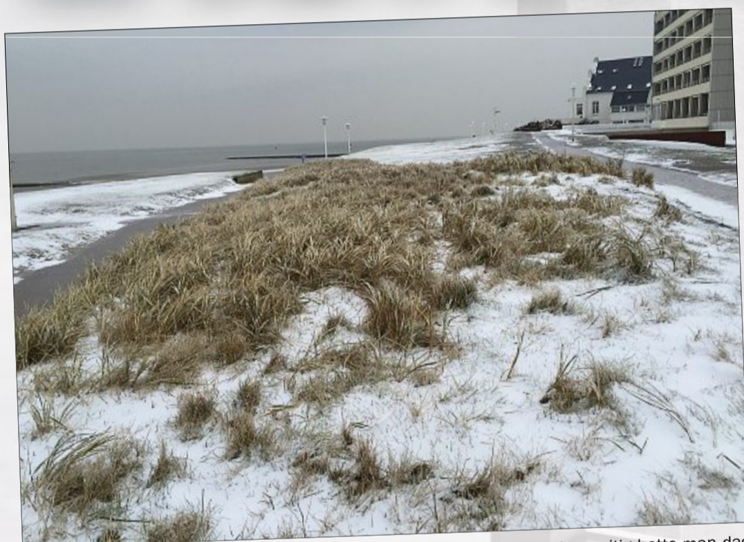
Auch wenn der Schnee nicht lange liegen geblieben ist – wenigstens kurzzeitig hatte man das Gefühl von „richtigem Winter“ auf der Insel.