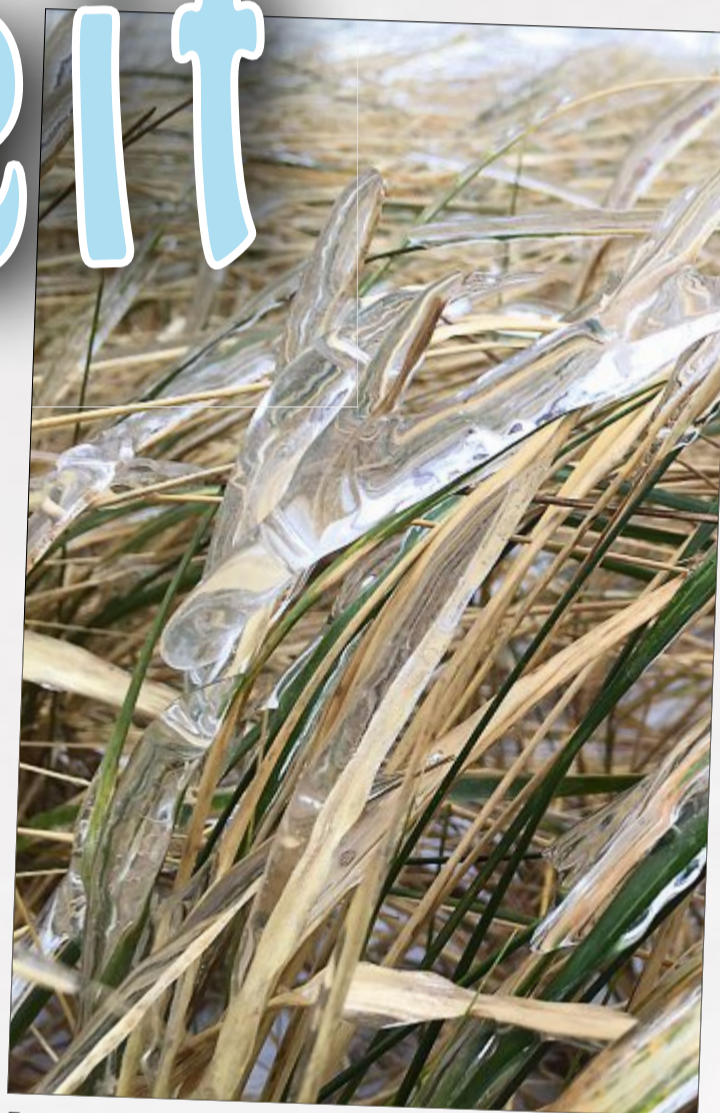
Frostiger Glanz: Dicke Eisschichten umhüllen jedes Blatt, jeden Strauch und jeden Grashalm.