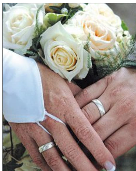
Für viele ein (wahr werdender) Traum: Heiraten auf Norderney.

Warum ist Norderney für Hochzeiten überhaupt so beliebt? „Viele sind als Kind schon hier im Urlaub gewesen“, weiß Mai aus den Gesprächen mit den Verlobten. „Sie verbinden mit der Insel nur Schönes wie Strand und gutes Wetter und wollen diesen Tag deshalb gern hier verbringen.“ Ein Teil der Hochzeitspaare hätte sich auch auf Norderney kennengelernt. Und manch einer würde eben auch keine große Feier wollen und sich auf der Insel etwas von der Familie abseilen.