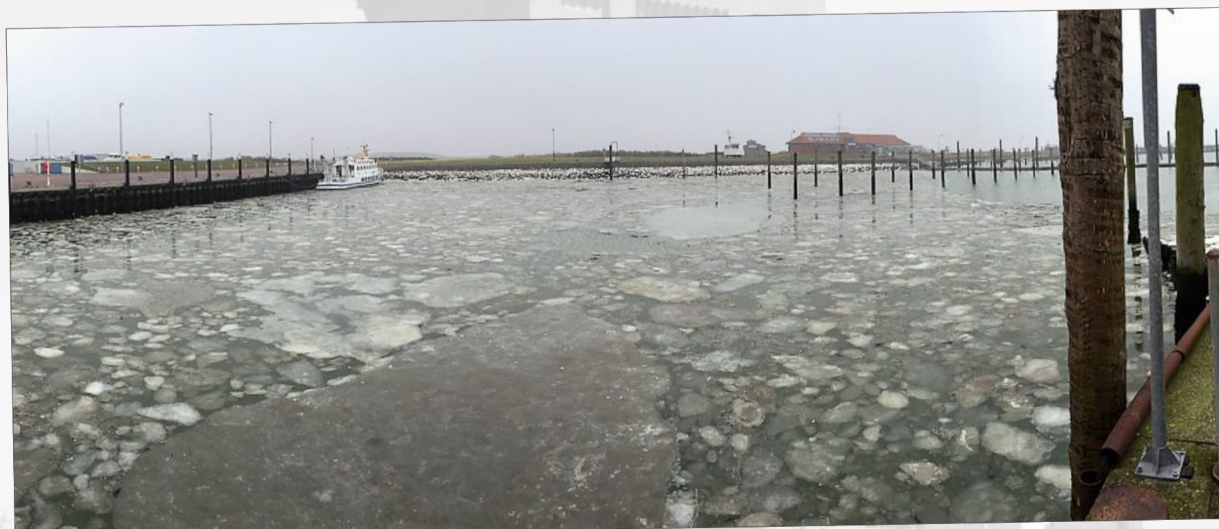
Eis im Hafen – in den letzten Jahren ein eher selten gewordener Anblick.