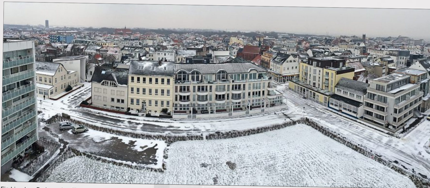
Ein bisschen Puderzucker für Norderney – zumindest kurzzeitig eine kleine weiße Pracht.