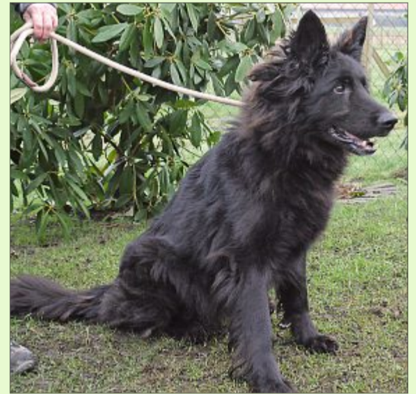
Hündin Blacky ist noch ganz neu im Tierheim.

Wer sich für Blacky interessiert, kann sich unter Telefon 04938/425 beim Hager Tierheim melden. Das Telefon ist montags bis freitags von 9 bis 12 Uhr und täglich von 13.30 bis 17 Uhr besetzt. Die Öffnungszeiten sind: täglich von 13.30 bis 16 Uhr und nach Vereinbarung – ausgenommen dienstags, mittwochs und an Feiertagen. Weitere Infos finden sich im Internet auf der Seite www.tierheim-hage.de .