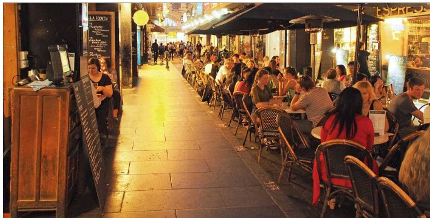
An gemütlichen Cafés mangelt es in Melbourne nicht.

Zwar gab es dann doch einige Einladungen zu Bewerbungsgesprächen, die verliefen jedoch im Sande. Im Nachhinein sind wir aber glücklich, dass wir auch diese negativen Erfahrungen gemacht haben. Am Ende ging es jobtechnisch nach drei Wochen Flaute doch wieder bergauf für uns, und zwar in einem kleinen Ort am Strand eine Stunde südlich von Sydney, in Cronulla Beach. Vermittelt durch unsere Organisation checkten wir in einem