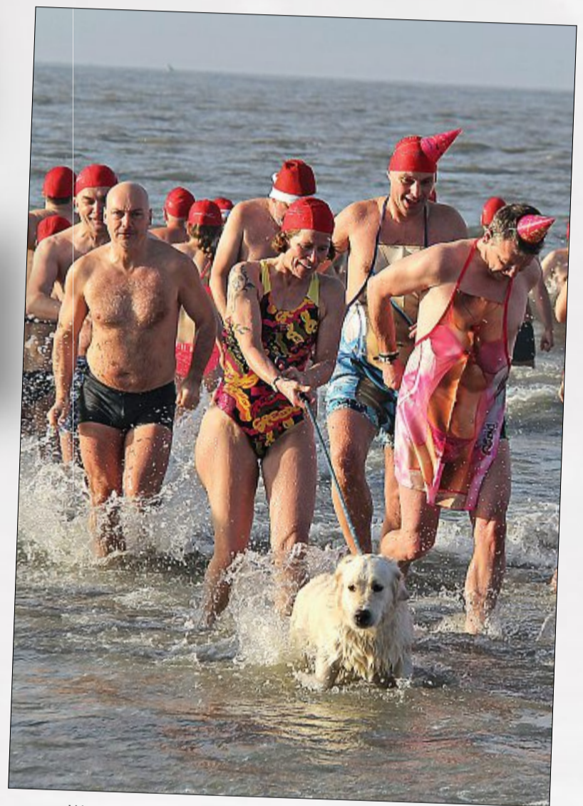
Wer die Grenzerfahrung gemeistert hat, fühlt sich berauscht.