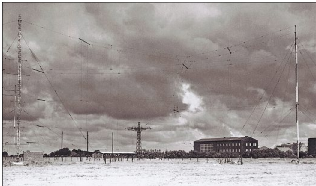
Der Rundfunksender Osterloog in den Jahren nach dem Zweiten Weltkrieg (um 1950).

Eingesetzt wird die Mittelwelle heute überwiegend noch in großflächigen Ländern mit dünner Besiedlung oder ungünstigen geografischen Bedingungen (Gebirge), wo ein flächendeckendes UKW-Netz zu aufwendig ist und in den USA, wo es für Sendeformate, bei denen es nicht auf HiFi-Qualität ankommt (Talkshows, Nachrichten und so weiter), weiterhin gern benutzt wird. Im dicht besiedelten Europa wird die Mittelwelle aber wohl irgendwann ganz Geschichte sein.