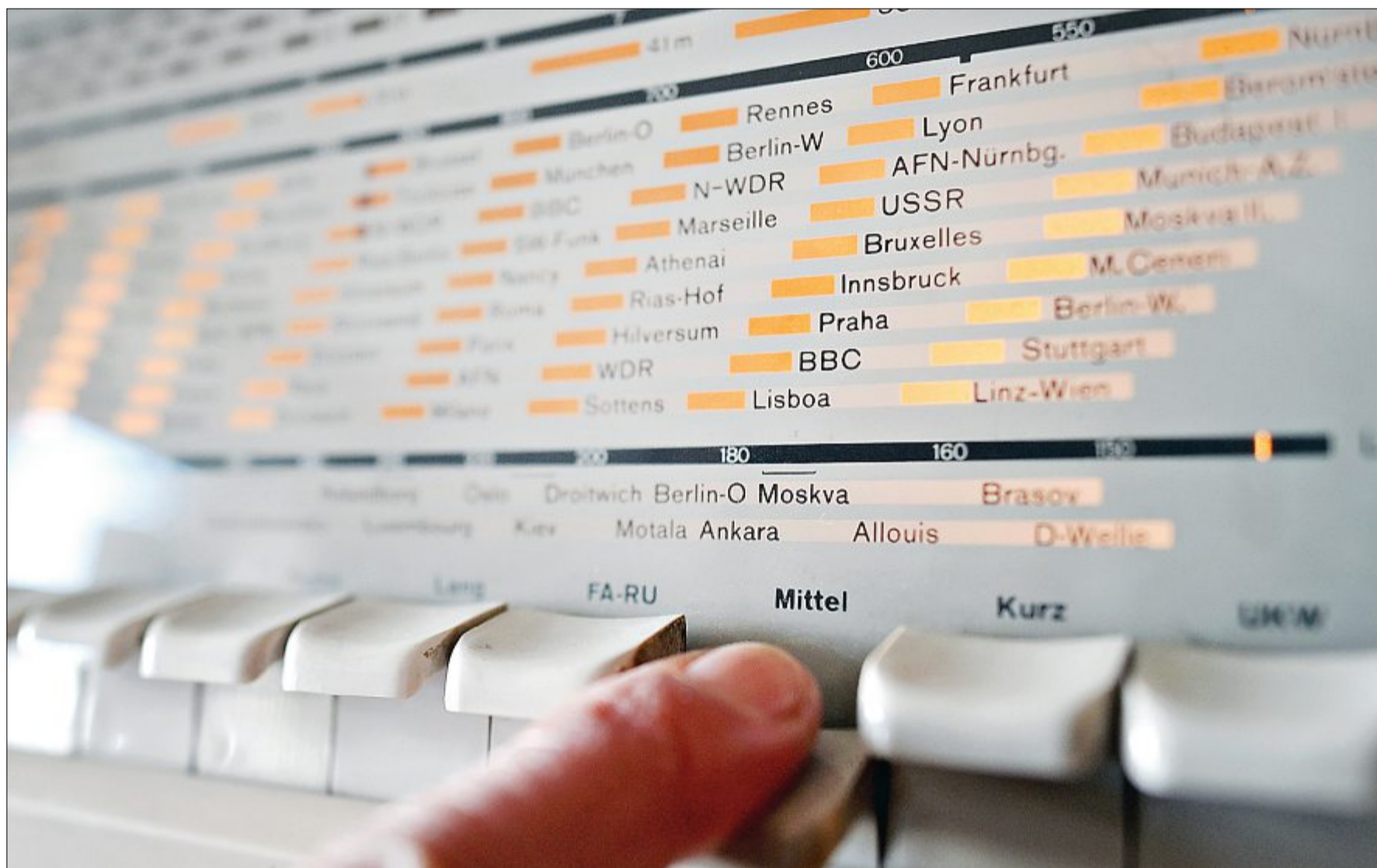
Am 31. Dezember hat sich mit dem Deutschlandfunk das letzte deutsche öffentlich-rechtliche Radio aus der Mittelwelle (MW) zurückgezogen.

Anderer Länder wie Österreich oder die Schweiz haben