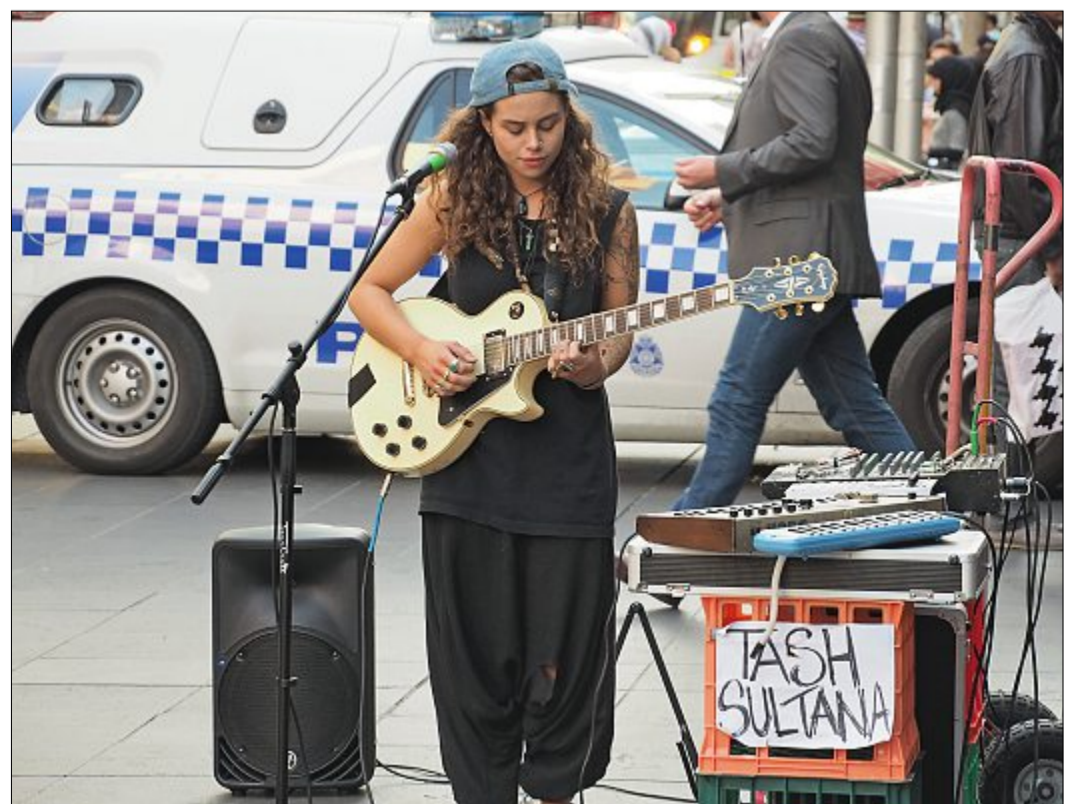
Das Leben in Freiheit: Eine Straßenmusikerin gibt in Melbourne eine Kostprobe ihres Könnens.