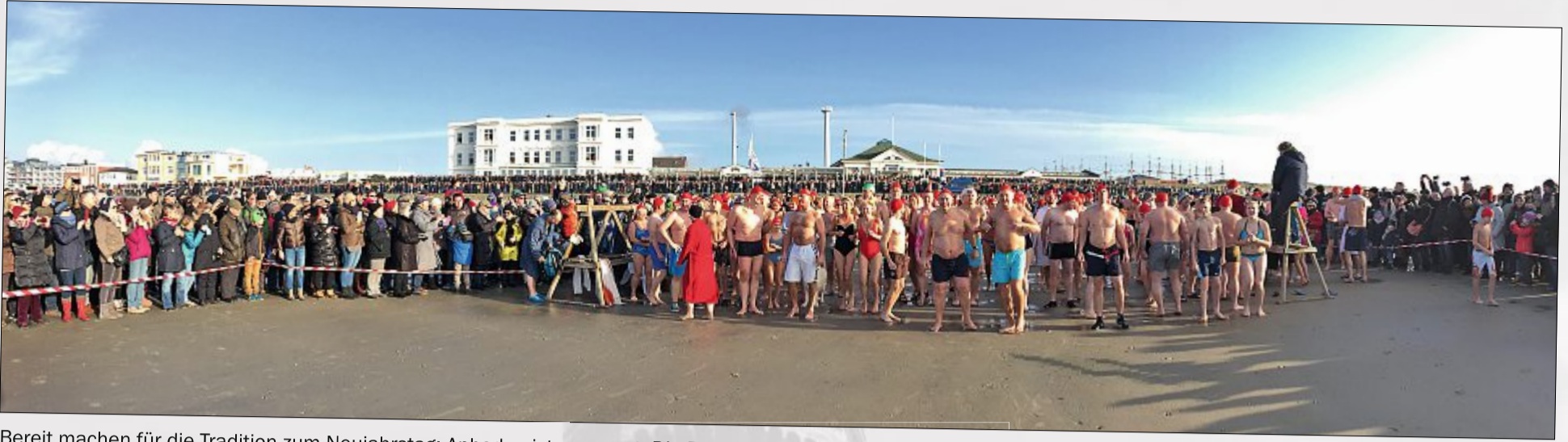
Bereit machen für die Tradition zum Neujahrstag: Anbaden ist angesagt. Die DLRG sorgt für die Sicherheit der Schwimmer.