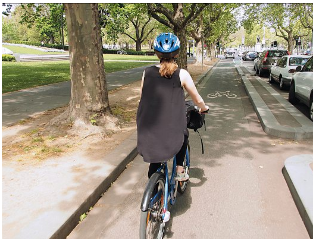
Für einige Dollar konnten die beiden ostfriesischen Mädchen den ganzen Tag mit dem Fahrrad unterwegs sein.

Mein nächster Artikel wird sich dann endlich nicht mehr nur mit der Arbeitswelt Australiens befassen, sondern mit dem schöneren und spannenderen Teil unserer Zeit hier, dem Reisen und Entdecken.