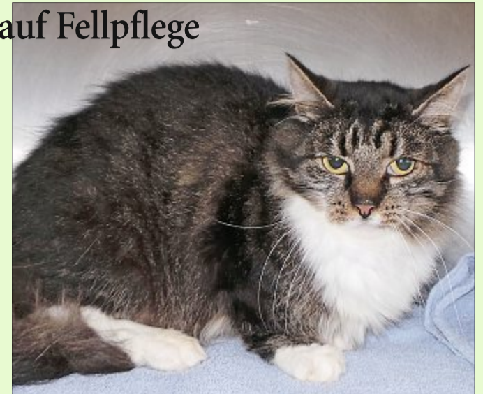
Musch Musch ist lieb und wird gern gebürstet.

Wer sich für Musch Musch interessiert, kann sich unter Telefon 04938/425 beim Hager Tierheim melden. Das Telefon ist montags bis freitags von 9 bis 12 Uhr und täglich von 13.30 bis 17 Uhr besetzt. Die Öffnungszeiten sind: täglich von 13.30 bis 16 Uhr und nach Vereinbarung – ausgenommen dienstags, mittwochs und an Feiertagen. Weitere Infos finden sich im Internet auf der Seite www.tierheim-hage.de .