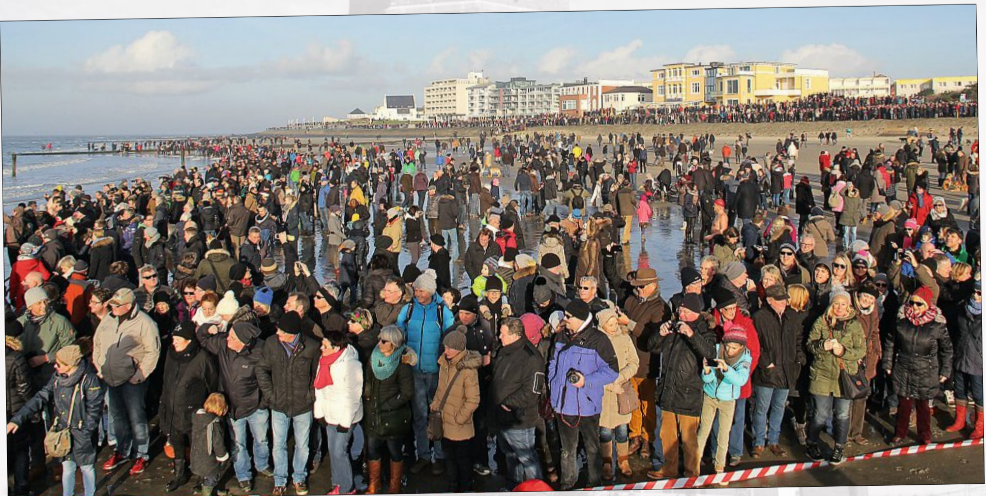
Dabei sein ist alles – wenn die allermeisten Strandbesucher die Kleidung auch lieber an lassen...