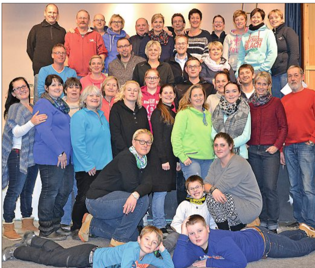
Trotz Zeitdruck noch bei bester Laune: Die Förderkreis-Familie lädt am 16. Januar zum traditionellen Winterfest in die KGS-Aula ein.

An der guten Laune jedenfalls ändert der zeitliche