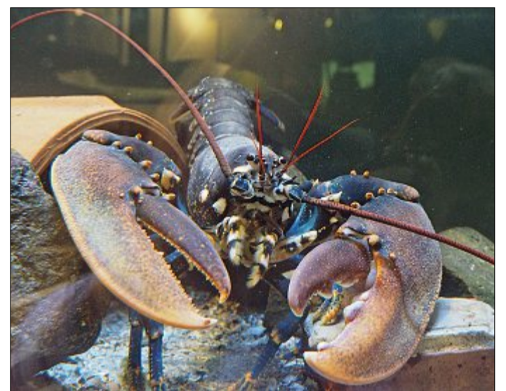
Der Europäische Hummer hat zwei verschieden ausgebildete Scheren: eine zum Knacken und eine zum Greifen. Waldemar kann im Nationalpark-Haus live beobachtet werden.