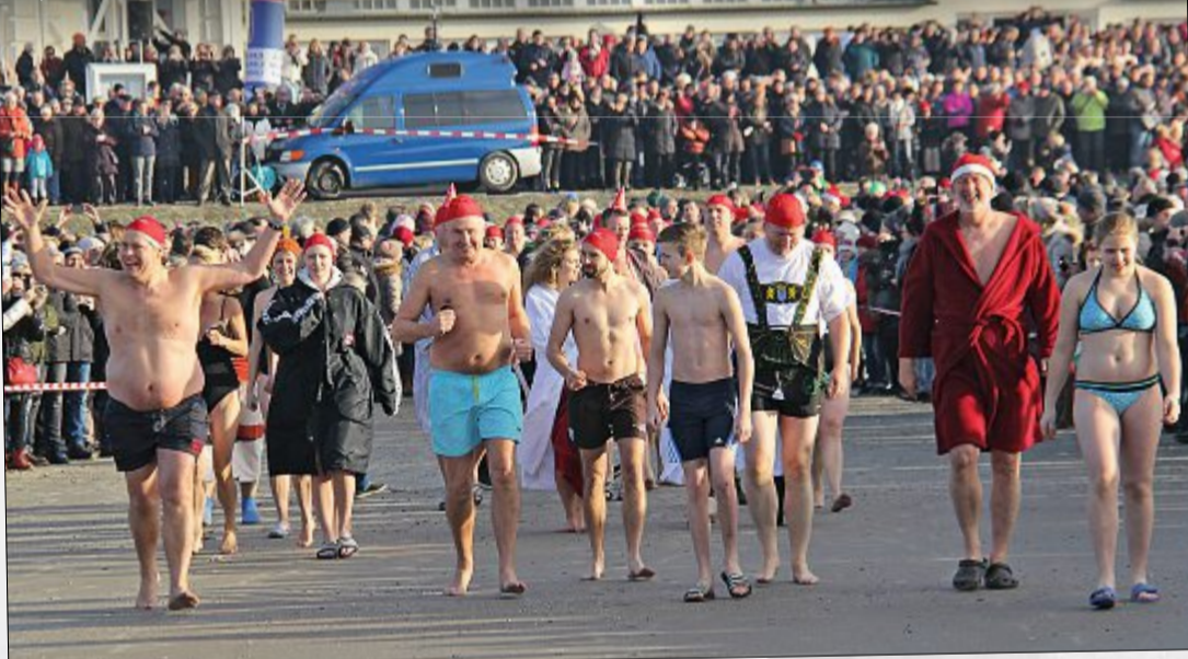
Insgesamt stürzen sich mehrere Hundert Mutige in die kalte Nordsee.