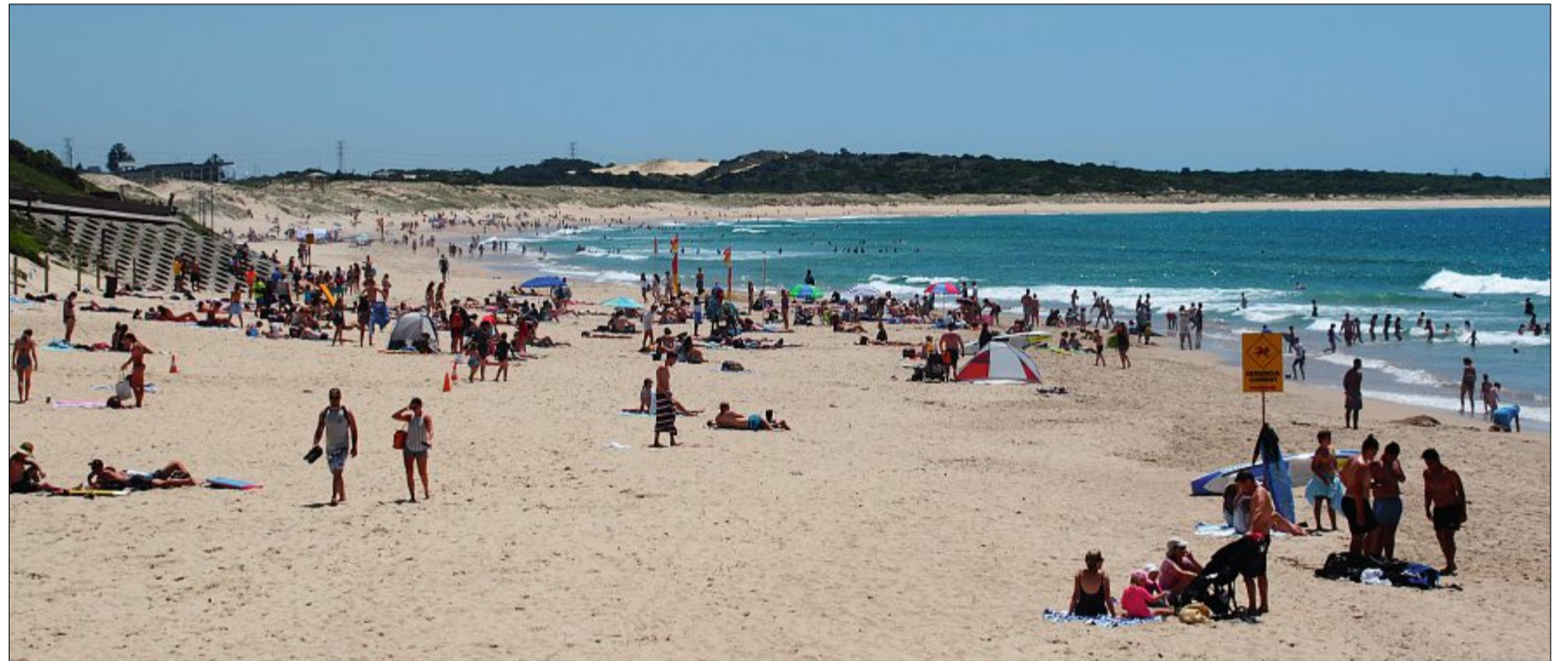
Nichts als Sand und Meer: Australien zählt mehr als 10000 Strände. Viele sind menschenleer, andere gut besucht.

Nachdem wir alles gesehen hatten, was unserem Reiseführer nach als sehenswert galt, nahmen wir den Zug zurück nach Sydney, um uns erneut auf die Jobsuche zu machen. Diese sah am Anfang leider alles andere als rosig aus und so verschickten wir zahlreiche Bewerbungen per Mail oder drückten Mitarbeitern der umliegenden Geschäfte Ausgaben in die Hand - trotzdem blieb die Anzahl der Rückmeldungen auf der Nulllinie.