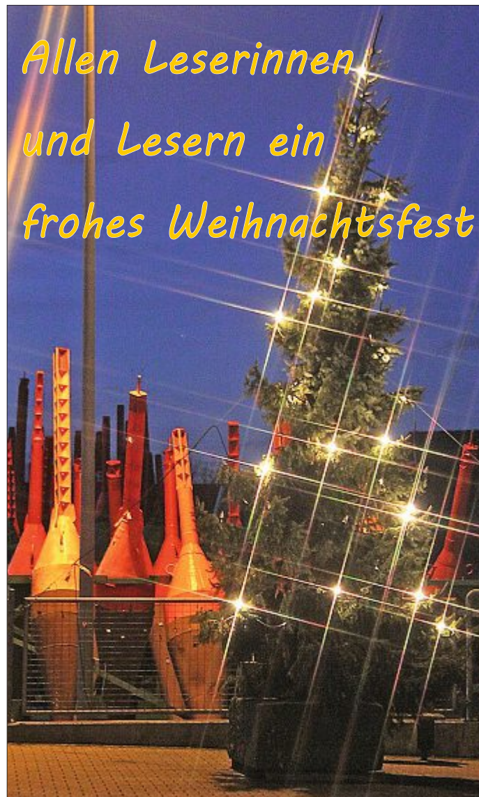
Geschmückter Tannenbaum am Tonnenhof.

So entsteht ein komplexes, polyrhythmischer Klanggebilde, das sich für europäische Ohren zuerst wie ein heilloses Durcheinander anhört, später aber fasziniert und den Hörer in seinen Bann zieht. Für die Show am 30. Dezember werden jedenfalls „heiße Rhythmen, mitreißende Tänze, exotische Schönheiten und traumhafte Melodien“ versprochen, die das Publikum durch das aufregende Nachtleben Kubas entführen. Der Eintritt kostet 27 bis 32 Euro.