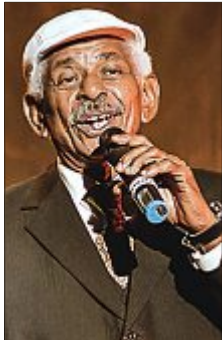
Die Show kommt auch zur Insel.

Rhythmen, Tänze und Gesang im Haus der Insel.