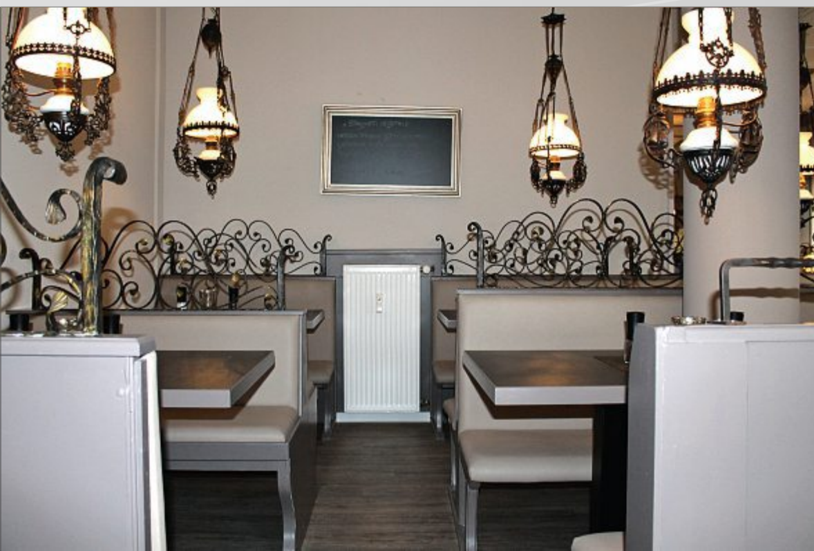
Die Stühle in der linken Ecke mussten weichen – Gäste bevorzugen Bänke. Lampen und Raumtrenner sind geblieben und fügen sich harmonisch in den neuen Stil ein.