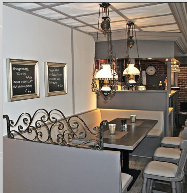
Das gemütliche Gefühl bleibt auch nach der Renovierung. Bei der Umgestaltung wurden die Wünsche von Stammgästen ebenfalls bedacht.

HERRENPFAD 1 | NORDERNEY | TEL.: 04932/3714