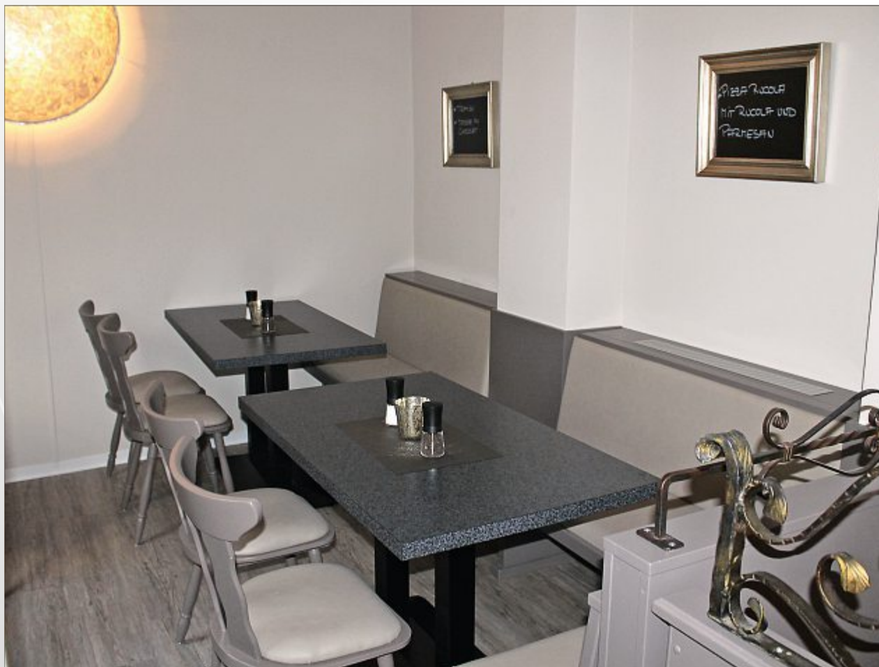
Stühle raus, Bänke rein: Auch im Nebenraum können sich Restaurantbesucher in Zukunft über die Neugestaltung und das Sitzen auf weichen Bänken freuen.