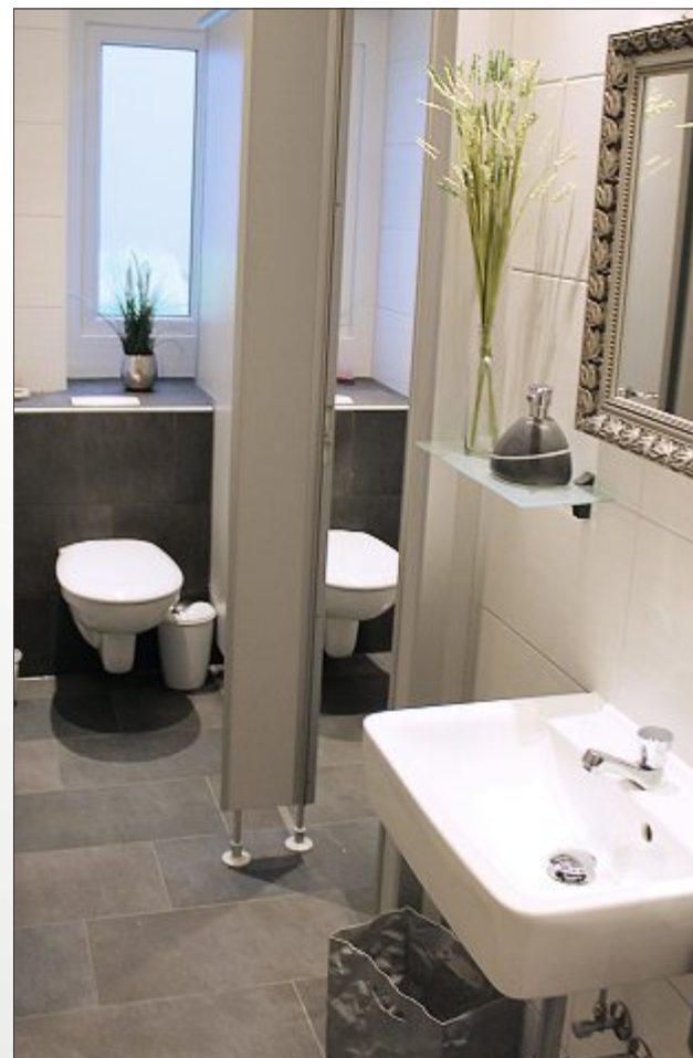
Komplett renoviert sind nun auch die Toiletten sowohl bei den Damen als auch bei den Herren besser eingeteilt.