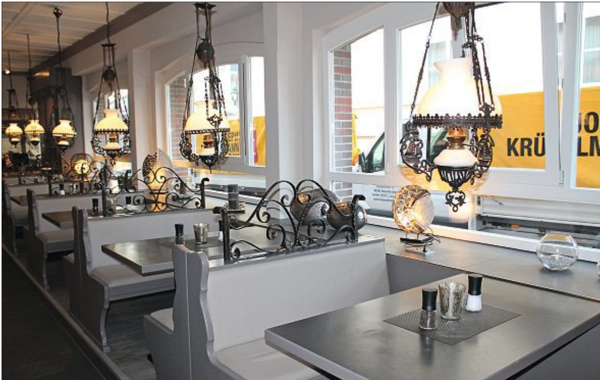
Die Einteilung ist geblieben, fortan aber sitzen die Gäste auf weichem, hellen Leder. Auch die Fenster und Fensterbänke wurden erneuert.