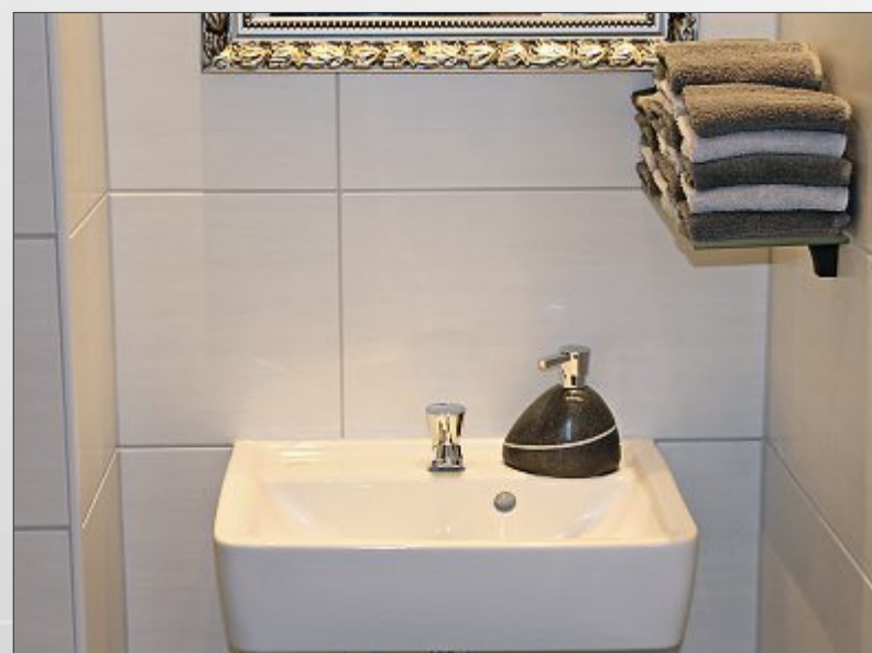
Nicht nur großer Umbau, auch auf kleine Details wurde geachtet: Statt Papiertüchern gibt es in den Badezimmern nun richtige Handtücher.