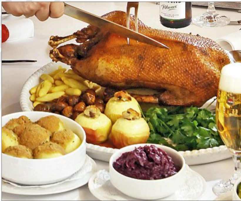
In vielen Familien kommt zu Weihnachten Gans auf den Tisch.