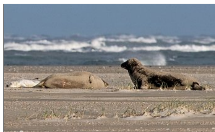
Eine Kegelrobben-Familie am Strand.

Seehunde werden im Sommer auf Sandbänken geboren und folgen der Mutter mit der ersten Flut nach der Geburt ins Wasser. Kegelrob-