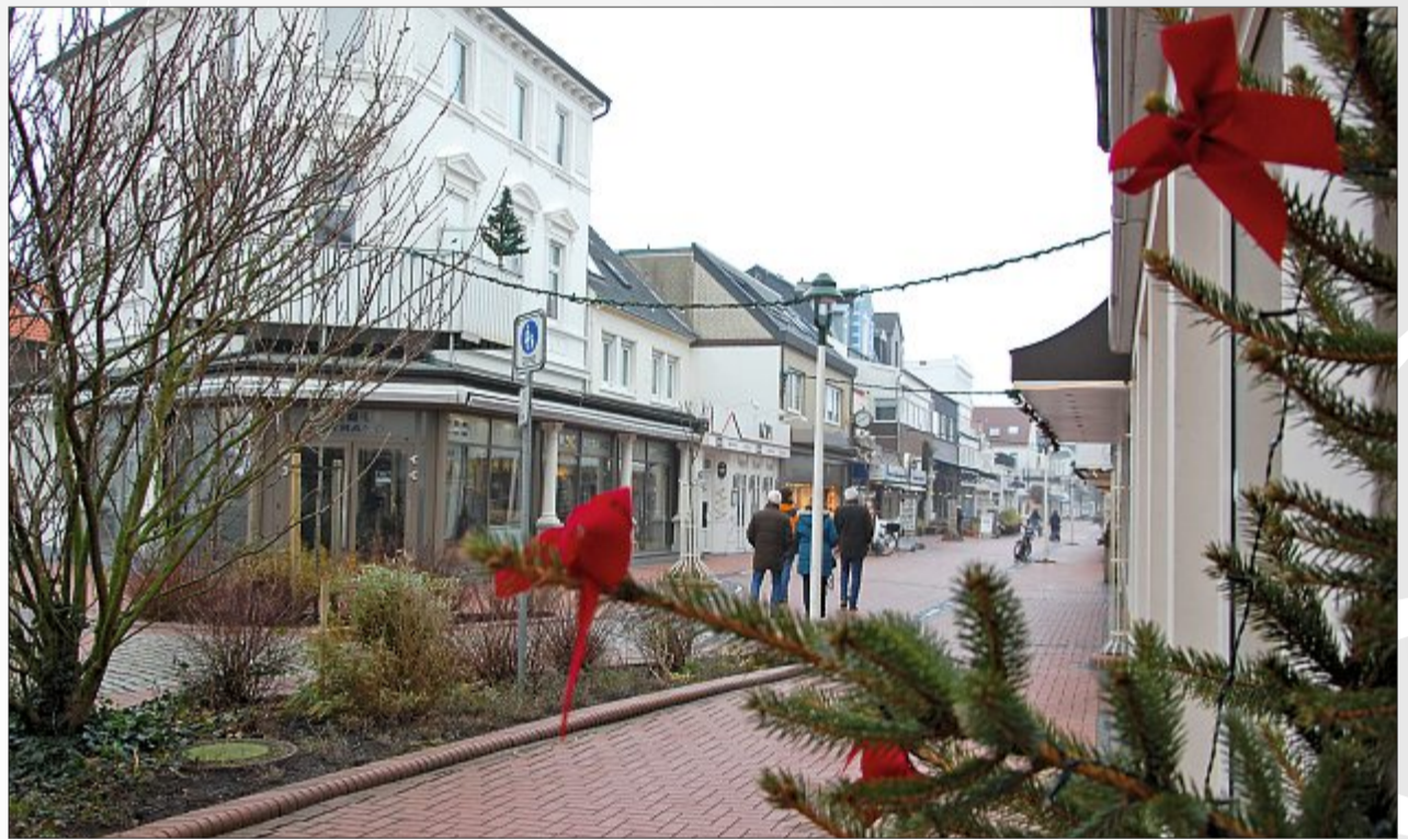
Entspannter Einkaufsbummel in der Friedrichstraße. Auch hier haben die Gewerbetreibenden mit Tannengrün, Weihnachtsschmuck und Lichterketten ein wohliges Flair gezaubert.