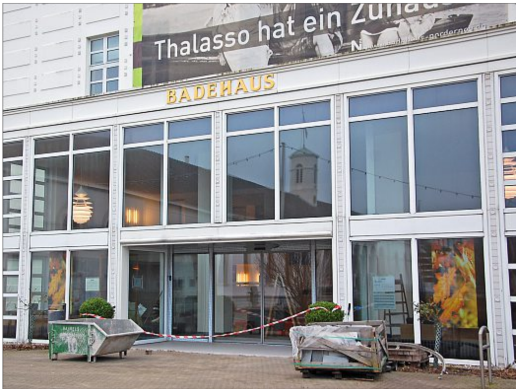
Die alljährlichen Revisionsarbeiten im Badehaus sind nun fast abgeschlossen. Ab dem morgigen Sonnabend wird sich die frisch eingebaute Eingangstür dann wieder täglich für die Besucher öffnen.

Alles in allem zeigt sich der Einrichtungsleiter sehr zufrieden mit dem Jahr 2015, in dem das Badehaus zudem seinen zehnten Geburtstag feiert. Die Nachfrage sei nach wie vor steigend, sowohl im Familienbad als auch im Spabereich, wie Rass erklärt. Daher investiere man auch immer wieder gern neu in dieses Standbein des Staatsbades, um den Gästen immer beste Qualität zu bieten. So seien auch die Umbaumaßnahmen