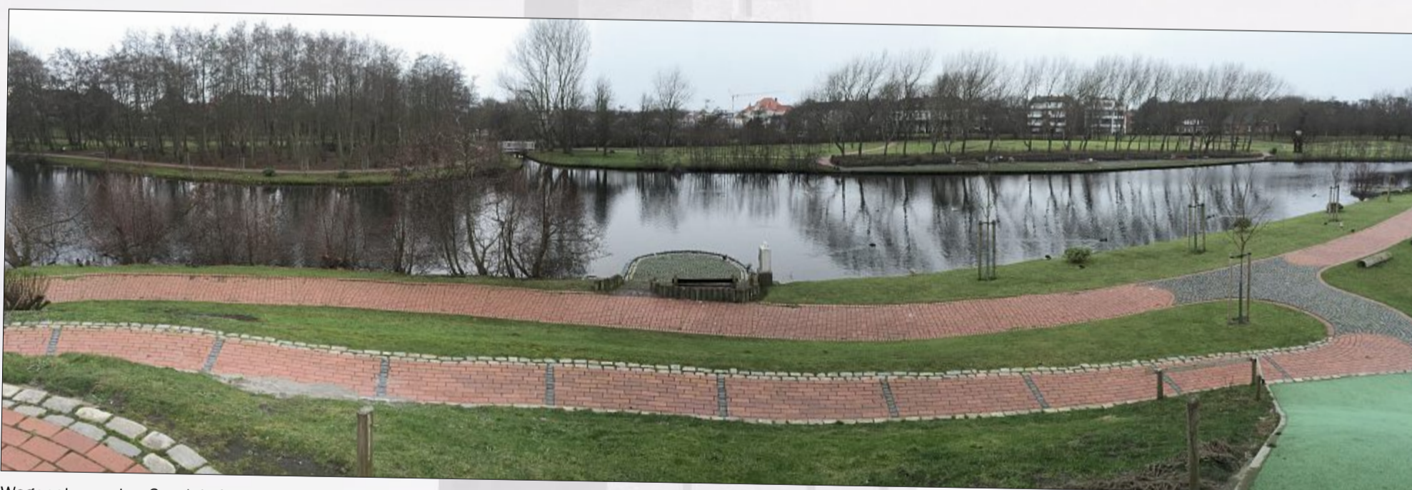
Wegenetz um den Gondelteich.