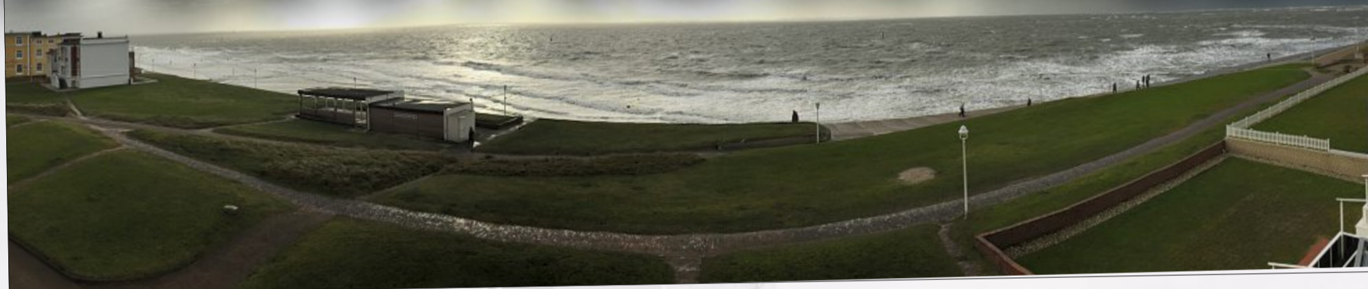
Wellen am Weststrand.