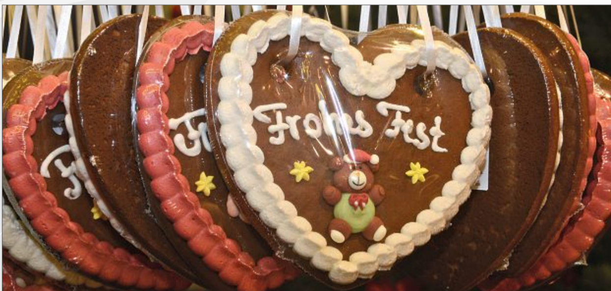
Leckereien gibt es zum Fest viele. Wer kann da schon widerstehen?