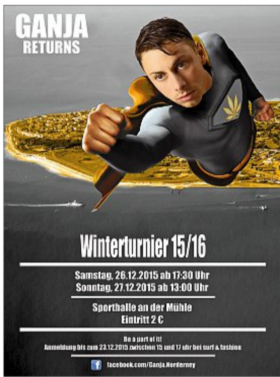
Volle Kraft voraus für das Winterturnier.

Die Vorbereitungen für die Veranstaltung sind beinahe abgeschlossen. Über 50 Sponsoren habe der Vorjahressieger für die Bannwerbung und die Tombola gewinnen können. Hauptpreis sind zwei VIP-Tickets für das Bundesligaspiel zwischen Borussia Dortmund und Bayern München. Insgesamt hat die Tombola einen Wert von 3000 Euro. „Wir danken den langjährigen Unterstützern und Förderern dieses Turniers ganz herzlich“, betonen die Organisatoren. Der Gewinn