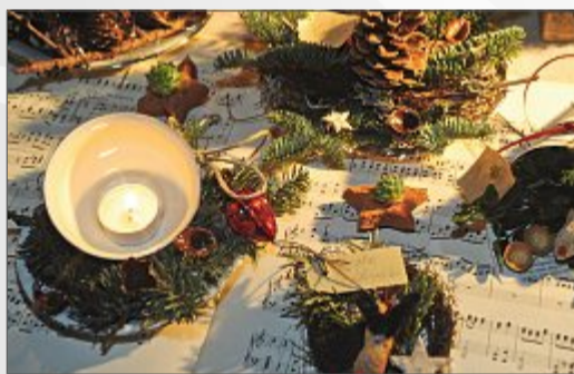
Eine hübsche Tischdeko bereichert das Mahl.

Natürlich ist schon die Vorweihnachtszeit heutzutage ein wahrer Speißbrutenlauf, wenn man sich Spekaltius, Punsch und Dominosteinen nicht einfach kampflos hingeben will. Die genussvolle Zeit lädt mit ihrem wohligen Flair aber auch einfach dazu ein. So lässt es sich kaum widerstehen, wenn man in geselliger Runde in der liebevoll dekorierten Stube sitzt und das Gebäck auf den Tisch kommt. Apropos Dekoration: Auch hier sind die Kaufleute natürlich die richtigen Ansprechpartner.