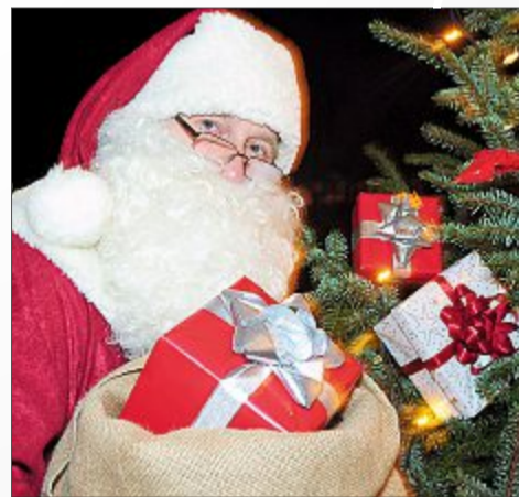
Endspurt beim Geschenkekauf. Ob der Weihnachtsmann schon alle hat?

Bei den Kaufleuten vor Ort wird man nicht nur gut beraten, sie helfen einem sicherlich auch gern beim Verpacken der Gaben.