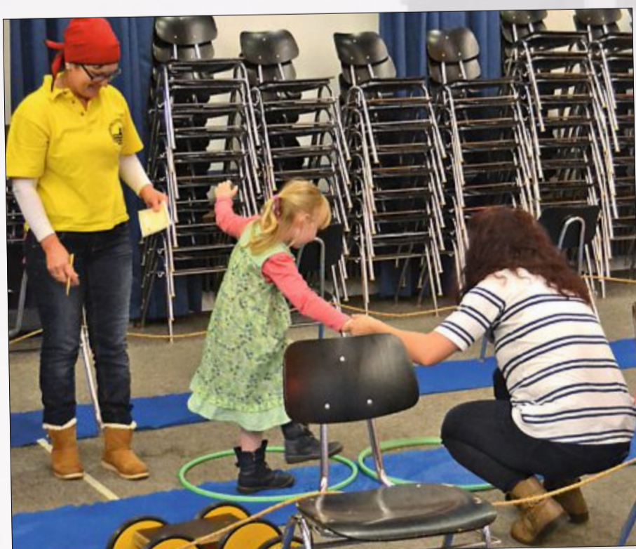
Gar nicht so einfach, auf der „Wasserstraße“ das Gleichgewicht zu halten.