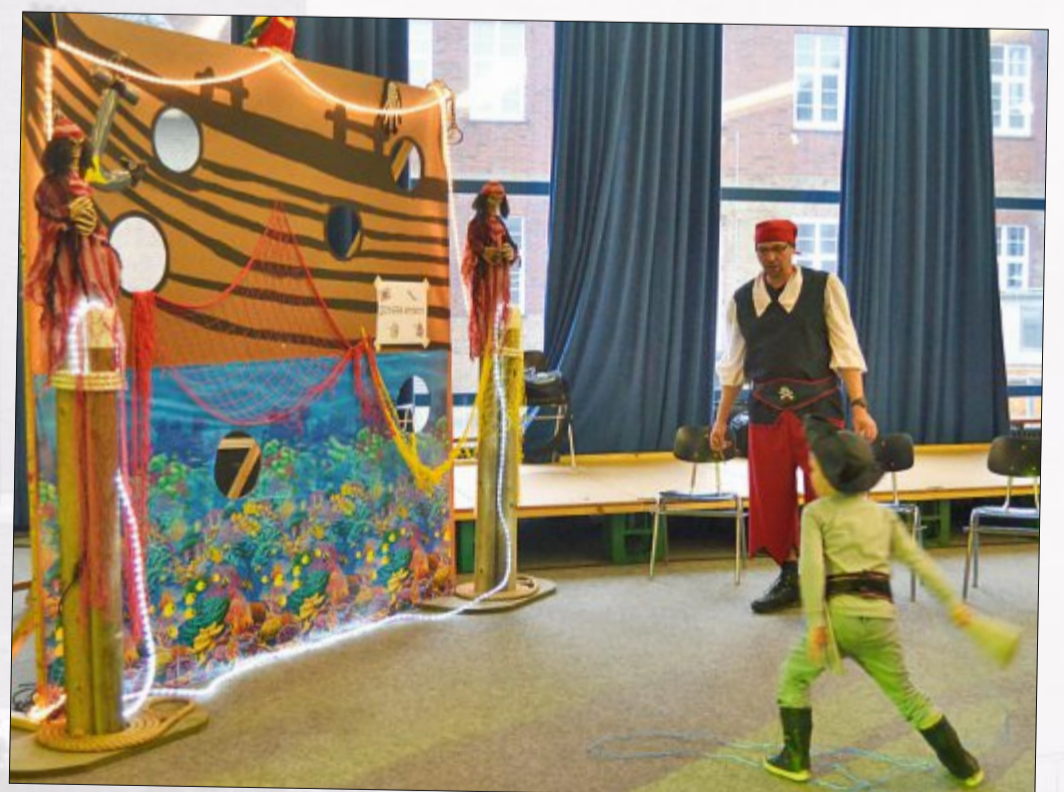
Wirft man durch die Löcher, hat man das Schiff geentert.