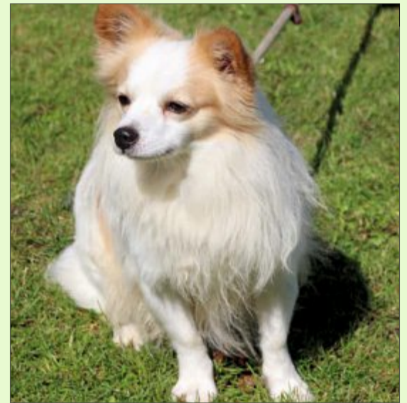
Spitz Uwe mag Bewegung.

Wer sich für den pfiffigen kleinen Rüden Uwe interessiert, kann sich unter Telefon 04938/425 beim Hager Tierheim melden. Das Telefon ist montags bis freitags von 9 bis 12 Uhr und täglich von 14.30 bis 17 Uhr besetzt. Die Öffnungszeiten sind: täglich von 14.30 bis 17 Uhr und nach Vereinbarung – ausgenommen dienstags, mittwochs und an Feiertagen. Weitere Infos finden sich im Internet auf der Seite www.tierheim-hage.de.