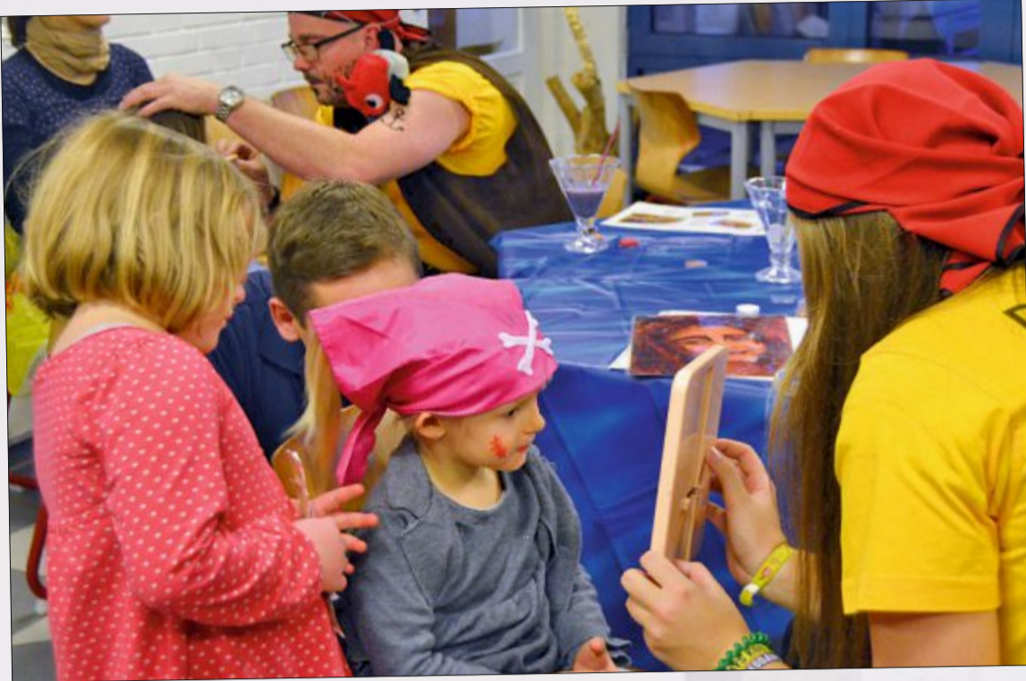
Beim Schminken wird so manch einer vom Kind zum waschechten Seeräuber.