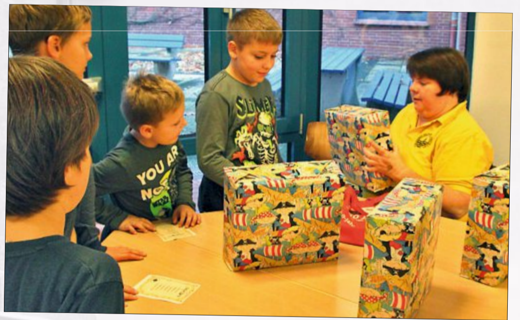
Verschiedene Spiele wie hier die „Fühlkästen“ stehen auf dem Programm.