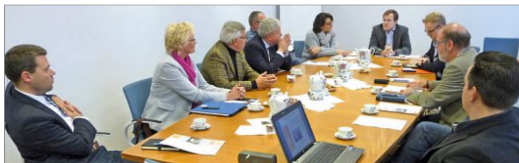
Erster offener Austausch zur Förderung der Inseljugend beim Übergang Schule-Beruf.

Man kam überein, nun zunächst die Meinung der örtlichen Betriebe einzuholen. An einer entsprechenden Infoveranstaltung sollen sowohl Vertreter der Schule als auch vom Verein Eibo als Gäste teilnehmen.