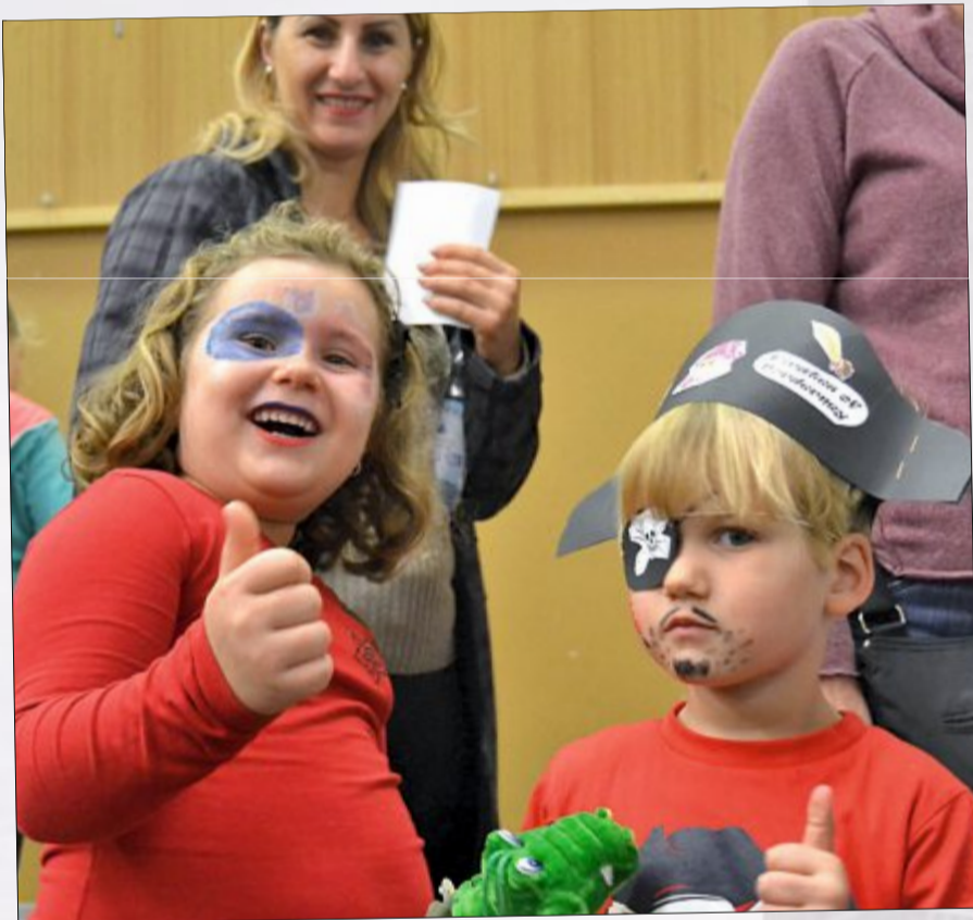
Daumen hoch für das Herbstfest des Förderkreises.