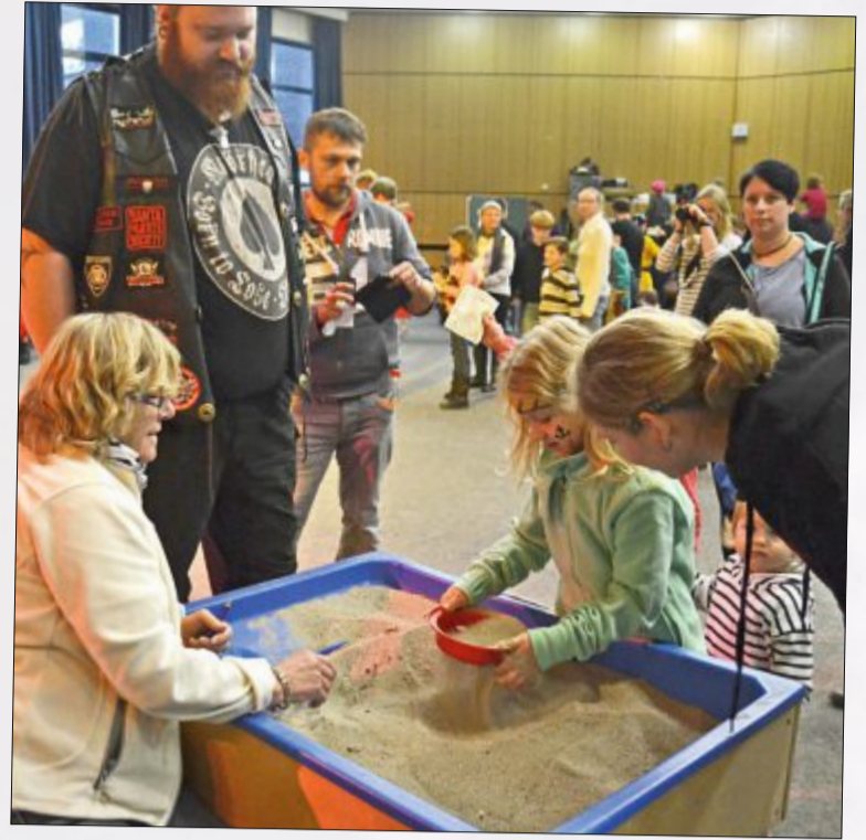
Im Sand verstecken sich einige Schätze.