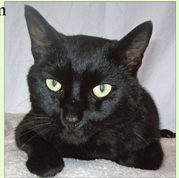
Baghira kuschelt gern und möchte Freigang haben.

Wer sich für Baghira interessiert, kann sich unter Telefon 04938/425 beim Hager Tierheim melden. Das Telefon ist montags bis freitags von 9 bis 12 Uhr und täglich von 14.30 bis 17 Uhr besetzt. Die Öffnungszeiten sind: täglich von 14.30 bis 17 Uhr und nach Vereinbarung – ausgenommen dienstags, mittwochs und an Feiertagen. Weitere Infos finden sich im Internet auf der Seite www.tierheim-hage.de .