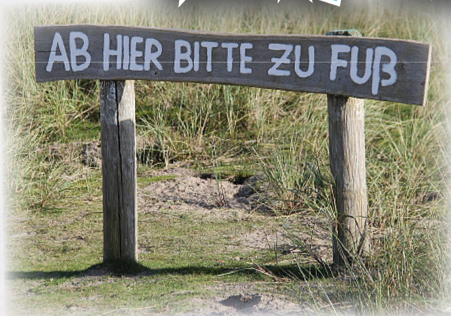
Der letzte Parkplatz. Autos und Räder gehören hier abgestellt.