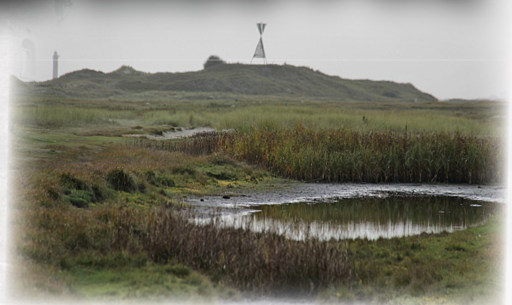
Postbake und saftiges Grün im Inselosten.