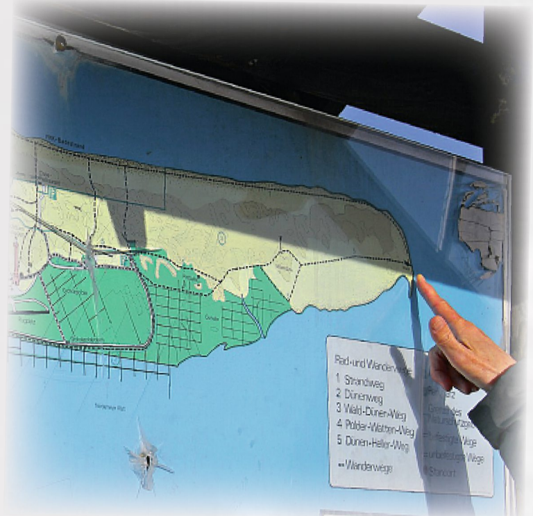
Der Weg zum Wrack ist weit.