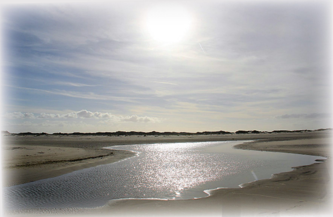
Glitzersonne am Strand.