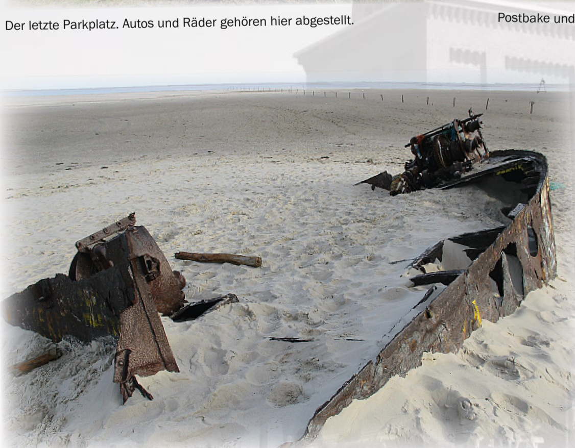
Das Ziel des Weges: das Wrack. Mit Blick auf die Nachbarinsel Baltrum.