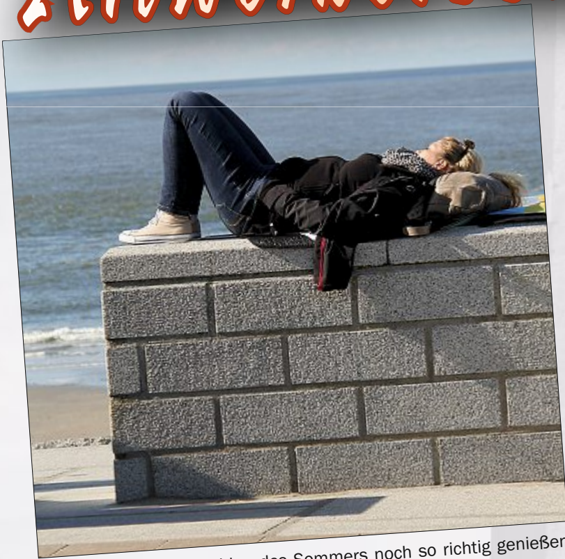
Die letzten Sonnenstrahlen des Sommers noch so richtig genießen – wie und wo man kann.