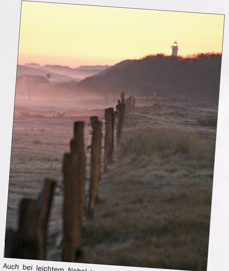
Auch bei leichtem Nebel immer zu sehen: der Norderneyer Leuchtturm bei Sonnenaufgang.