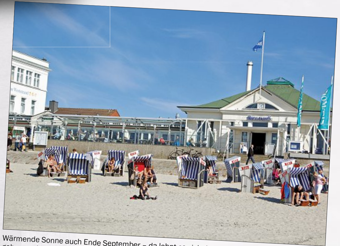
Wärmende Sonne auch Ende September – da lohnt es sich doch, noch einmal an den Strand zu gehen und dem Alltag zu entfliehen.