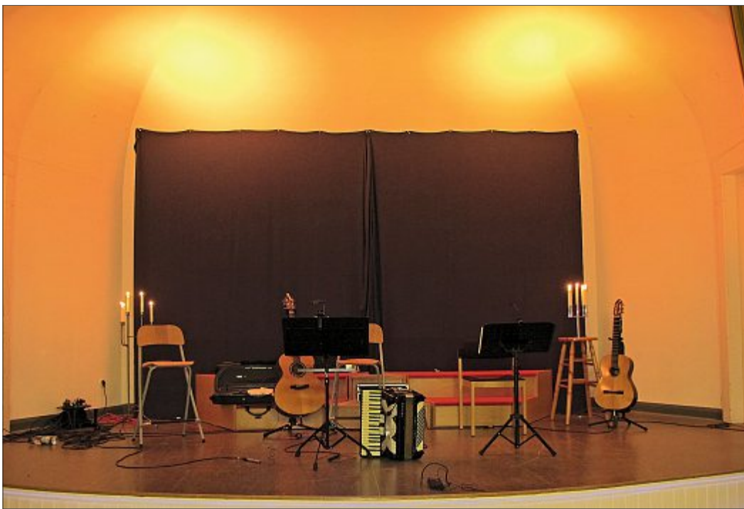
Egal, ob allein oder in einer Gruppe, ob nur ein Lied oder ein ganzes Set: Am 14. November ist die Bühne im Gemeindehaus wieder für jeden geöffnet, der einmal auf einer Bühne stehen möchte. Anmelden kann man sich noch bis zum 20. Oktober bei Sibylle Wessels.

Bevor das LLL-Team aber die Bühne für die (noch) unentdeckten Talente öffnet, steht bereits im Okto-