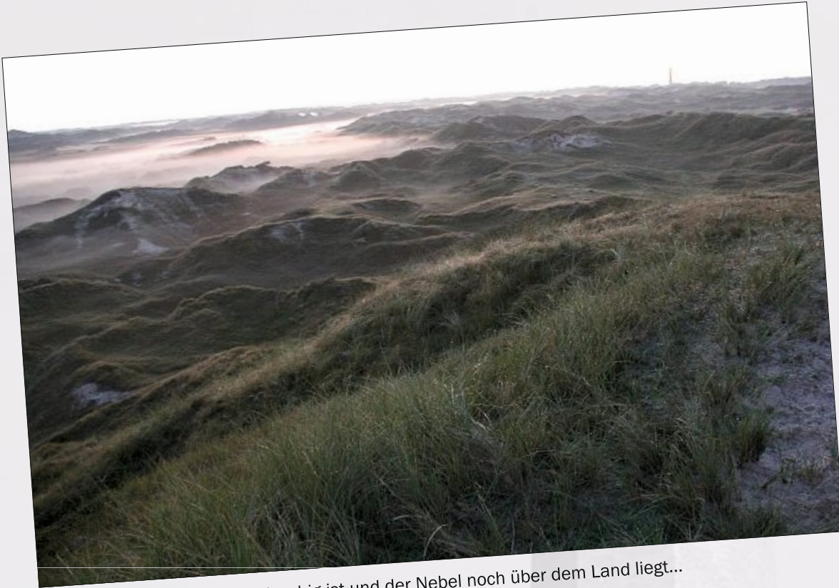
Morgens, wenn die Insel noch ruhig ist und der Nebel noch über dem Land liegt...