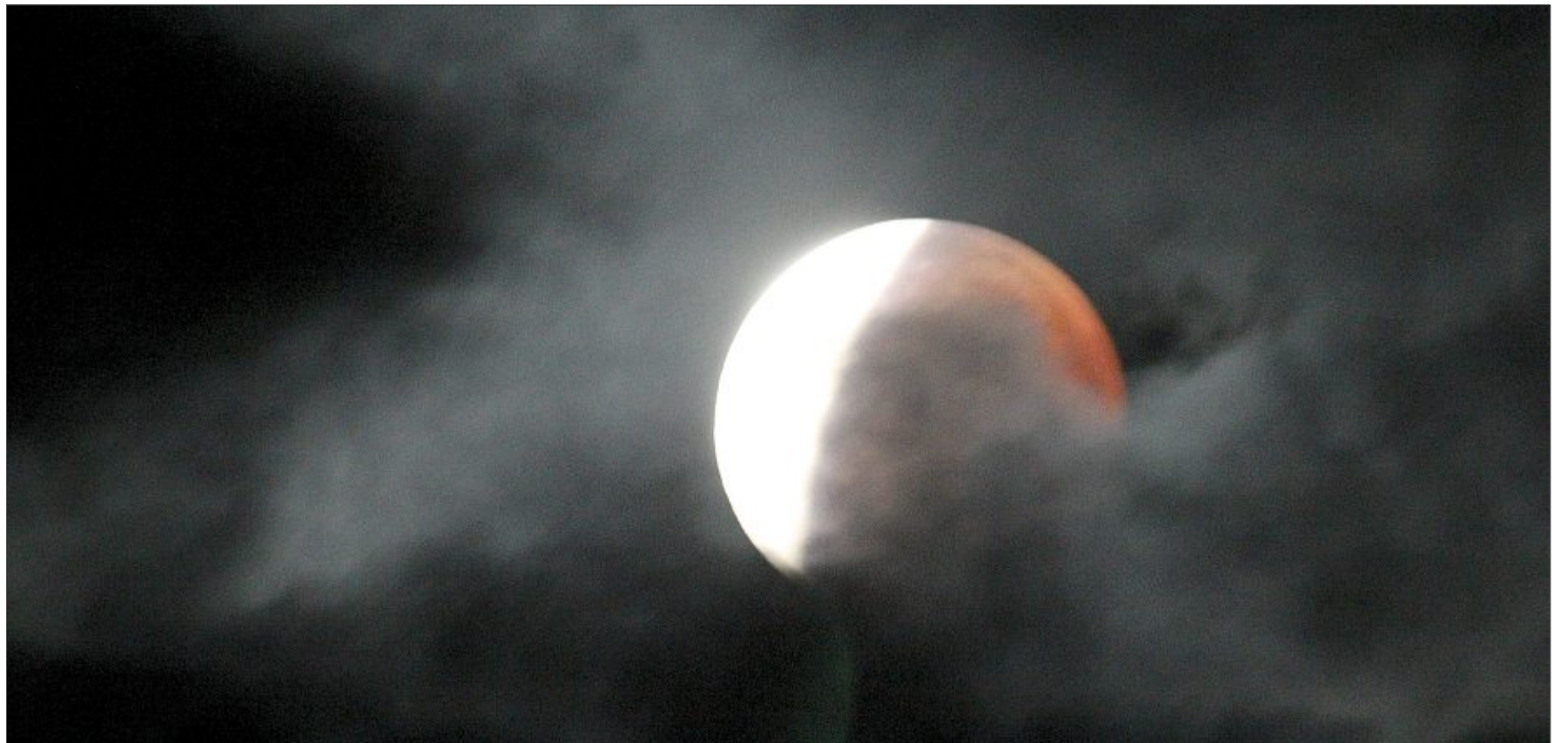
Bis 5.15 Uhr musste der Fotograf dieses Bildes ausharren, erst dann brach die Wolkendecke über Norderney auf und gab die Sicht frei auf das Spektakel des Blutmondes und der totalen Mondfinsternis. Bei der totalen Mondfinsternis liegt der Erdtrabant völlig im Schatten unseres Heimatplaneten.

Schon um 3.07 Uhr ist der Mond in den Kernschatten der Erde eingetreten. Der Erdtrabant zeigte sich auch als Super-Mond, da er besonders nahe war und entsprechend groß wirkte. „Besonders nah“ heißt: 356.880 Kilometer. Außerdem präsentierte er sich als „Blutmond“: Der rote Schimmer rührt von langwelligem Licht, das von der Erdatmosphäre in den Schattenkegel gestreut wird. Über Norderney war das Spektakel allerdings weniger „blutig“ als am klaren Festlandshimmel weiter südlich.