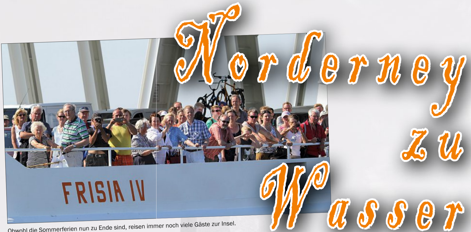
Obwohl die Sommerferien nun zu Ende sind, reisen immer noch viele Gäste zur Insel.