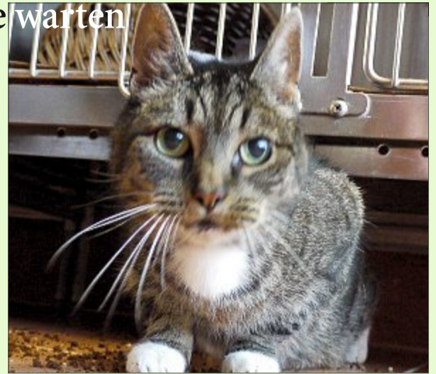
Kater Tattoo ist lieb und zutraulich, er mag nur nicht auf den Arm genommen werden.

Wer sich für Tattoo interessiert, kann sich unter Telefon 04938/425 beim Hager Tierheim melden. Das Telefon ist montags bis freitags von 9 bis 12 Uhr und täglich von 14.30 bis 17 Uhr besetzt. Die Öffnungszeiten sind: täglich von 14.30 bis 17 Uhr und nach Vereinbarung – ausgenommen dienstags, mittwochs und an Feiertagen. Weitere Infos finden sich im Internet auf www.tierheim-hage.de .