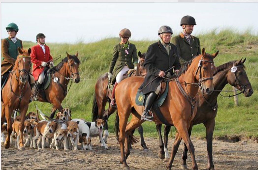
Die Jagdreiter und ihre Meute.