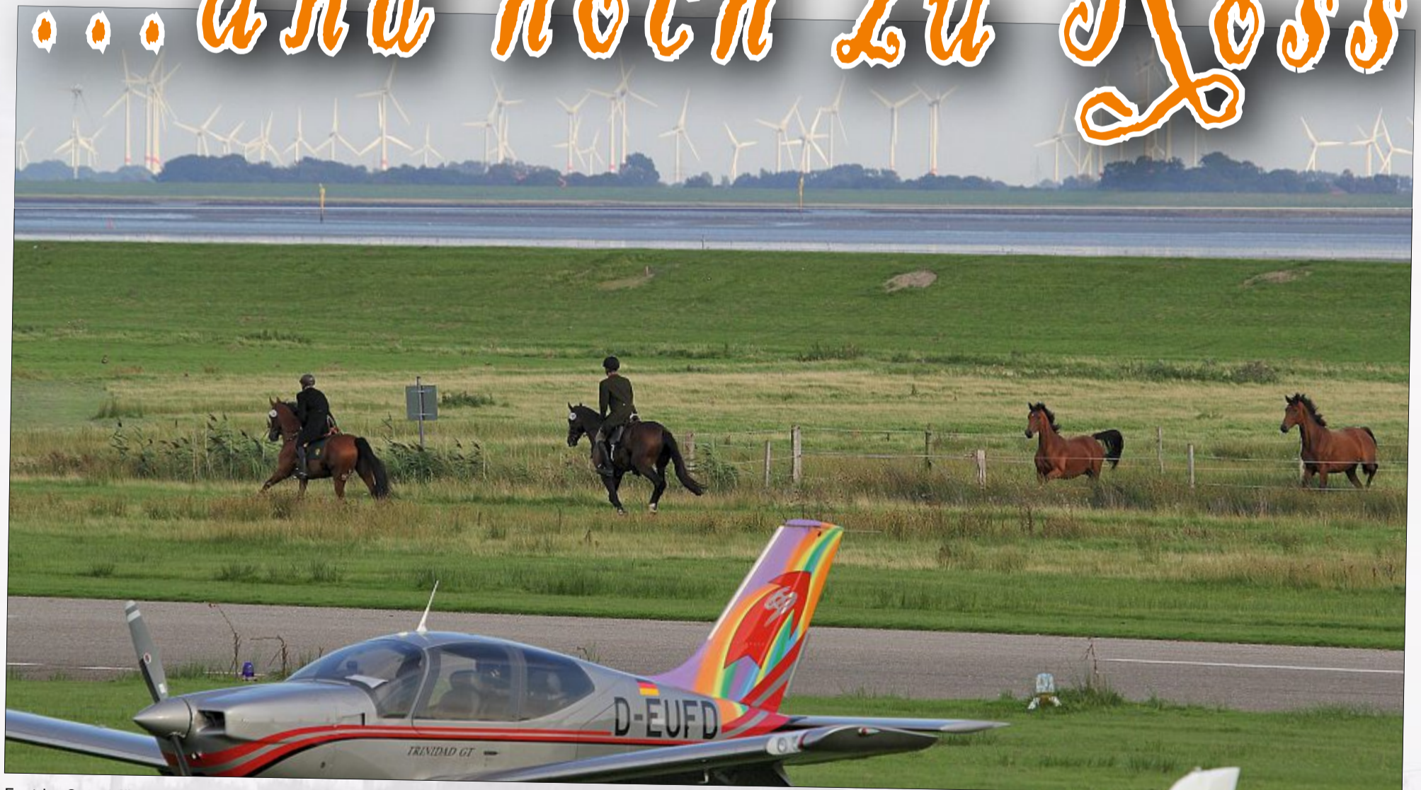
Fest im Sattel führt die Tour der Jagdreiter auch am Flughafen vorbei. Was für ein Ausblick vom Pferderücken.