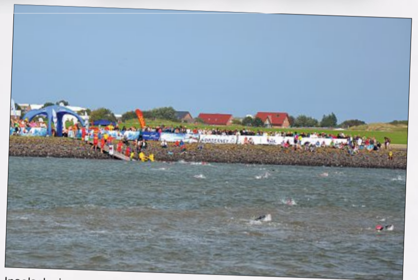
Inselschwimmen: Von Hilgenriedersiel bis nach Norderney ging es am vergangenen Wochenende für 300 Teilnehmer.