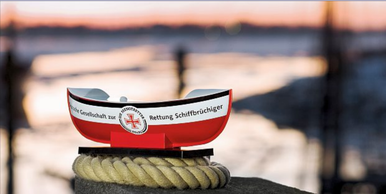
Die Seenotretter feiern in diesem Jahr ihren 150. Geburtstag. Der Tombola-Erlös soll ihnen zugutekommen.