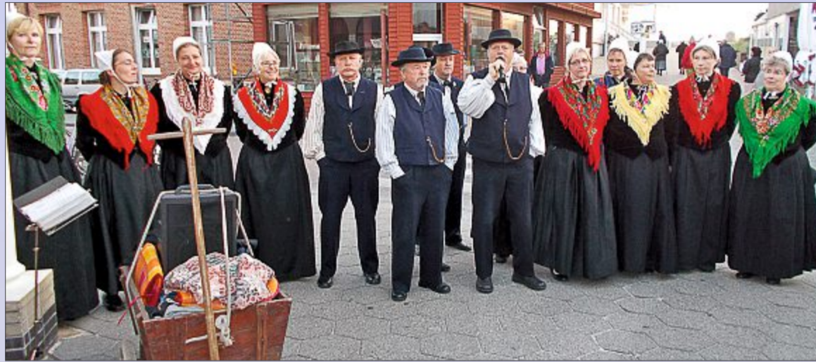
Die Mitglieder des Heimatvereins sorgen mit ihren traditionellen Kostümen und Musik für Unterhaltung in den Einkaufsstraßen. ARCHIVFOTOS

Während alle teilnehmenden Kaufleute ihren Kunden mit besonderen Aktionen, exklusiven Rabatten, Probieraktionen und Unterhaltung für Groß und Klein an diesem Abend verschiedenste Feinheiten liefern, sind auch die