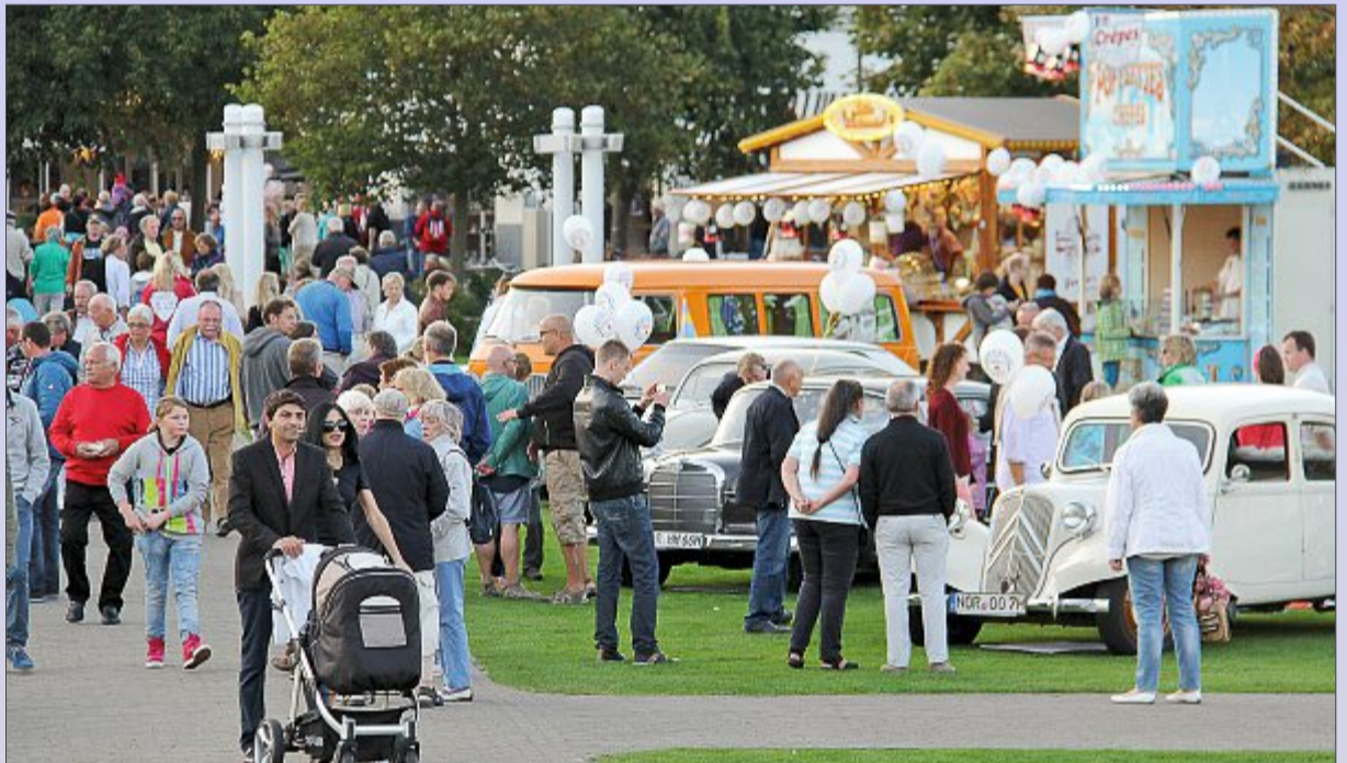
Ein paar der schicken Norderneyer Oldtimer waren beim vergangenen Nachtbummel zum ersten Mal mit dabei. Auch in diesem Jahr fahren sie durch die Stadt und sind hinterher auf dem Kurplatz zu bewundern. ARCHIVFOTOS