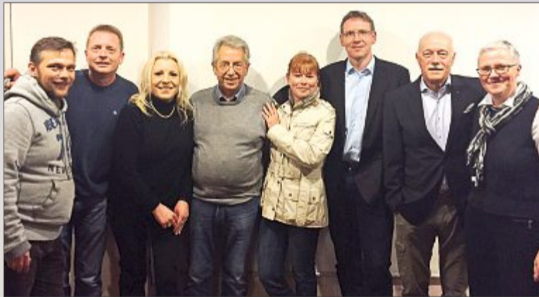
Dem Nachtbummel geht immer eine lange Planung voraus. Gemeinsam mit allen Teilnehmern lässt der Vorstand des Einzelhandelsverbands die Insel zum Einkaufsparadies für Nachtschwärmer werden.