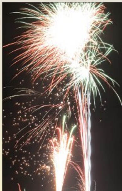
Mit einem Feuerwerk findet der Nachtbummel seinen Abschluss.

NORDERNEY/JEN – Rote Teppiche und schwarz-rote Einkaufsstützen – ein sicheres Zeichen für den Norderneyer Nachtbummel. Auch in diesem Jahr öffnen die Inselkaufleute ihre Türen wieder an einem besonderen Tag besonders lange und locken mit Schnäppchen und speziellen Aktionen. Am Montag geht es in der Innenstadt bis 22 Uhr bunt zu, und zwar für große und kleine Besucher.