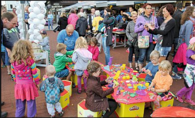
Verschiedenste Aktionen für Groß und Klein warten beim Nachtbummel.