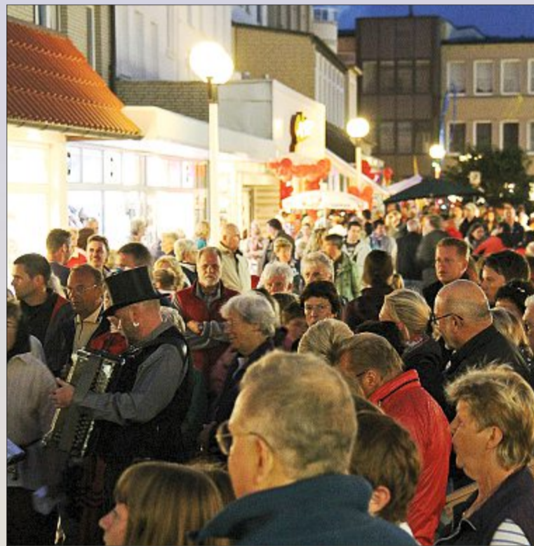
Aktionen, Schnäppchen, Musik und Gespräche – all das erwartet Gäste und Einheimische beim Norderneyer Nachtbummel. Zum siebten Mal findet dieser am Montag auf der Insel statt.

platz erneut ein großes Feuerwerk gezündet werden und den Nachthimmel über der Insel erleuchten.