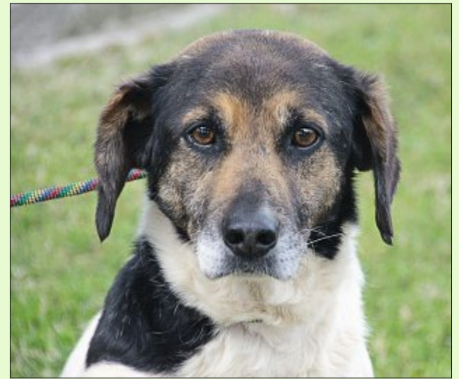
Peter ist zwar zurückhaltend, aber hat er erstmal Vertrauen gefasst, schmusst er gern und ausgiebig.

Wer sich für Charli interessiert, kann sich unter Telefon 04938/425 beim Hager Tierheim melden. Das Telefon ist montags bis freitags von 9 bis 12 Uhr und täglich von 14.30 bis 17 Uhr besetzt. Die Öffnungszeiten sind: täglich von 14.30 bis 17 Uhr und nach Vereinbarung – ausgenommen dienstags, mittwochs und an Feiertagen. Weitere Infos finden sich im Internet auf www.tierheim-hage.de .