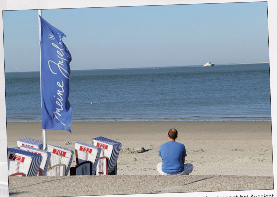
Dieser Herr konnte offenbar noch ein ruhiges Plätzchen ergattern und entspannt bei Aussicht aufs Meer.