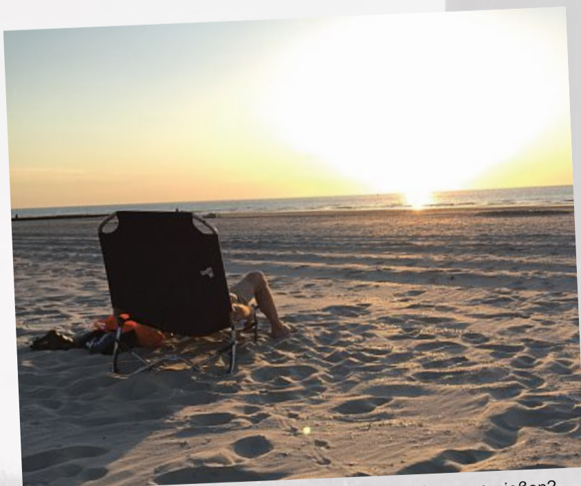
Was gibt es Schöneres, als den lauen Sommerabend so zu genießen?