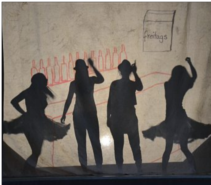
Mit viel Schwung wurde von den Schülerinnen der achten Jahrgangsstufe die Geschichte zum Lied „Die Da!?!“ erzählt.

Schüler des Wahlpflichtkurses Darstellendes Spiel der Jahrgänge sieben und acht präsentieren Showtänze und mehr.