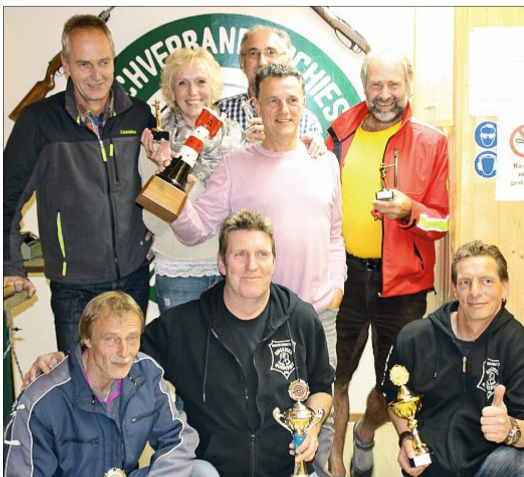
Die diesjährigen Sieger des Vereineschießens auf Norderney konnten sich über Pokale freuen.

Die vollständige Liste mit allen Ergebnissen der 96 Teilnehmer ist auf der Internetseite des Vereins www.schiessortverein-norderney.de bereitgestellt.