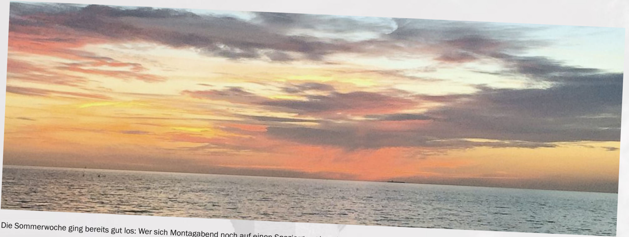
Die Sommerwoche ging bereits gut los: Wer sich Montagabend noch auf einen Spaziergang begab, konnte dieses Farbenspiel am Himmel bewundern.