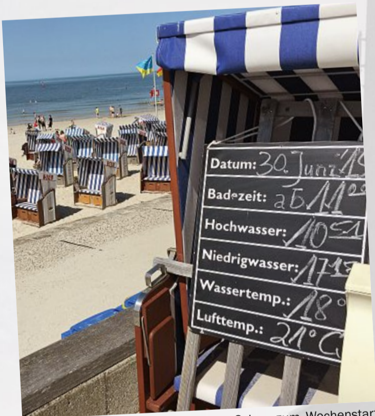
Das Thermometer steigt nach oben: Schon zum Wochenstart lockte gutes Wetter an den Strand.