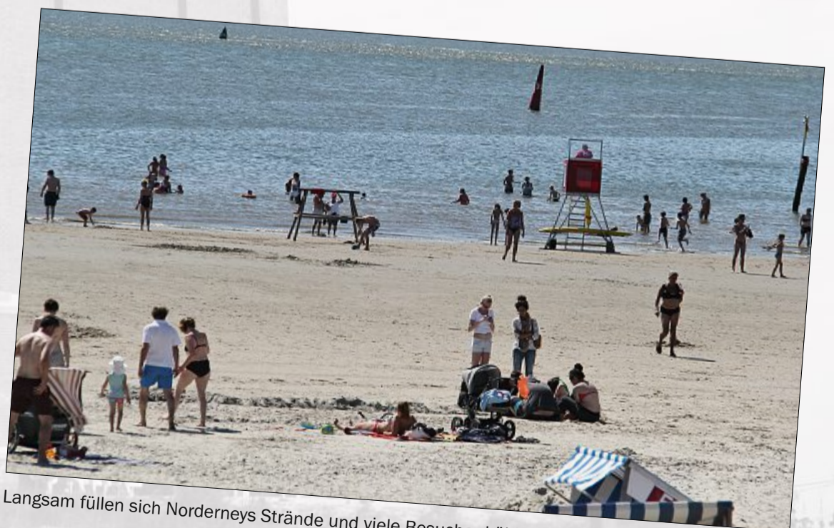
Langsam füllen sich Norderneys Strände und viele Besucher kühlen sich in der Nordsee ab.