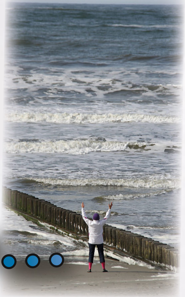
Gruß an die Sonne – vielleicht hört sie es ja.