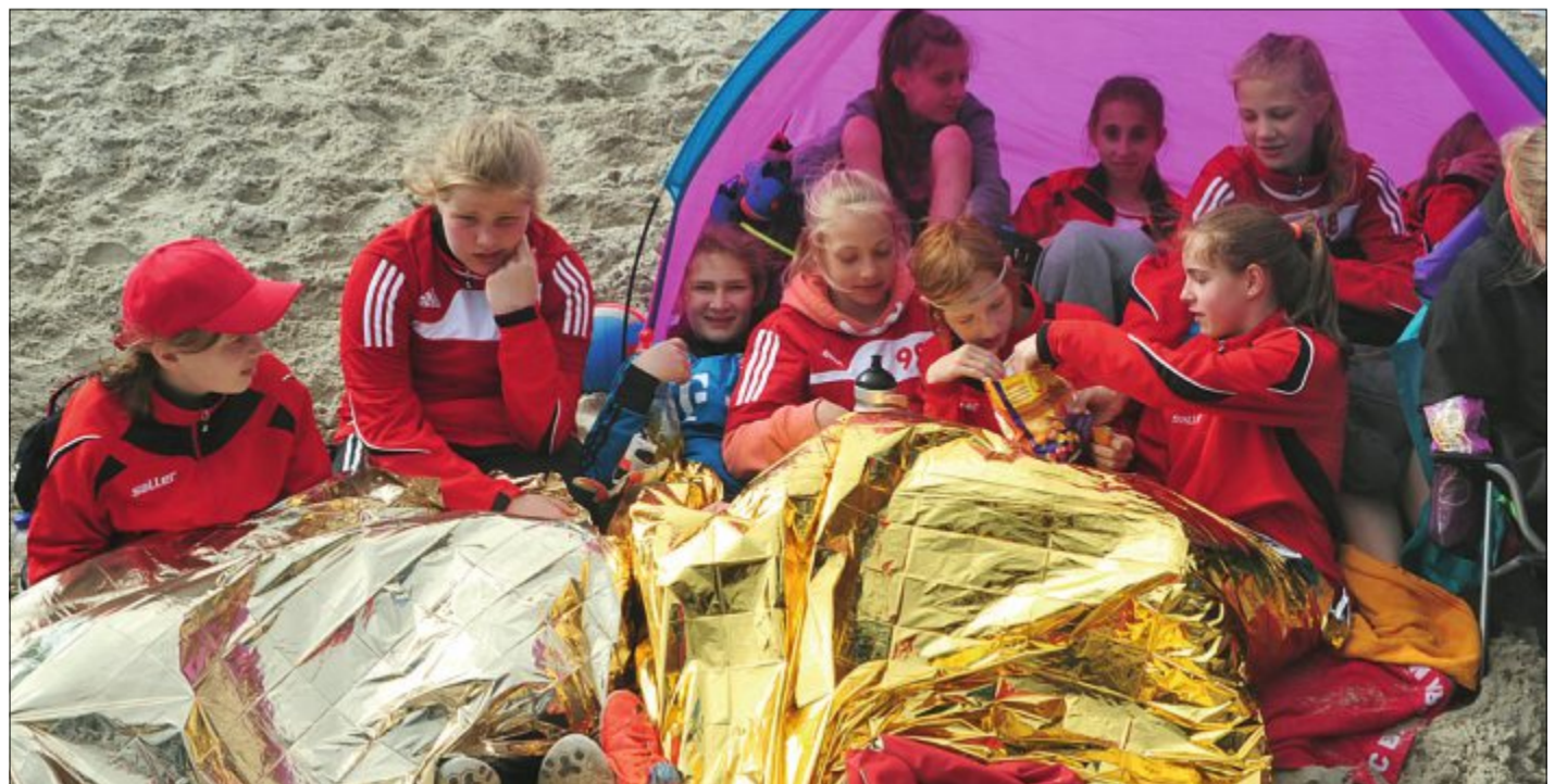
Ungemütliche Bedingungen. Das Wetter machte den Spielerinnen und Spielern, aber auch den mitgereisten Eltern und Betreuern einen dicken Strich durch die Rechnung. Die Kinder ließen sich beim 13. Sparkassen Beachsoccer Junior Fun-Cup auf Norderney trotzdem nicht die Laune vermiesen und kämpften mit großem Einsatz um die Titel.