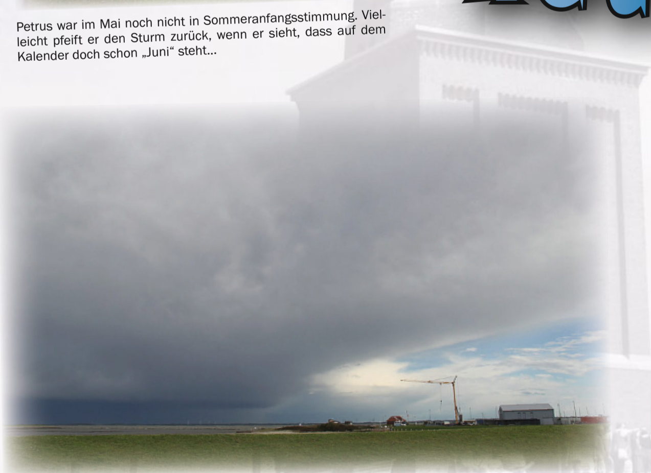
Wie eine vollgesogene Wolldecke hängt der wolkendichte Himmel über der Insel. Die blauen Flecken lassen auf Besserung hoffen und die soll laut Wetterbericht ja nun auch endlich kommen.