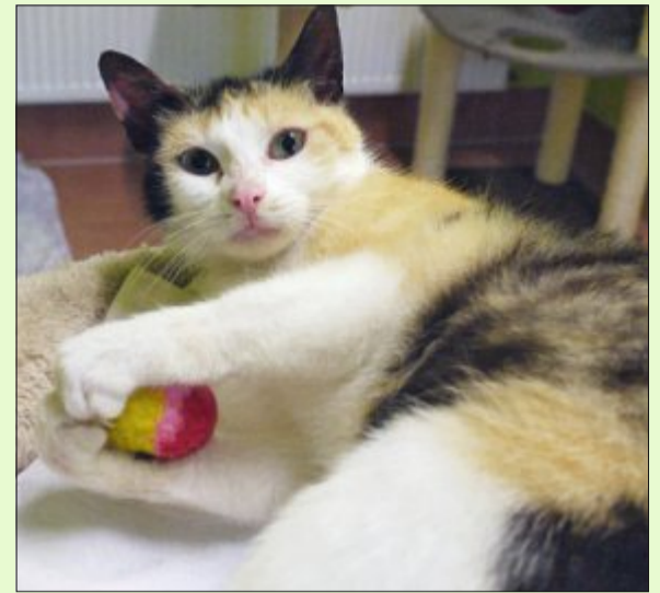
Die dreifarbige „Glückskatze“ Naomi scheint die perfekte Begleiterin für die ganze Familie zu sein.

Wer sich für die Katzendame Naomi interessiert, kann sich unter Telefon 04938/425 beim Hager Tierheim melden. Das Telefon ist montags bis freitags von 9 bis 12 Uhr und täglich von 14.30 bis 17 Uhr besetzt. Die Öffnungszeiten sind: täglich von 14.30 bis 17 Uhr und nach Vereinbarung – ausgenommen dienstags, mittwochs und an Feiertagen. Weitere Infos finden sich im Internet auf www.tierheim-hage.de.