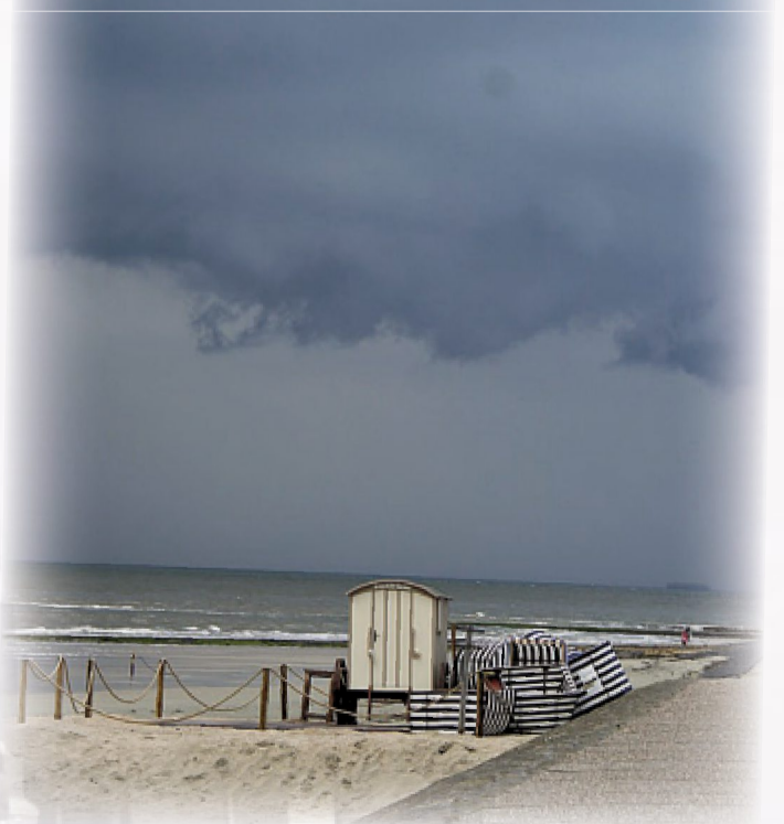
Wenn das die Liebesfee sieht... Auch die Traumhochzeit im Badekarren ist bei Sonne schöner.