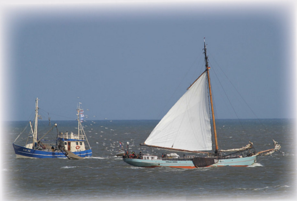
Maritime Impressionen à la Romantikpostkarte.