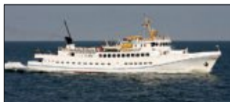
Die „Fair Lady“ legt im Sommer Richtung Helgoland ab.

Um 9 Uhr heißt es im Norderneyer Hafen „Leinen los!“ und die „Fair Lady“ startet zur etwa dreistündigen Fahrt von Norderney nach Helgoland. Gegen 12 Uhr legt das Schiff auf Reede vor Helgoland an und die Besucher gelangen mit dem Börteboot auf die Insel hinüber. Von hier sind es nur wenige Gehminuten zur Einkaufsmeile „Lung Wai“ und nach wie vor haben die meisten Helgoland-Besucher auf dem Rückweg zoll- und mehrwertsteuerfreie Einkäufe im Gepäck, heißt es seitens der Reederei. Helgoland ist vor allem aber ein Naturparadies: „Der klassische Ausflug ist ein Spaziergang durch Ober- und Unterland, inklusive Erkundung des Klippenrandweges.“ Dieser führt direkt zu den „Lummenfelsen“ mit seinen zahlreichen Vogelkolonien und zum bekanntesten Wahr-