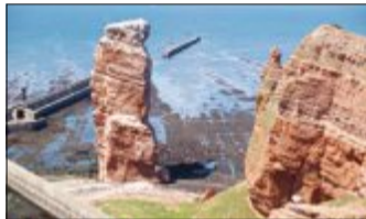
Ein Abstecher zur „Langen Anna“ gehört zum Programm.