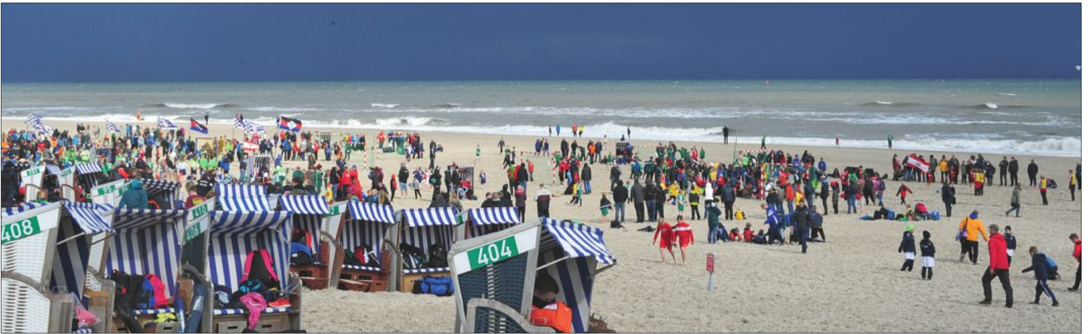
Eine schwarze Wand. Die Wolken kündigten das Unheil frühzeitig an. Ein Unwetter zog am Sonnabend über Norderney hinweg und sorgte dafür, dass sich mehrere Mannschaften zurückzogen.