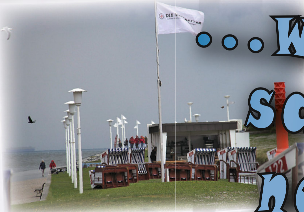
Petrus war im Mai noch nicht in Sommeranfangsstimmung. Vielleicht pfeift er den Sturm zurück, wenn er sieht, dass auf dem Kalender doch schon „Juni“ steht...