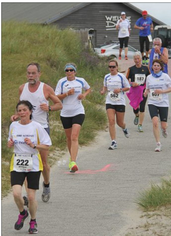
Der Nordseelauf führt wieder über Norderney. Anmeldungen sind kurzfristig noch möglich.

Am Sonntagabend, 7. Juni, kommen die Sportler direkt von der vorherigen Strecke auf Juist mit dem Schiff rüber. Am Hafen startet dann um 18 Uhr auch gleich der Lauf, der vom Anleger über 6,6 Kilometer über die untere Promenade zum Cornelius führt. Hier ist der Wendepunkt. Auf der mittleren Promenade geht es vorbei am Januskopf bis zur Georgshöhe und weiter über die untere Promenade und Viktoriastraße. Die Weststrandstraße wird überquert und bis zum Ziel auf dem Kurplatz sind es noch 75 Meter. Die Siegerehrung soll um 20.30 Uhr erfolgen. Um 21.15