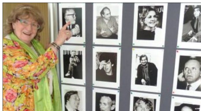
Isabel Mahns-Techau aus Hamburg fotografiert seit Jahrzehnten die ganz großen Filmstars.

Die ganz Großen der Leinwand – Isabel Mahns-Techau aus Hamburg hat Hunderte von ihnen auf Abertausenden von Bildern. Die Fotografin kennt die Stars oft auch persönlich und kann zu jedem ihrer Bilder eine eigene Geschichte erzählen. Clint Eastwood, Sean Connery, Nastassja Kinski sind nur drei aus der Fülle der ausgestellten, großen Schauspieler und Regisseure, denen Isabel Mahns-Techau als Journalistin begegnete. Eine Auswahl internationaler Starfotos ist anlässlich des Filmfestes erstmals im Kurtheater zu sehen.