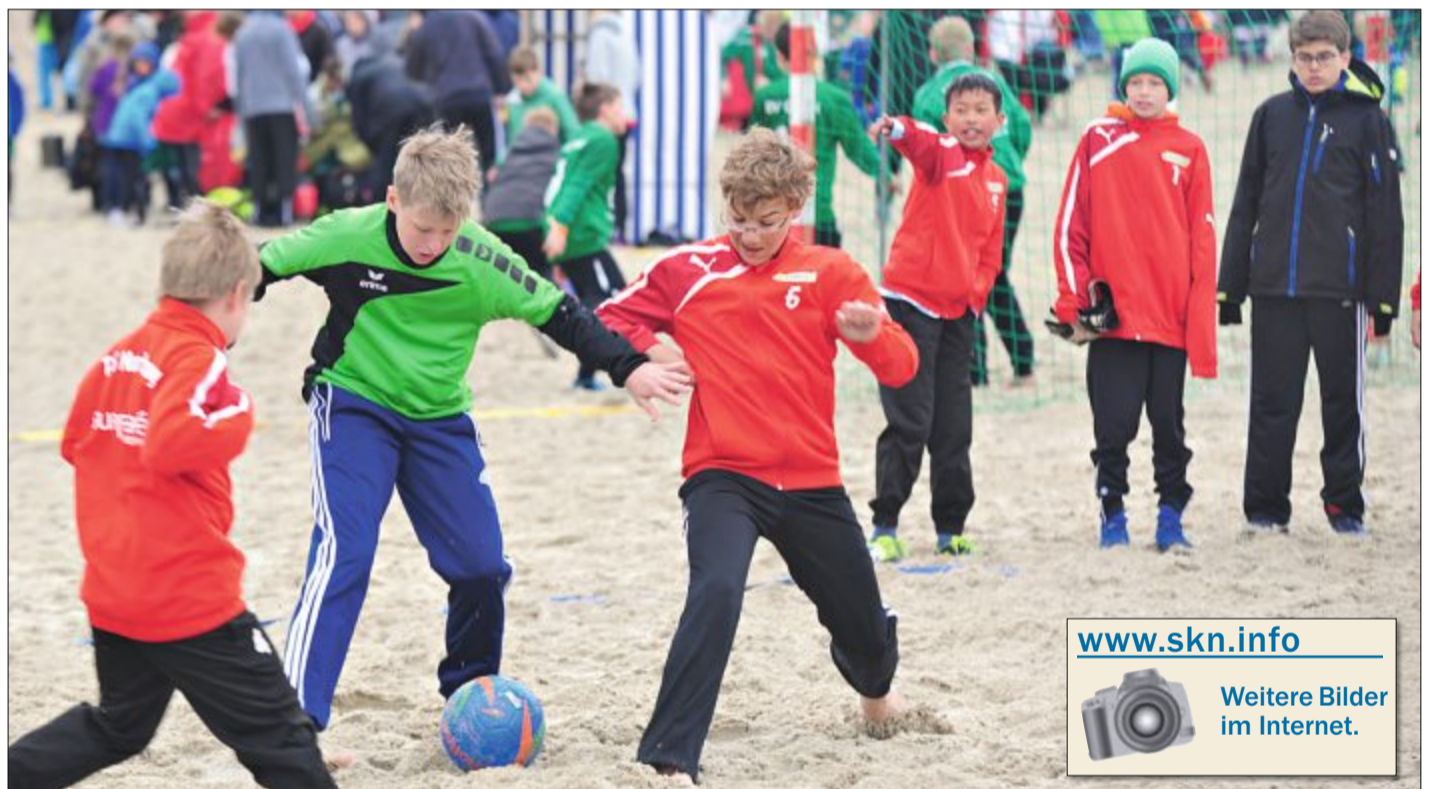
Diesmal nicht ganz vorn dabei. Der Nachwuchs des gastgebenden TuS Norderney (rote Jacken, hier TuS II gegen SC Wiesens), der im vergangenen Jahr zweimal triumphierte, konnte Sonnabend nicht in den Titelkampf eingreifen.

Um den immensen logistischen Aufwand zu meistern, hatte der TuS wieder