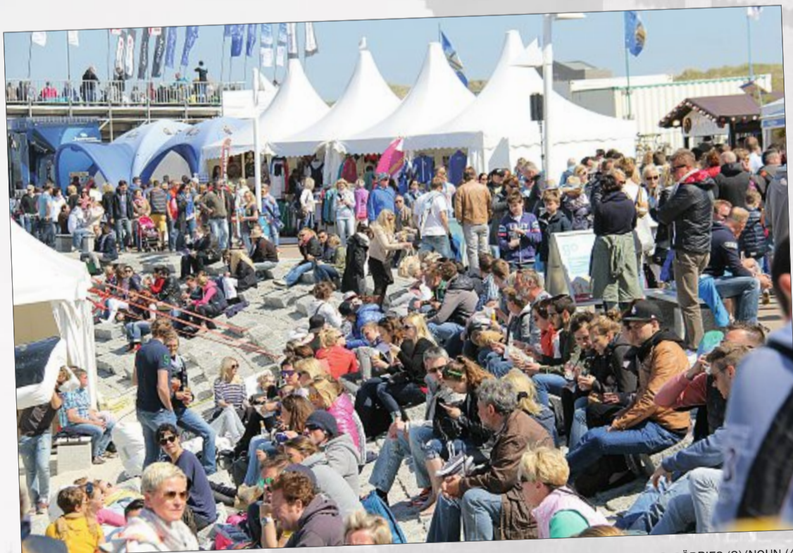
Beste Stimmung in der White-Sands-Arena.