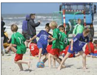
Kicken am Strand.