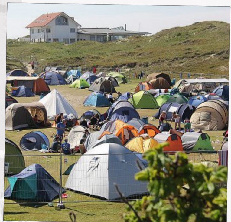
Begehrte Zeltplätze nahe des Festivalgeländes: Wer mehrere Tage bleiben wollte, musste sich zeitnah um eine Bleibe kümmern.