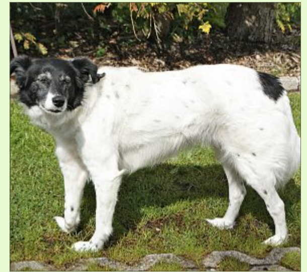
Flo sucht liebevolle Hände, um Vertrauen aufbauen zu können.

Wer sich für Flo interessiert, kann sich unter Telefon 04938/425 beim Hager Tierheim melden. Das Telefon ist montags bis freitags von 9 bis 12 Uhr und täglich von 14.30 bis 17 Uhr besetzt. Die Öffnungszeiten sind: täglich von 14.30 bis 17 Uhr und nach Vereinbarung – ausgenommen dienstags, mittwochs und an Feiertagen. Weitere Infos finden sich im Internet auf www.tierheim-hage.de .