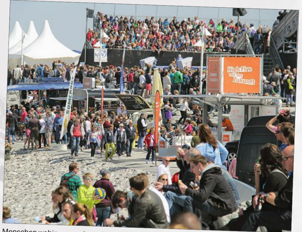
Menschen wohin man schaut: Neben Party und Sport lockte diesmal auch die Roadshow der IdeenExpo 2015 die Menschen an den Januskopf.