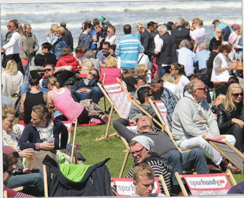
Sonnenbaden am Meer: Pünktlich zu Pfingsten spielte auch das Wetter mit.