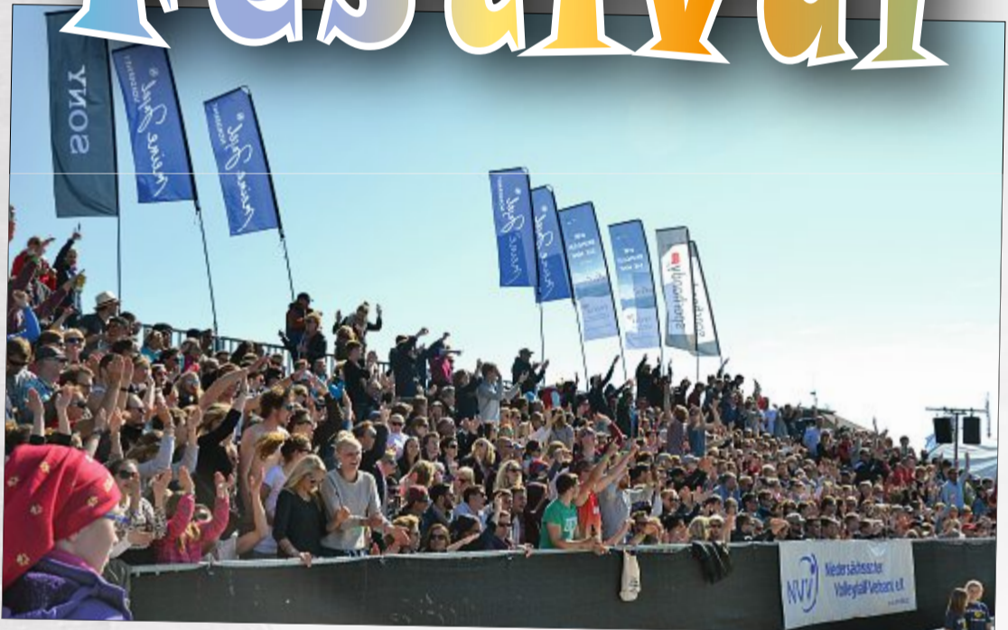
La-Ola und Applaus für die Stars in der Arena. Windsurfer und Volleyballer stellten wieder die sportlichen Mittel- und Höhepunkte dar.