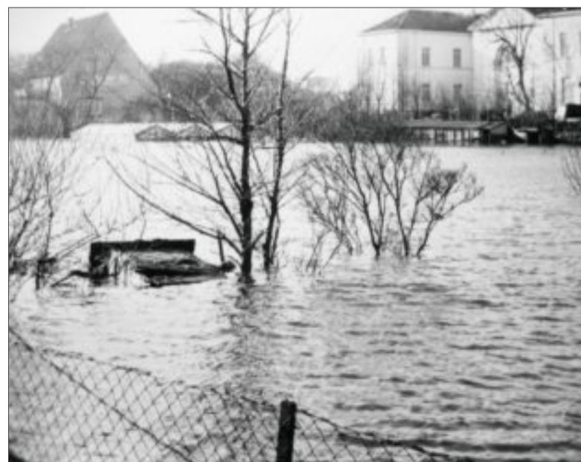
Sturmflut 1962: Auch die Gärten an der Weststrandstraße wurden komplett überspült und danach nicht wieder richtig genutzt.