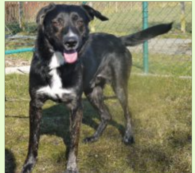
Rocky mag spielen und laufen, aber auch schmusen.

Name: Rocky Rasse: Mischling Alter: geboren am 1. März 2011 Geschlecht: männlich, unkastriert