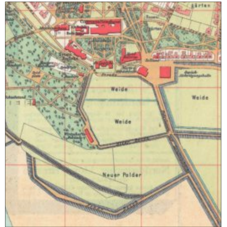
Karte des Areals an der Weststrandstraße von 1912.