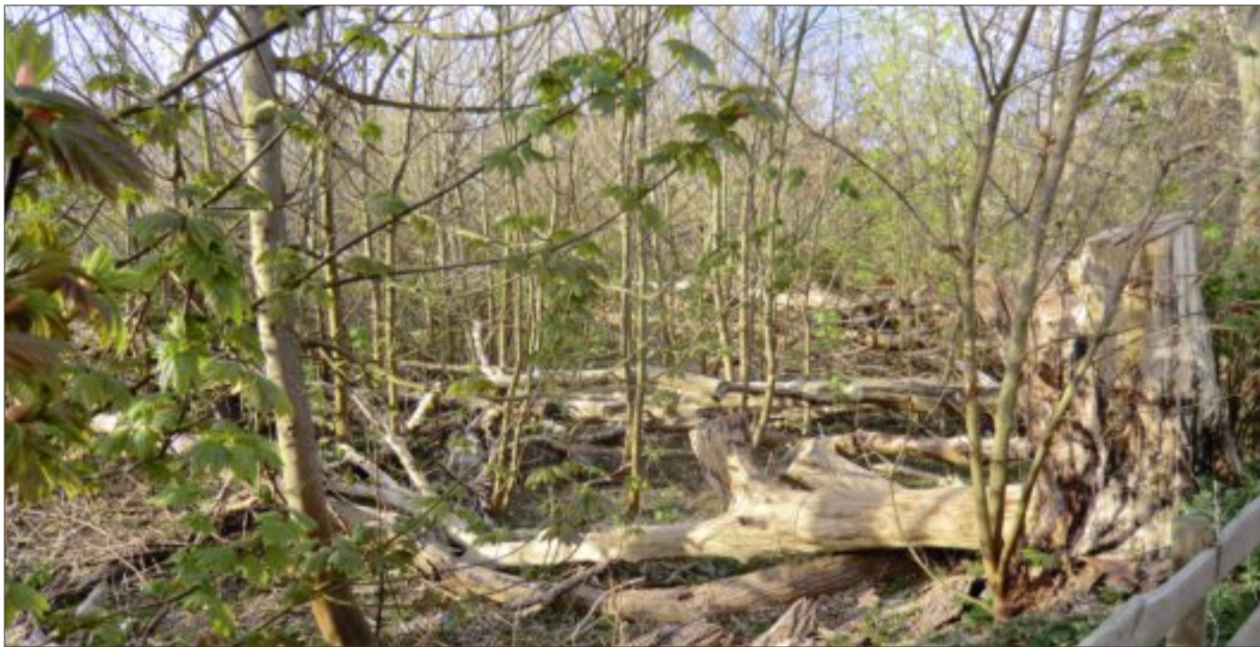
„Hinnis Tuun“: So sieht die verwilderte Fläche heute aus.