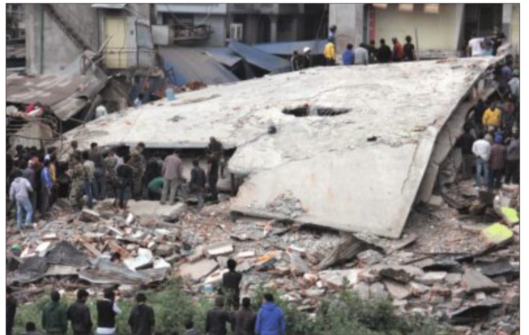
Erdbeben in Nepal. Dieses Foto zeigt ein fünfstöckiges Gebäude, das in Shovabagwati nahe der Hauptstadt Kathmandu zusammengestürzt ist.