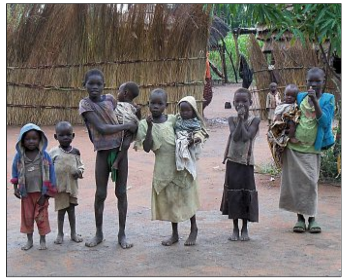
60 Kilometer bis zur weiterführenden Schule – das ist in Kadeba Realität.

Angedacht sind zunächst vier Klassenräume mit Toiletten, die vorrangig Mädchen, Schwangeren und jungen Müttern zur Verfügung stehen sollen. Doch langfristig sollen auch Jungen aufgenommen werden, denn der Bedarf ist groß. Der Außenbereich ist für Acker- und Gartenbau vorgesehen, sodass den Frauen gezeigt werden kann, wie sie sich selbst versorgen können. Geerntete Produkte sollen außerdem zum Wohl der Schule verkauft werden. Vorerst wird im Bedarfsfall Strom mit einem Generator erzeugt. Künftig sollen eine Solaranlage die Stromversorgung und ein Brunnen die Wasserversorgung sichern.