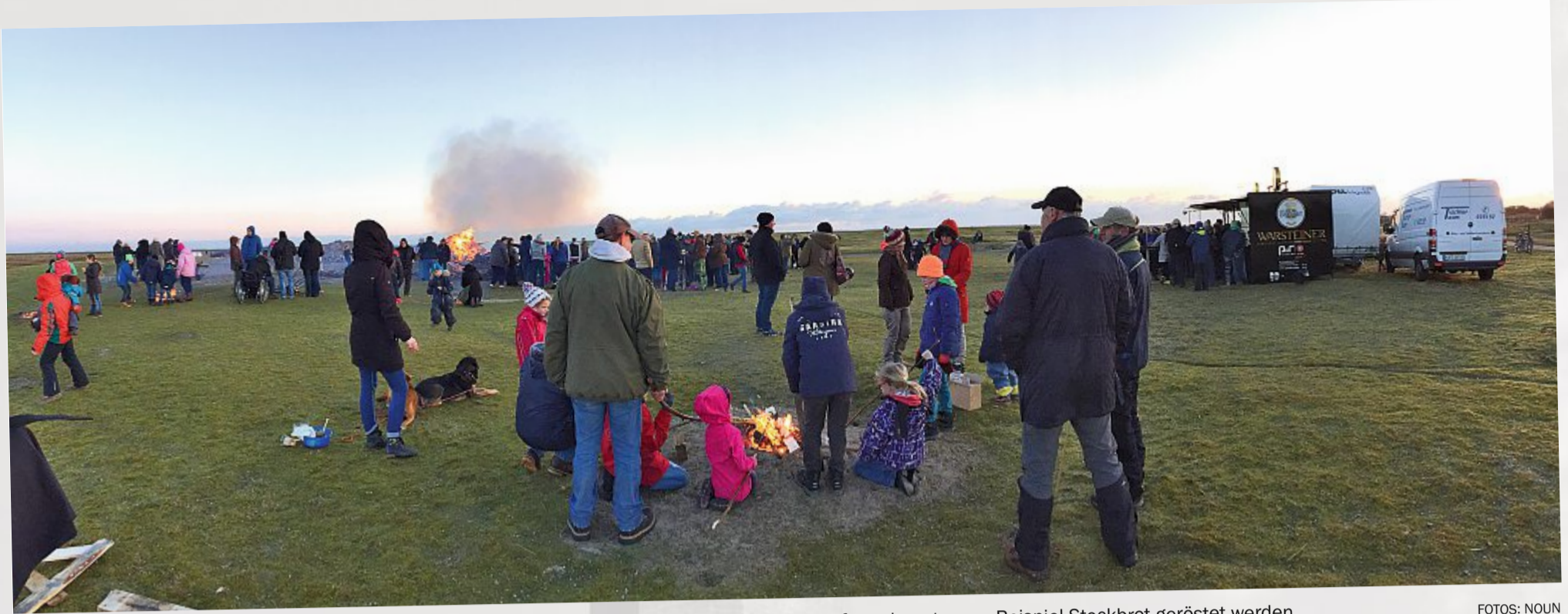
Ganz traditionell ist auch auf Norderney ein Osterfeuer entfacht worden. An einem kleinen Lagerfeuer konnte zum Beispiel Stockbrot geröstet werden.