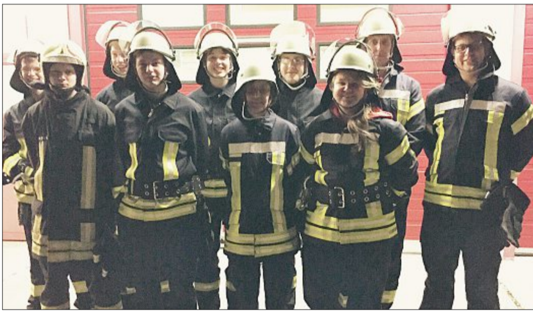
Diese Kameradinnen und Kameraden haben im Feuerwehr-Ausbildungszentrum Prüfungen zum „Truppmann 1“ und „Truppmann 2“ absolviert.