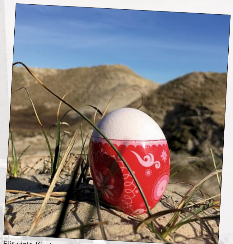
Für viele Kinder stand sicherlich die Eiersuche ganz oben auf dem Osterprogramm.