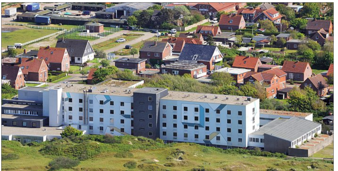
80 000 Euro konnte der Förderverein der Inselklinik jüngst zukommen lassen. Der Standort auf Norderney ist für Einheimische und Gäste von Bedeutung.