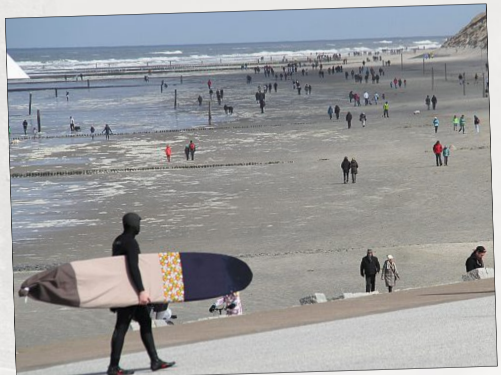
...und lockte viele Menschen nach draußen an den Strand, um die frische Meeresluft zu genießen.