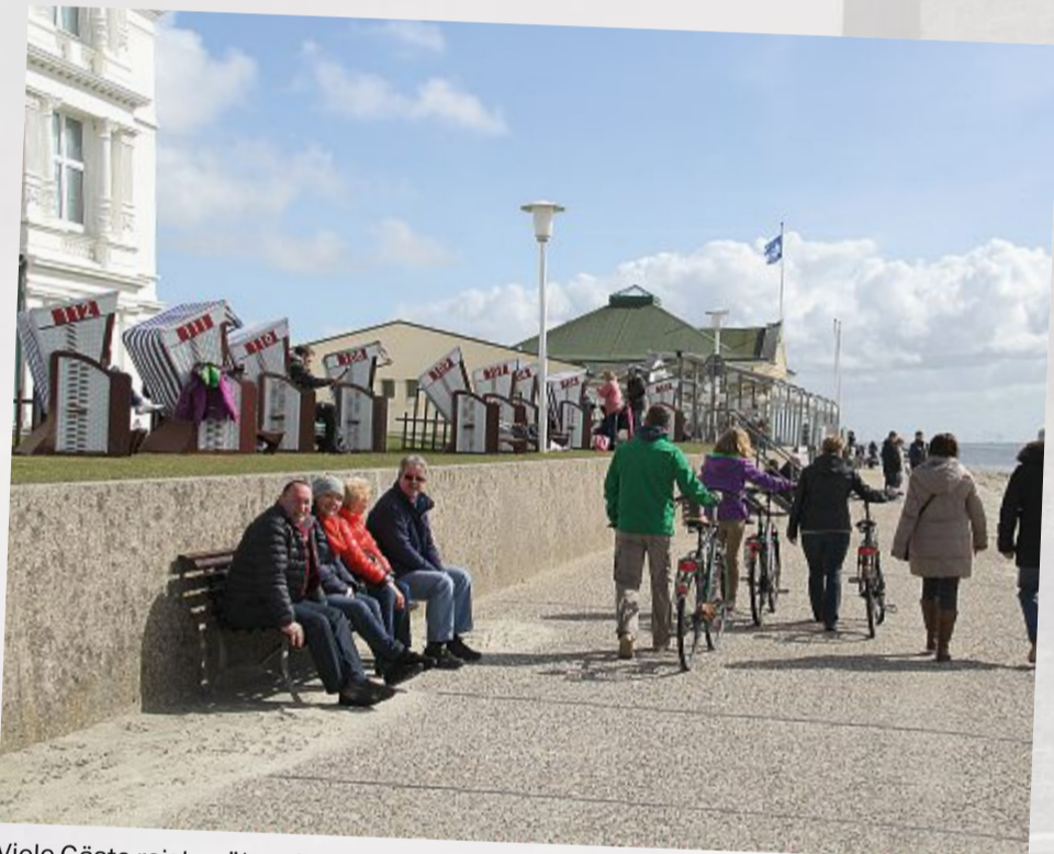
Viele Gäste reisten über die Ostertage an. Nachdem es die Woche über sehr stürmisch war, zeigte sich am Wochenende dann doch die Sonne...