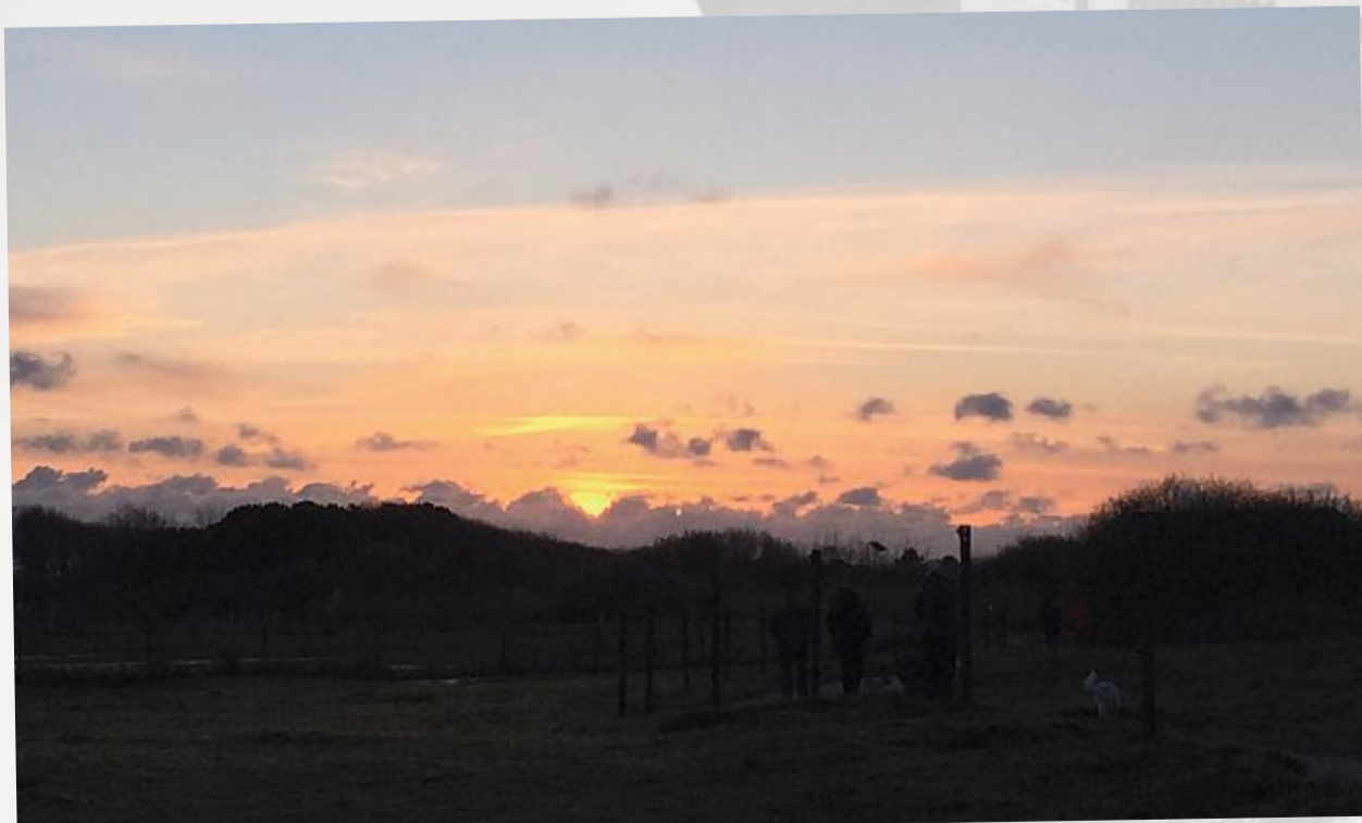
Auch die Abende zeigten sich von ihrer schönsten Seite.