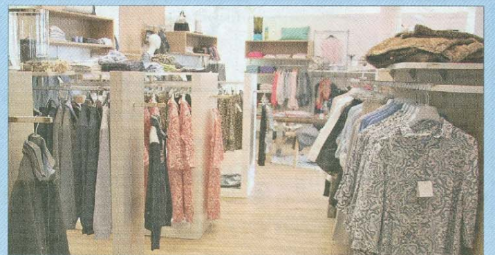
Kombinationen und Accessoires für den Schick-Mix.