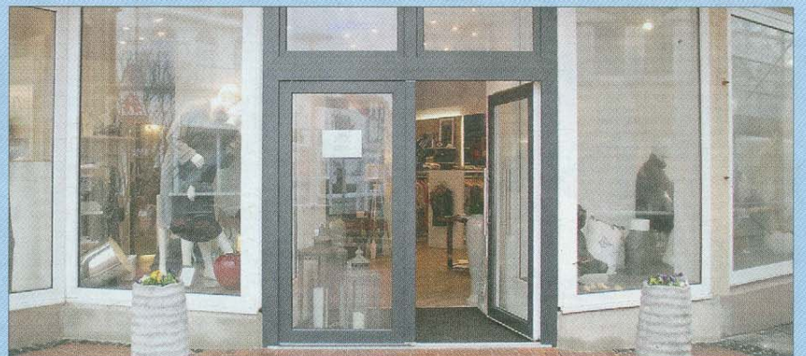
An der Fassade des Hauses wird noch gearbeitet.