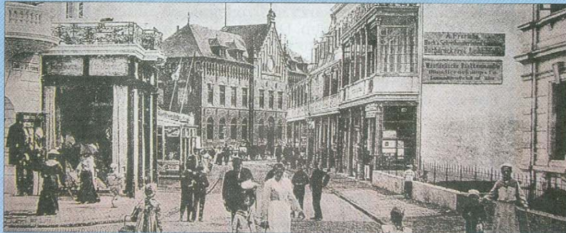
Blick in die Poststraße zu früheren Zeiten.