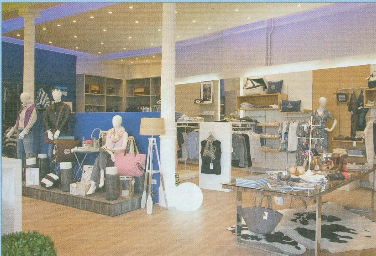
Der Moderaum. Eine Mischung aus Styling-Boutique und Wohnzimmer.

Im Gewerbegebiet 52 a 26548 Norderney Tel.: (0 49 32) 99 05 05