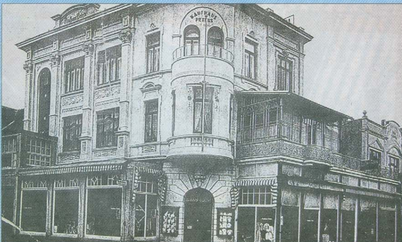
Das große Eckhaus war schon immer ein Hingucker im Stadtbild.