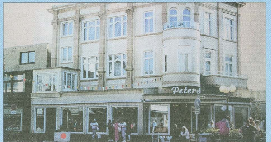
Seit über 120 Jahren gibt es das Modehaus auf der Insel.