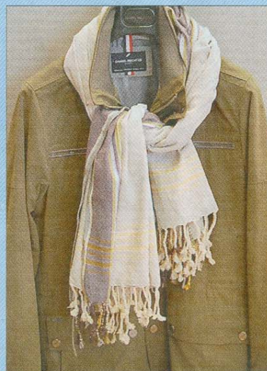
Schick und funktional.