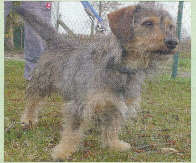
Der kleine Raudi ist erst vor Kurzem gefunden und im Tierheim abgegeben worden.

Wer sich für Raudi interessiert, kann sich telefonisch unter 04938/425 beim Hager Tierheim melden. Das Telefon ist montags bis freitags von 9 bis 12 Uhr und 14.30 bis 17 Uhr besetzt. Die Öffnungszeiten sind: täglich von 14.30 bis 17 Uhr und nach Vereinbarung – ausgenommen dienstags, mittwochs und an Feiertagen. Weitere Infos finden sich zudem im Internet auf der Seite www.tierheim-hage.de .