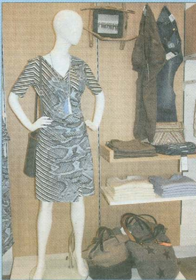
Pfiffig für Damen.