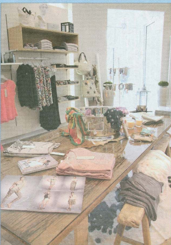
Alles passt zusammen: Blickfänge bietet nicht nur der neue Moderaum selbst, sondern natürlich vor allem das ausgewählte Sortiment.