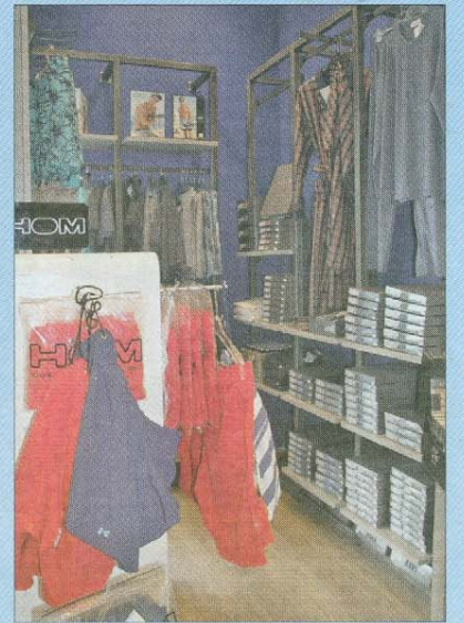
Unter- und Nachtwäsche.