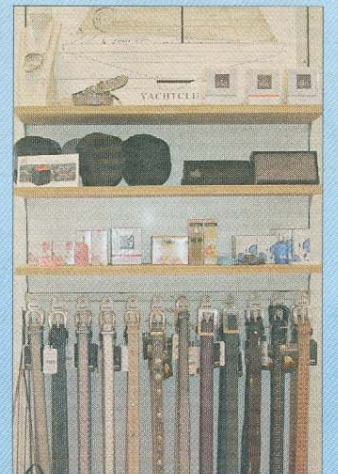
Gürtel nach Wunsch und andere Accessoires.