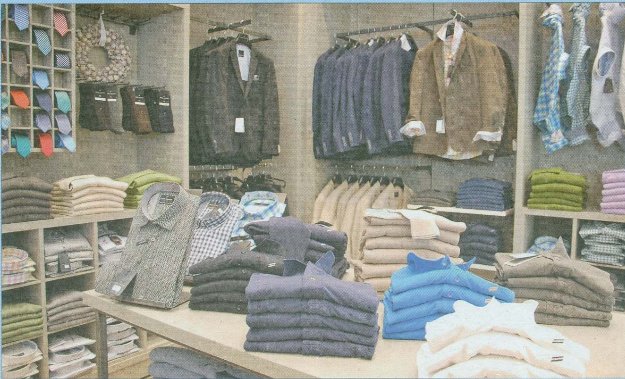
Trendiger Schick in abgestimmten Farben und ausgezeichnete Qualität für Herren.