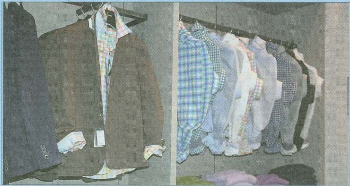
Herrenmode für alle Lebenslagen.