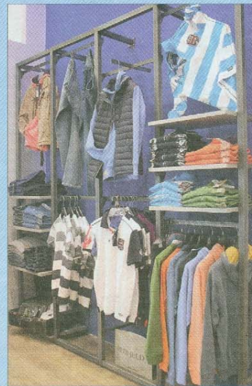
Sportlich für Herren.