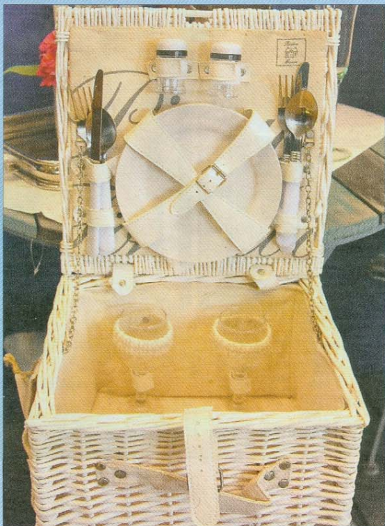
Aktion: Ab einem Einkaufswert von 250 Euro gibt es diesen Picknickkorb dazu.

Auch auf indivi-duellen Service legt der Moderaum natürlich Wert. Und diese Linie verfolgen auch die Firmen im Sortiment. So biete beispielsweise die Marke Vanzetti nicht nur exquisite Gür-tel von der Stange, sondern fertige di-ese auch nach Kun-denwunsch. Und auch wer einmal ei-nen Mangel an sei-ner Ware feststellt, könne sich auf die passende Betreuung verlassen.