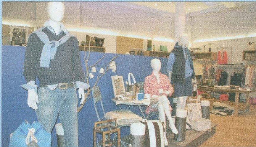
Picknick, Segeln, Strandpromenade: Lässig und elegant ist das Motto hier.