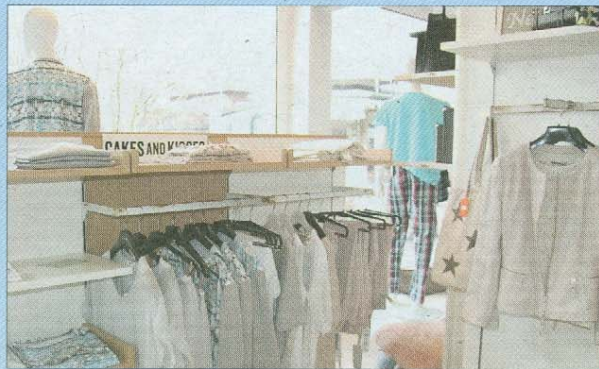
Damenmode mit Ausblick.