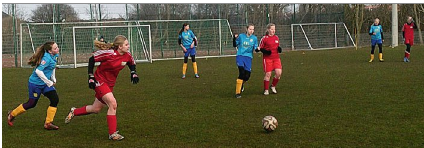
Mit zwei Siegen sind die TuS-Mädchen erfolgreich in die Außensaison gestartet.

fen und auf die Kinder aufzupassen. Neben all dem Training würde aber natürlich auch der Spaß nicht zu kurz kommen. Der erste Mannschaftspokal ging in diesem Jahr an die „Fruchtis“.