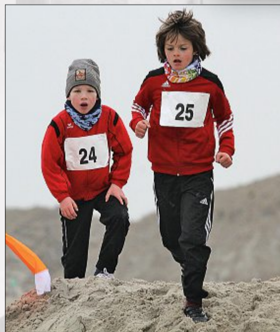
Je älter die teilnehmenden Kinder sind, desto mehr Hürden hatten sie zu nehmen.