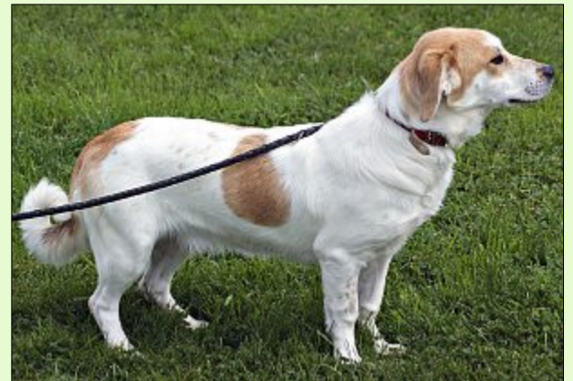
Samira sucht ein ruhiges Zuhause. Sie braucht Zeit, um Vertrauen zu fassen.

Für Samira wird ein ruhiger, kinderloser Frauen-Haushalt gesucht, in dem idealerweise schon ein Hund lebt, an dem sich die hübsche Mischlingsdame orientieren könnte. Sie benötigt viel Zeit, um Vertrauen zu fassen und um sich einzugewöhnen. Mit Artgenossen versteht sie sich gut. Samira wurde entwurmt, geimpft, gechippt und kastriert.