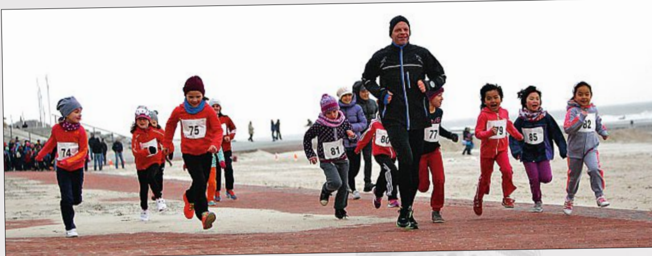
Zum mittlerweile traditionellen Koruslauf wurde es am vergangenen Wochenende wieder sportlich am Nordstrand. Sieben Starts über verschiedene Distanzen zwischen 400 und 2000 Meter waren zu bewältigen.