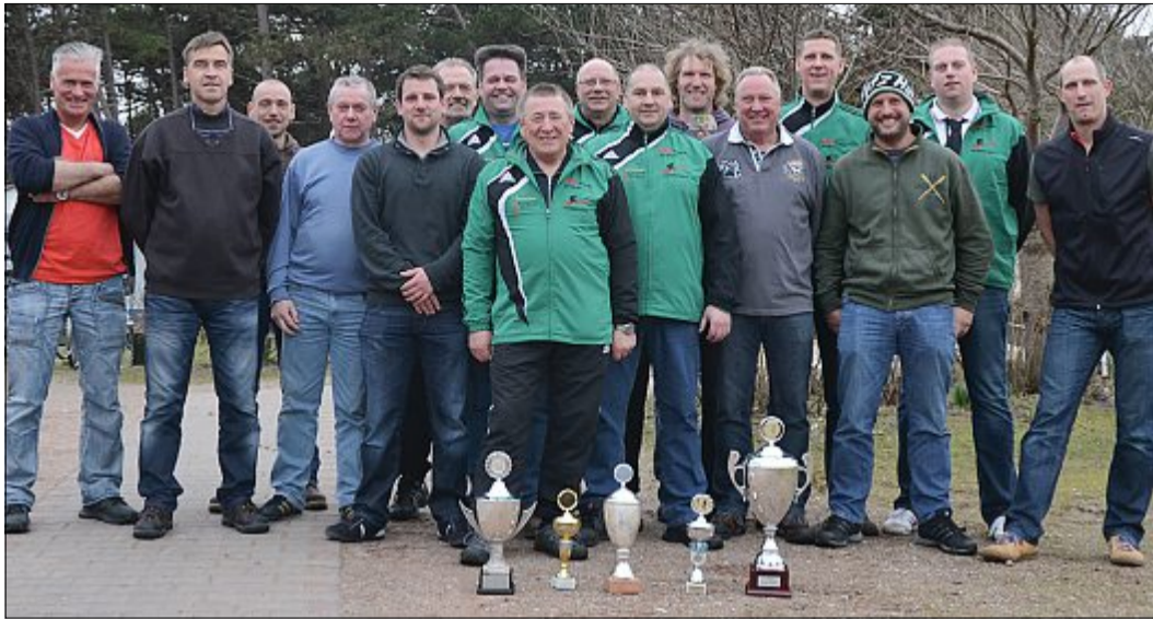
Nach dem Gewinn der Meisterschaft konnte sich „Putz Hum“ auch noch über drei der vier möglichen Einzelmeisterschaften und den Victoriacup freuen.