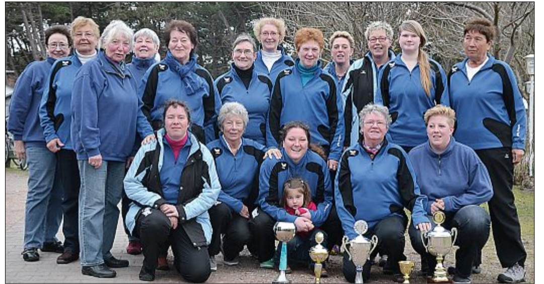
Neben der Meisterschaft gingen in diesem Jahr auch die beiden Einzelmeisterschaften an die Frauen von „Ost Ut“.