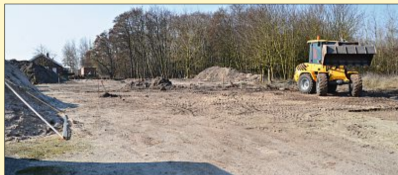
Am Südwesthörn haben die Erschließungsarbeiten für die neuen Bauprojekte bereits begonnen.

Generell nimmt die Bautätigkeit auf der Insel zu. Rund 140 Bauanträge sind im vergangenen Jahr bei der Stadtverwaltung eingegangen – ein neuer Rekord. Wengleich der Mammutanteil sich auf kleinere Maßnahmen beziehe oder in man-