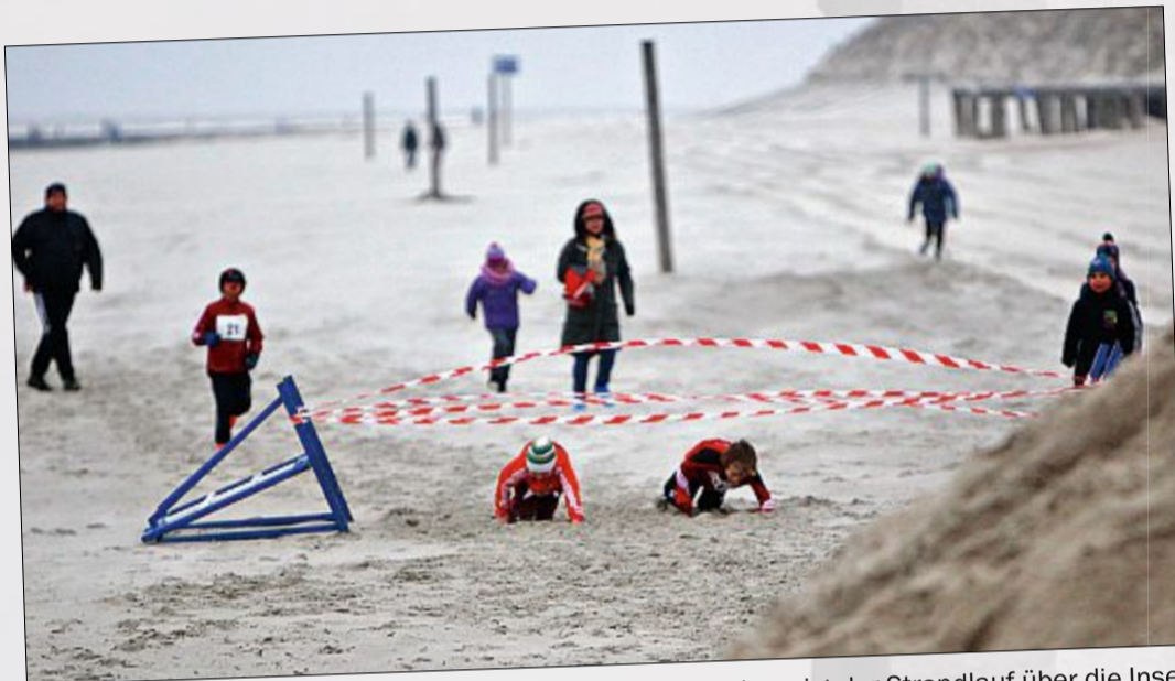
Für die Kinder und Jugendlichen im Alter von fünf bis 17 Jahren ist der Strandlauf über die Insel erneut ein Riesenspaß gewesen.