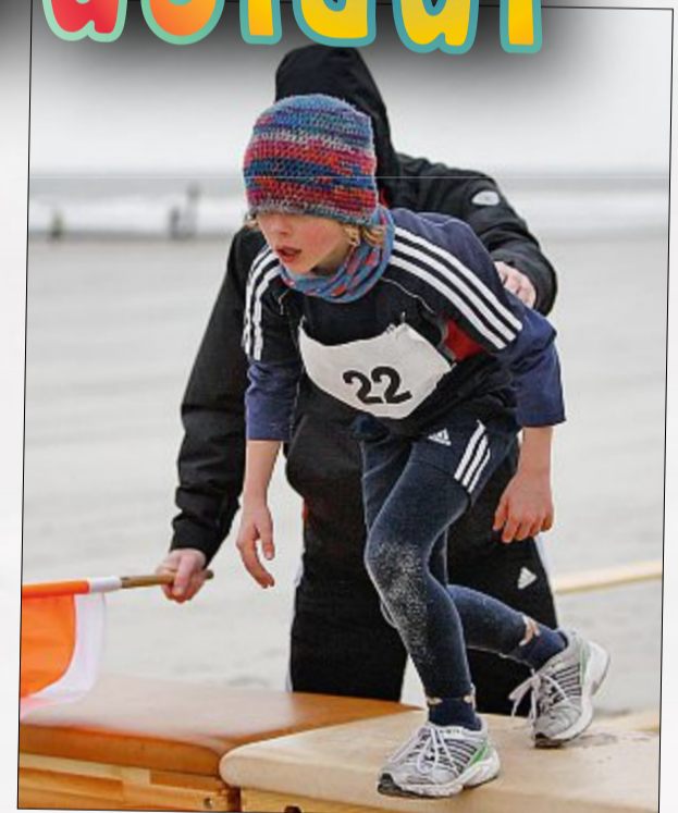
Und wer diese besonders gut und schnell meisterte, wurde bei der Siegerehrung belohnt.