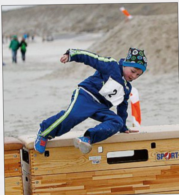
Hindernisse wie Kästen, Sandhügel, Hürden und Krabbelstation waren eine spannende Herausforderung.