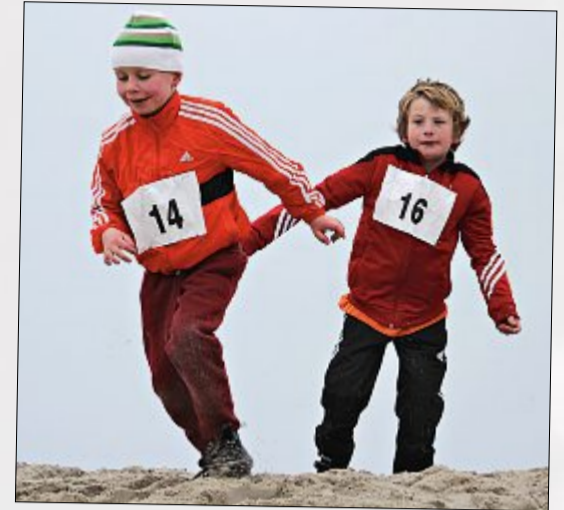
Laufen und springen im Sand ist ganz schön anstrengend...