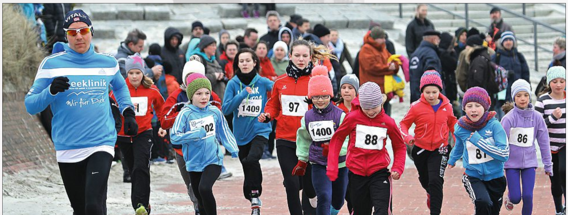
Genau 98 Kinder und Jugendliche, davon 63 Jungen und 35 Mädchen, haben am 16. A.u.e.-Korus-Gedächtnislauf teilgenommen.