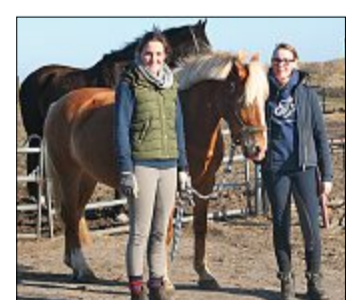
Zwei Fachkräfte für den Inselreitersport.