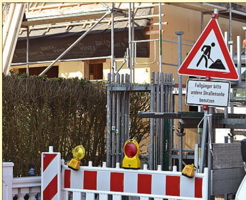
Der Raum auf der Insel ist begrenzt. Gebaut wird trotzdem eifrig.

Ihr OLB-Immobilien-Team Strandstraße 3 · Tel.: 0 49 32-9 18 30 www.olb.de