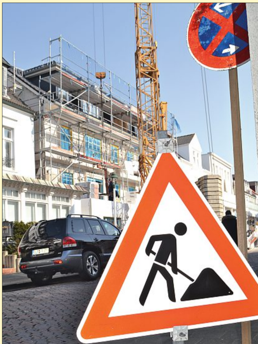
Baustellenschilder sind über die Herbst-, Winter- und Frühjahrsmonate kein seltener Anblick auf der Insel. Dann boomt das Baugeschäft.

Wer einen An-, Um- oder Neubau anstrebt, findet bei den Architekten, Planern und Handwerkern vor Ort kompetente und verlässliche Ansprechpartner von A bis Z.