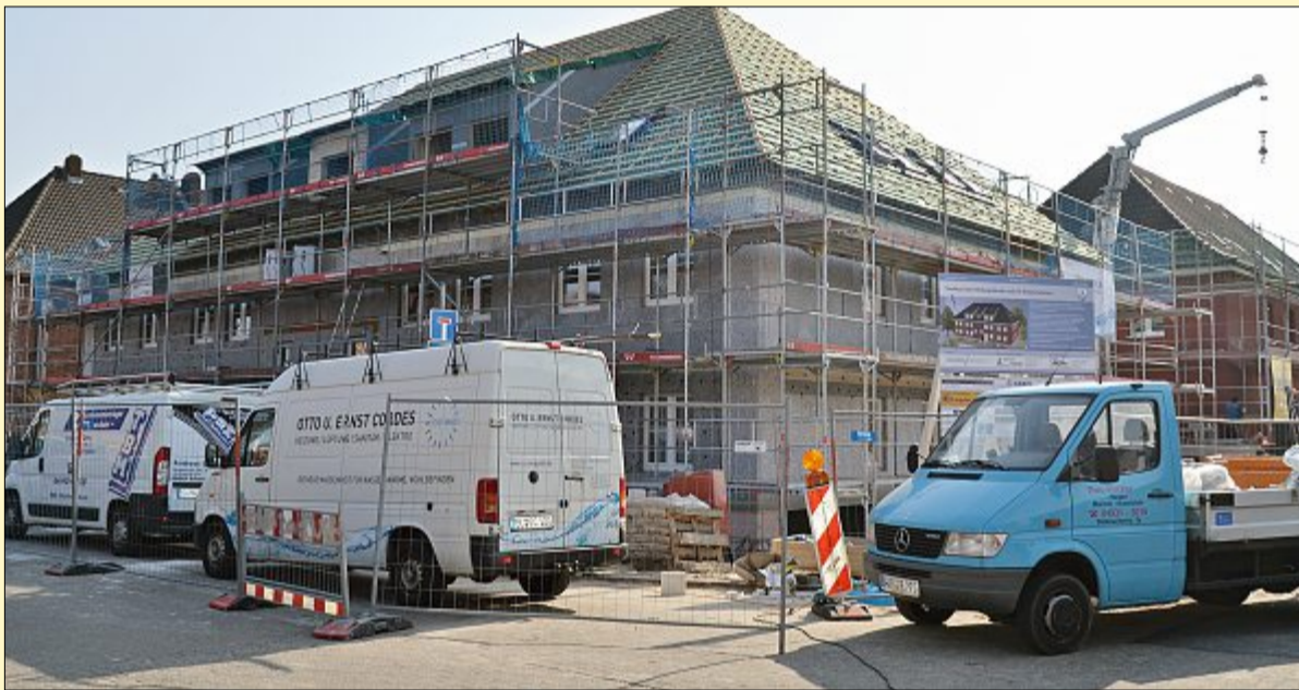
An der Ecke Benekestraße/Mühlenstraße entstehen durch die Wohnungsgesellschaft Norderney gerade 16 neue Unterkünfte für Insulaner. Im Herbst sollen sie bezugfertig sein.