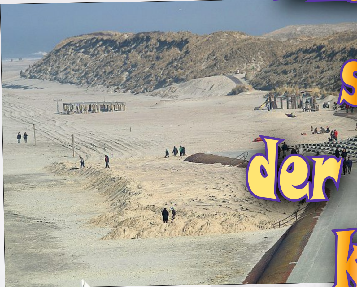
Vorbereitung für die Saison: neuer Sand für den Nordstrand.