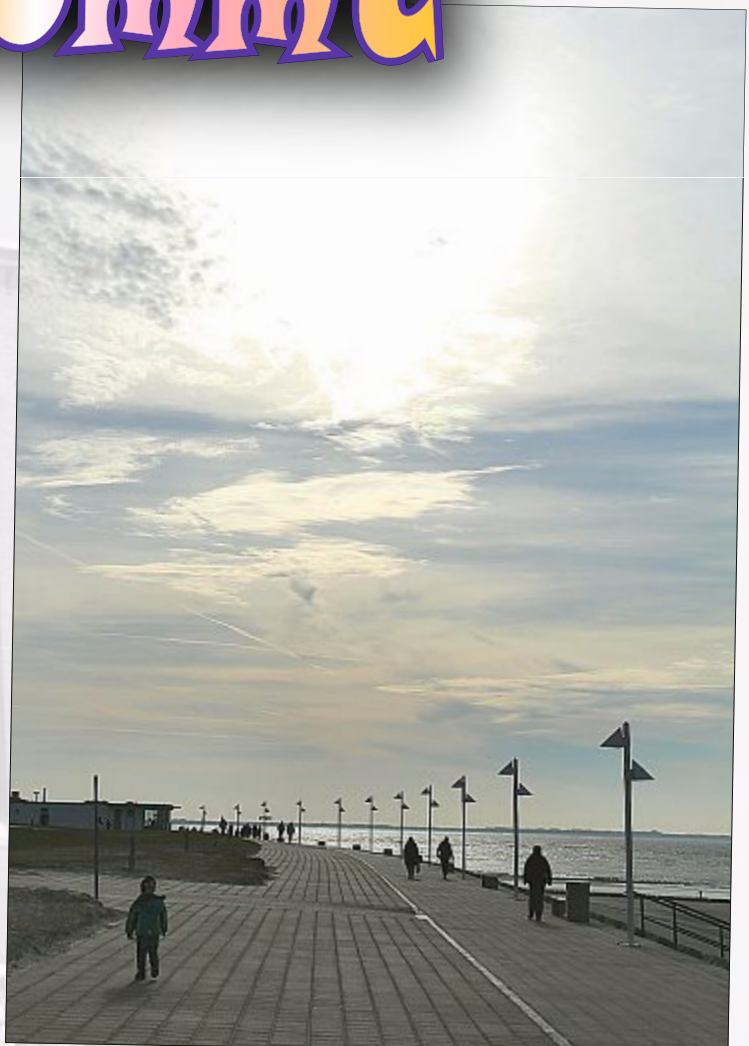
Sonnenstrahlen - Balsam für Haut und Seele.