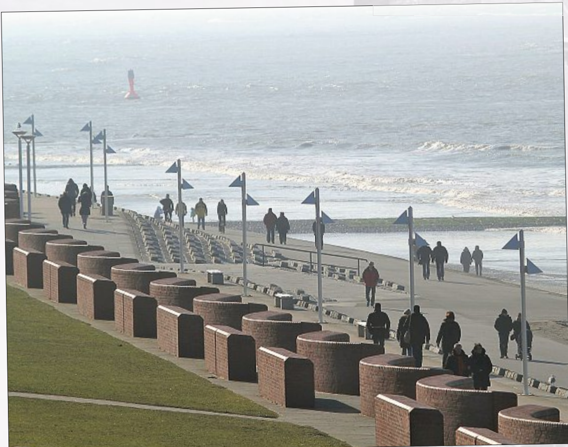
Windig, aber sonnig ist es auf der Insel. Zeit für einen Spaziergang.