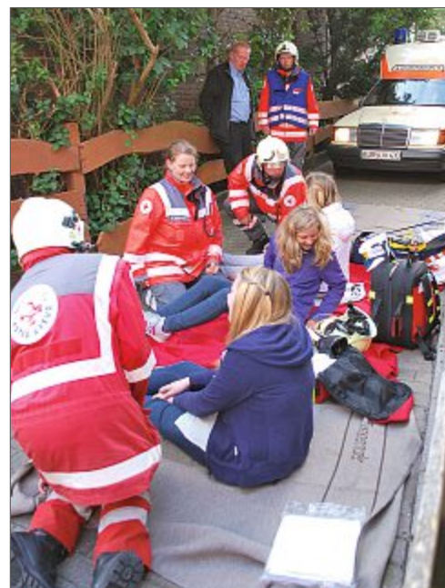
Immer wieder üben die DRK-Mitglieder den Ernstfall.