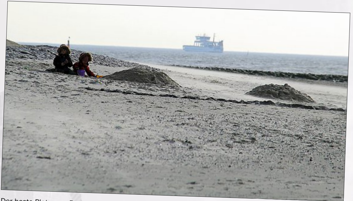
Der beste Platz zum Buddeln ist der mit Seeblick.