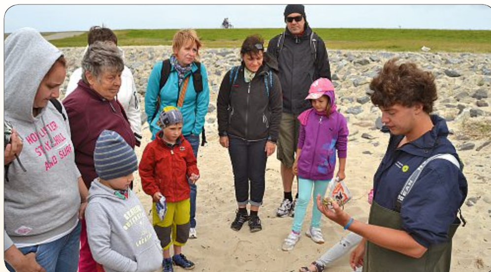
Tipp der Woche: Das Team des Nationalpark-Hauses bietet wieder fachkundige Ausflüge in die Inselnatur an. Am Montag um 11 Uhr heißt es „Watt intensiv“ (Treffpunkt: Holzbänke an der Westseite des Campingplatzes Um Ost), am Dienstag „Watt für Zwerge“ (Surferbucht am Deichübergang Südstraße) und am Freitag um 15 Uhr „Meereskunde für Anfänger“ (Nationalpark-Haus am Hafen). Anmeldung und Information unter Telefon 04932/2001.

nahme ist für jeden offen und kostenlos.