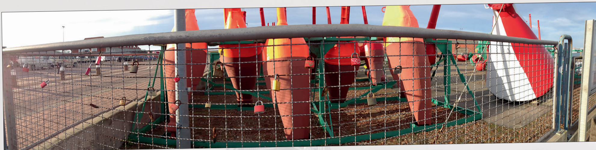
Nicht nur an den Hochzeitsstätten, auch am Tonnenhof bringen Paare mittlerweile ihre Liebesschlösser an.