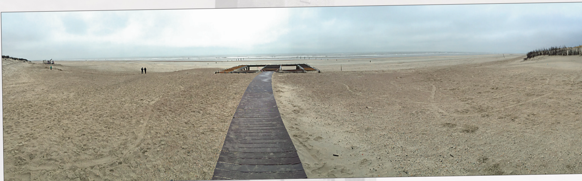
Pfad ans Meer – zur Nebensaison ganz „ungeschmückt“.