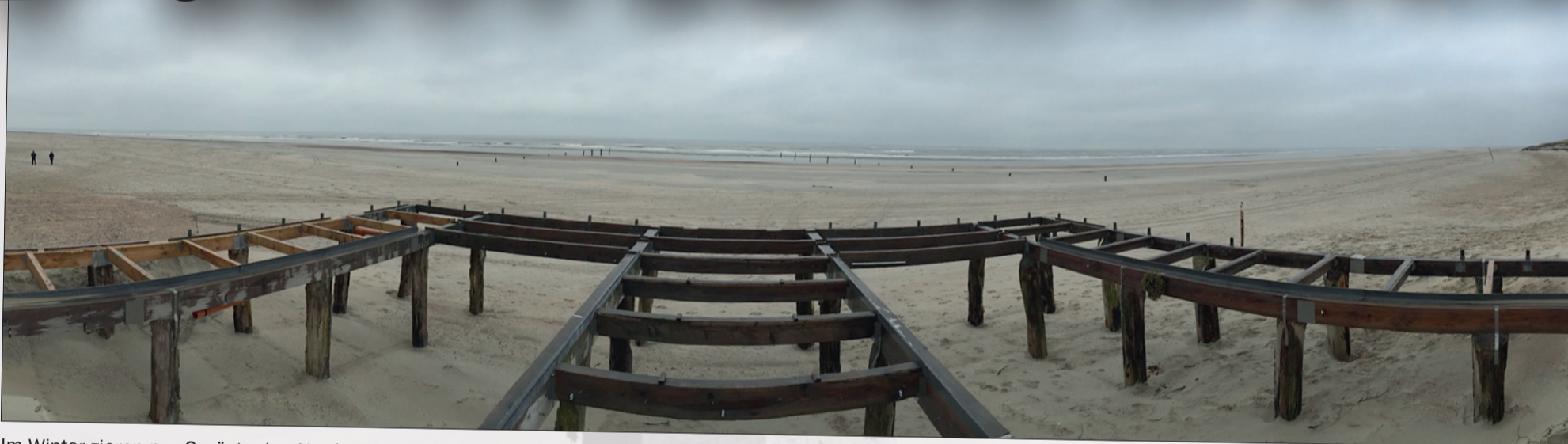
Im Winter zieren nur Gerüste den Nordstrand.