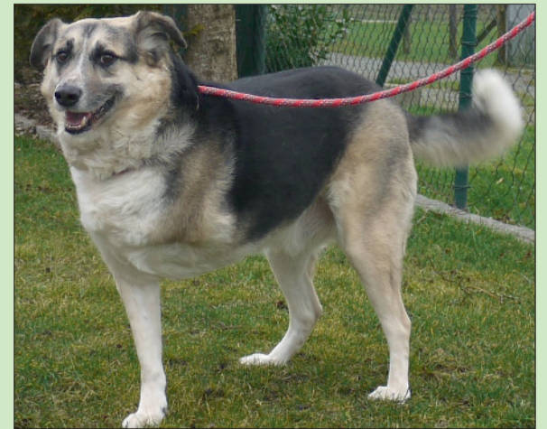
Mit seiner Behinderung kommt Nero gut zurecht.

Die Öffnungszeiten im Winterhalbjahr sind: täglich von 13.30 bis 16 Uhr und nach Vereinbarung – ausgenommen dienstags, mittwochs und an Feiertagen, dann ist das Tierheim für Besucher geschlossen. Weitere Infos finden sich zudem im Internet auf der Seite www.tierheim-hage.de .