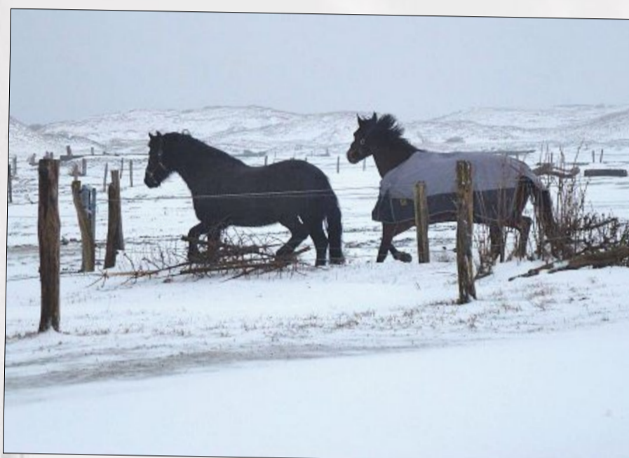
Im Galopp durch das kühle Element: Vielen Vierbeinern macht das Toben durch den Schnee genauso viel Spaß wie dem menschlichen Nachwuchs.