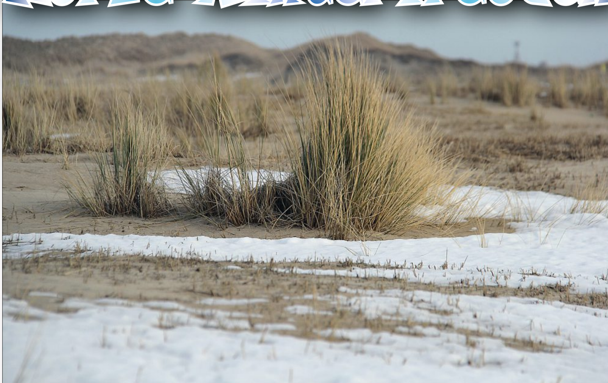
Malerisches Dünenbild im Inselosten.