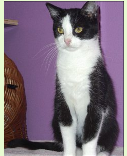
Fuchs ist zutraulich und verschmüsst.

Die Öffnungszeiten im Winterhalbjahr sind: täglich von 13.30 bis 16 Uhr und nach Vereinbarung – ausgenommen dienstags, mittwochs und an Feiertagen, dann ist das Tierheim für Besucher geschlossen. Weitere Infos finden sich zudem im Internet auf der Seite www.tierheim-hage.de .