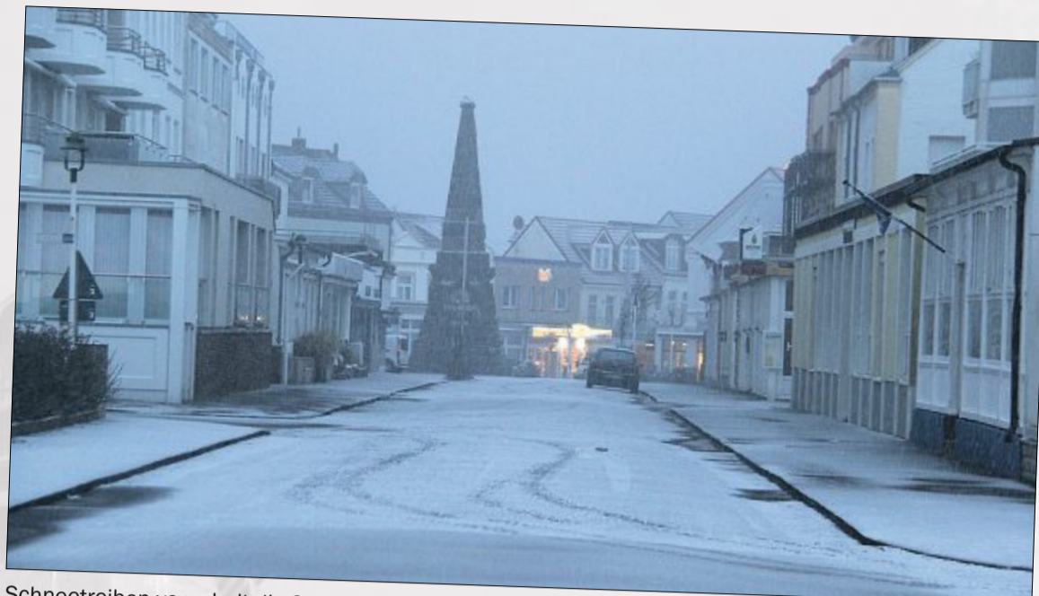
Schneetreiben vernebelt die Straßen. Lange bleibt die weiße Pracht allerdings nicht liegen und auch die Luft klart bald wieder auf, sodass der Blick auf das Denkmal frei wird.