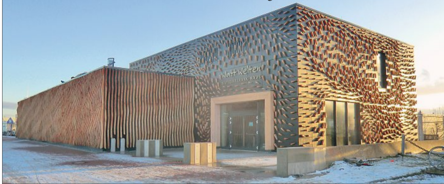
Die Bewegungen von Wind, Watt und Wasser sollen optisch an der Außenfassade des neuen NEZ am Norderneyer Hafen nachgebildet sein. Ende Februar wird es auch endlich etwas von der Ausstellung im Innern des Hauses zu sehen geben.

NEZ Staatssekretärin wird erwartet – Ausstellung sehr erlebnisorientiert