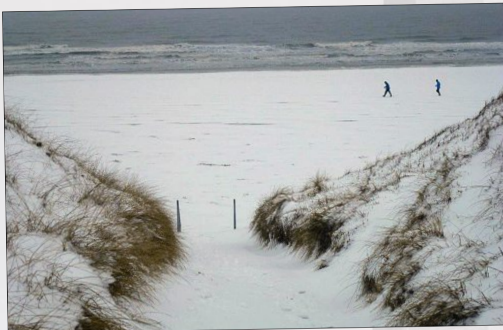
Hat der Strand Bleichmittel abbekommen? Dass die Nordsee direkt an feinen Puder-schnee statt -sand grenzt, kommt nicht so häufig vor.