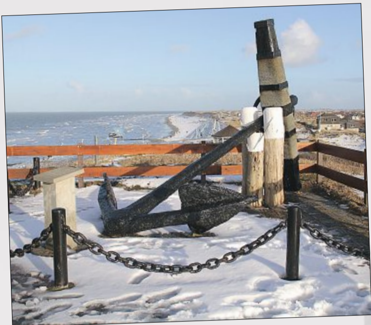
Verschneiter Blick von der Aussichtsdüne Georgshöhe am Januskopf gen Inselosten.