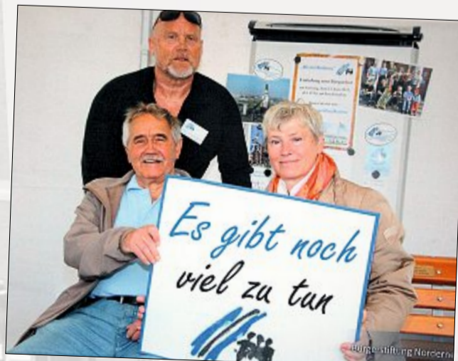
Die Bürgerstiftung weiß, dass es beim Thema Gewalt noch einiges zu tun gibt.

Die Ausstellung „Standpunkte gegen Gewalt“ ist derzeit im Conversationshaus zu sehen. Zum nationalen Tag gegen Gewalt an Frauen und Kindern sind die rund 60 Fotografien aufgehängt worden, auf denen auch zahlreiche Norderneyer nicht nur Gesicht gegen Gewalt zeigen, sondern auch ihre Meinung dazu vertreten. Initiiert wurde das Projekt von den Gleichstellungsbeauftragten im Landkreis Aurich.