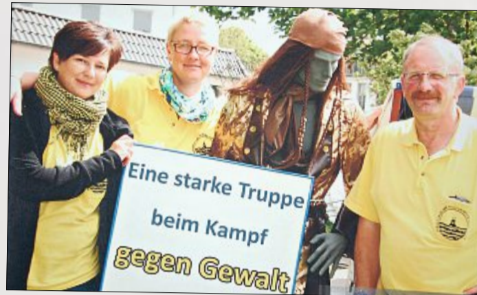
Auch die Mitglieder des Förderkreises der Norderneyer Schulen wollen Gewalt nicht hinnehmen.