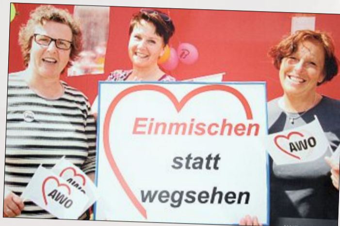
Die Norderneyer Awo-Mitglieder sind für Zivilcourage.