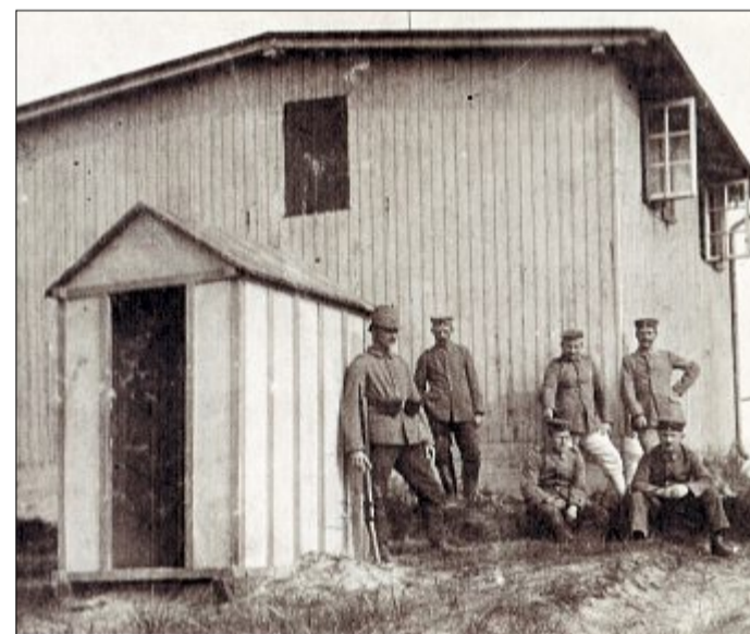
Das fertig renovierte „Wärrerhäuschen“. Es stand auf einer kleinen Düne mit Sicht auf das Wattenmeer.