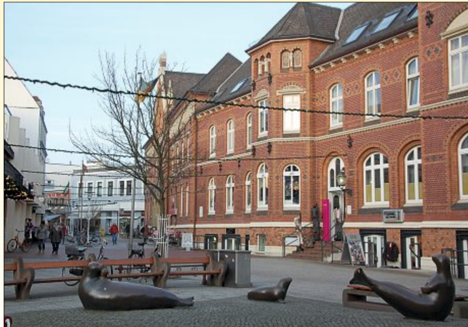
Am morgigen Sonnabend soll gegen 16.30 Uhr in kleinem, feierlichen Rahmen die Weihnachtsbeleuchtung in der Poststraße angeschaltet werden.

Während die vielen kleinen Lichter rund um den Kurplatz bereits brennen, werden auch in der Poststraße die Lämpchen bald