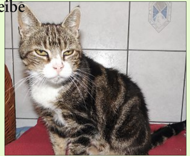
Gaby sucht ein eher ruhiges Zuhause.

Die Öffnungszeiten im Winterhalbjahr sind: täglich von 13.30 bis 16 Uhr und nach Vereinbarung – ausgenommen dienstags, mittwochs und an Feiertagen, dann ist das Tierheim für Besucher geschlossen. Weitere Informationen finden sich zudem im Internet auf www.tierheim-hage.de .