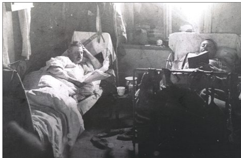
Im Schlafrum der „Vogelkolonie“ ist es sehr eng. Die Feldbetten stammen aus dem Kinderheim Seehospiz. Ein Hocker muss als Nachtschrank herhalten.