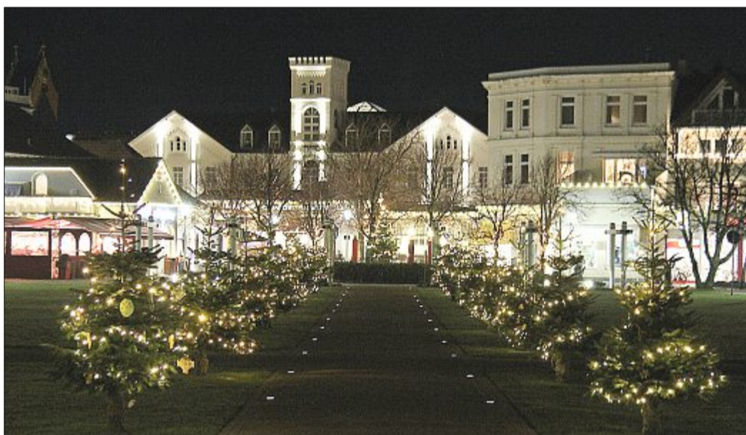
Weihnachtsstimmung auf dem Kurplatz: Wie in jedem Jahr erstrahlt der Stadtkern wieder mit festlicher Beleuchtung und allerlei Adventsschmuck.

Wer sich den Advent auch musikalisch erleben möchte, sollte die vier kleinen Musicals des Kinderchores der evangelischen Gemeinde nicht verpassen. Zu den Themen Glaube, Liebe, Frieden und Hoffnung möchten die Kleinen in diesem Jahr vier sängerische Adventskerzen entzünden, um die Insel