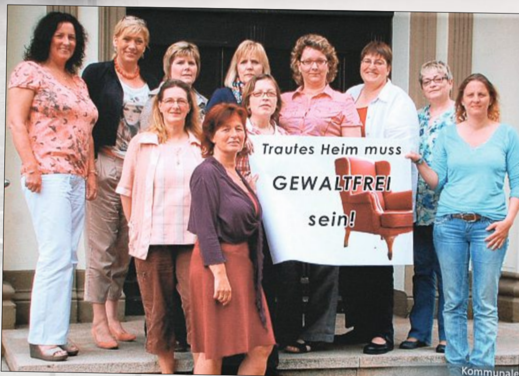
Die Gleichstellungsbeauftragten der Kommunen im Landkreis Aurich setzen sich immer wieder dafür ein, dass es zu Hause gewaltfrei zugeht und Betroffene Hilfe bekommen.