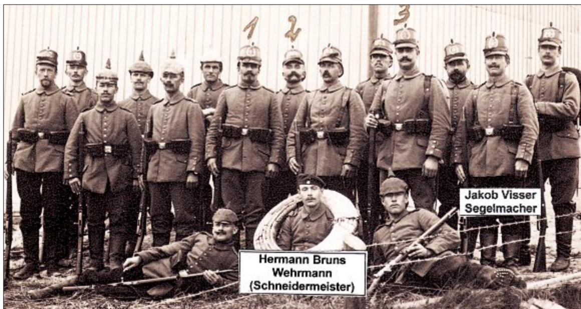
Auf der Rückseite dieses Bildes steht von Wilhelm Becker geschrieben: Ablösung der Wache im September 1914 an der Vogelkolonie in Norderney.