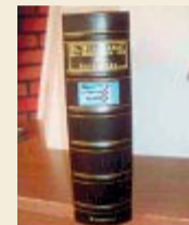
Bearbeitet von: Bonno Eberhardt

Norderney war ein Stützpunkt im Ersten Weltkrieg. Dabei wurde die Insel vor allem durch militärische Bauten in den Jahren 1914 bis 1918 maßgeblich beeinflusst. Bonno Eberhardt hat in sechsjähriger Tätigkeit aufgearbeitet, was damals mit Land und Leuten passiert ist. Seine Ergebnisse stellt er nun innerhalb einer Serie im Norderney Kurier vor.