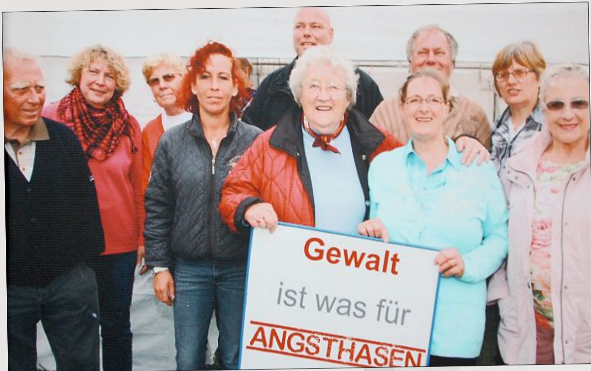
Wer wüsste es besser als die Männer und Frauen vom Rassekaninchenzuchtverein Norderney? „Gewalt ist was für Angsthäsen!“