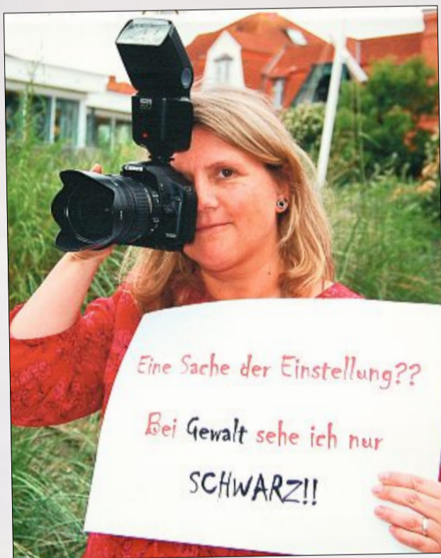
Einen Großteil der Ausstellungsfotos hat Antje Köser aufgenommen.