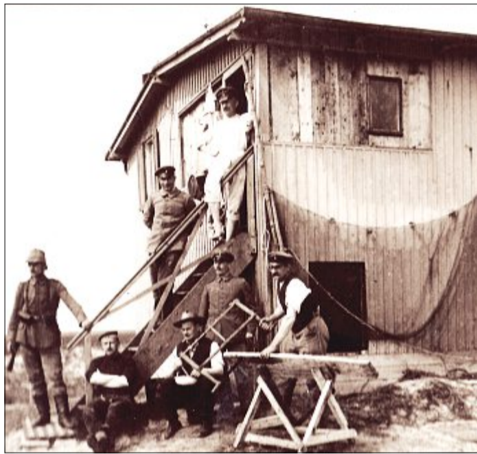
Die Baracke, das ehemalige Vogelwärterhäuschen, im Inselosten wurde trotz 30-jährigen Pachtvertrags der Naturfreunde mit der königlichen Regierung von der Militärverwaltung beschlagnahmt, von Handwerkern der Inselwache instandgesetzt und für eine Gruppe Landwehrmänner wohnbar gemacht.