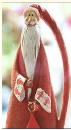
Deko zum Weihnachtsfest.

die Insel auszeichne. „Wer mit offenen Augen durch die Einkaufsstraßen geht, kann die Vielfalt entdecken“, läßt Harms ein, für das Weihnachtssopping zuerst die Geschäfte vor Ort anzusteuern. „Vieles, was es im Internet gibt, bekommt man auch hier“, so Harms. „Der Handel ist im Wandel“, wissen der Verbandsvorsitzende und seine Kollegen nur zu gut. „Auf Norderney bewegen wir uns nach vorn.“