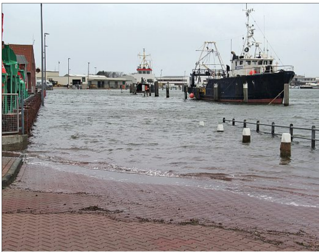
Der Norderneyer Hafen stand am Mittwoch unter Wasser. Mit 1,92 Metern über dem mittleren Tidehochwasser erreichte die Wasserhöhe nicht die einer schweren Sturmflut.

Die Plattformen an der Weißen Düne und am FKK-Strand seien ohnehin bereits zum 15. Oktober abgebaut worden, so Rass. Die letzte Hütte am Westbad sei am Vortag der Sturmflut noch schnell entfernt worden. Auch die Strandkörbe auf den Stränden seien größtenteils bereits abtransportiert. Die noch verbleibenden standen weiter oben in Gruppen zusammen, um so dem Wind mehr Widerstand