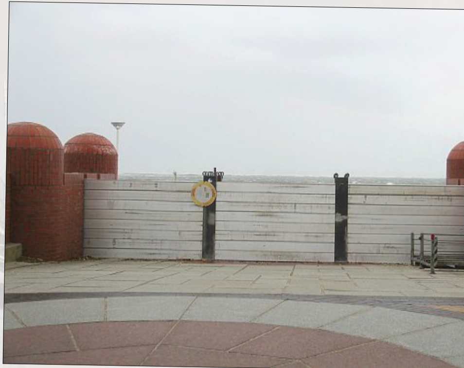
Die Deichscharten auf Norderney, wie hier am Strandaufgang Moltkestraße, waren dicht verschlossen.