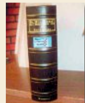
Bearbeitet von: Bonno Eberhardt

Norderney war ein Stützpunkt im Ersten Weltkrieg. Dabei wurde die Insel vor allem durch militärische Bauten in den Jahren 1914 bis 1918 maßgeblich beeinflusst. Bonno Eberhardt hat in sechsjähriger Tätigkeit aufgearbeitet, was damals mit Land und Leuten passiert ist. Seine Ergebnisse stellt er nun innerhalb einer Serie im Norderney Kurier vor.