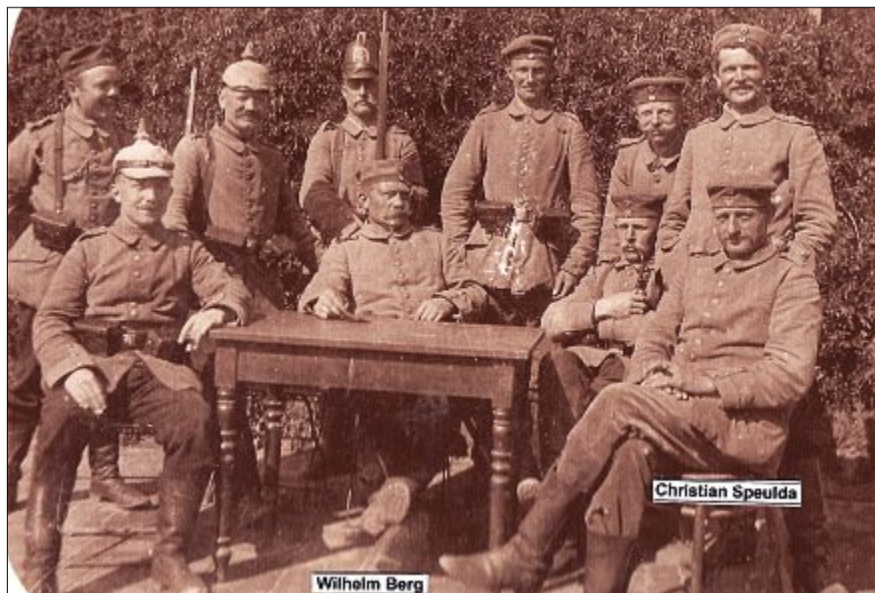
Im Vorgarten des Seehospizes wurde eine wachfreie Gruppe Zeuge, wie das Luftschiff L 16 am 23. September 1915 ihren Kasernenblock überflog.