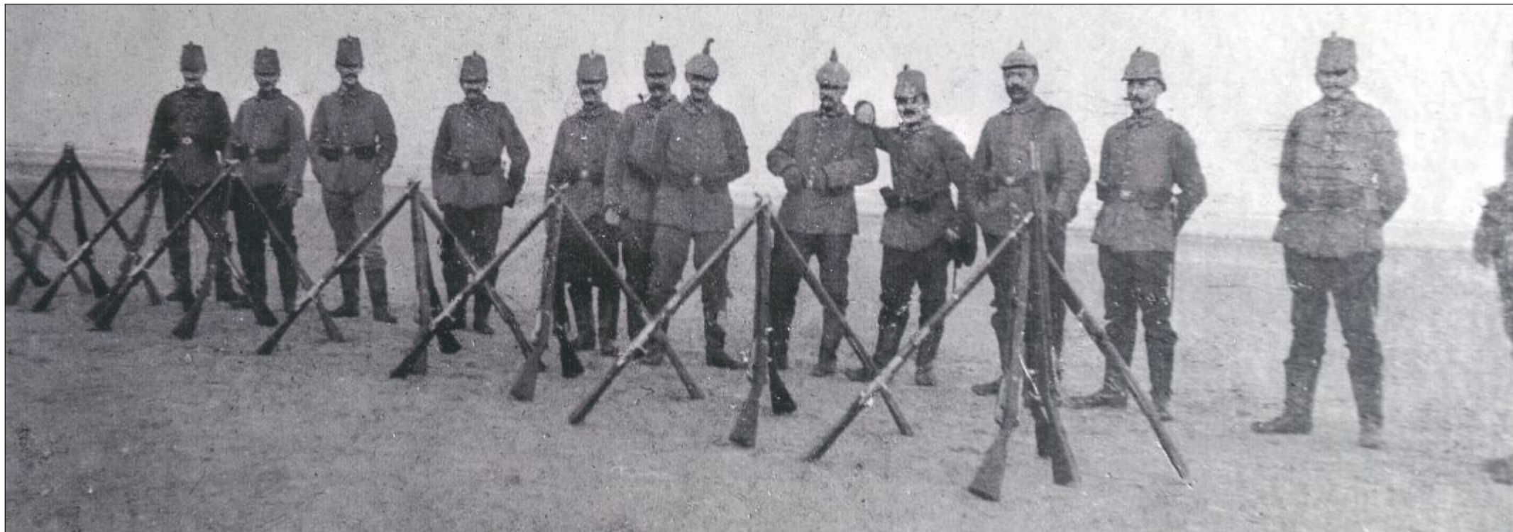
Exerzierübungen am Nordstrand. Die Gewehre zu einer Pyramide zusammenzustellen, haben sie gelernt. Sollte das Gewehr allerdings umfallen und Sand ins Schloss kommen, gab es Probleme.