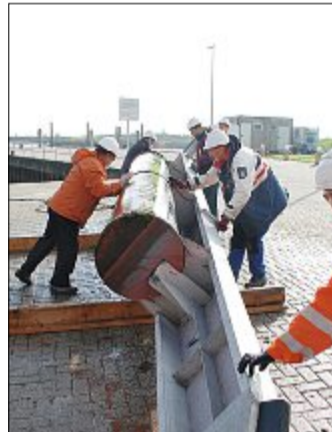
Viele Arbeitsschritte verlangen Handarbeit.