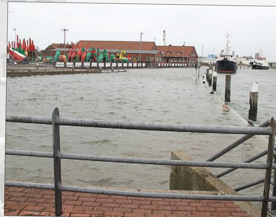
Am Nachmittag stand der Hafenbereich unter Wasser.