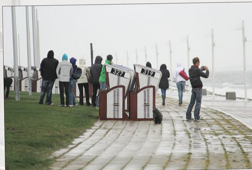
Trotzten Wind und Regen: Einige Schaulustige trauten sich auch bei der stürmischen Wetterlage nach draußen und beobachteten das Naturschauspiel.