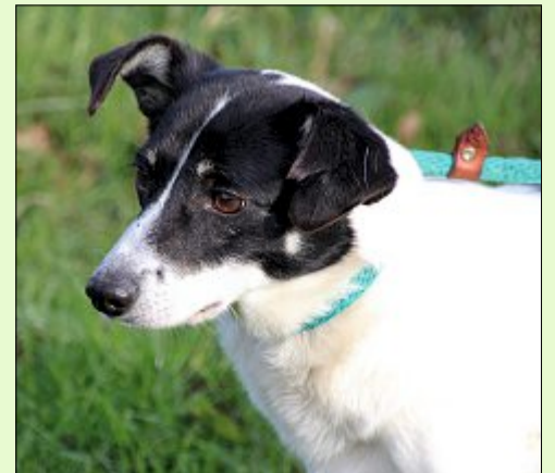
Hündin Kim geht gern spazieren und liebt es, gestreichelt zu werden.

Wer sich für Kim interessiert, kann sich unter Telefon 04938/425 beim bmt-Tierheim Hage melden. Das Telefon ist montags bis freitags von 9 bis 12 Uhr und täglich von 14.30 bis 17 Uhr besetzt. Weitere Infos finden sich zudem im Internet auf www.tierheim-hage.de .