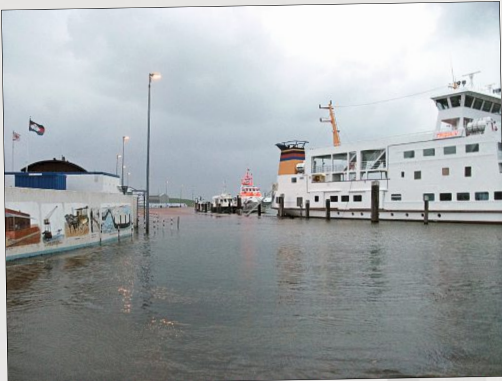
Geflutet: Im Norderneyer Hafen stand das Wasser bereits am Mittwochmorgen gegen kurz nach 8 Uhr zehn bis 15 Zentimeter hoch.