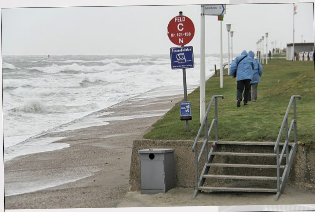
Gegen Mittag peitschten die Wellen an das Ufer der Insel. Spaziergänger mussten darauf achten, keine nassen Füße zu bekommen.