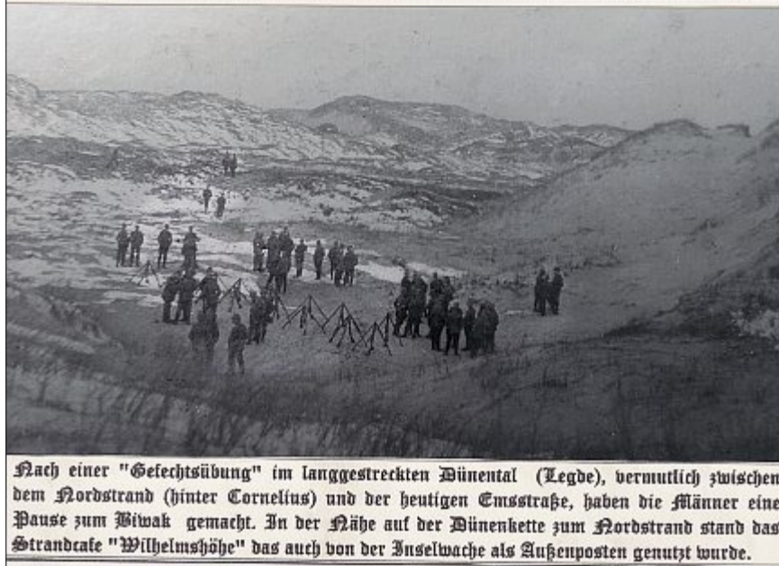
Nach einer „Gefechtsübung“ im langgestreckten Dünenental (Legde), vermutlich zwischen dem Nordstrand (hinter Cornelius) und der heutigen Emsstraße, haben die Männer eine Pause zum Biwak gemacht. In der Nähe auf der Dünenkette zum Nordstrand stand das Strandcafé „Wilhelmshöhe“ das auch von der Inselwache als Außenposten genutzt wurde.