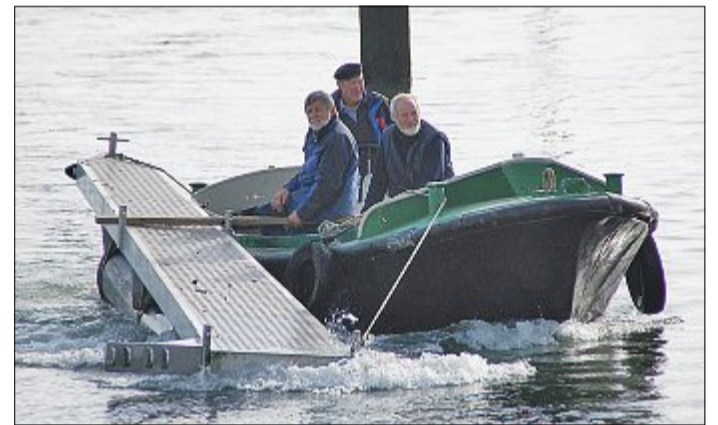
Die sogenannten Fingerstege werden per Boot durch das Hafengebäck zur Reinigungsstation transportiert.

Wer einmal einen Posten bei diesen Arbeiten übernommen habe, der behalte ihn, sagt Karow. Entsprechend eingespielt sind die fleißigen Helfer. Die Arbeiten gehen Hand in Hand. Vor Ort werden die Stege abmontiert und an