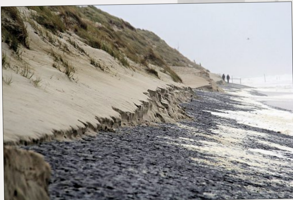
An einigen Stellen der Insel ist aufgrund der hohen Wellen Sand abgetragen worden.