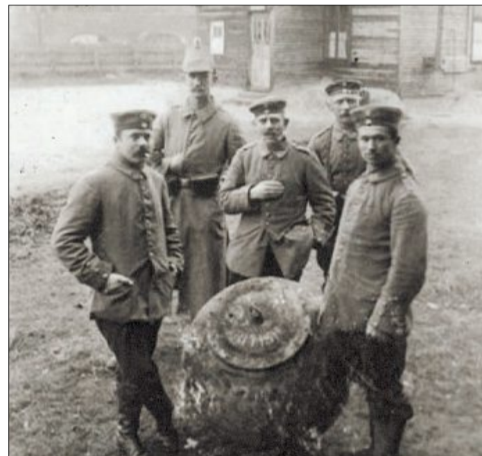
Warum steht die angetriebene Seemine vor der Küchenbaracke? Sollte es etwa eine Drohung an die Köche sein, dass sie ja immer gutes Essen zubereiten? Das Fundstück wurde sicher am Strand von Spezialkräften der Marine entschärft. Wie die schwere Ankertau-Mine transportiert wurde, ist allerdings fraglich.