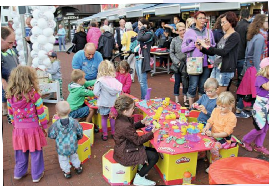
Kein Platz für Langeweile: Auch an die kleinen Gäste wurde gedacht.