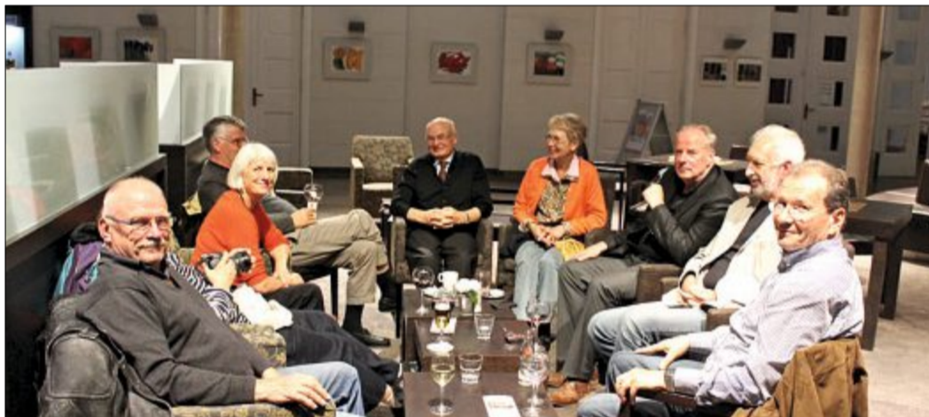
Interessante Vorträge und spannende Gesprächsrunden stehen auch in diesem Jahr auf dem Programm der Sommerakademie.

Bis zum 12. September finden dann die Referate mit anschließender Diskussion jeweils um 19.30 Uhr im Weißen Saal des Conversationshauses statt.