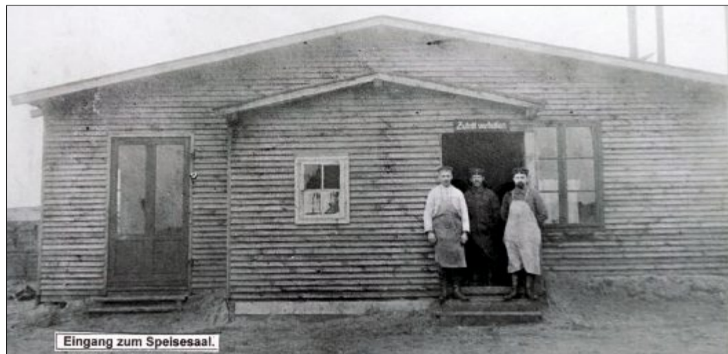
Die Küchenbaracke am Seehospiz. Das untere Bild zeigt zudem zwei Köche und in der Mitte den Proviantmeister. Aus Hygienegründen war der Zutritt nur bestimmten Personen gewährt.