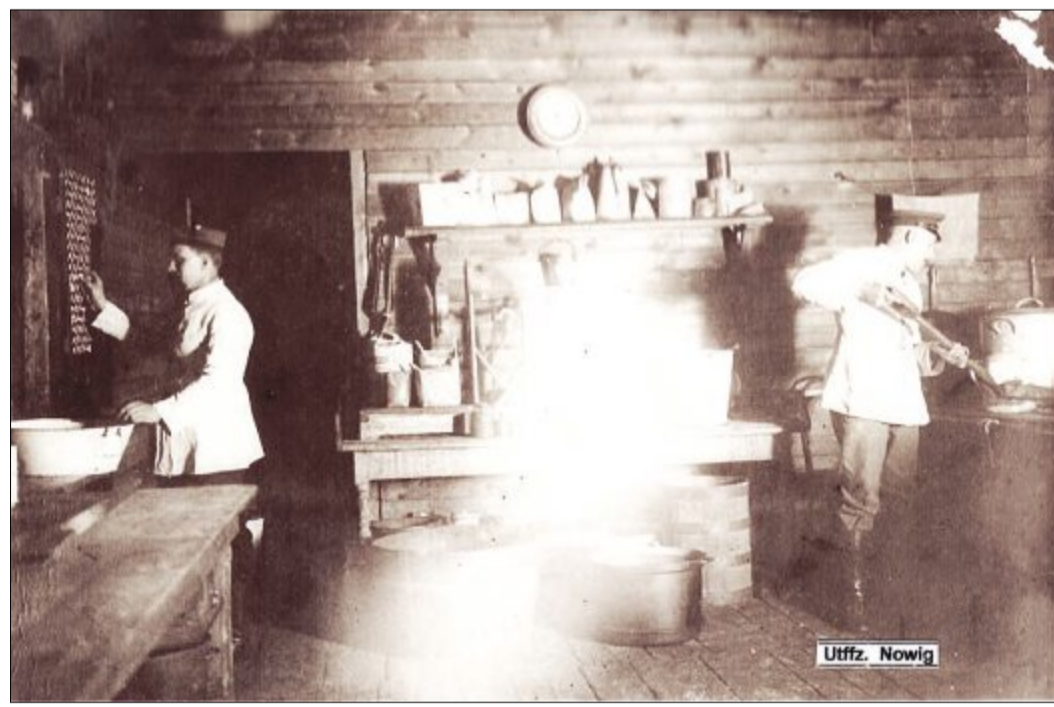
Der Zeiger der Küchenuhr steht auf fünf vor 6 Uhr, die Küchenmannschaft bereitet das Frühstück vor. Der Küchenchef (r.) füllt den Küchenherd mit Kohle auf. Sein Helfer ist an der Tafel bei der Zählung der auszugebenden Portionen. Das Kaffeewasser wird rechts im großen Topf heiß gemacht.