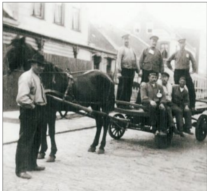
Ein Einspanner der Spedition Fischer in der Luisenstraße. Die Spedition war für den Gütertransport auf der Insel zuständig. Der alte Fischer war ein Pferdefreund.