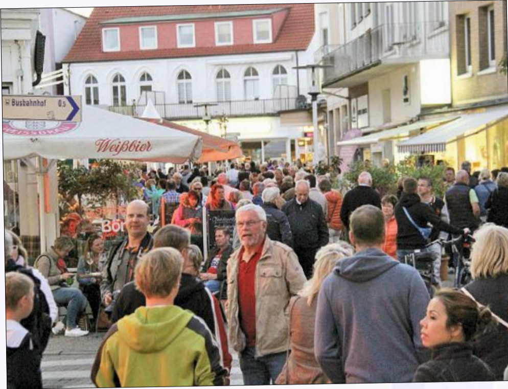
Großer Andrang: Bei angenehmen Temperaturen nutzten Einheimische und Gäste die Gelegenheit für einen ausgelassenen Einkaufsbummel.