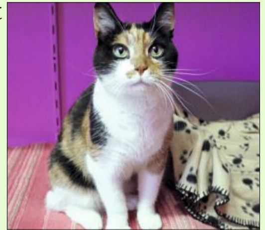
Die Katzendame hat ihren eigenen Kopf

Wer sich für Dornröschen interessiert, kann sich unter Telefon 04938/425 beim bmt-Tierheim Hage melden. Das Telefon ist montags bis freitags von 9 bis 12 Uhr und von 14.30 bis 17 Uhr besetzt. Weitere Infos finden sich zudem im Internet auf www.tierheim-hage.de .