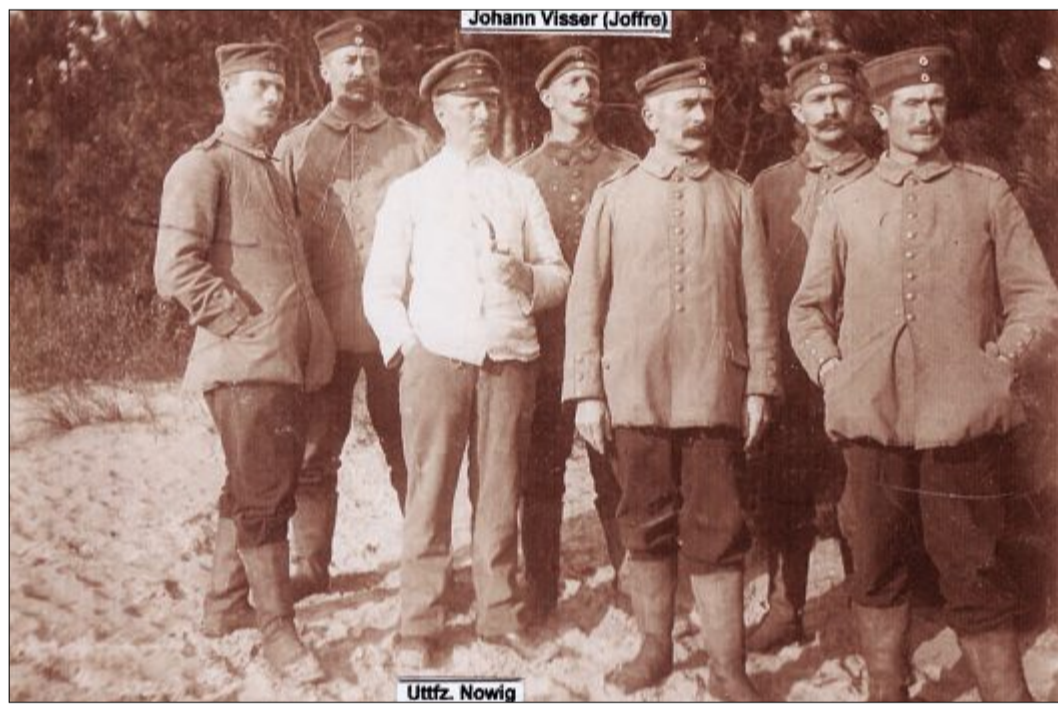
Bekannte Küchenchefs waren die Unteroffiziere Nowig, Tölle, Werner und Berte. Die Norderneyer Soldaten wurden jetzt als Helfer in bestimmten Abständen ausgetauscht, sodass jeder Gemeine einmal den „Küchendienst“ mitmachen musste.