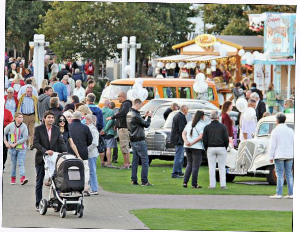
Ein absoluter Hingucker und ein beliebtes Fotomotiv waren die Oldtimer, die auf dem Kurplatz ausgestellt waren.