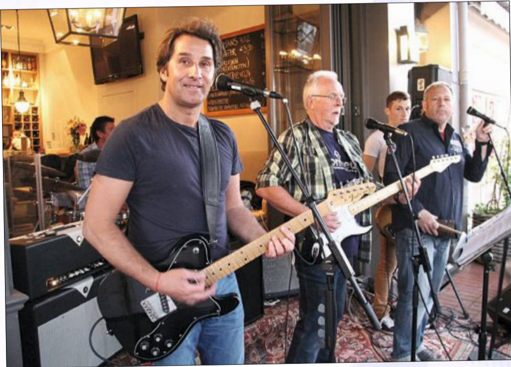
Die Band „Rock Machine“ spielte im Café Friedrich und heizte den Besuchern mit ihrer Musik ordentlich ein.