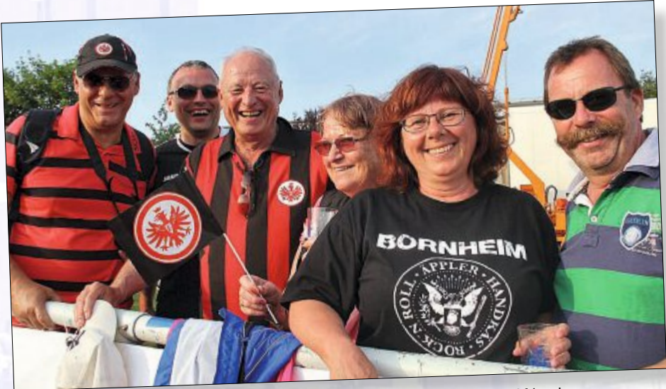
Gut gelaunt sind diese Frankfurt-Fans extra für das Testspiel auf Norderney.