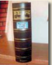
Bearbeitet von: Bonno Eberhardt

Norderney war ein Stützpunkt im Ersten Weltkrieg. Dabei wurde die Insel vor allem durch militärische Bauten in den Jahren 1914 bis 1918 maßgeblich beeinflusst. Bonno Eberhardt hat in sechsjähriger Tätigkeit aufgearbeitet, was damals mit Land und Leuten passiert ist. Seine Ergebnisse stellt er nun innerhalb einer Serie im Norderney Kurier vor.