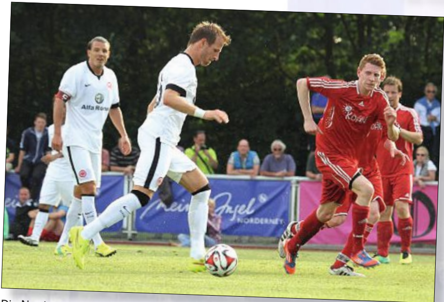
Die Norderneyer versuchen immer wieder, den Frankfurtern den Ball abzuluchsen.