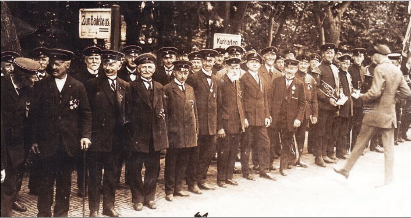
Der Norderneyer Kriegerverein nach dem Ersten Weltkrieg bei einer Aufstellung zu einem Umzug durch den Ortskern in der Bülow-Allee. Viele ehemalige Norderneyer Landsturmänner der „Inselwache“ sind auf dem Foto zu sehen.

Besonders hörbar wurde das „Lied eines Norderneyers“ mit dem Text „Ich bin aus Norderney, ihr müsst mich kennen: Wo man von deutschen