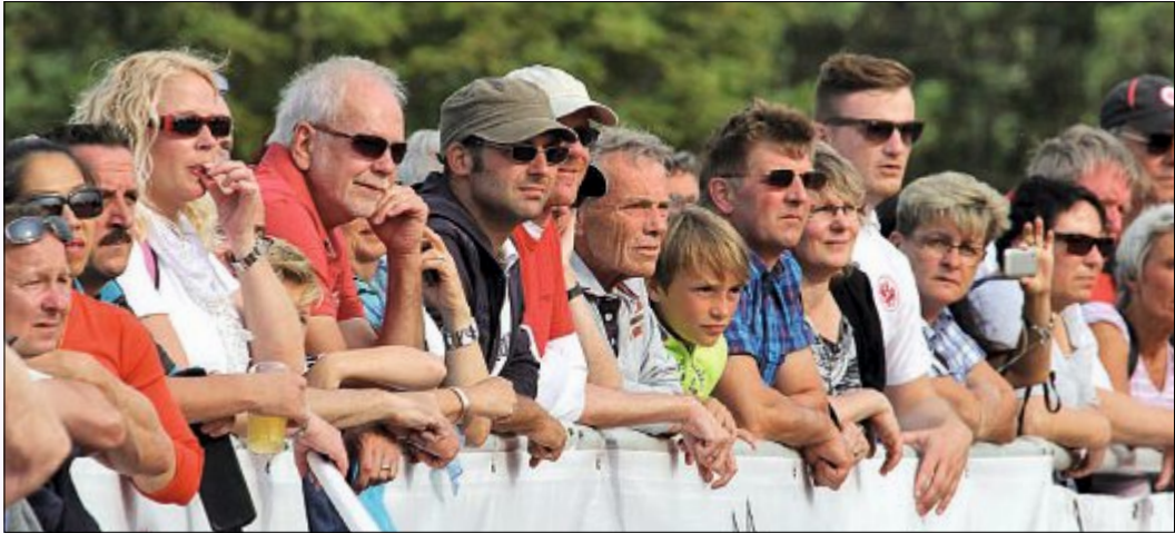
Zwar herrschte kein Andrang wie bei den Testspielen der vergangenen Jahre gegen Werder Bremen, doch zog es an die 600 Zuschauer zu der Partie von Eintracht Frankfurt gegen den TuS Norderney.