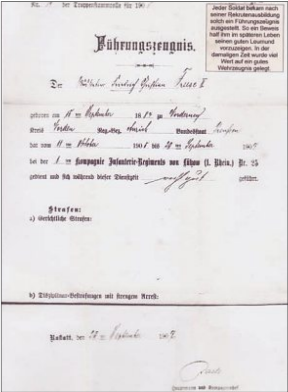
Militärpass und Führungszeugnis waren wichtige Dokumente, um in Friedenszeiten eine Arbeitsstelle zu finden.