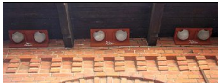
Der Nabu verteilt Nisthilfen für Schwalben.

Leider sei durch eine Vielzahl von Umständen ihr Lebensraum in Deutschland und auch in Niedersachsen bedroht. „Schwalben sind Kulturfolger und nisten in unmittelbarer Nachbarschaft zum Menschen“, erklärt der Nabu. Die modernen Fassaden würden aber nur ungenügenden Halt für ihre Nester bieten. Bei