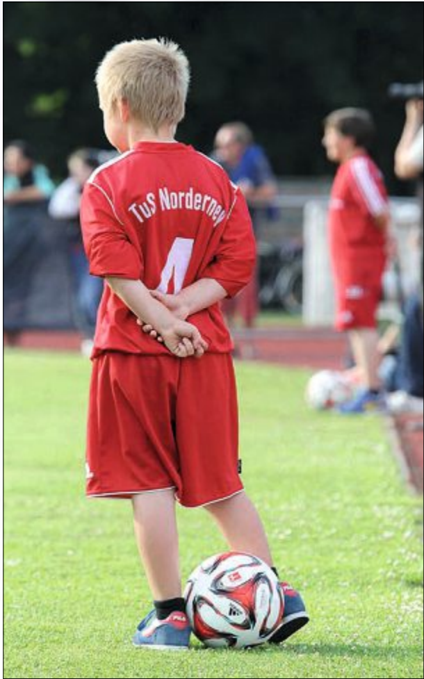
Die Balljungen halten stets Ersatzbälle bereit.