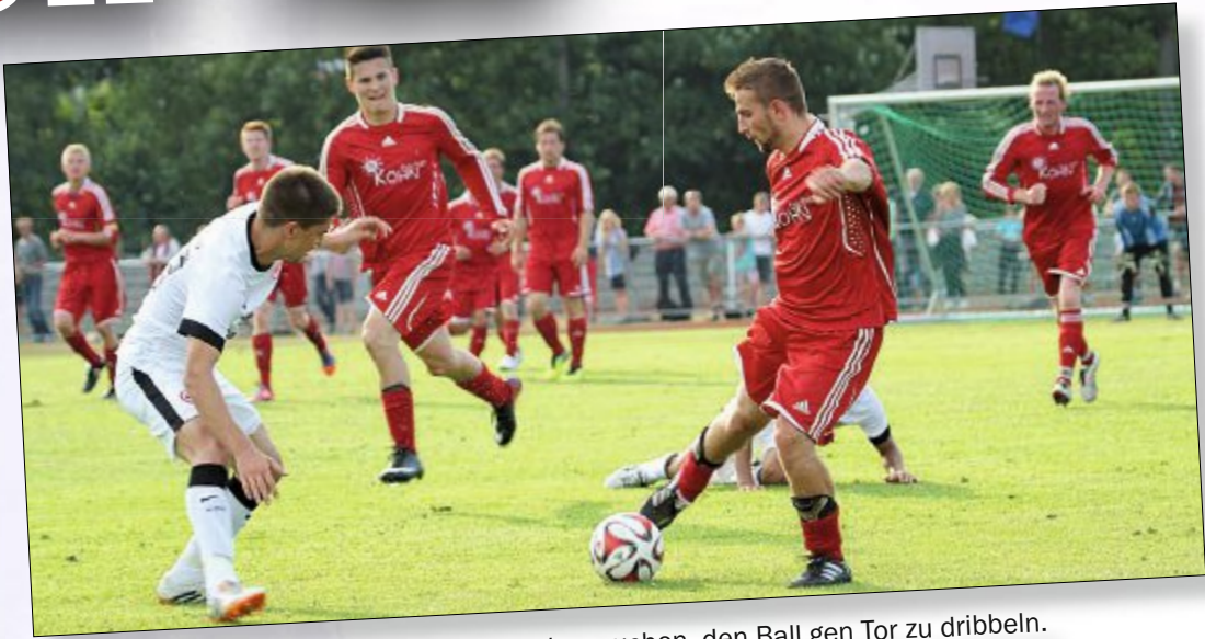
Die Norderneyer beweisen Kampfgeist und versuchen, den Ball gen Tor zu dribbeln.