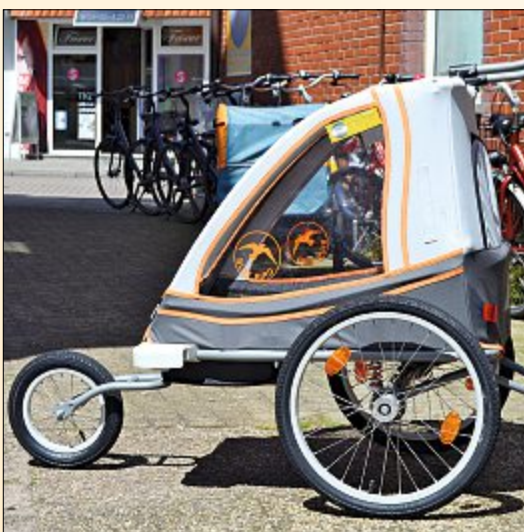
Beim Fahrradverleih Kulle gibt es ebenfalls Fahrrad-Anhänger für Kleinkinder.