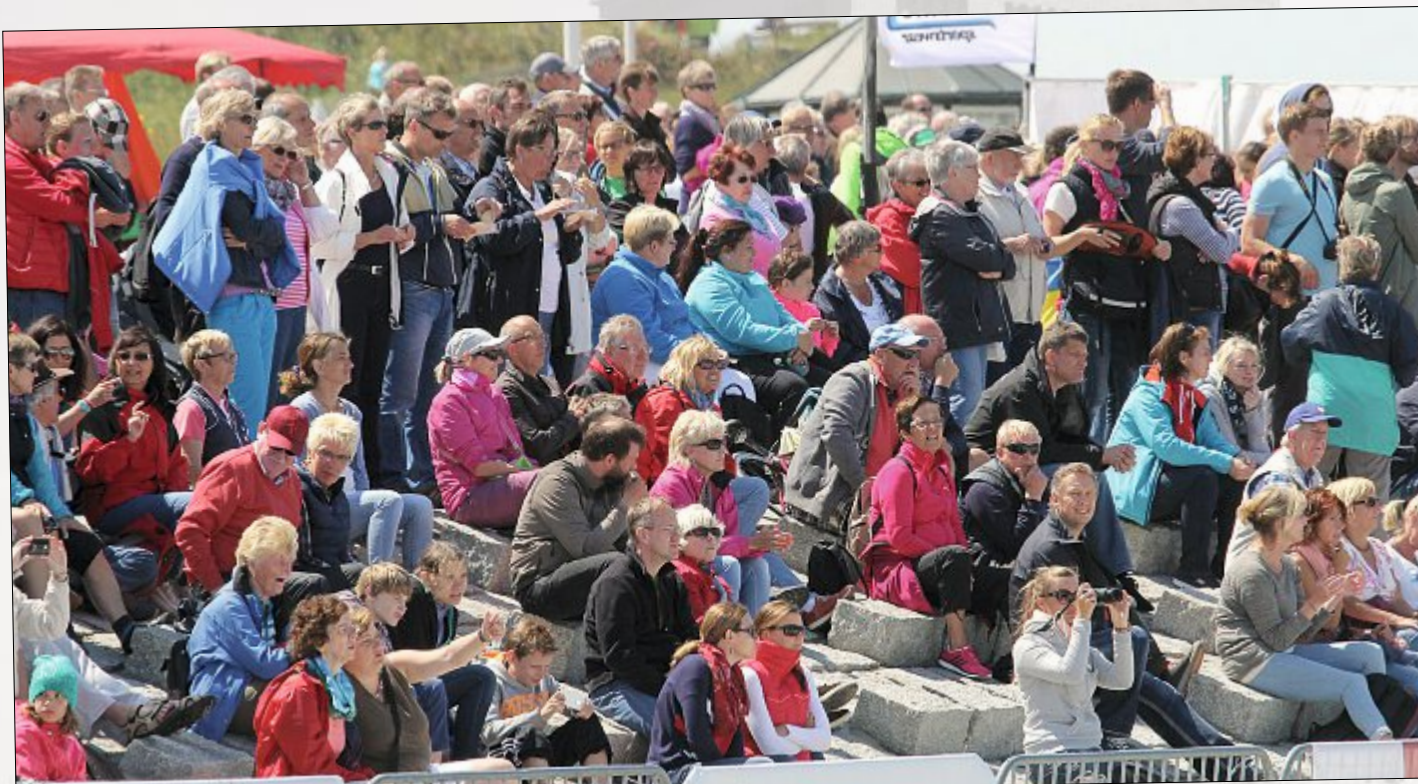
Ein großes Publikum verfolgt den Triathlon in jedem Jahr.