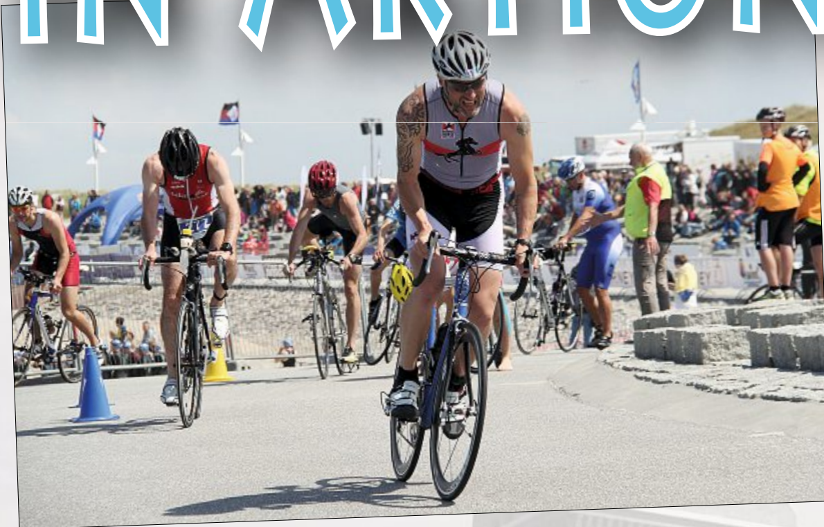
An der Promenade entlang führt die Etappe auf zwei Rädern.