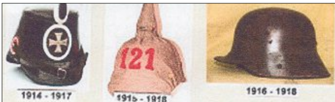
Unterschiedliche Helme aus verschiedenen Kriegsjahren.