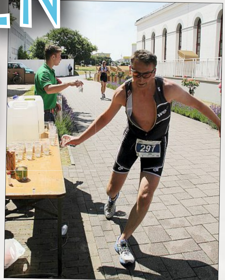
Ein Wasser zur Erfrischung für die Läufer.