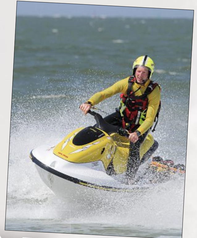
Die DLRG sorgt für die Sicherheit.