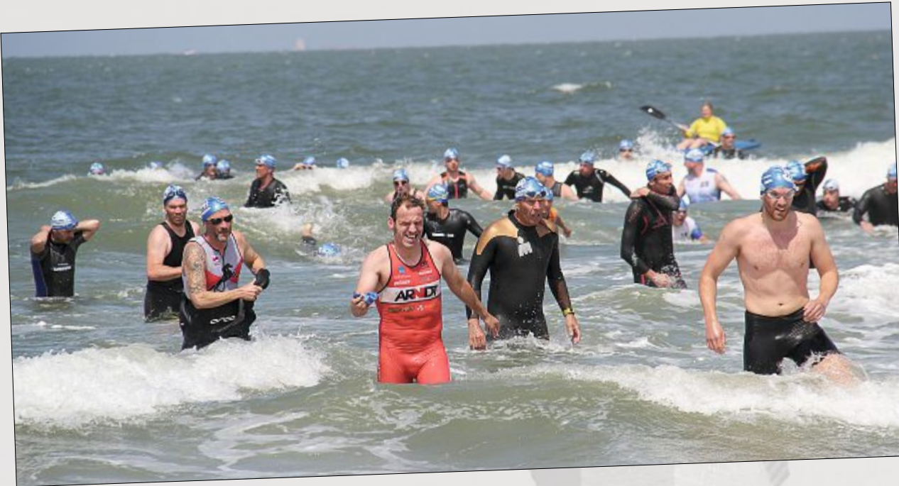
Erste Etappe geschafft! Und nun raus aus dem Wasser...