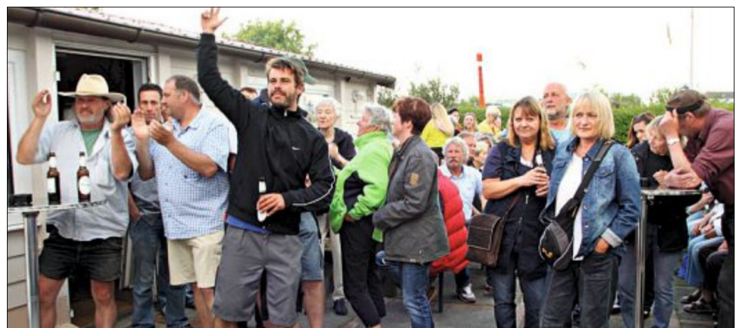
Besten Laune erfreuten sich die Gartenfreunde bei den Kleingärtnern. Zahlreiche Mitglieder und Freunde haben gemeinsam gefeiert.