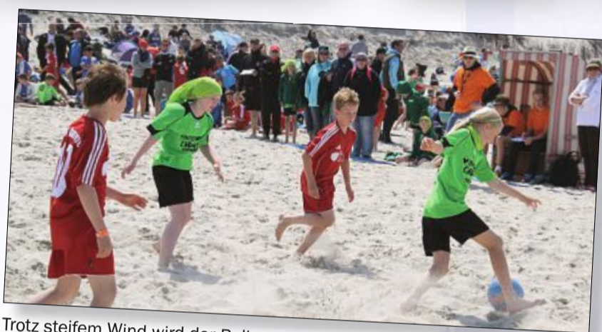
Trotz steifem Wind wird der Ball geradlinig von Tor zu Tor geführt.