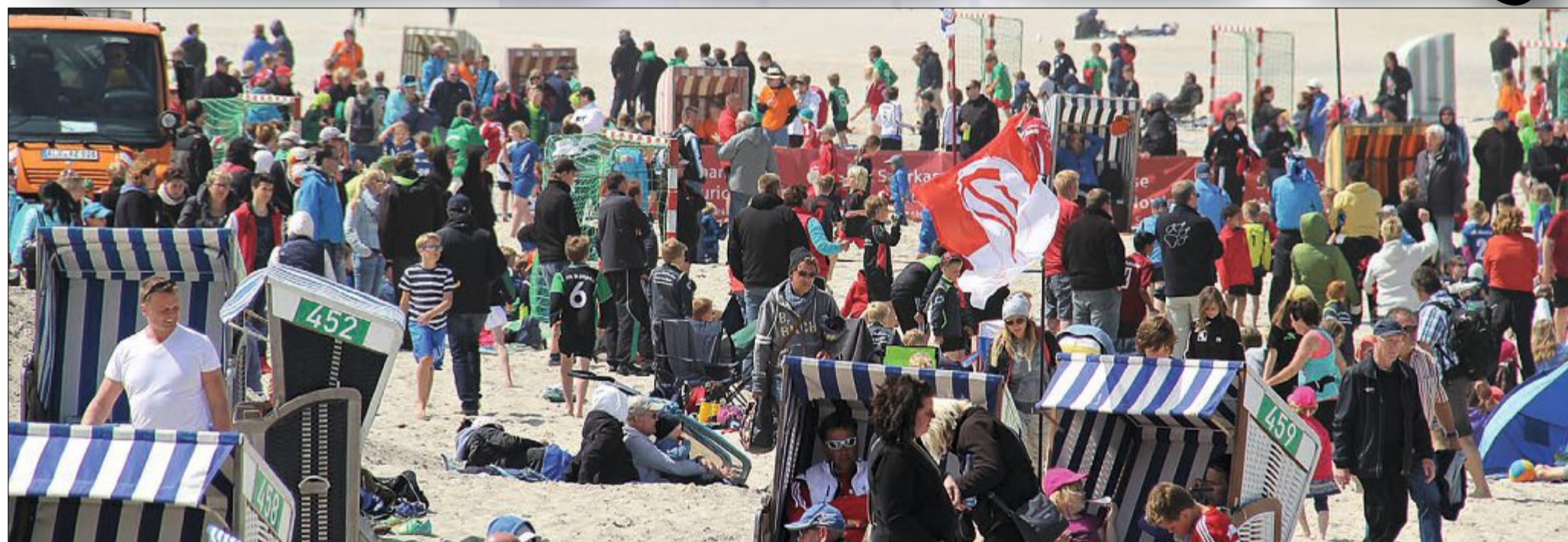
Strahlender Sonnenschein lockt zahlreiche Besucher aus allen Ecken Deutschlands nach Norderney, um den 100 Nachwuchsmannschaften beim 12. Sparkassen Beachsoccer Junior Fun-Cup zuzugucken. Die Stimmung ist gut und die jungen Spieler werden ordentlich angefeuert. Der TuS Norderney kann in gleich zwei der drei Altersklassen den Pokalsieg feiern.