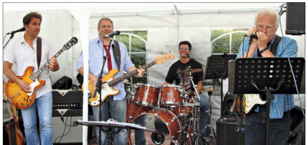
Die Band „Rock Machine“ sorgt immer wieder für gute Stimmung mit ihren Auftritten. Auch beim Frühlingfest der Kleingärtner wurde ordentlich gerockt.

„Im nächsten Jahr wollen alle wieder für solch einen schönen Tag sorgen, wir freuen uns schon jetzt darauf“, ist sich der Vorsitzende sicher, dass das beliebte Fest noch viele Wiederholungen finden wird. Mit einem „Gut und Grün“ grüßt der Verein alle Gartenfreunde und wünscht sich ein weiterhin gesundes Miteinander.