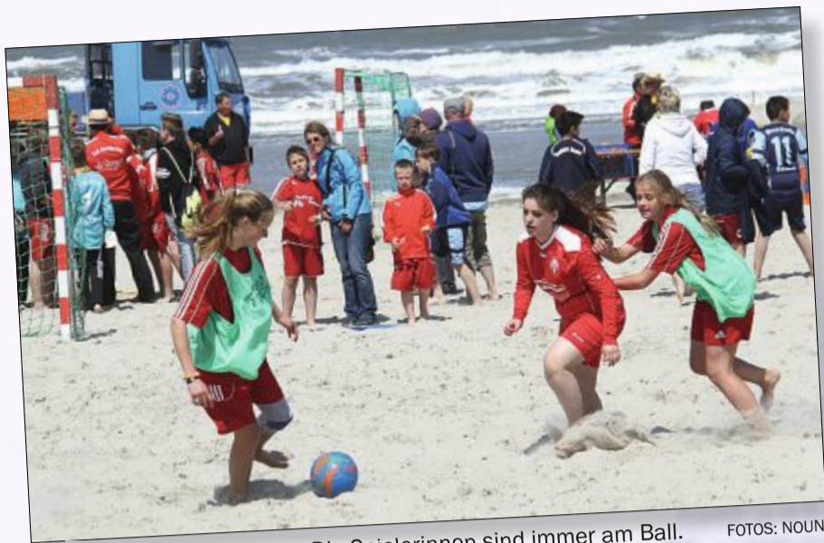
Engagement vom Feinsten: Die Spielerinnen sind immer am Ball.