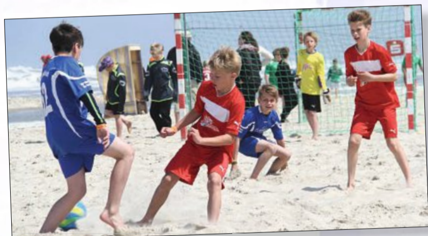
Bei den Zweikämpfen kurz vorm Tor wird es so richtig spannend.