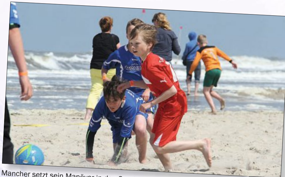
Mancher setzt sein Manöver in den Sand, spielt aber trotzdem energisch weiter.