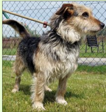
Struppel wurde im Mai gefunden.

Name: Struppel Rasse: Mischling Alter: vier bis fünf Jahre Geschlecht: männlich, nicht kastriert