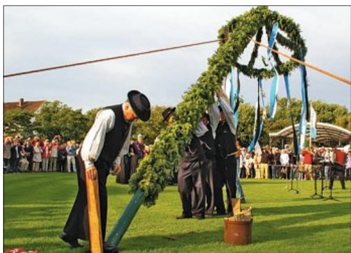
Auch in diesem Jahr werden die Mitglieder des Heimatvereins und die Seenotretter den traditionell geschmückten Pfingstbaum auf dem Kurplatz aufstellen.

TRADITION Heimatverein und Seenotretter stellen Norderneyer Pfingstbaum auf