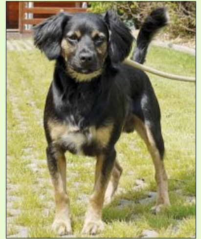
Waldemars Herkunft ist dem Tierheim nicht bekannt.

Waldemar (rechtes Bild), so haben die Hager Tierfreunde ihn genannt, wurde Mitte Mai in Norden in der Nähe des Wasserturms aufgefunden. Viel ist über den kastrierten Rüden nicht bekannt. Derzeit versuchen die Tierheimmitarbeiter noch, Waldemars Herkunft zu klären und seinen Besitzer zu finden. Das Tier ist leider weder tätowiert noch gechippt. Gelingt das nicht, soll der hübsche Vierbeiner möglichst schnell in ein neues Zuhause vermittelt werden.