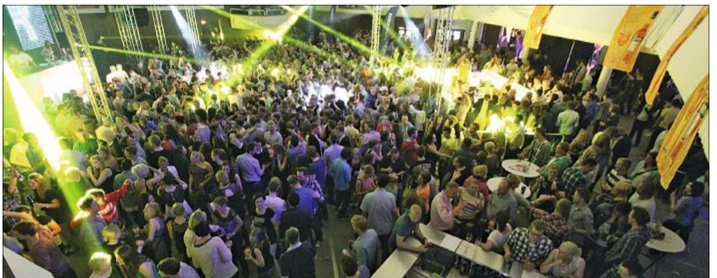
Die legendären White-Sands-Partys sind fester Bestandteil des Festivals.