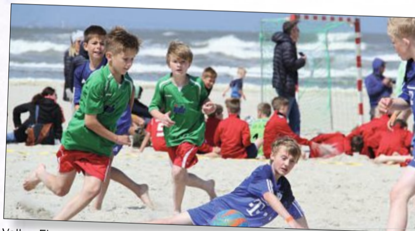
Vollen Einsatz haben die jungen Fußballer am Wochenende gezeigt.