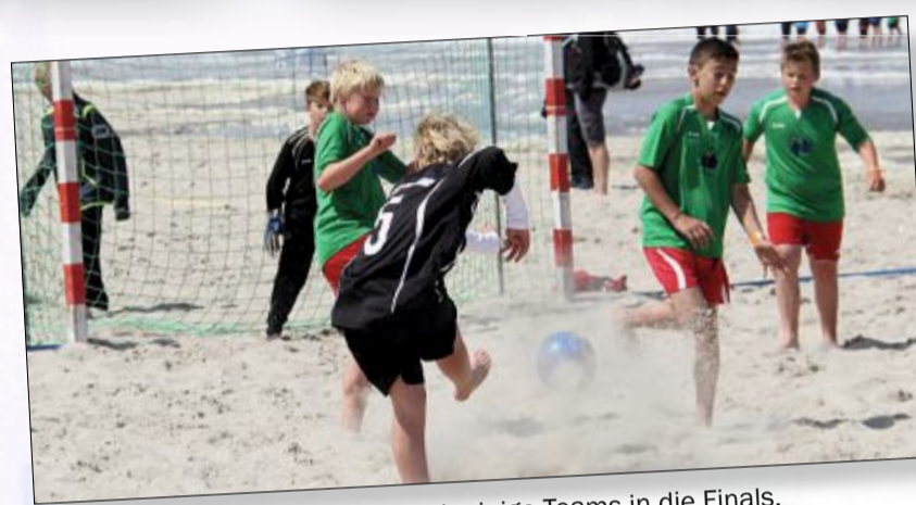
Volltreffer: Zielsicher schießen sich einige Teams in die Finals.