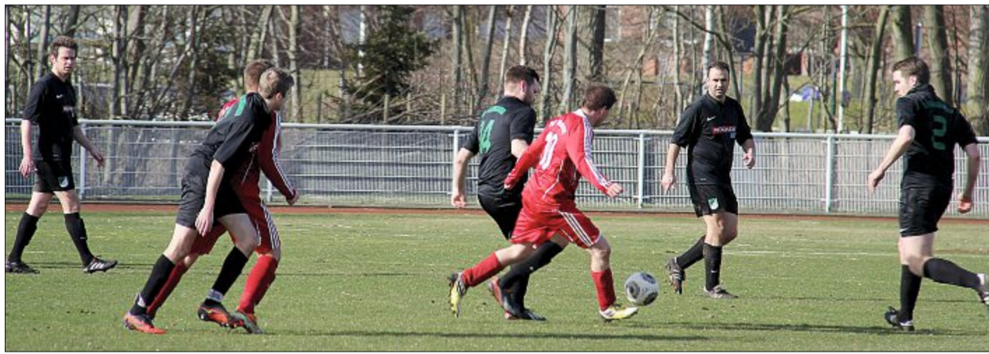
Mit einem Unentschieden gegen den SV Wallinghausen sind die TuS-Kicker in die Rückrunde gestartet.

NORDERNEY - Um Punkt 20 Uhr hatte die Online-Anmeldung zum zweiten Wind Sportswear Inselschwimmen der DLRG Norderney geöffnet und nur knapp 30 Minuten später wurde sie auch schon wieder geschlossen. Ruck, zuck waren alle 300 Startplätze komplett ausgebucht. Aufgrund der großen Nachfrage haben die Verantwortlichen bereits eine Warteliste für Nachrücker eingerichtet. Über das Kontaktformular der Internetseite www.inselschwimmen-norderney.de kann man sich auf die Warteliste setzen lassen. Ebenso erhält man alle wichtigen Informationen zur Veranstaltung am 10. August auf dieser Internetseite.