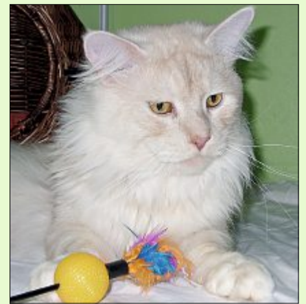
Happy ist ein zutraulicher und verschmüsst lieber Kerl.

Wer sich für Happy interessiert, kann sich unter Telefon 04938/425 beim bmt-Tierheim Hage melden. Das Telefon ist montags bis freitags von 9 bis 12 Uhr und von 14.30 bis 17 Uhr besetzt. Weitere Infos und Öffnungszeiten finden sich zudem im Internet auf www.tierheim-hage.de .