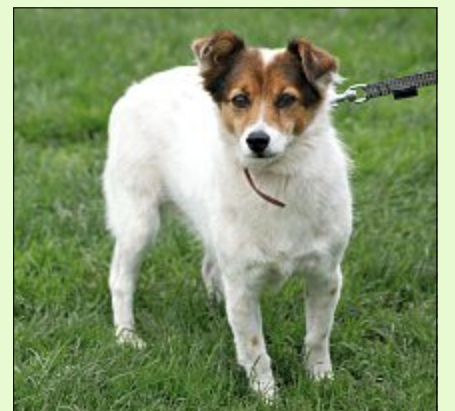
Die freundliche Dina verträgt sich gut mit ihren Artgenossen.

Wenn Sie glauben, dass Dina der richtige Hund für Sie ist, melden Sie sich bitte beim bmt - Tierheim Hage unter Telefon 04938/425. Das Telefon ist täglich von 14.30 bis 17 Uhr besetzt. Weitere Informationen und Tiere finden sich auf der Homepage unter www.tierheim-hage.de .