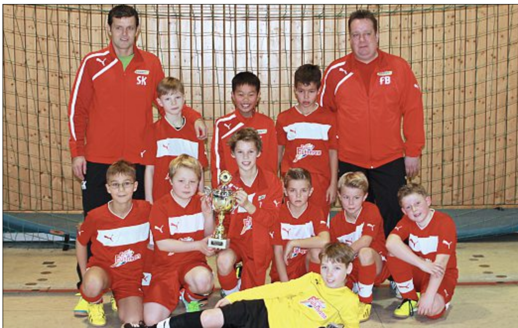
Die E-I-Jugend zeigte eine tolle Leistung beim Uhren-Eilers-Cup in Norden.