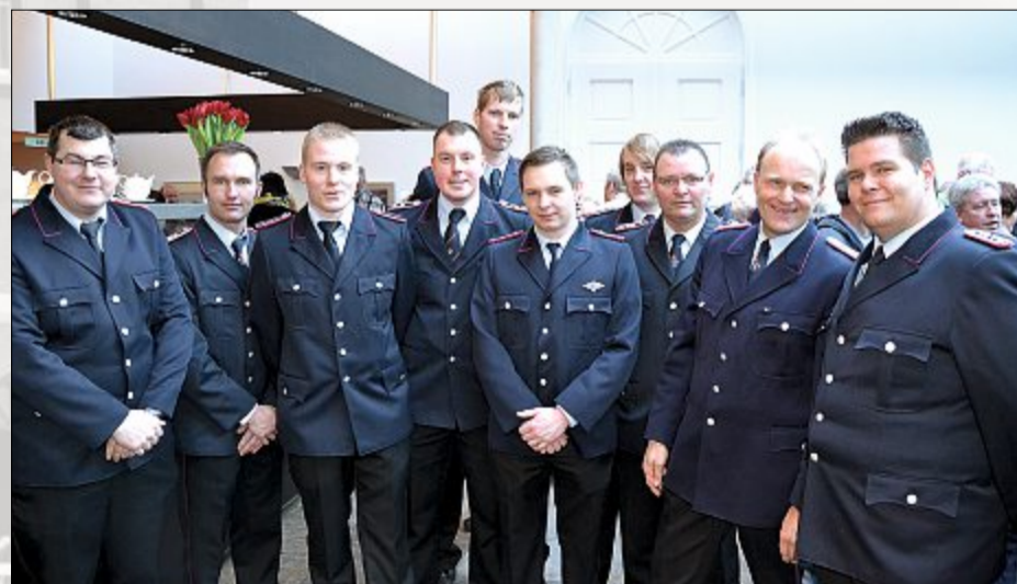
Seltener Gast – zumindest in der schneigen Uniform: die Feuerwehr. Diesmal waren die Männer aber nicht im Einsatz, sondern einmal ohne Löschauftrag unterwegs.