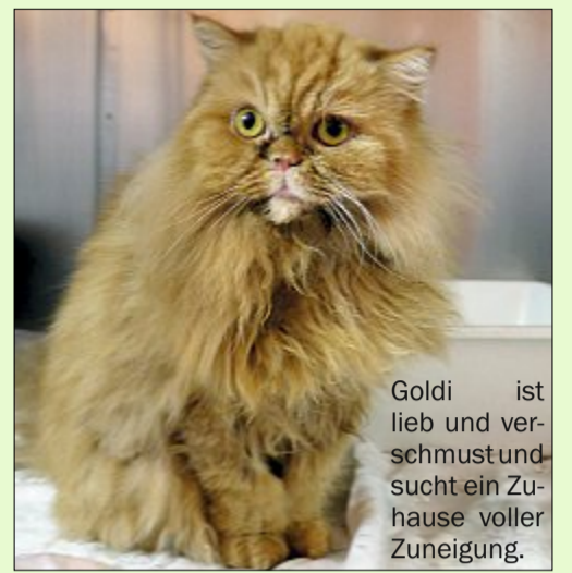
Goldi ist lieb und verschmust und sucht ein Zuhause voller Zuneigung.

Wer sich für Goldi interessiert, wird gebeten, sich beim bmt-Tierheim Hage unter Telefon 04938/425 zu melden. Das Telefon ist montags bis freitags von 9 bis 12 Uhr und von 14.30 bis 17 Uhr besetzt. Weitere Infos und Öffnungszeiten finden sich zudem im Internet auf www.tierheim-hage.de .