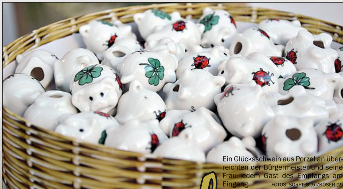
Ein Glücksschwein aus Porzellan überreichten der Bürgermeister und seine Frau jedem Gast des Empfangs am Eingang.