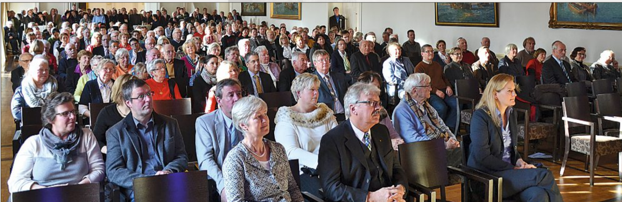
Erneut ein gut gefüllter Saal: Rund 300 Gäste folgten der Rede des Bürgermeisters beim Neujahrsempfang von Stadt und Rat.