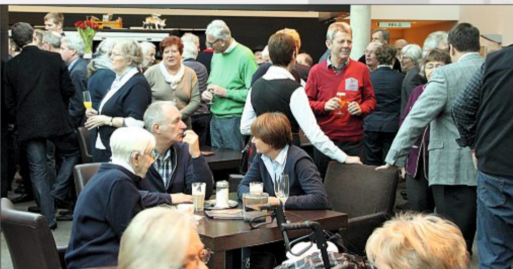
Im Foyer des Conversationshauses konnte nach der Veranstaltung noch gemeinsam geplaudert und auf ein gesundes 2014 angestoßen werden.