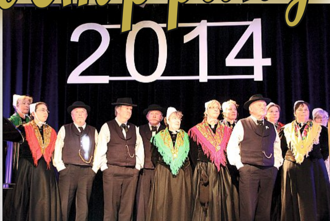
Als besonders verdiente Gruppe der Insel wurde in diesem Jahr der Heimatverein geehrt. Die Brauchtumpflege trage dazu bei, die Insel als Heimat zu bewahren.