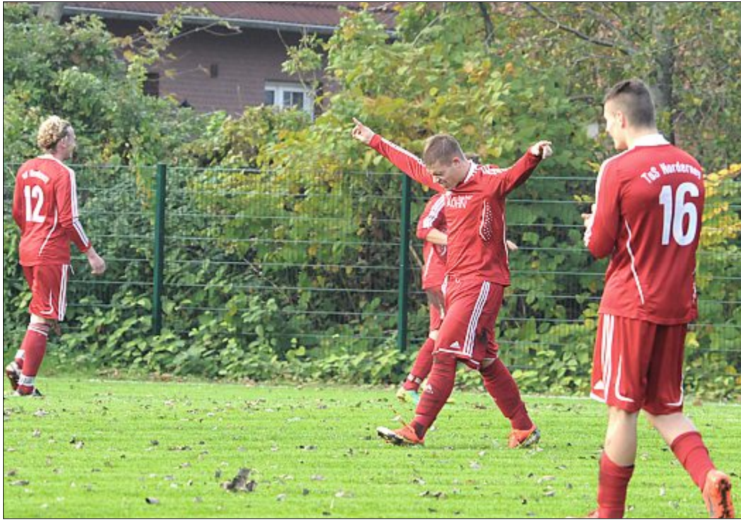
Normalerweise sind die TuS-Herren bei ihren Spielen unter freiem Himmel anzutreffen. Ein Hallenturnier, wie jüngst in Obenstrohe, bietet der Elf eine willkommene Abwechslung. ARCHIVFOTO

Gegen den TuS Ekern drehte das Team einen Rückstand in eine 2:1-Führung, doch plötzlich riss Ekern das Ruder wieder herum und führte mit 2:3. Das Ausscheiden vor Augen, legten die Norderneyer einen furiosen Schlusspurt hin und er-