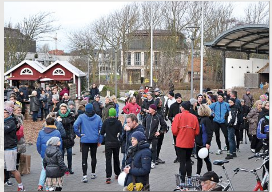
...oder im Wintermantel einfach nur zugeguckt.