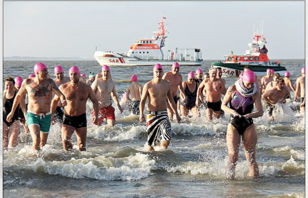
...pünktlich zum Beginn des neuen Jahres in die eisig kalte Nordsee – ein neuer Rekord.