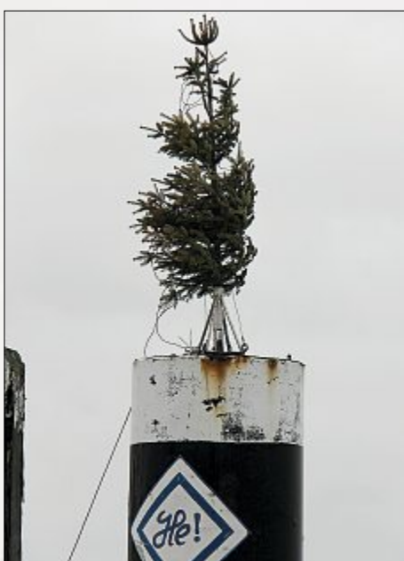
Noch ein Weihnachtsgruß...