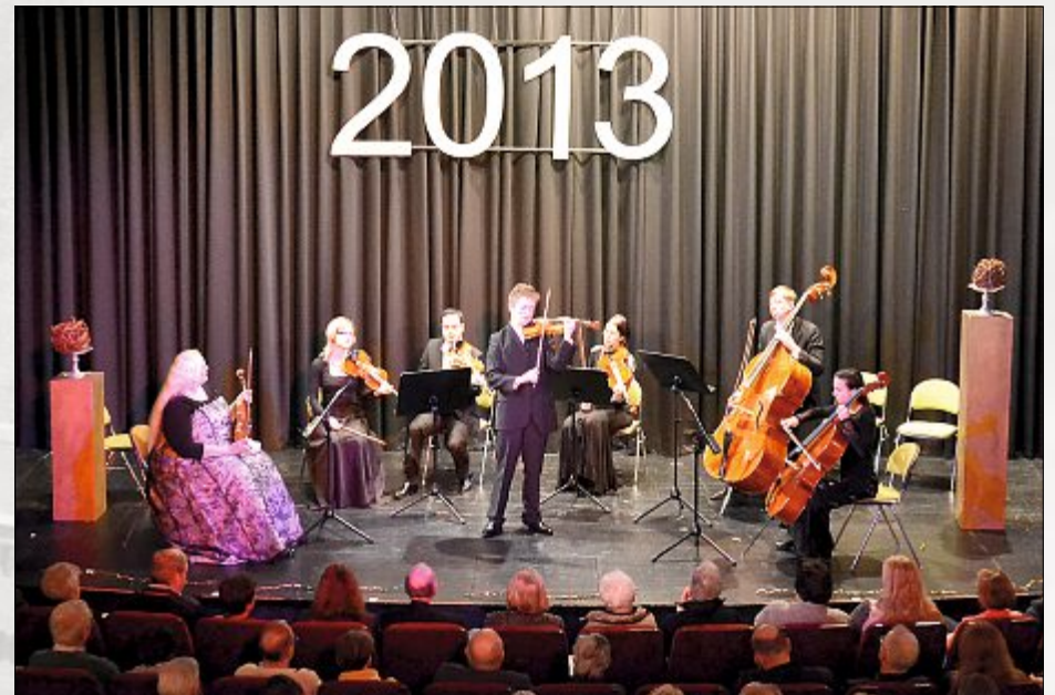
Klassischer Jahresausklang mit den Kölner Philharmonikern im Kurtheater.