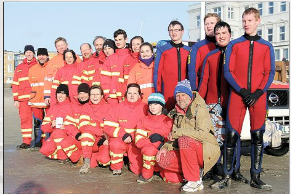
Die fleißigen und unverzichtbaren Helfer und Retter der DLRG.