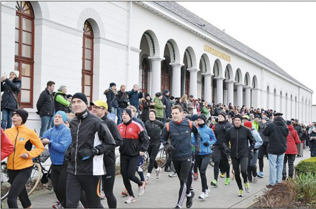
Zum Silvesterlauf haben sich wieder viele in ihre Sportkleidung geworfen...