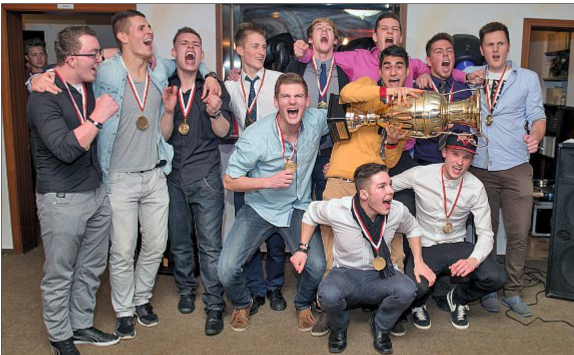
Strahlende Sieger des 30. Neujahrsturniers auf der Insel: Der Kampfgeist des Teams „Kamikaze“ wurde mit dem Wanderpokal belohnt.

Am Freitag sah es laut Harms noch nach einer Titelverteidigung des Ausrichters „Ganja“ aus, der jedes Spiel am ersten Spieltag gewinnen konnte und auch den späteren Titelträger verdient besiegte. Der Knackpunkt sollte jedoch am Sonnabend das Spiel gegen „Team Bacardi Jr.“ sein, das einen überraschenden und sensationellen Finaleinzug feiern konnte.