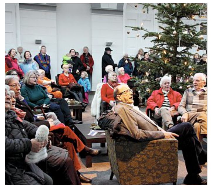
Wer zwischen den Liedern noch eine Kleinigkeit spenden wollte, konnte gleichzeitig den Heimatverein unterstützen.