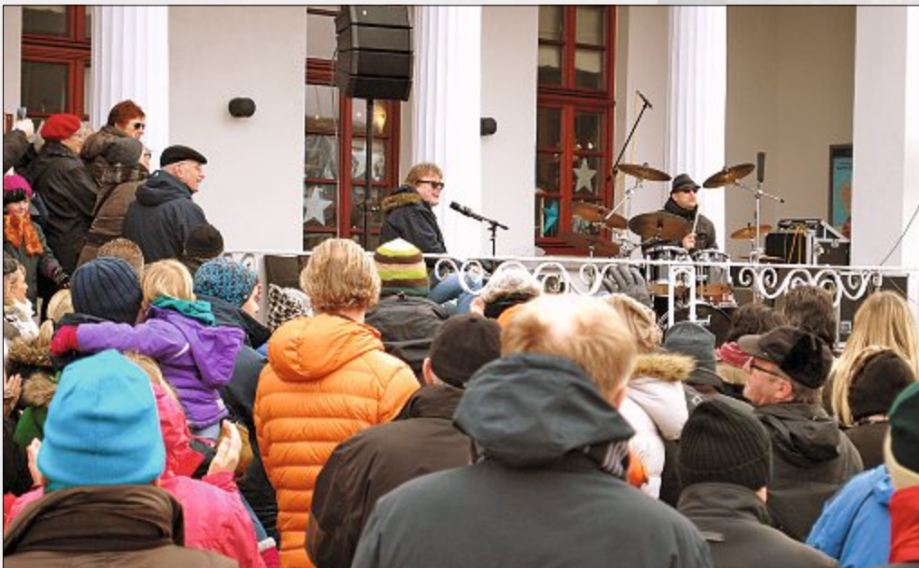
Das Duo „Bluenight Boogie“ begeisterte erneut am Neujahrstag auf dem Kurplatz.