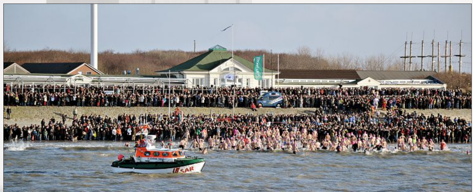
Lebendige Tradition: Tausende Zuschauer und Hunderte Schwimmer sind Teil des diesjährigen Anbadens.