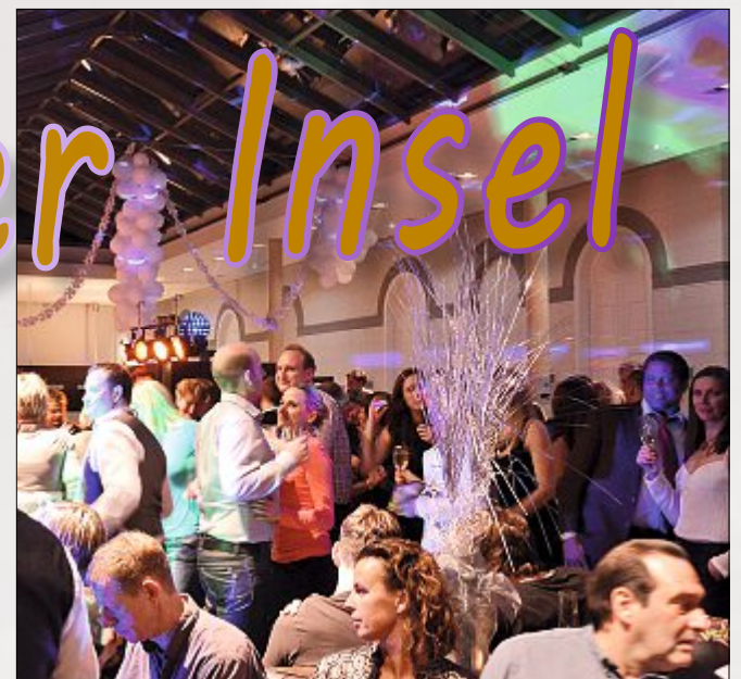
Silvesterparty im Conversationshaus.