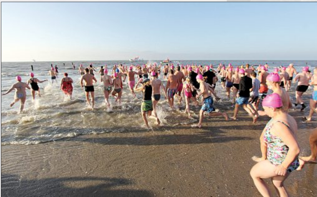
Hinein in das kühle Nass!