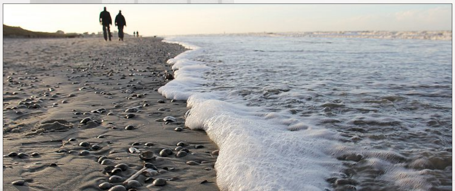
...und dann gemütlich bei herrlichem Sonnenschein ins neue Jahr spaziert.