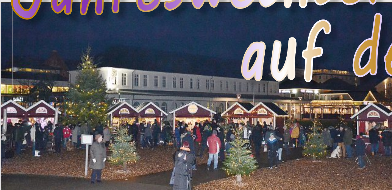
Spezialitäten und gute Unterhaltung in heimeliger Atmosphäre brachte auch erneut der Winterzauber am Kurplatz.