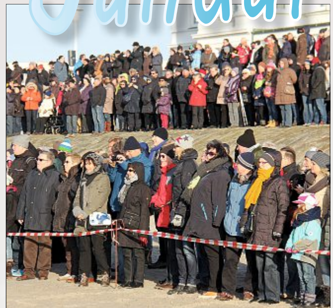
Viele begehrte Plätze am trockenen Ufer.