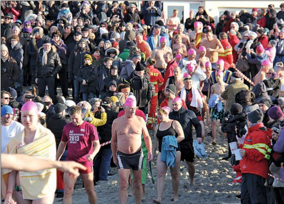
Unter den Augen der Seenotretter trauen sich über 300 Einheimische und Gäste...