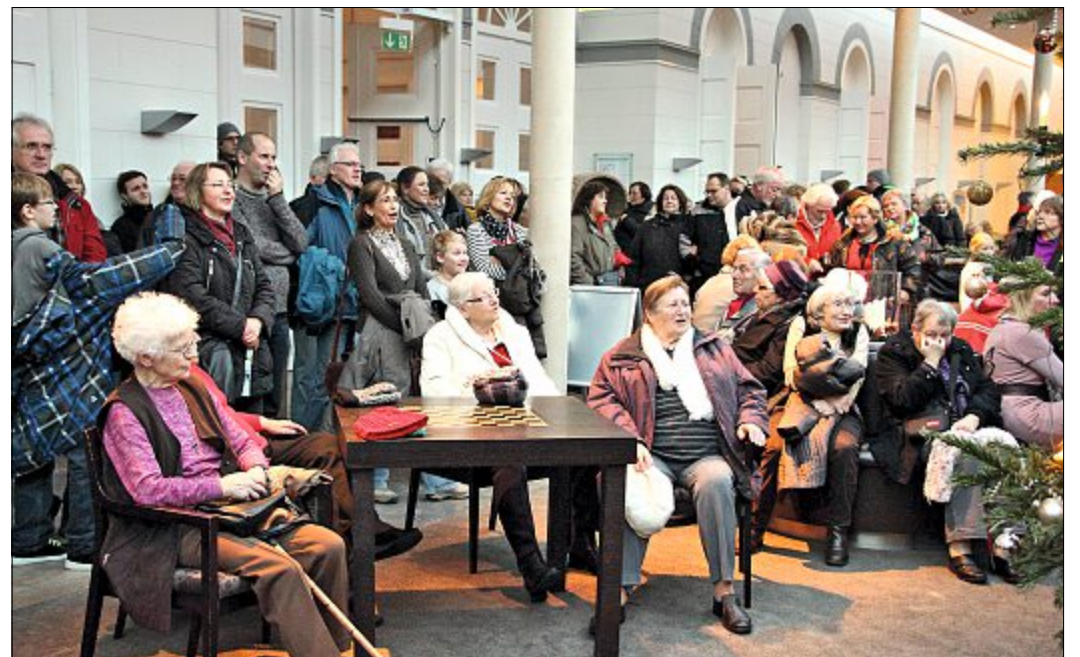
Viele Norderneyer und Gäste haben das gemeinsame Singen von Weihnachtsliedern in dem gemütlichen Ambiente der Orangerie im Conversationshaus Norderney genossen.

Im Programm waren die alten traditionellen und kirchlichen Lieder wie „Stille Nacht, heilige Nacht“, „Oh Tannenbaum“ oder „Leise rieselt der Schnee“, die gesungen wurden und die viele Besucher auch ohne Vorlage textsicher mit anstimmen