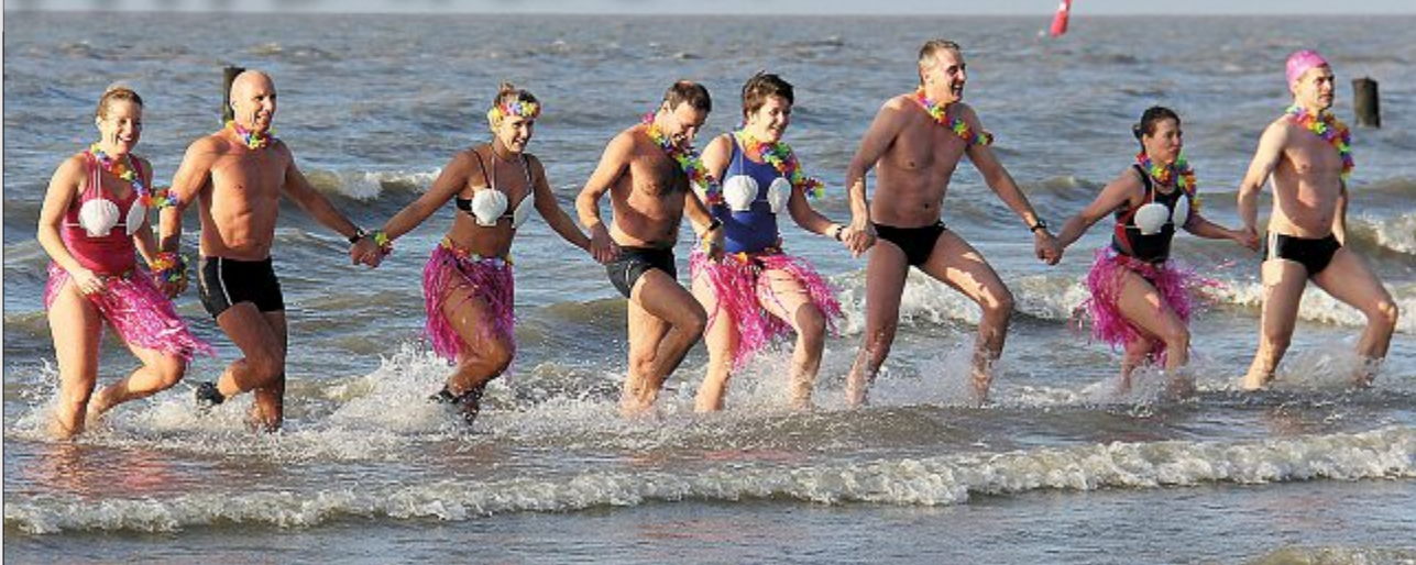
Mit der richtigen Einstellung – und wärmerer Außenwirkung – ist das kühle Bad eine reine Freude.