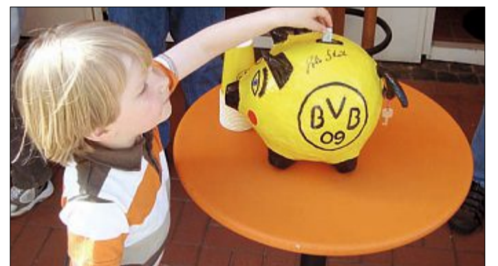
Sogar die Kleinsten sammeln fleißig Spenden.

Am morgigen Sonnabend sind die Erwachsenen des BVB-Fanclubs an der Reihe. Ein Großteil der 163 Mitglieder kommt vom Festland, und damit denen auf der Insel nicht zu schnell langweilig wird, sind alle um 12.30 Uhr ins Schützenhaus eingeladen. Dort wird der vereinsinterne Schützenkönig ermittelt. Nach dem Schießvergnügen steht die Jahreshauptversammlung ab 18.30 Uhr in der Königsbrasserie auf dem Programmzettel. „Dort entscheiden wir mit der gesamten Mannschaft, welcher Institution die nächsten Förderbeiträge zugutekommen sollen“, betont der Vereinsvorstand.