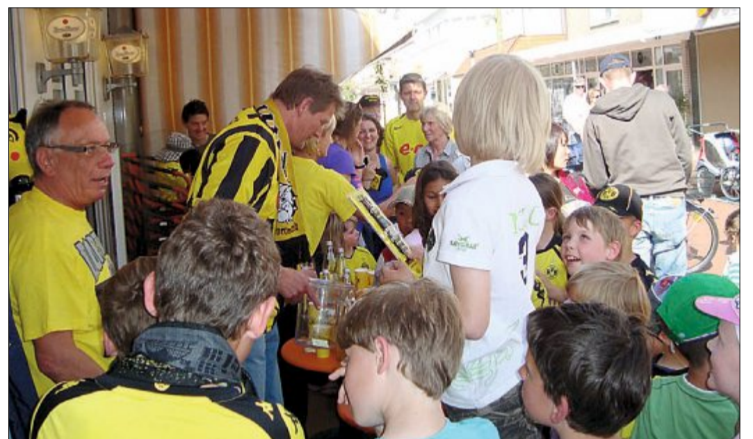
Mit viel Engagement unterstützt der BVB-Fanclub die Norderneyer Jugend.