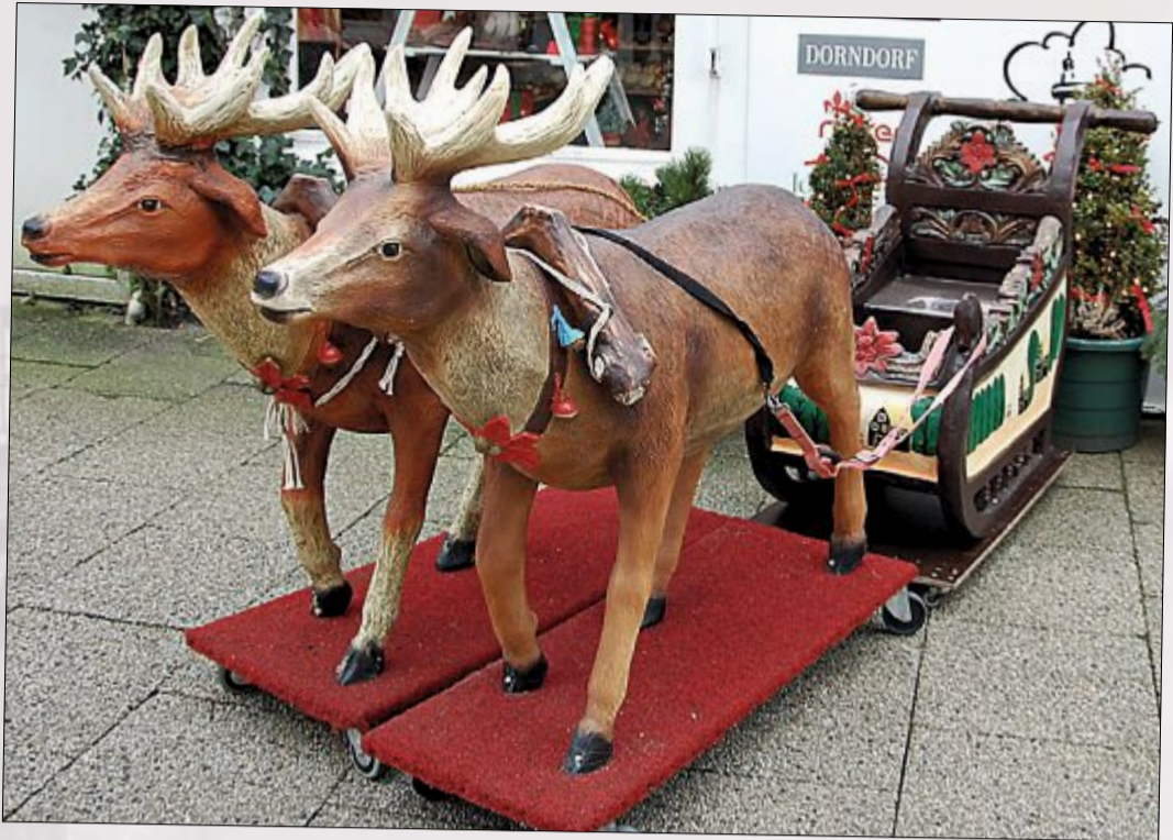
Die Insulaner geben sich sichtlich Mühe und dekorieren für die besinnliche Zeit ihre Häuser und Geschäftsräume.