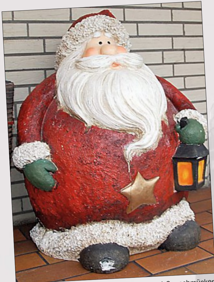
Große Weihnachtsmänner, Lichterketten und Co. schmücken die Norderneyer Straßen.