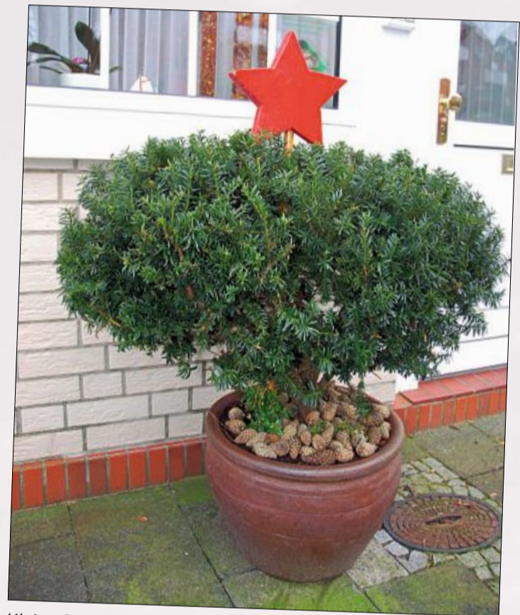
Kleine Sterne und Plätzchenduft sorgen für die perfekte Atmosphäre.