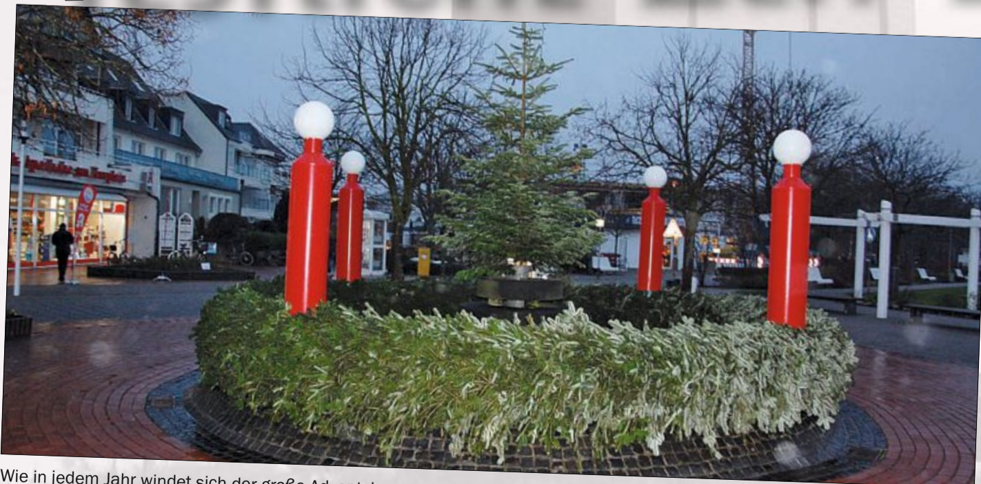
Wie in jedem Jahr windet sich der große Adventskranz um den Brunnen und wartet auf seinen Einsatz am Sonntag.