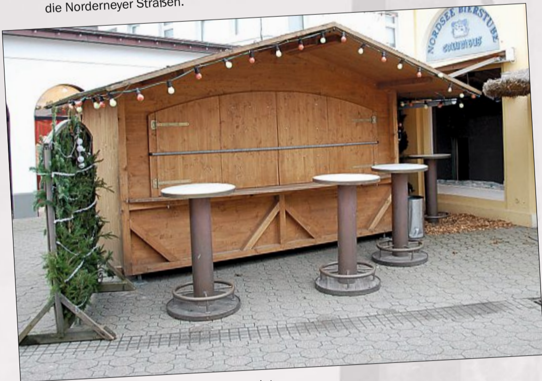
Die ersten Glühweinbuden stehen am Kurplatz.