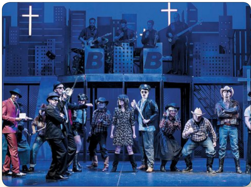
Tip der Woche: Ein Klassiker auf der Theaterbühne. Am Freitag, 6. Dezember, 19.30 Uhr präsentiert die Landesbühne Niedersachsen im Kurtheater die Blues Brothers. Wie bekommt man die lustigste Verfolgungsjagd der Filmgeschichte auf die Bühne? Benötigt werden auf jeden Fall: die zwei ultracoolen Brüder Jake und Elwood Blues, ein 1974er Dodge Monaco, eine eingeschworene Soul-Band, ein Gospelchor, der mit Aretha Franklin „Freedom“ schmettert, ein singfreudiges Publikum und beim legendären Finale mit „Everybody Needs Somebody To Love“ darf auf den Stühlen getanzt werden. Nebenbei zeichnet das Stück ein prächtiges Spottbild des US-amerikanischen Spießers, dem Jake und Elwood samt ihrer Mitstreiter eine politisch äußerst unkorrekte lange Nase drehen. Die Karten gibt es an der Abendkasse für 18 bis 22 Euro pro Person.