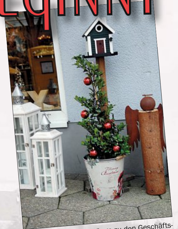
Liebevoll sind die Eingänge zu den Geschäftsräumen geschmückt.