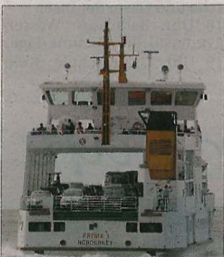
Die Frisia I soll morgen Schauplatz der Übung werden.

werden, kann sich ohne Voranmeldung einfach morgen um 9.30 Uhr am Norderneyer Hafen an der Fährbrücke 2 einfinden. „Norderneyer und Gäste sind eingeladen, bei dem Szenario mitzumachen“, betont auch die Feuerwehr. Die Übung soll dann gegen 10 Uhr beginnen und etwa um 12.30 Uhr beendet sein.