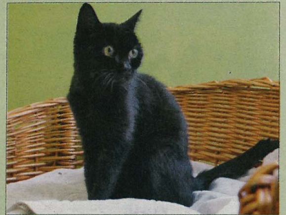
Lakritz war zu Anfang sehr scheu. Nun sucht sie ein liebevolles Zuhause.

Wer sich für Lakritz interessiert, wird gebeten, sich beim bmt-Tierheim Hage unter Telefon 04938/425 melden. Das Telefon ist täglich von 14.30 bis 17 Uhr besetzt. Weitere Infos finden sich im Internet auf www.tierheim-hage.de .