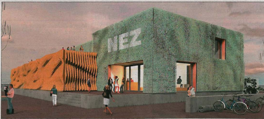
Der überarbeitete Entwurf: Die Fassade des neuen Nationalpark-Erlebnisentrums soll einerseits Watt, Sand und Land widerspiegeln und andererseits Wasser, Wind und Luft.

Voller Überzeugung stellte dieser den „optimierten Ent-