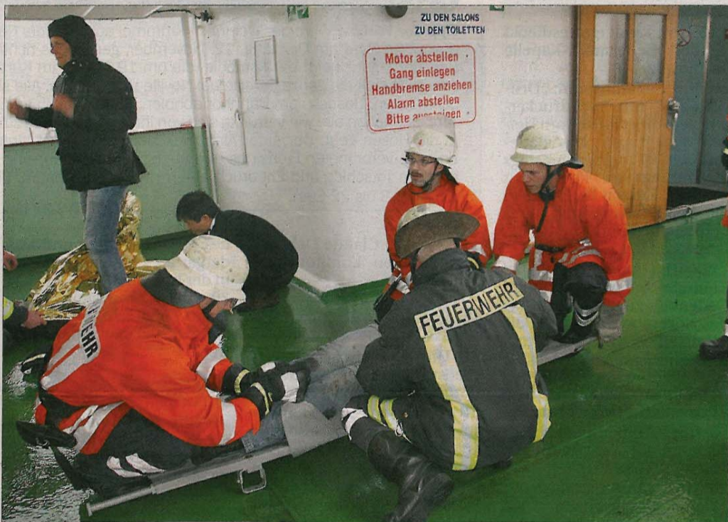
Proben für den Ernstfall: Regelmäßig führen die Mitarbeiter der Reederei Norden-Frisia zusammen mit verschiedenen Einsatzkräften Übungen auf den Schiffen durch.

NORDERNEY/JEN – Keine Sorge, es handelt sich nicht um einen Ernstfall. Um für einen solchen aber möglichst gut gerüstet zu sein, führen die Besatzungen der Frisia-Flotte in Zusammenarbeit mit verschiedenen Einsatzkräften regelmäßige Übungen durch. Die nächste Großübung ist für den morgigen Sonnabend, 9. November, im Norderneyer Hafen in Zusammenarbeit mit der Inselwehr und der DGzRS geplant. Auf der Frisia I soll ein Unglück simuliert werden, und zwar unter möglichst authentischen Bedingungen. Das genaue Szenario ist natürlich noch geheim. Die Übung an sich hingegen soll bereits vorab möglichst bekannt wer-