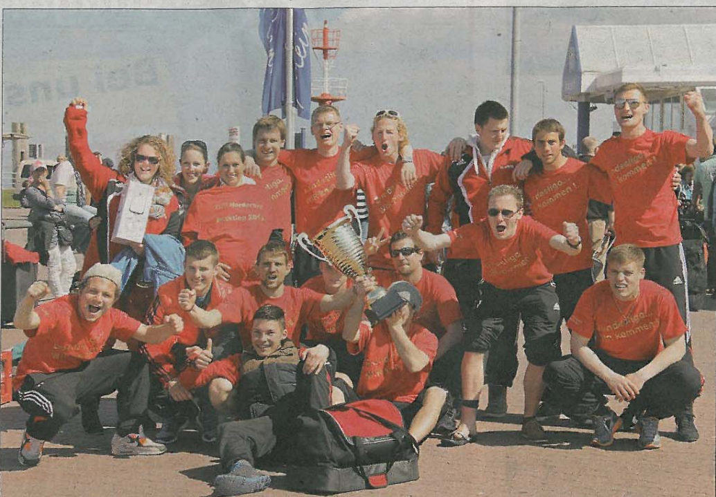
Am Ende der letzten Saison haben die TuS-Herren den Pokal geholt. Nach dem Aufstieg warten nun andere Gegner und zudem ist die Mannschaft personell geschwächt. Nichtsdestotrotz wollen die Kicker positiv denken und klare Ziele verfolgen. Kopf in den Sand is' nicht!