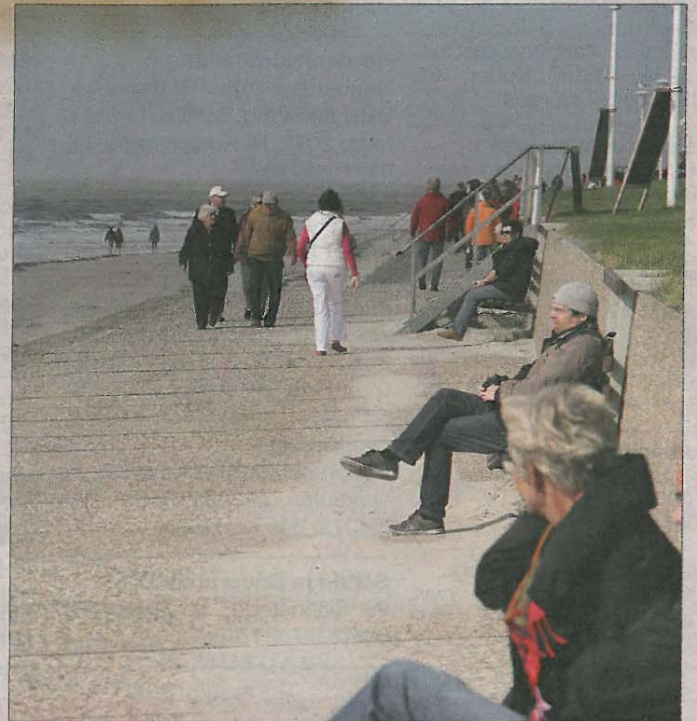
Strandspaziergang mit Päuschen. Zu sehen gibt es in jedem Fall eine ganze Menge – ob mit oder ohne Sonne.