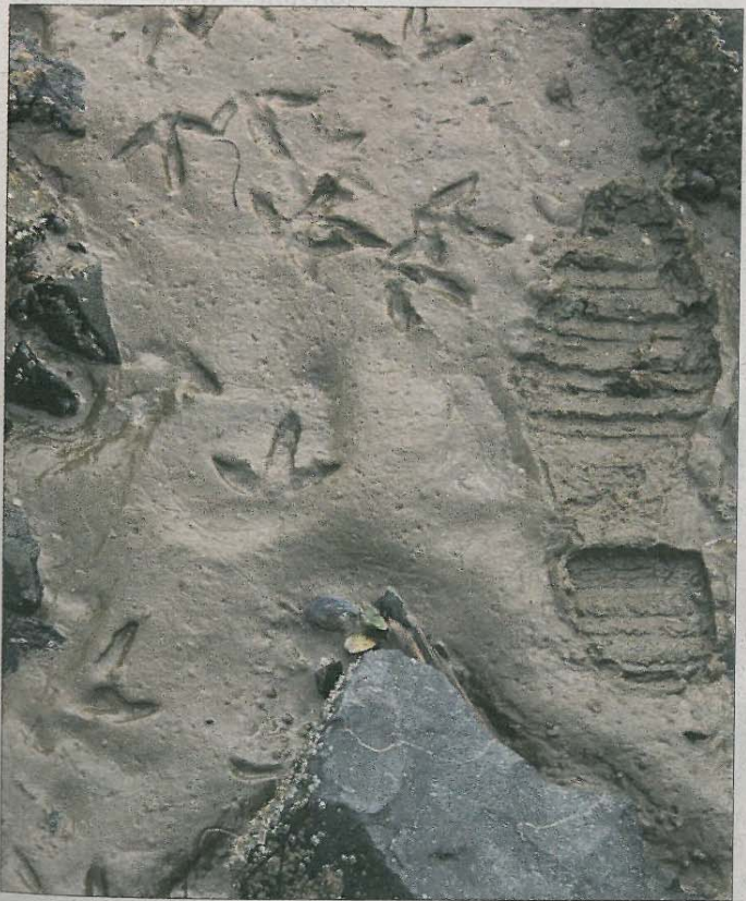
Wo der Mensch neugierig schaut, ist zuvor ein Austernfischer entlangspaziert.

ausreichend Zeit, die vielen Vögel zu beobachten. Mit der Führung „Vielfalt – to go to“ vom Nationalpark-Haus im Rahmen der Zugvogeltage bietet sich den Teilnehmern eine wunderbare Kombination aus Vogelkunde und Watt erkundung, die der Gruppe am Mittwochmorgen sichtlich Spaß gemacht hat. Eine letzte Führung gibt es heute um 15.30 Uhr, Treffpunkt ist der Parkplatz am Erlenwäldchen.