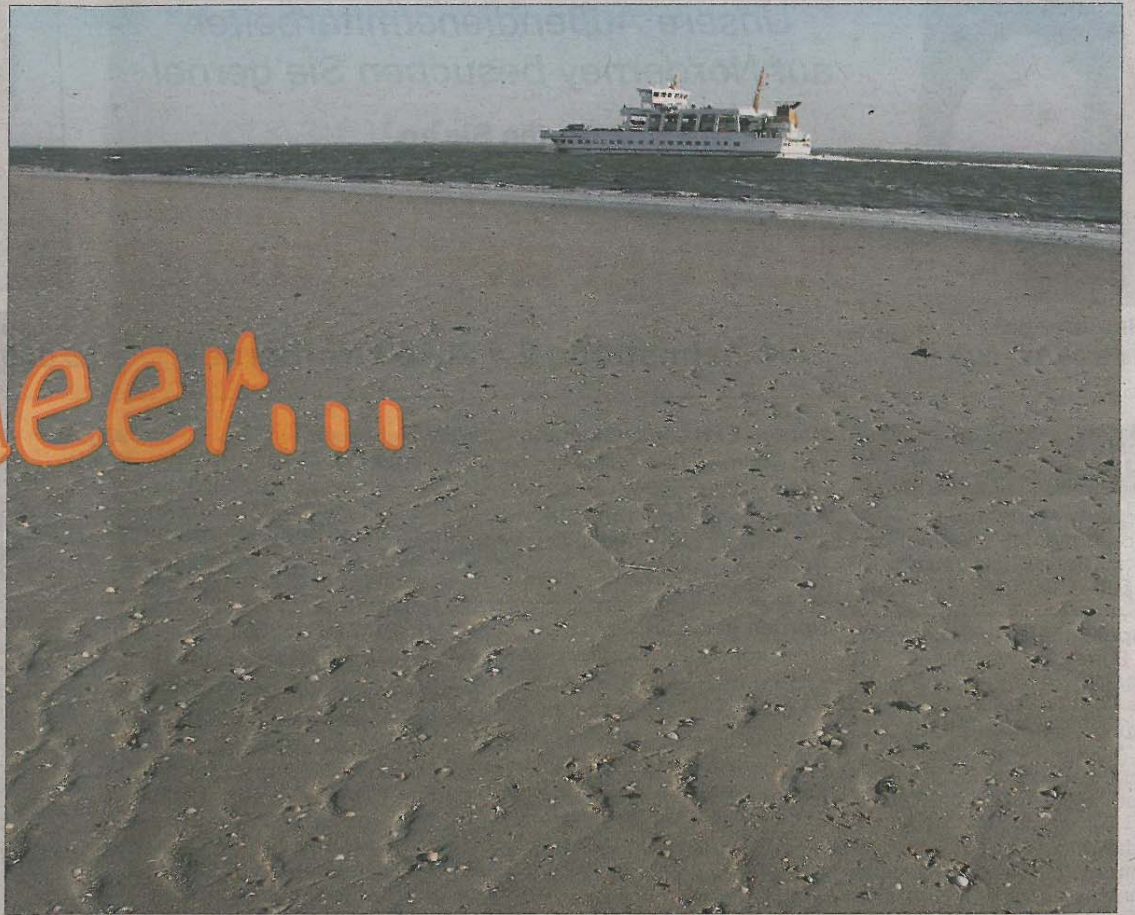
Auch das dynamische Schauspiel von Ebbe und Flut bietet immer wieder Sehenswertes.