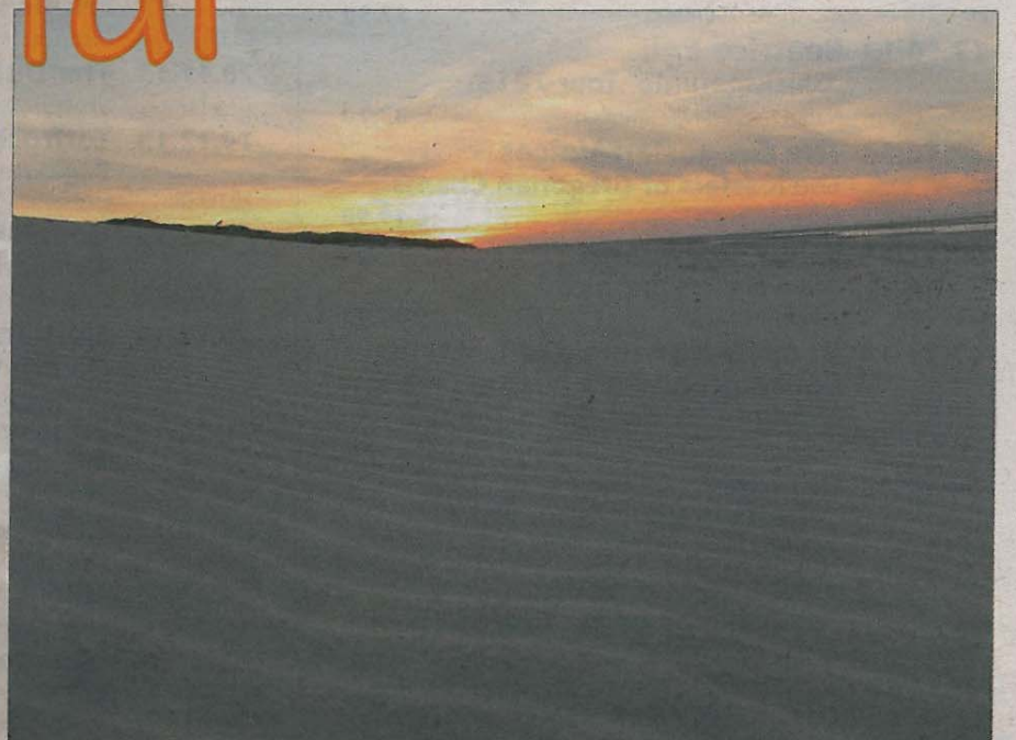
Weicher Sand, durch die Natur wunderschön geformt – ein Postkartenbild, dessen Anblick einfach Balsam für die Seele ist.