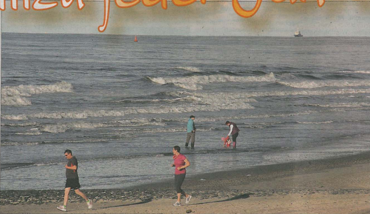
Die Badesaison klingt jetzt endgültig aus. Wer sich barfuß nicht mehr in die kühlen Fluten traut, kann sich das Wasser natürlich auch um die Gummistiefel spülen lassen.