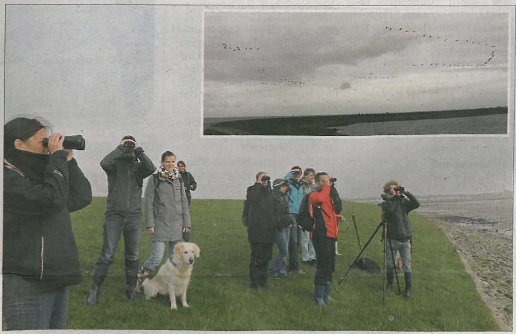
Mit Spektiv und Ferngläsern ausgerüstet, macht sich die Gruppe der Vogelkundler auf ins Watt, während das Federvieh am Himmel seine Kreise zieht.

Die Wattwanderung geht vom Deich bis an die Wassergrenze. Das Watt ist hier eher fester, hat einen sandigeren Untergrund, weshalb man nicht allzu tief einsinkt. Die meisten Teilnehmer ha-