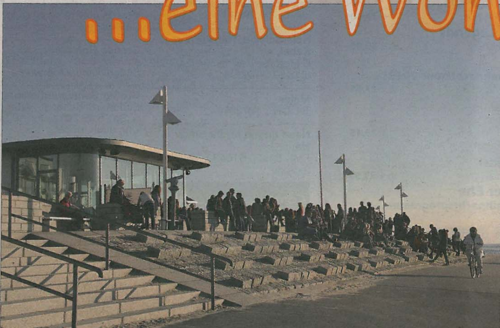
Bei blauem Himmel kann man den goldenen Herbst noch mal so richtig genießen. Doch auch wenn die Tage grauer werden, hat der Blick von der Promenade etwas Reizvolles.