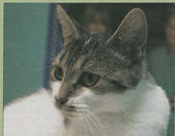
Katzendame Tina ist sehr auf Menschen bezogen und sucht nun eine neue Bleibe.

Wer sich für Tina interessiert, kann sich beim bmt-Tierheim Hage unter Telefon 04938/425 melden. Das Telefon ist täglich von 14.30 bis 17 Uhr besetzt. Weitere Infos finden sich im Internet auf www.tierheim-hage.de .