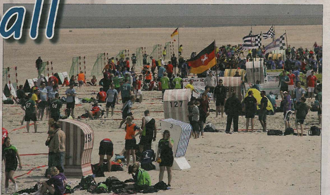
Beachhandball am Norderneyer Strand. Durch eine vorüberziehende Kaltfront ließen sich die Spieler nur kurz unterbrechen.