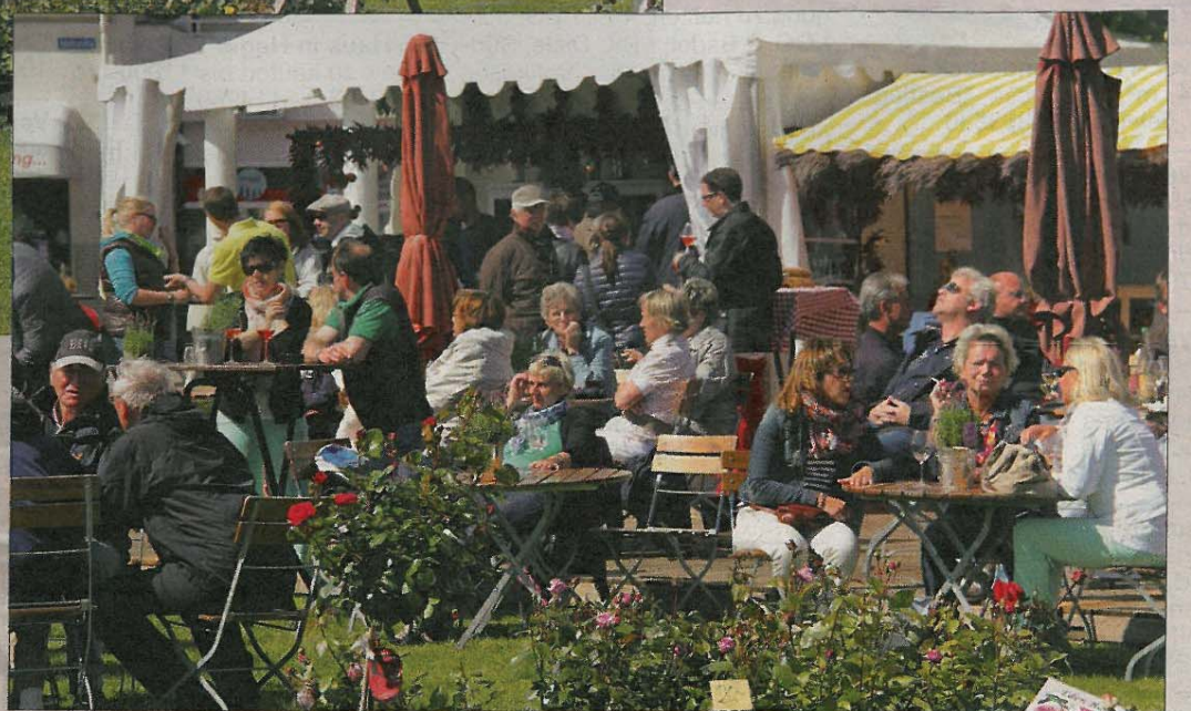
Die Schloss Gödens Entertainment GmbH und das Staatsbad hatten den Kurplatz zur diesjährigen „Inselpartie“ wieder in ein zauberhaftes Meer aus Blumen, Dekorationen, Verweilmöglichkeiten in schickem Ambiente und allerlei Leckereien verwandelt. Das Wetter war zwar wechselhaft, doch kam die Sonne raus, tummelten sich auch die Gäste zwischen den festlichen Pagoden.